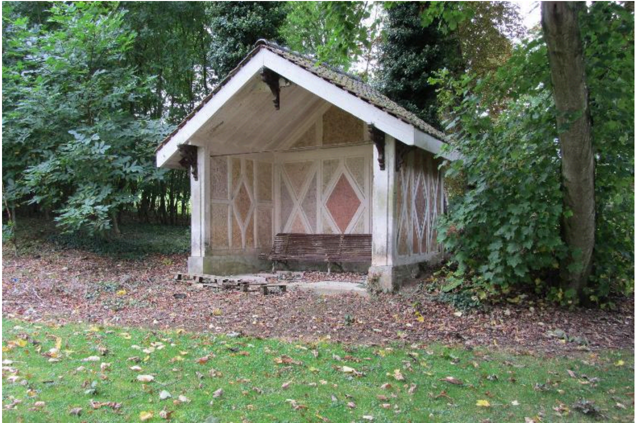
Fabrique de jardin.