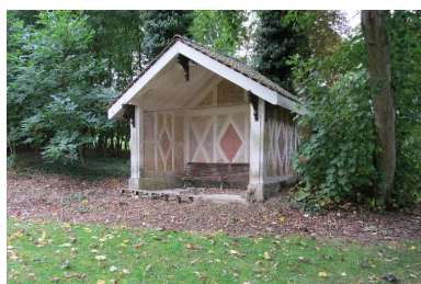
Fabrique de jardin. IVR22_20128005327NUCA