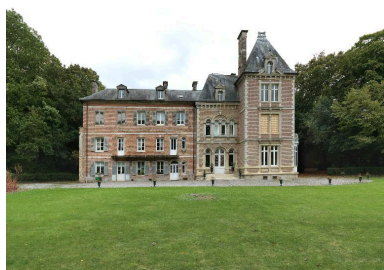
Vue d'ensemble de la façade nord. IVR22_20128000835NUC2A