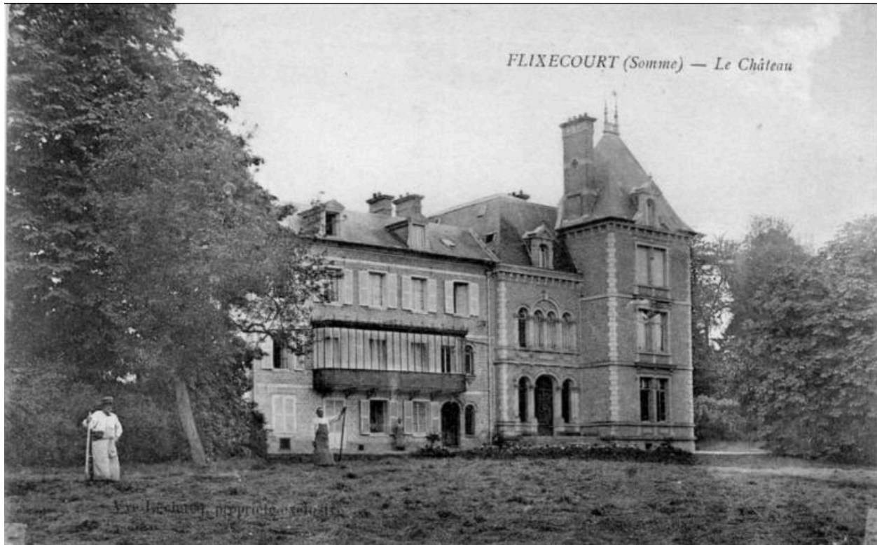
Vue générale, vers 1905 (coll. part).