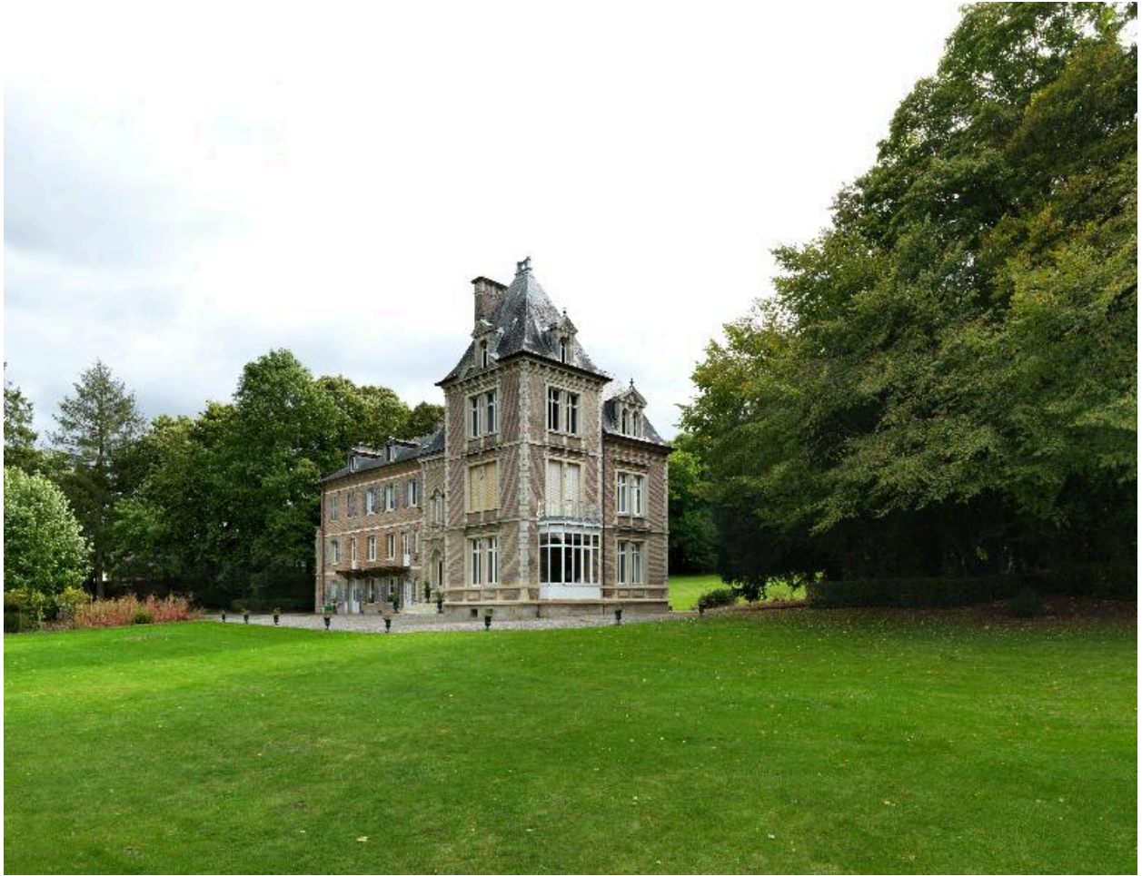
Vue d'ensemble nord-ouest du château.