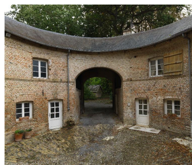
Vue du porche d'entrée des communs depuis la cour. IVR22_20128000846NUC2AQ