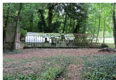
La serre. IVR22_20128005326NUCA