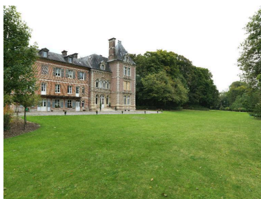
Vue d'ensemble du château et de son parc depuis le nord-est. IVR22_20128000837NUC2A