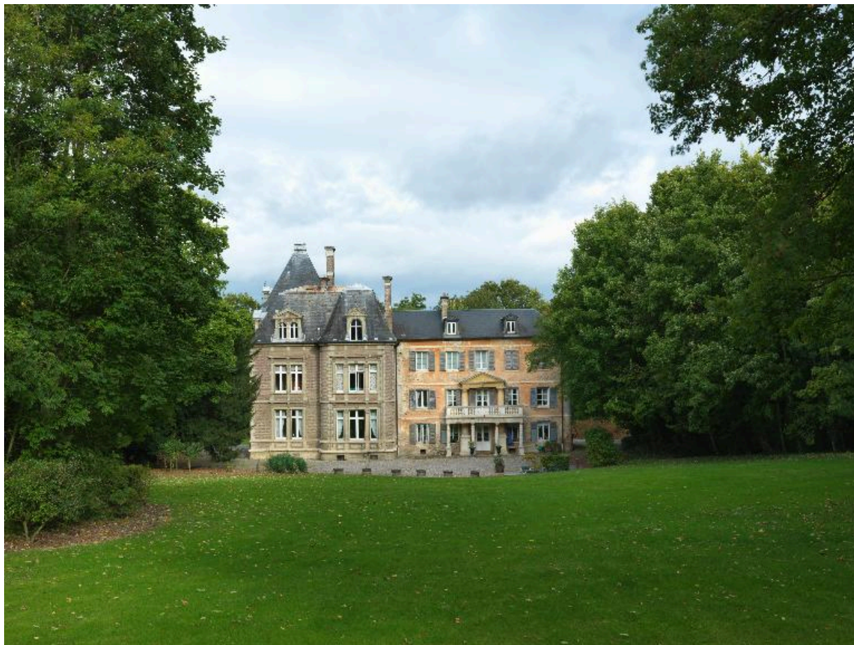
Vue d'ensemble sud du château.