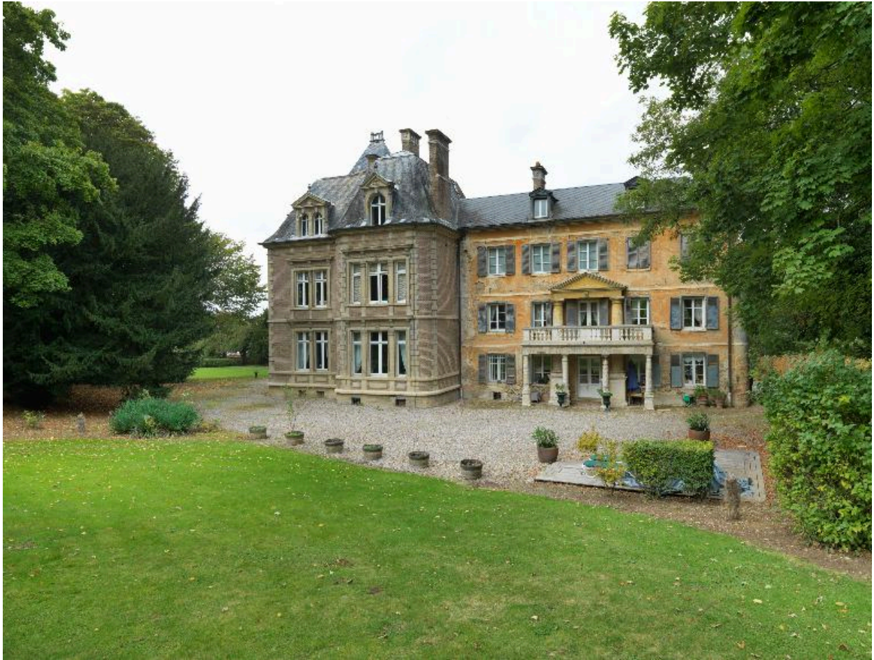
Vue d'ensemble de la façade sud du château, vue depuis le sud-est.