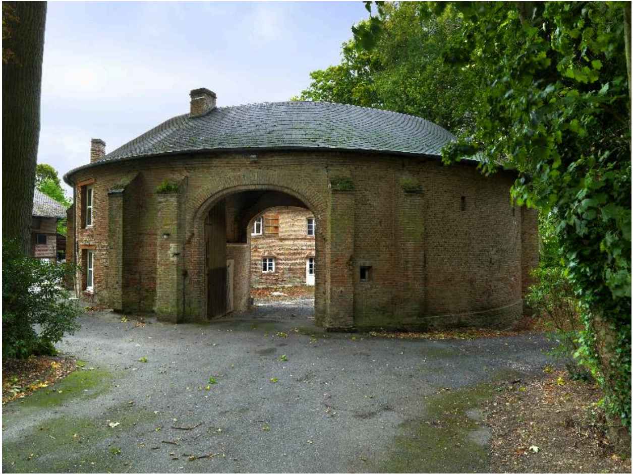
Le porche d'entrée des communs, vue d'ensemble nord.