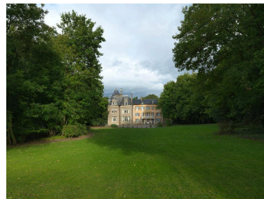
Vue d'ensemble sud du château et de son parc.