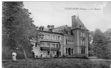
Vue générale, vers 1905 (coll. part). IVR22_20138016053NUC2A