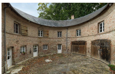
Vue de la cour circulaire des communs du château. IVR22_20128000845NUC2AQ