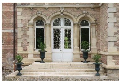
L'entrée principale du château. IVR22_20128000847NUC2AQ