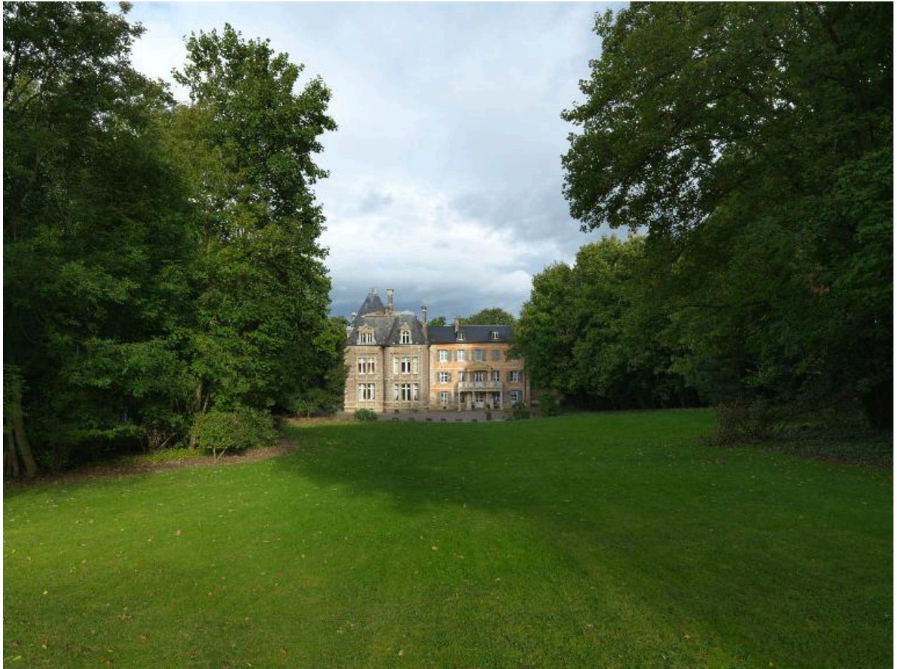
Vue d'ensemble sud du château et de son parc.