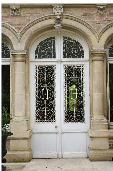
Porte d'entrée marquée des initiales HH. IVR22_20128000848NUC2A