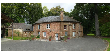
Les communs, vue d'ensemble sud. IVR22_20128000842NUC2AQ