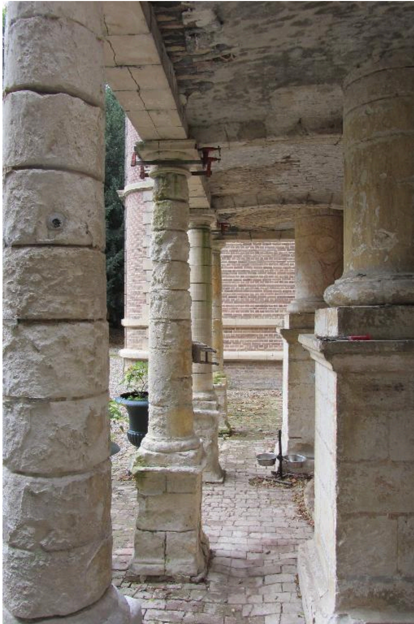
Détail des colones soutenant le balcon.