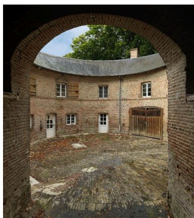
La cour circulaire des communs, vue depuis le porche d'entrée. IVR22_20128000844NUC2AQ