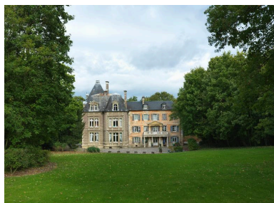
Vue d'ensemble sud du château. IVR22_20128000839NUC2A