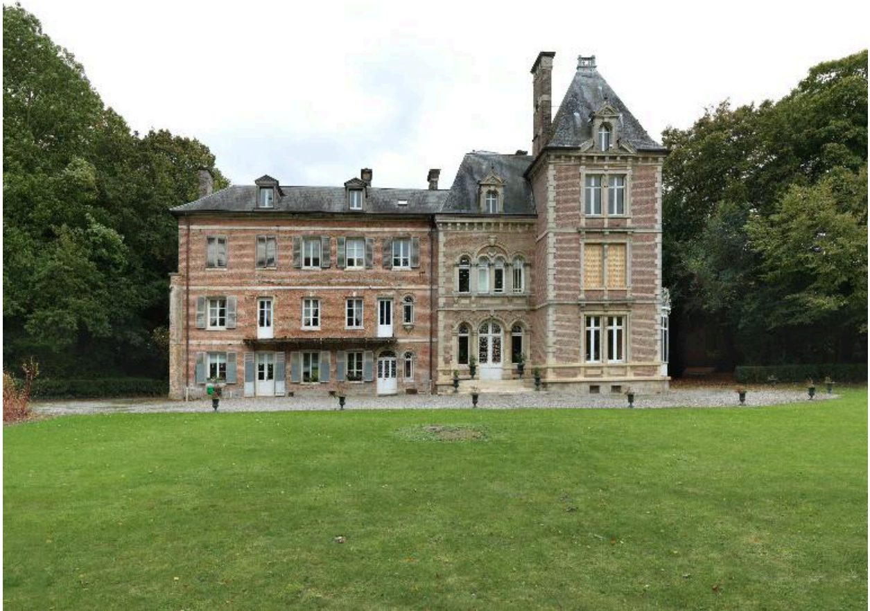
Vue d'ensemble de la façade nord.