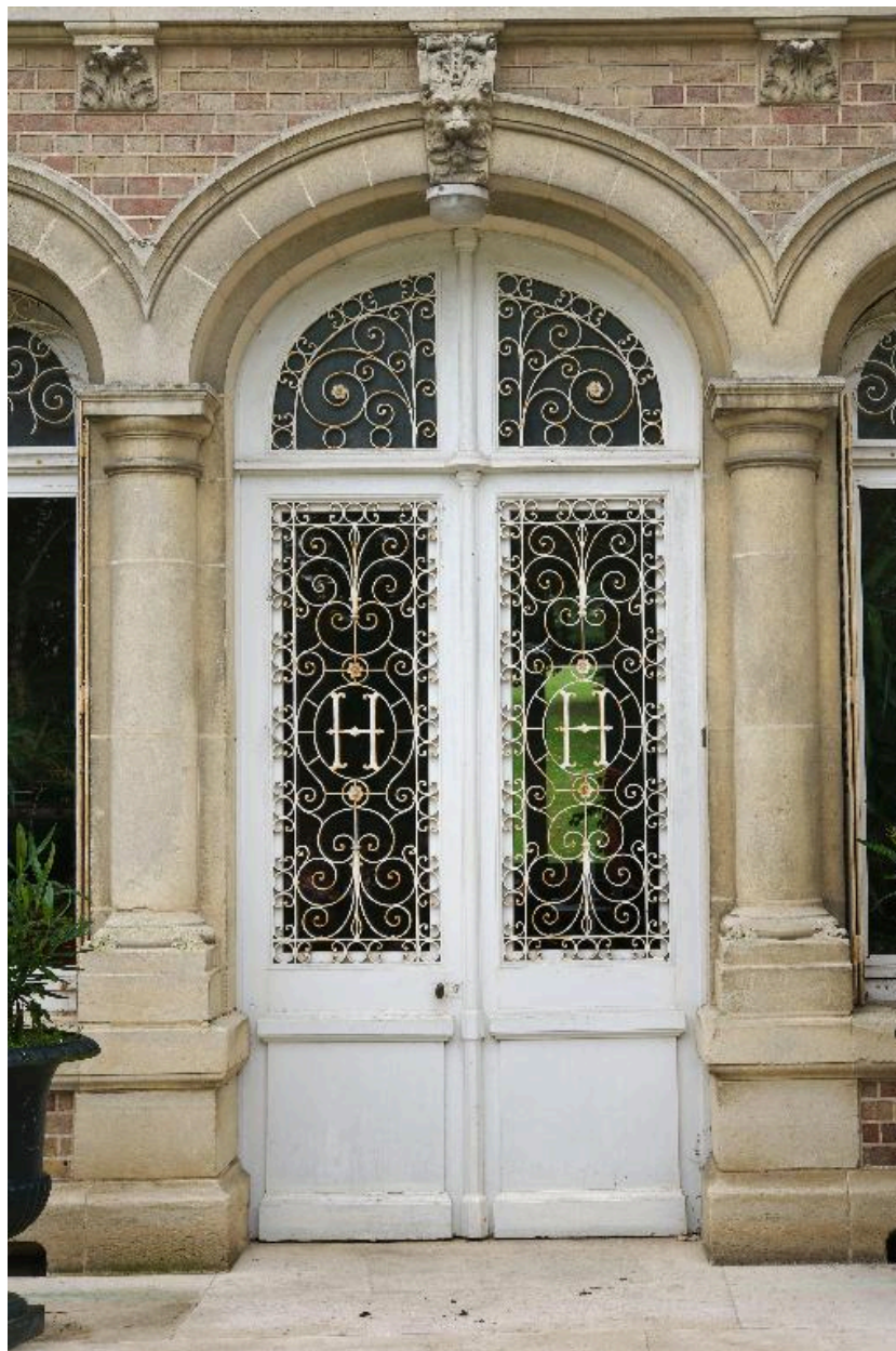
Porte d'entrée marquée des initiales HH.