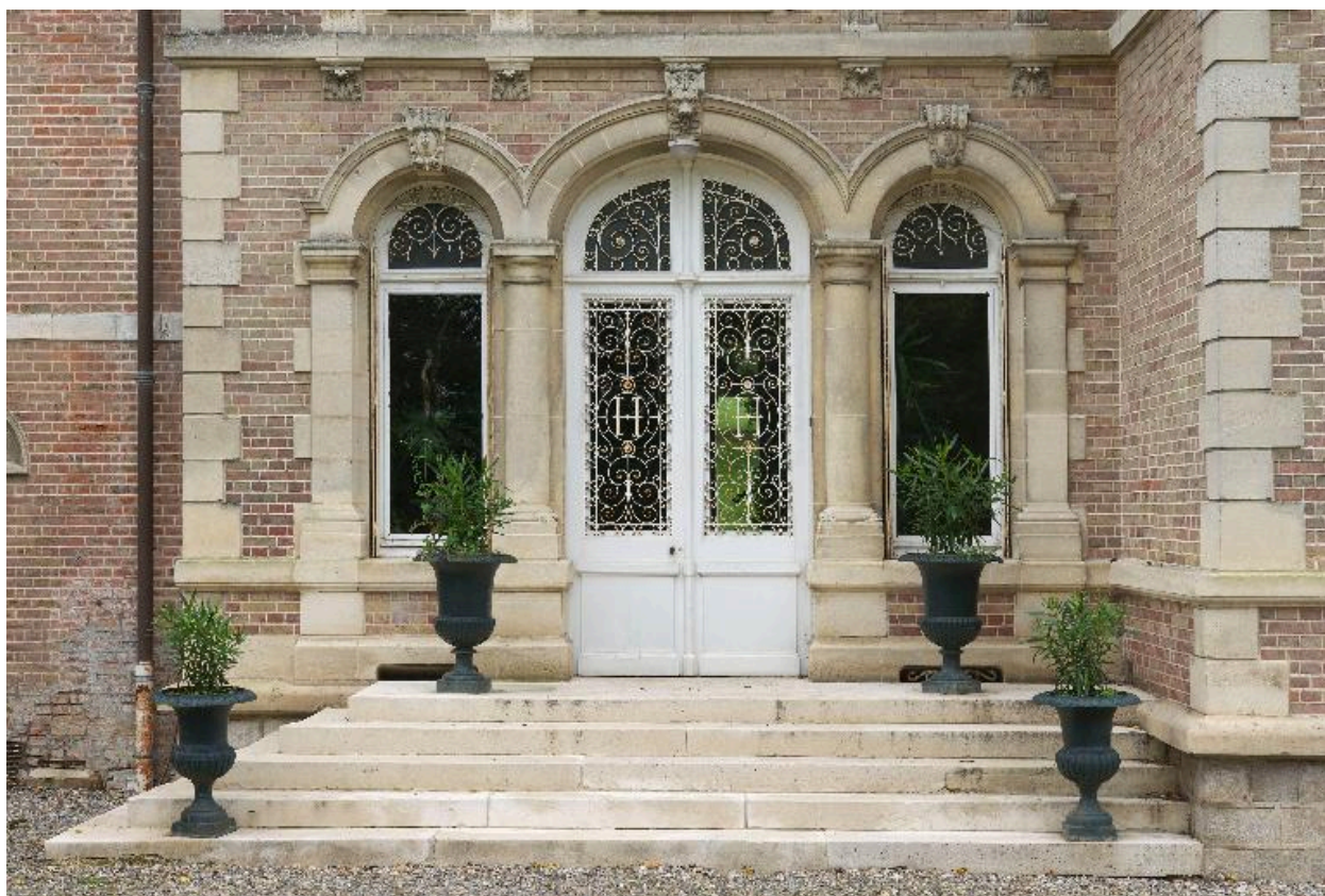
L'entrée principale du château.