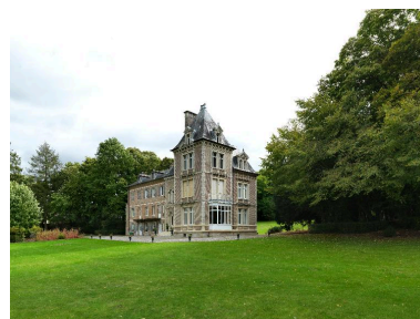
Vue d'ensemble nord- ouest du château. IVR22_20128000836NUC2A