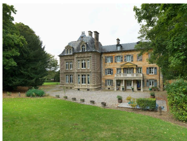
Vue d'ensemble de la façade sud du château, vue depuis le sud-est.