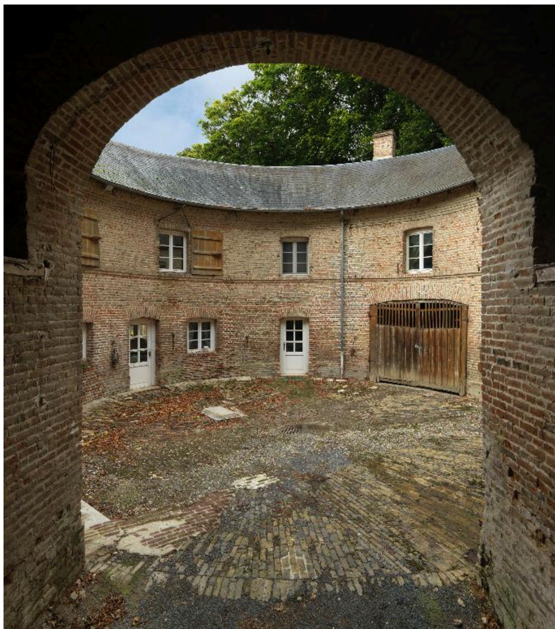
La cour circulaire des communs, vue depuis le porche d'entrée.