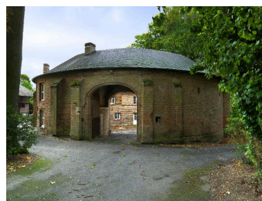
Le porche d'entrée des communs, vue d'ensemble nord. IVR22_20128000843NUC2A