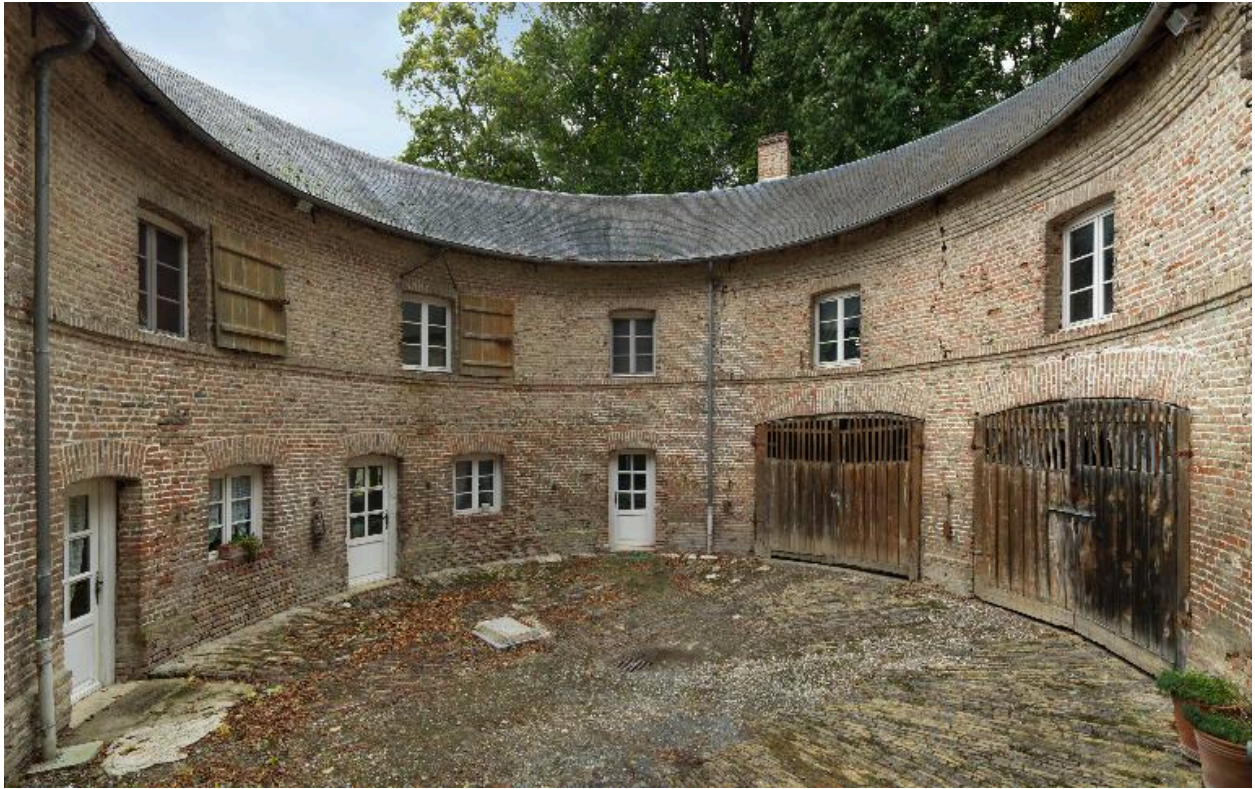
Vue de la cour circulaire des communs du château.