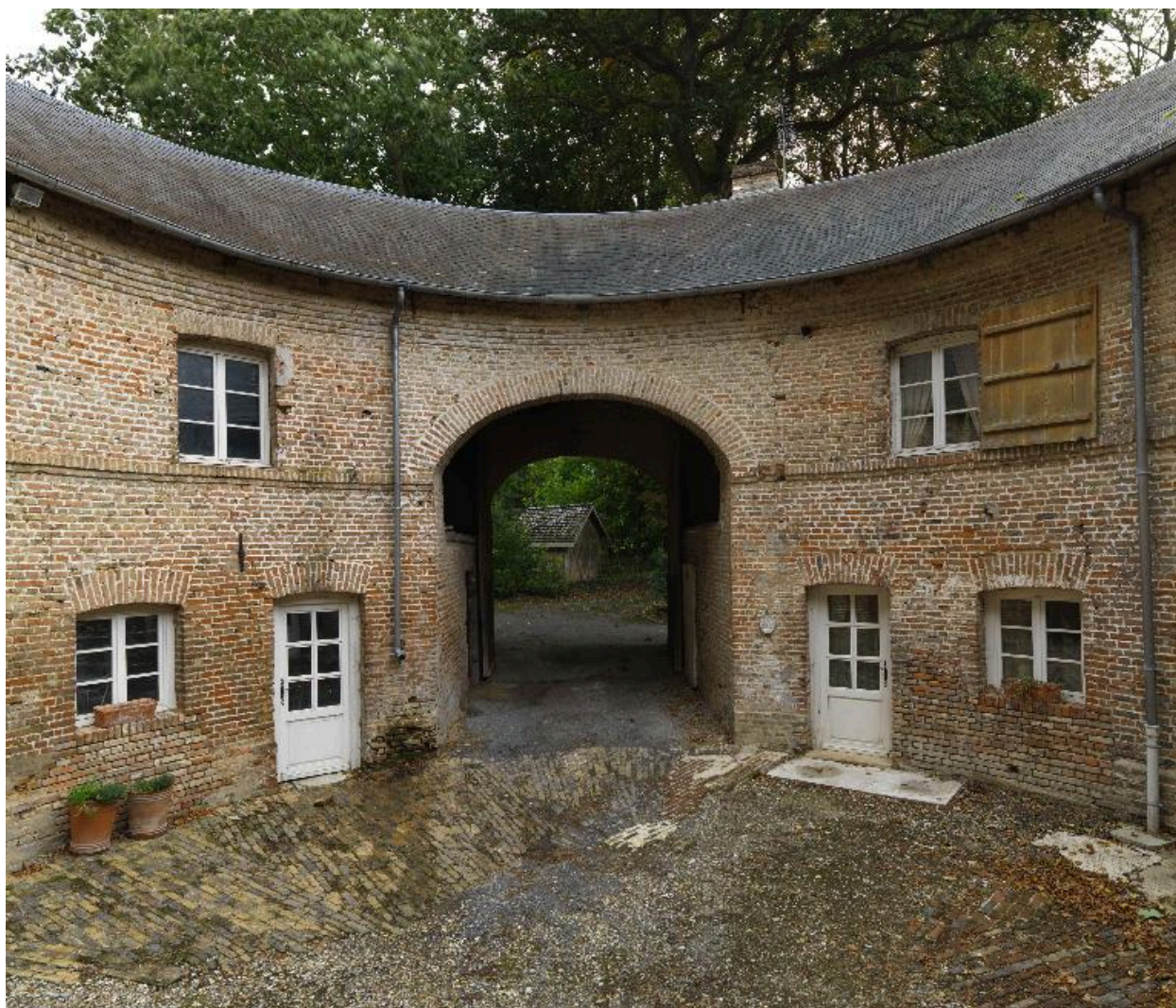
Vue du porche d'entrée des communs depuis la cour.