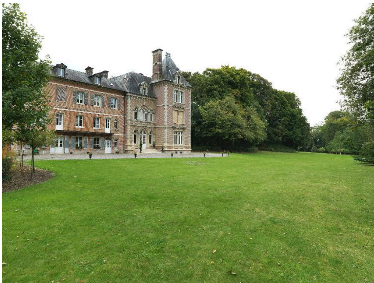
Vue d'ensemble du château et de son parc depuis le nord-est.