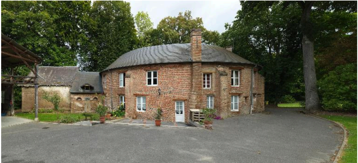
Les communs, vue d'ensemble sud.