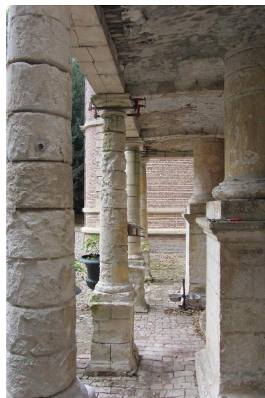
Détail des colones soutenant le balcon. IVR22_20128005340NUCA