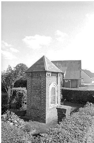
Vue générale. IVR22_19980202690Z