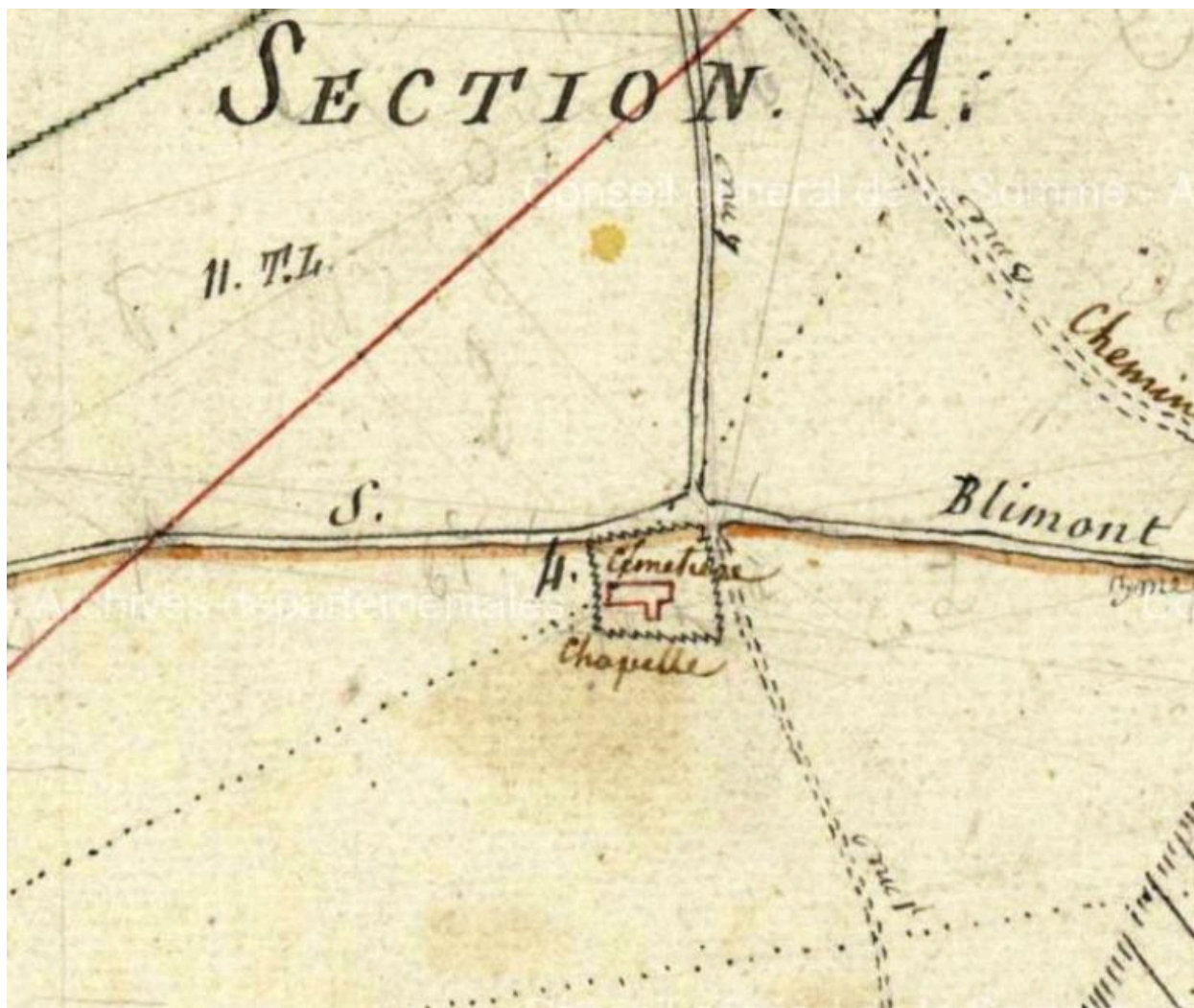
Extrait du plan par masse de culture de 1807 (AD Somme ; 3 P 1493/1).