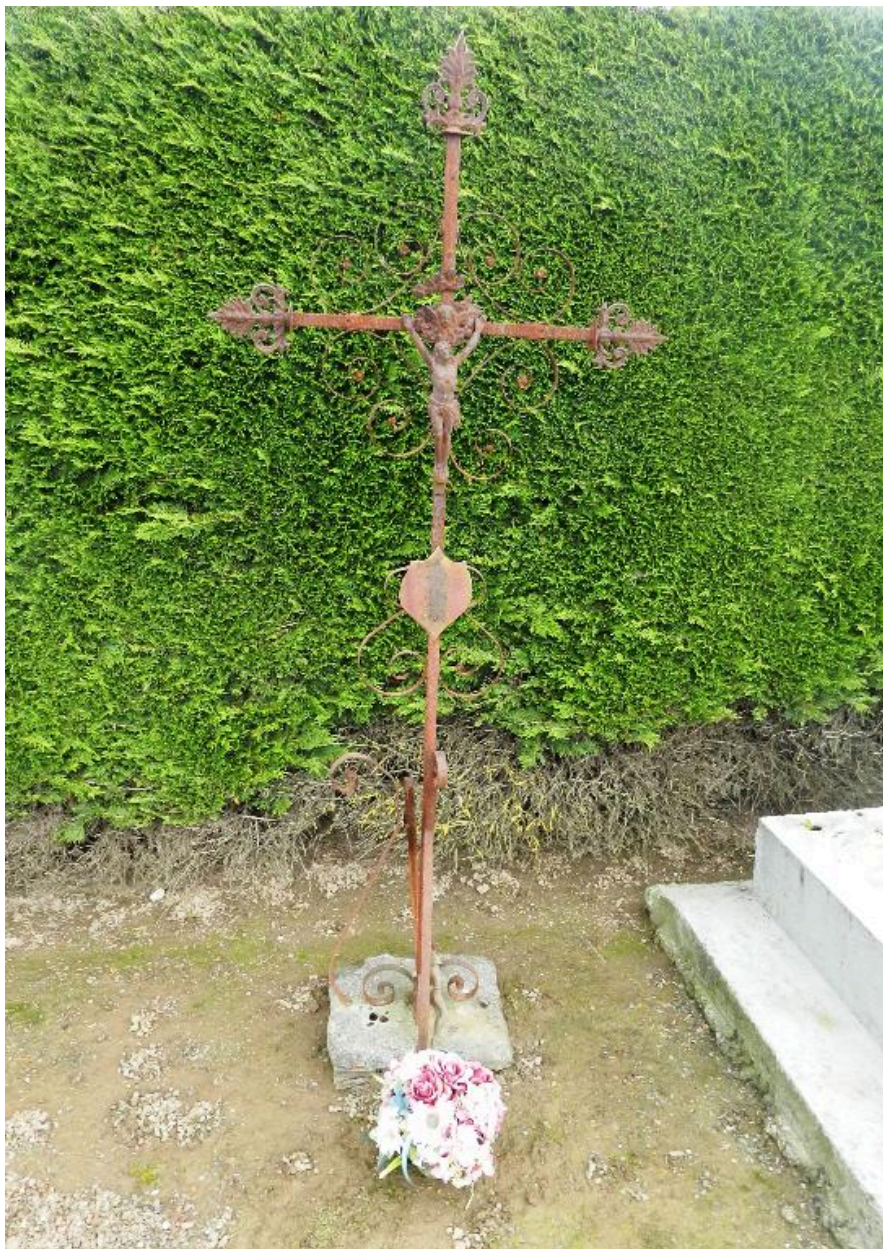
Croix funéraire en fer forgé.