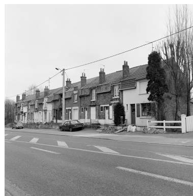
Logements d'ouvriers.