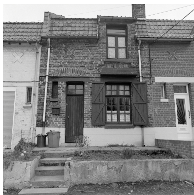
Logement d'ouvrier. IVR31_19895900430X