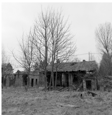
Vestiges des bureaux. Élévation postérieure. IVR31_19885900429X