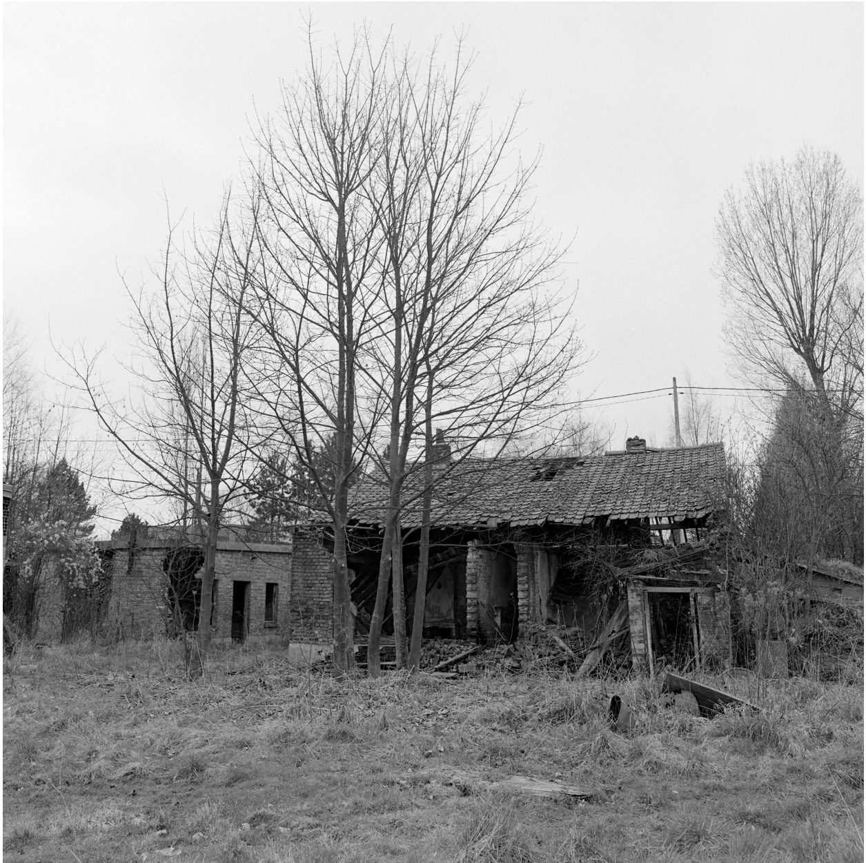
Vestiges des bureaux. Élévation postérieure.