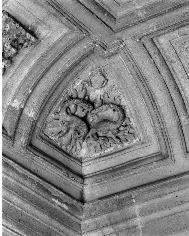
Caisson d'angle orné de deux salamandres couronnées.