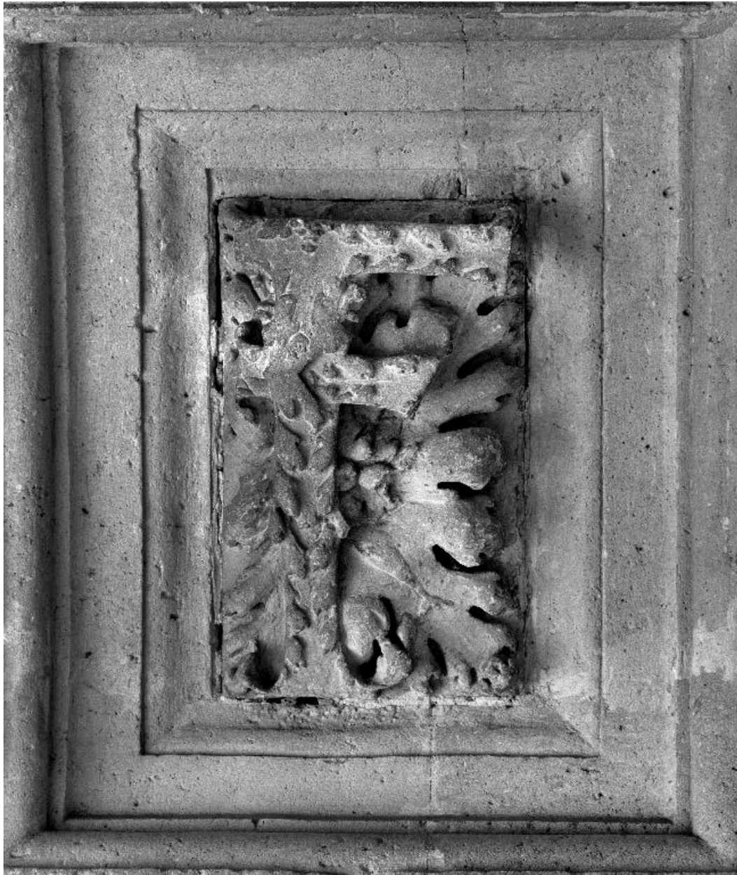
Caisson orné d'un F feuillagé.