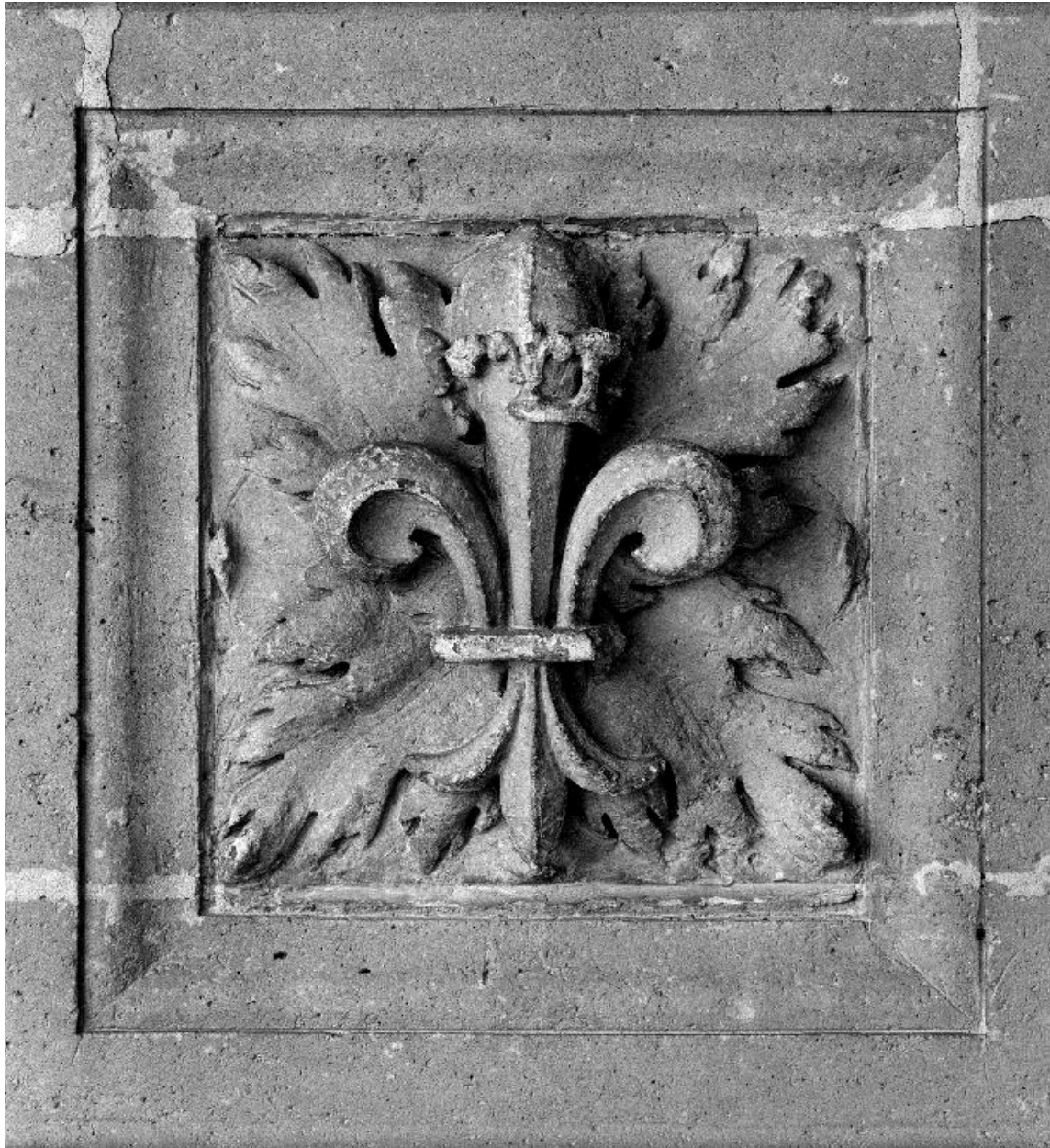
Caisson orné d'une fleur de lys couronnée.