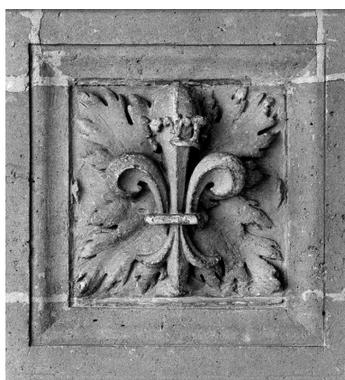
Caisson orné d'une fleur de lys couronnée.