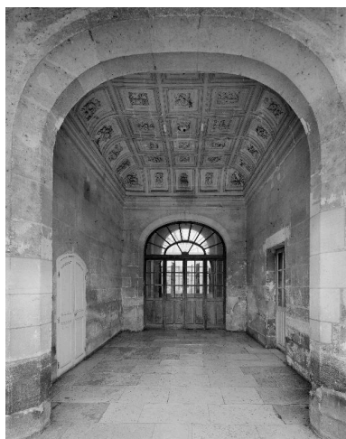
Vue du passage reliant les deux cours.