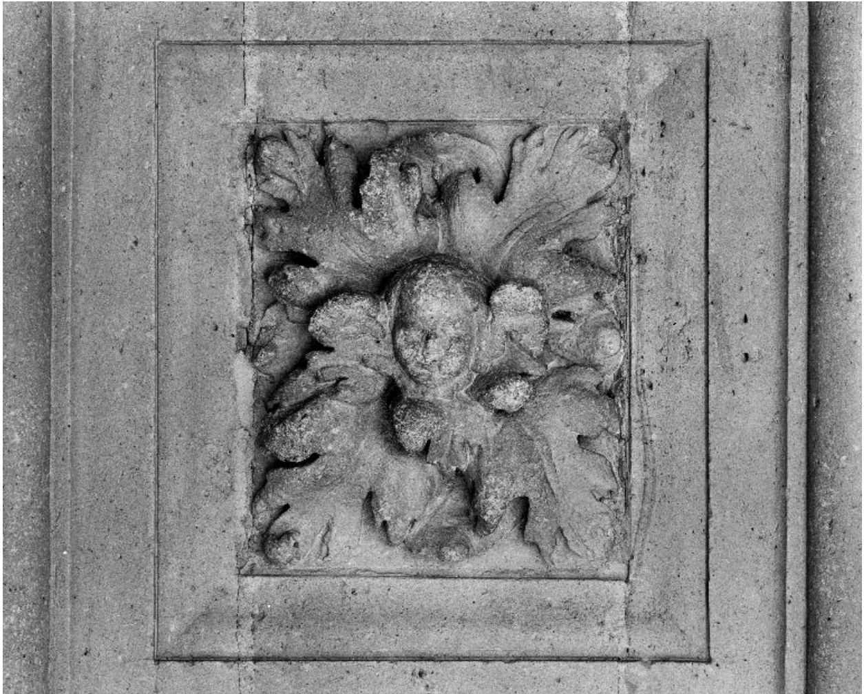
Caisson orné d'une tête humaine sur fond de feuilles.