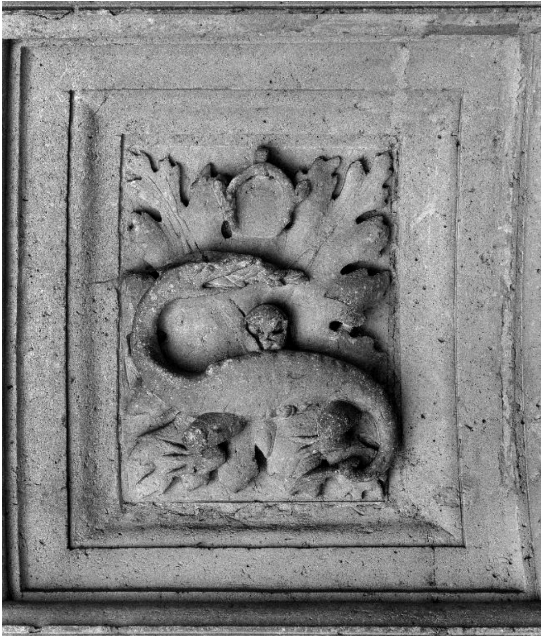
Caisson orné d'une salamandre couronnée.