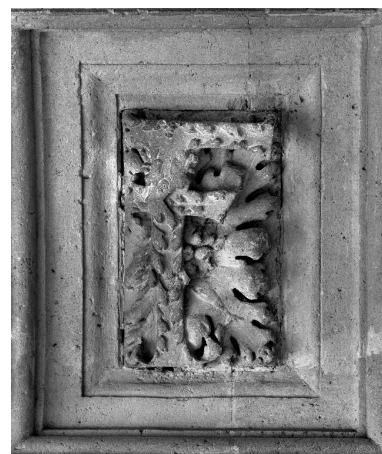
Caisson orné d'un F feuillagé. IVR22_19900202217X