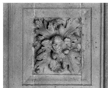
Caisson orné d'une tête humaine sur fond de feuilles. IVR22_19900202210X