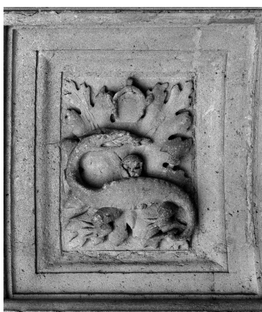
Caisson orné d'une salamandre couronnée.