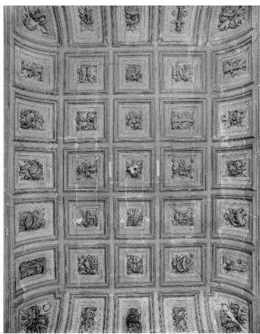
Vue générale de la voûte. IVR22_19900202319X