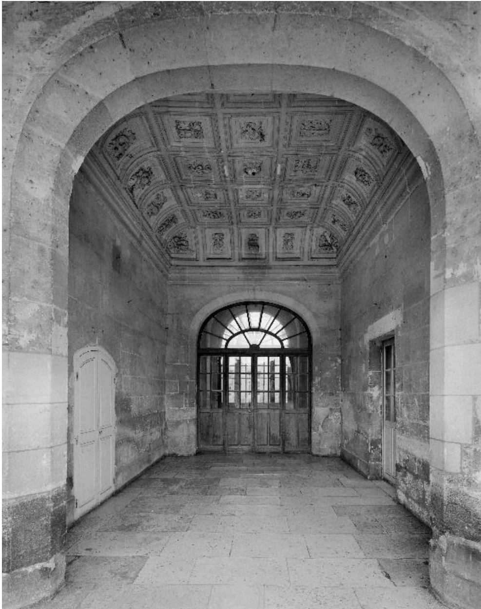
Vue du passage reliant les deux cours.