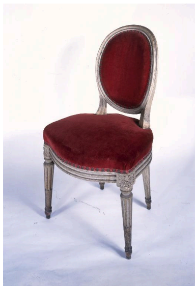
Vue d'ensemble. IVR22_19956000467XA