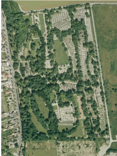
Vue aérienne du cimetière de la Madeleine.