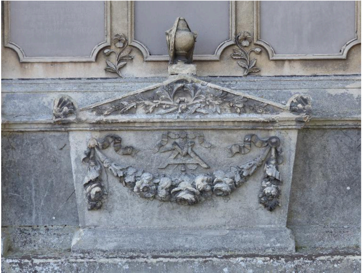
Vue de détail sur le cataphalque en trompe-l'oeil.