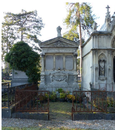
Vue générale. IVR32_20168006432NUCA