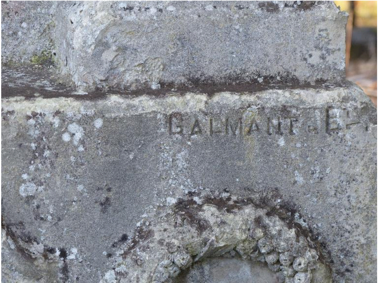
Vue de détail sur la signature de Jean-Baptiste Galmant.