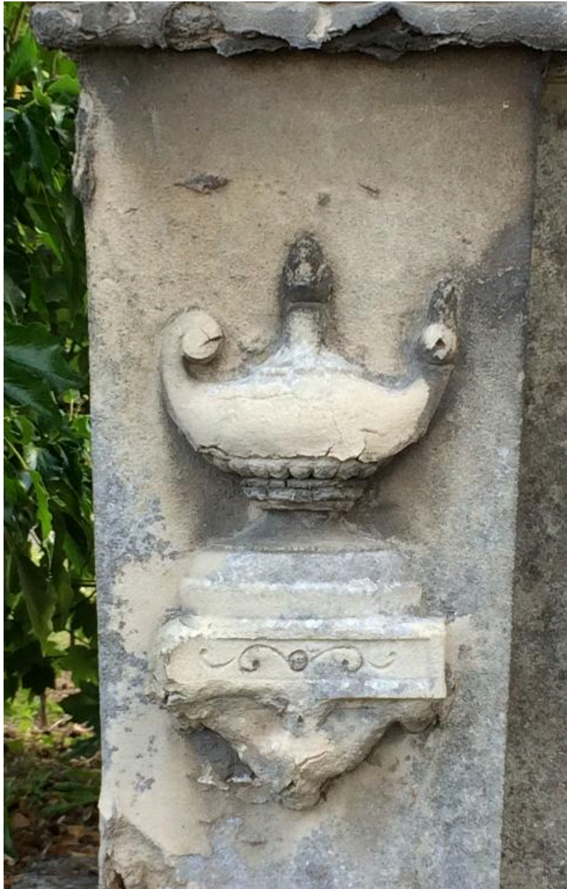
Détail du décor sculpté.