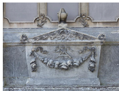
Vue de détail sur le cataphalque en trompe-l'oeil.