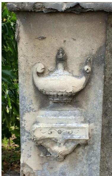
Détail du décor sculpté.