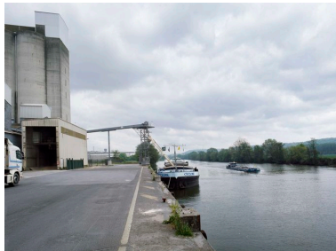
Cellules de stockage et quais de transbordement au bord de l'Oise. IVR22_20106000291XA