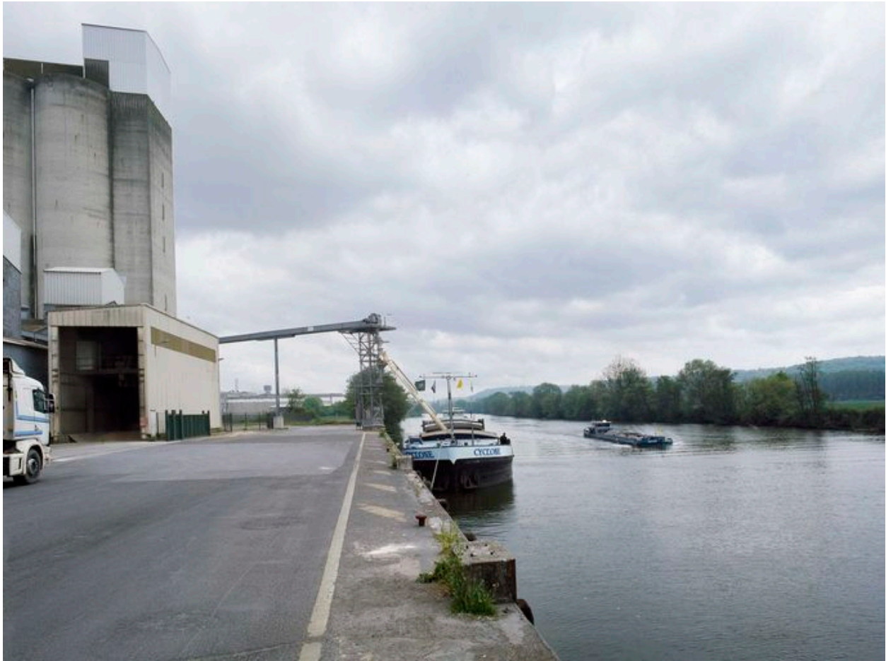
Cellules de stockage et quais de transbordement au bord de l'Oise.