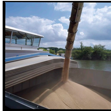
Chargement d'une péniche.