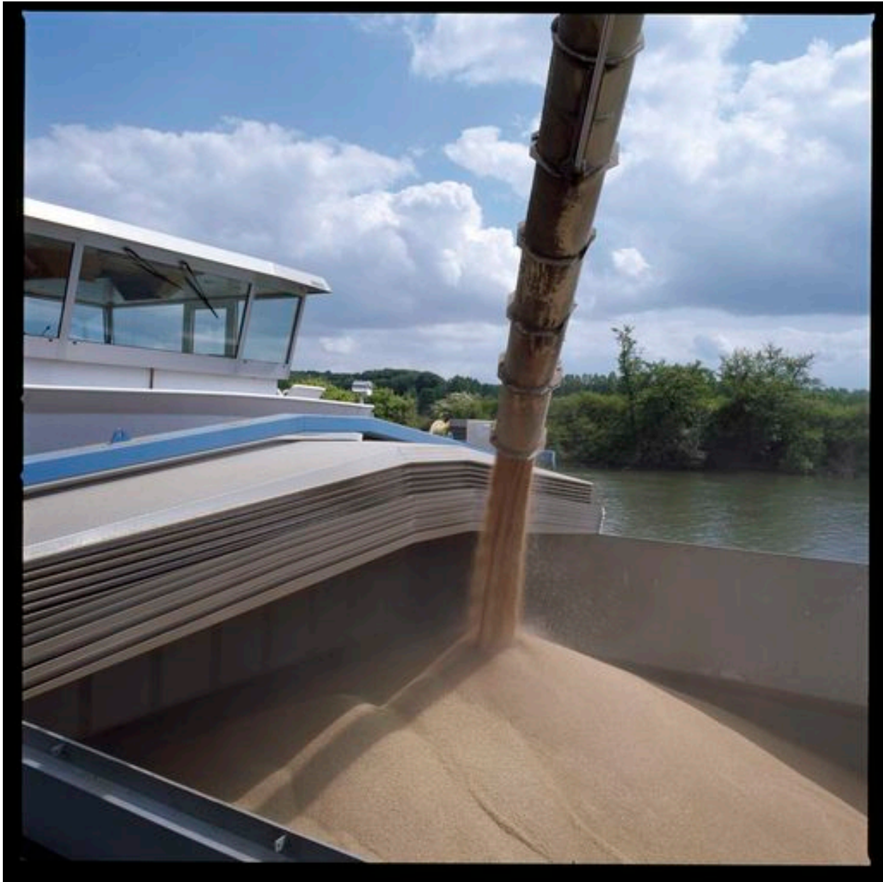
Chargement d'une péniche.