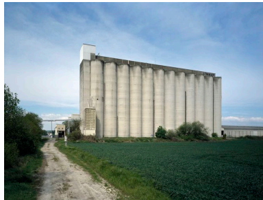
Vue générale des silos de la SEMMAP. IVR22_20106000289VA