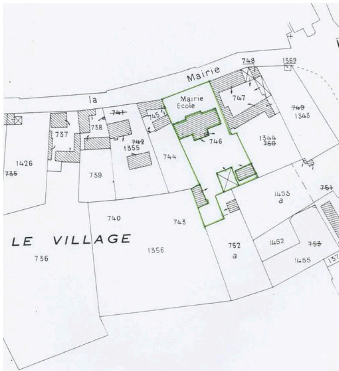
Plan de situation. Extrait du plan cadastral de 1982, section C4 746.