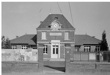
Elévation antérieure. IVR22_19856000559X