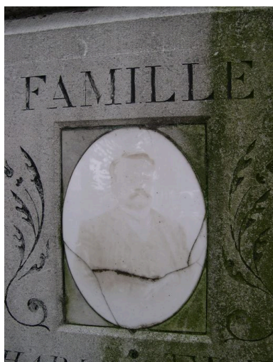
Vue de détail sur le portrait.