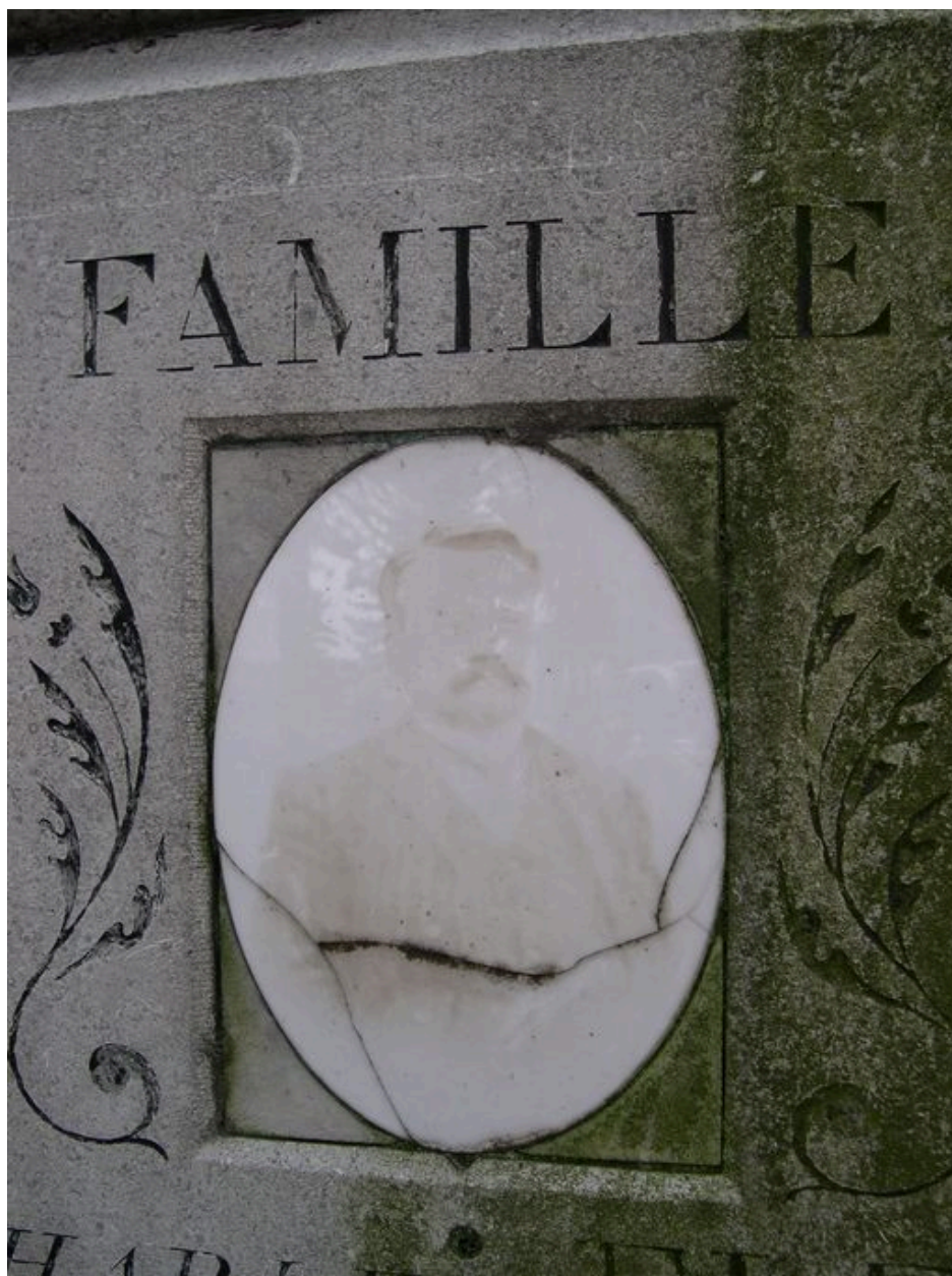
Vue de détail sur le portrait.