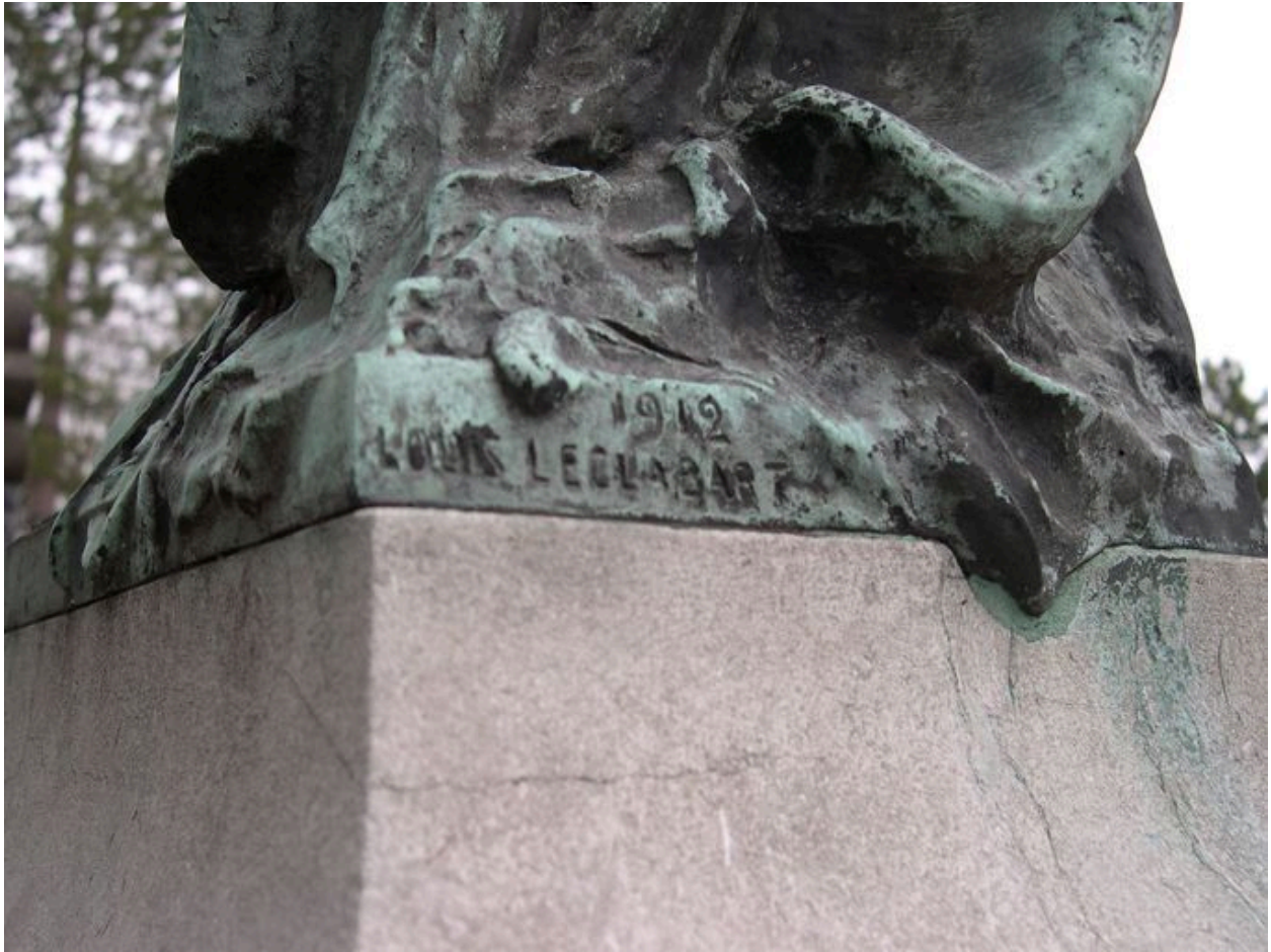
Vue de détail sur la signature.