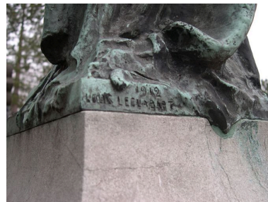
Vue de détail sur la signature.