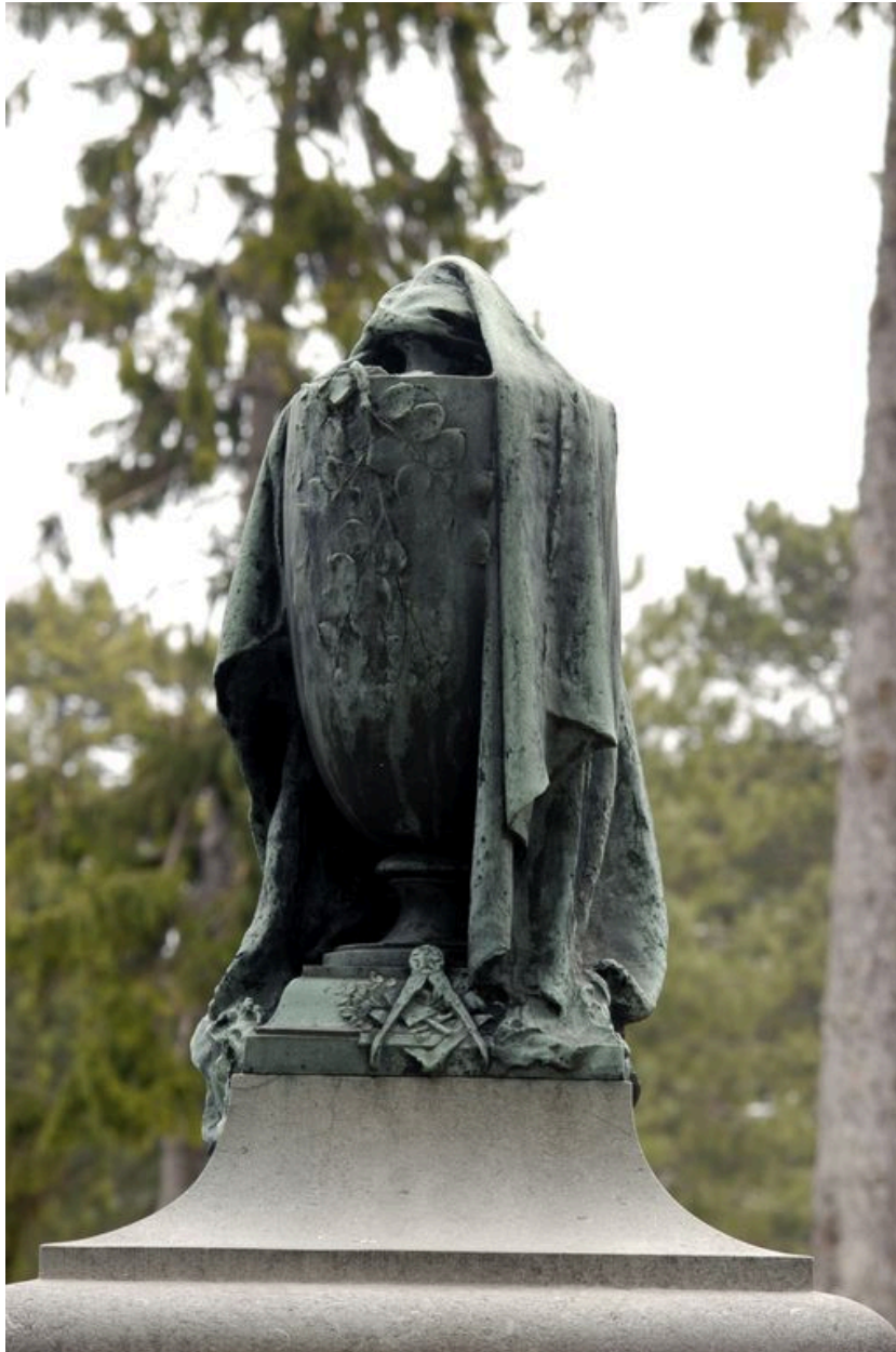
Vue de détail sur l'urne funéraire.