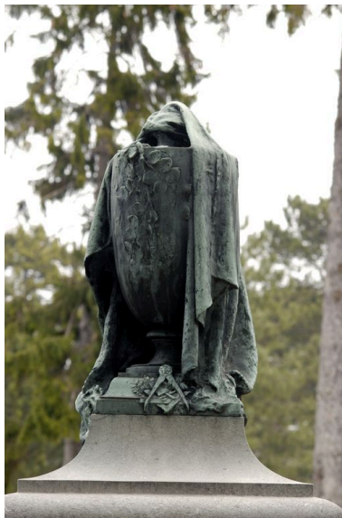
Vue de détail sur l'urne funéraire. IVR22_20058000304NUCA