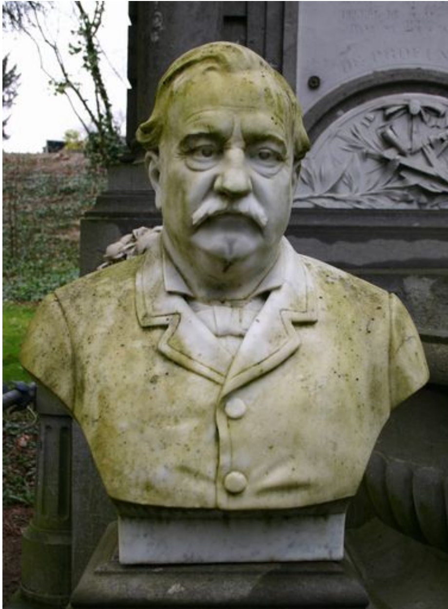
Vue rapprochée du buste de M. Bois-Ducrocq.