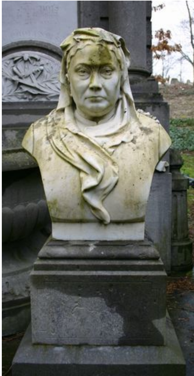
Vue générale du buste de Mme Bois-Ducrocq.