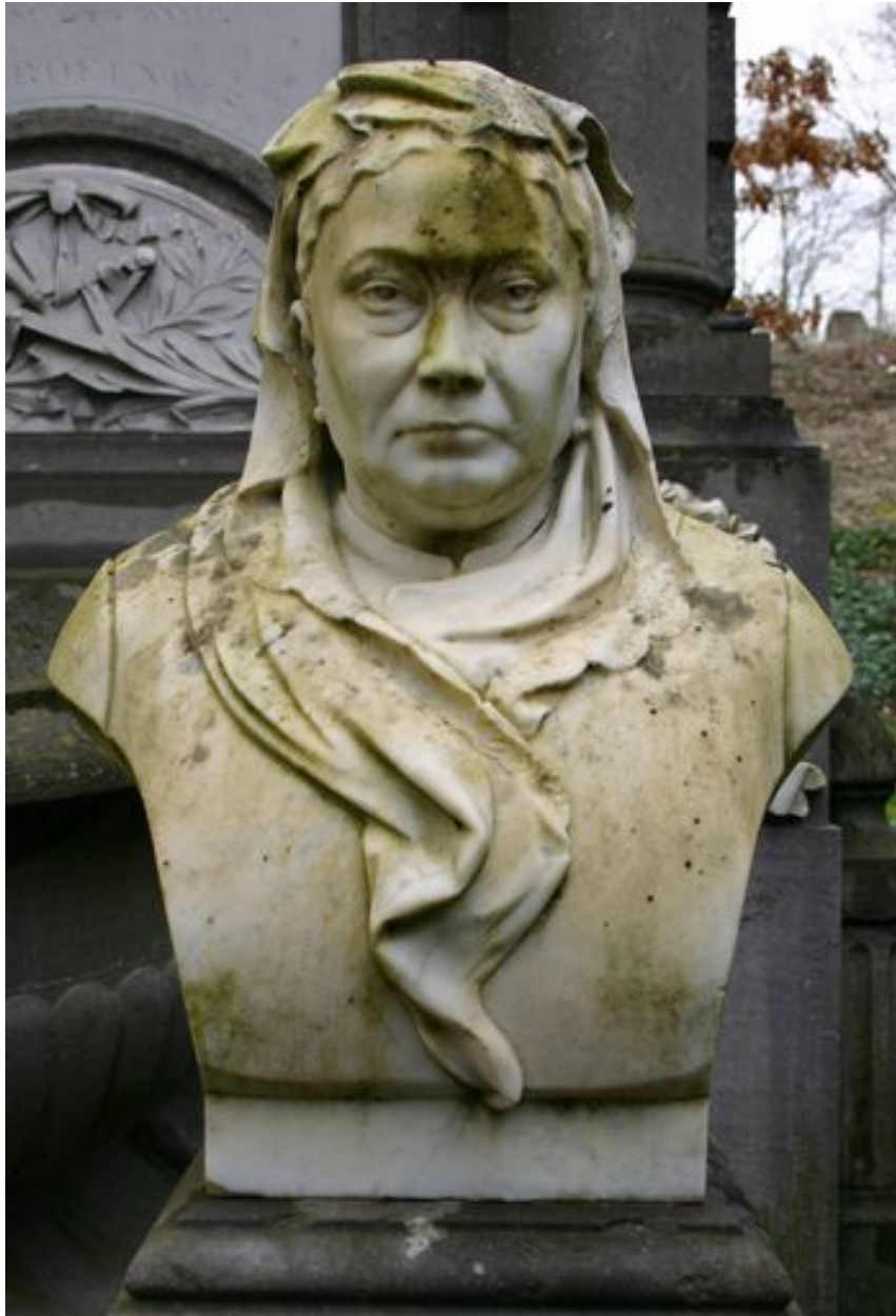
Vue rapprochée du buste de Mme Bois-Ducrocq.