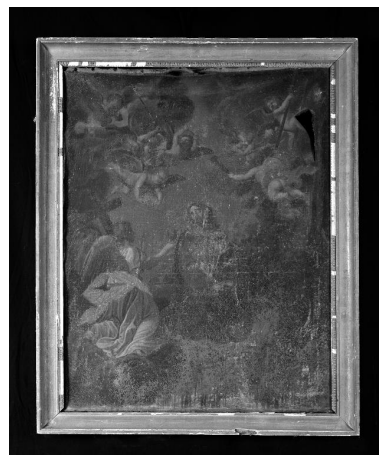
Agonie du Christ, d'après Guido Reni. IVR22_19978000640X