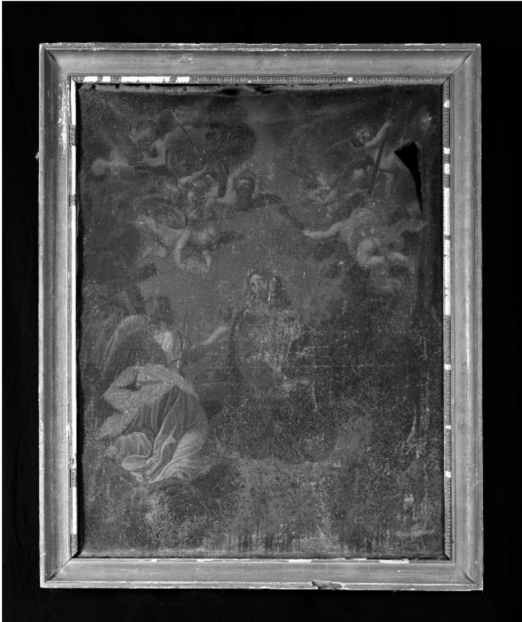
Agonie du Christ, d'après Guido Reni.