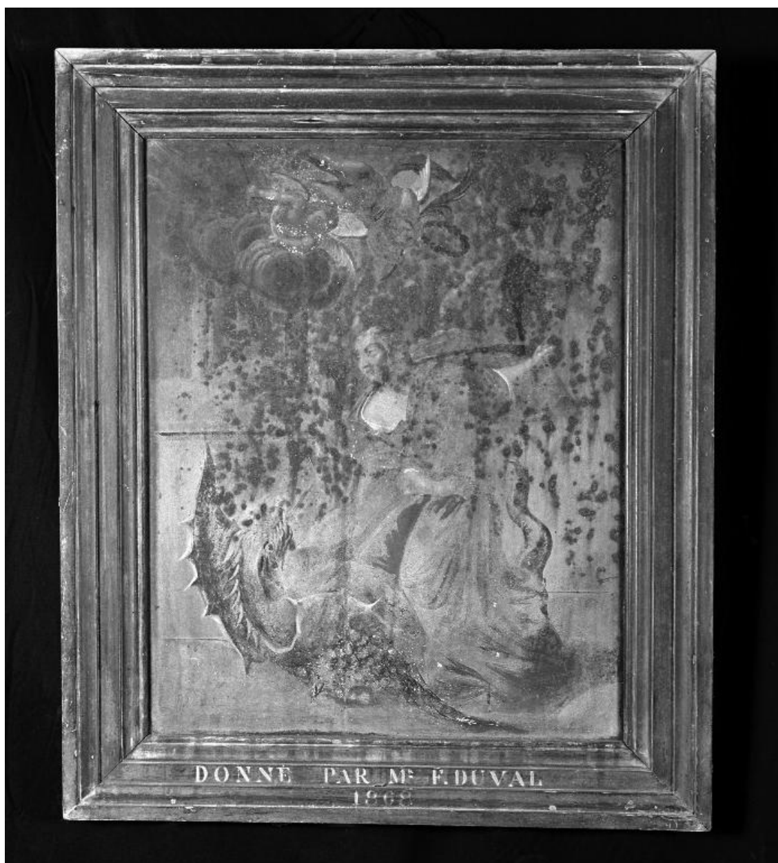
Sainte Marguerite et le dragon, d'après Simon Vouet.