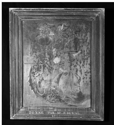
Sainte Marguerite et le dragon, d'après Simon Vouet.