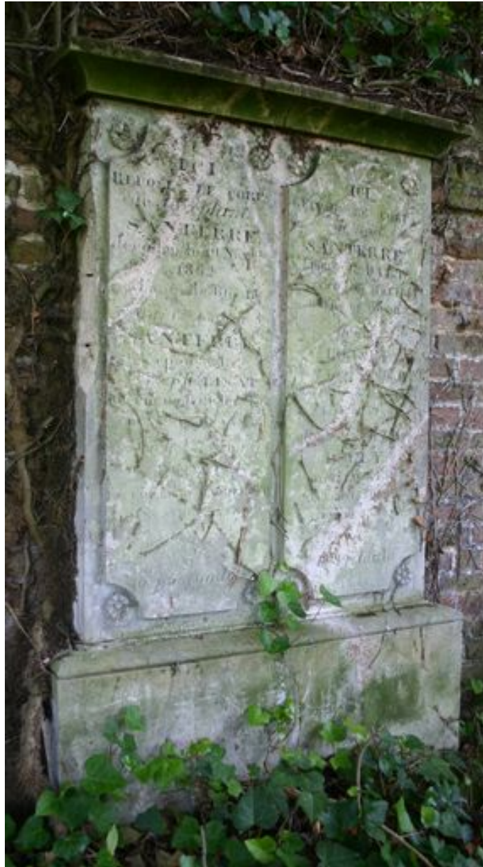
Stèle à entablement et fronton (déposé).