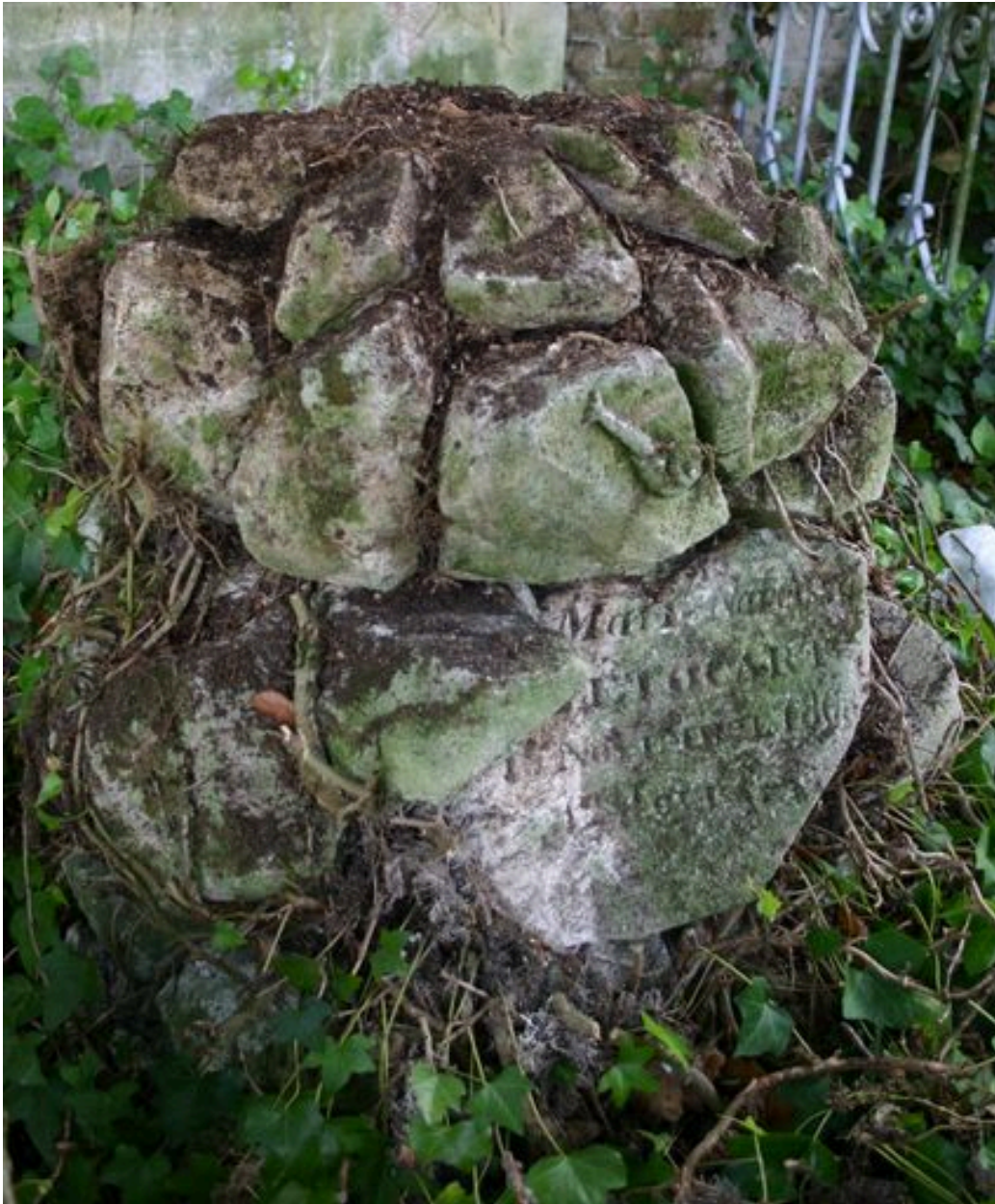
Monument en forme d'enrochement, côté gauche.