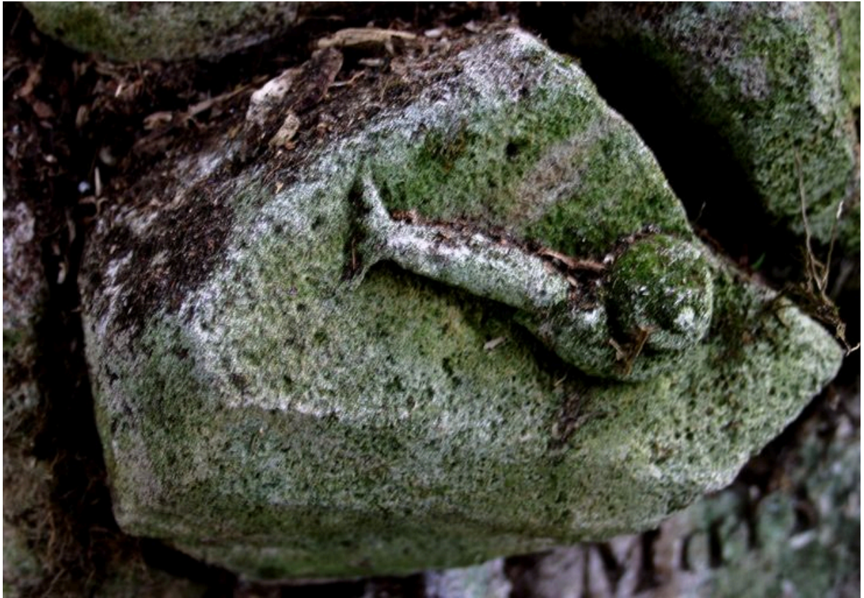
Escargot sculpté ornant le monument en forme d'enrochement.