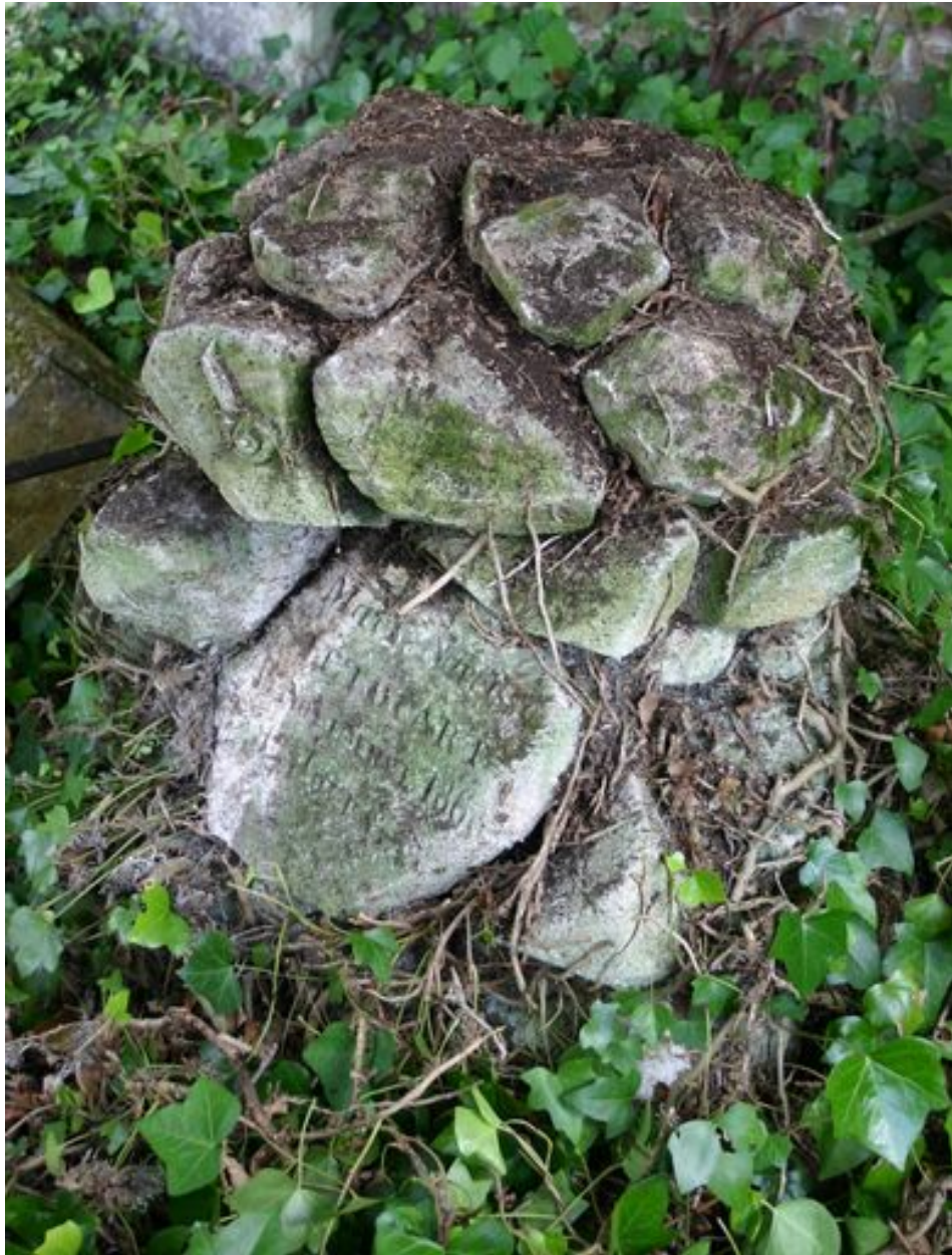
Monument en forme d'enrochement, côté droit.