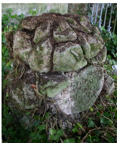
Monument en forme d'encochement, côté gauche.