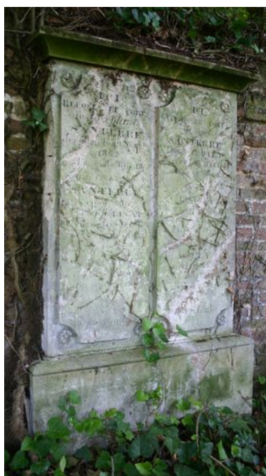
Stèle à entablement et fronton (déposé). IVR22_20068001137NUCA