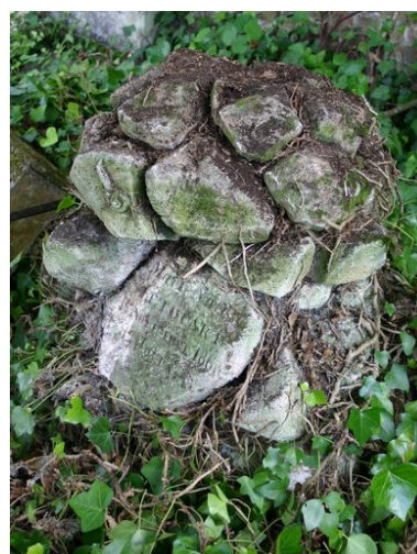
Monument en forme d'encochement, côté droit.