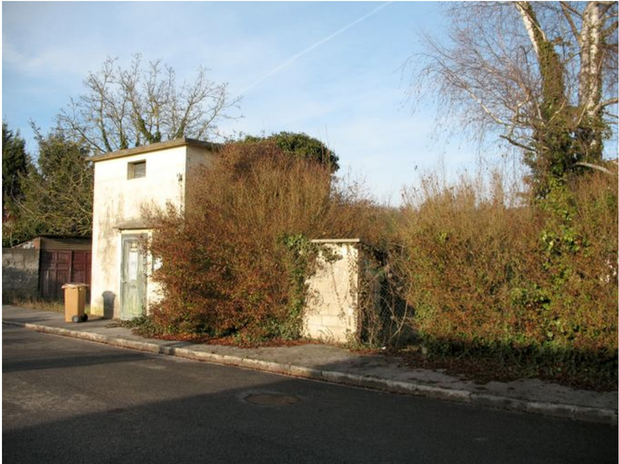
Le transformateur électrique le long de la rue Parot.