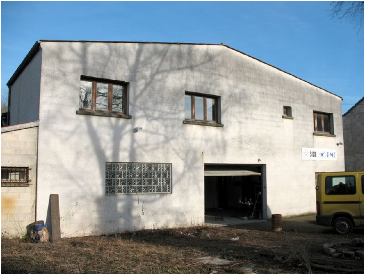
Le bâtiment principal construit pour la blanchisserie en 1959.