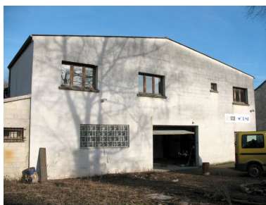
Le bâtiment principal construit pour la blanchisserie en 1959.