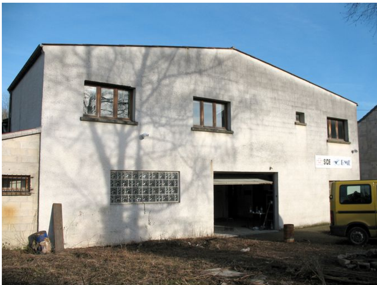
Le bâtiment principal construit pour la blanchisserie en 1959.