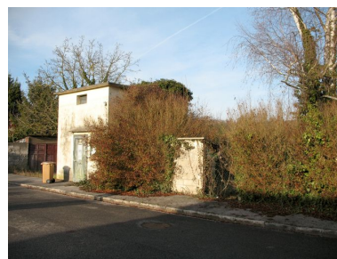
Le transformateur électrique le long de la rue Parot. IVR22_20096005028NUCA