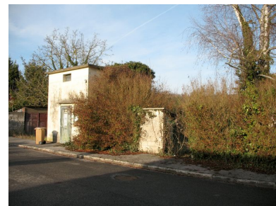
Le transformateur électrique le long de la rue Parot.