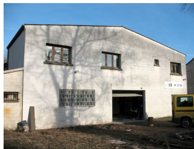
Le bâtiment principal construit pour la blanchisserie en 1959. IVR22_20096005027NUCA