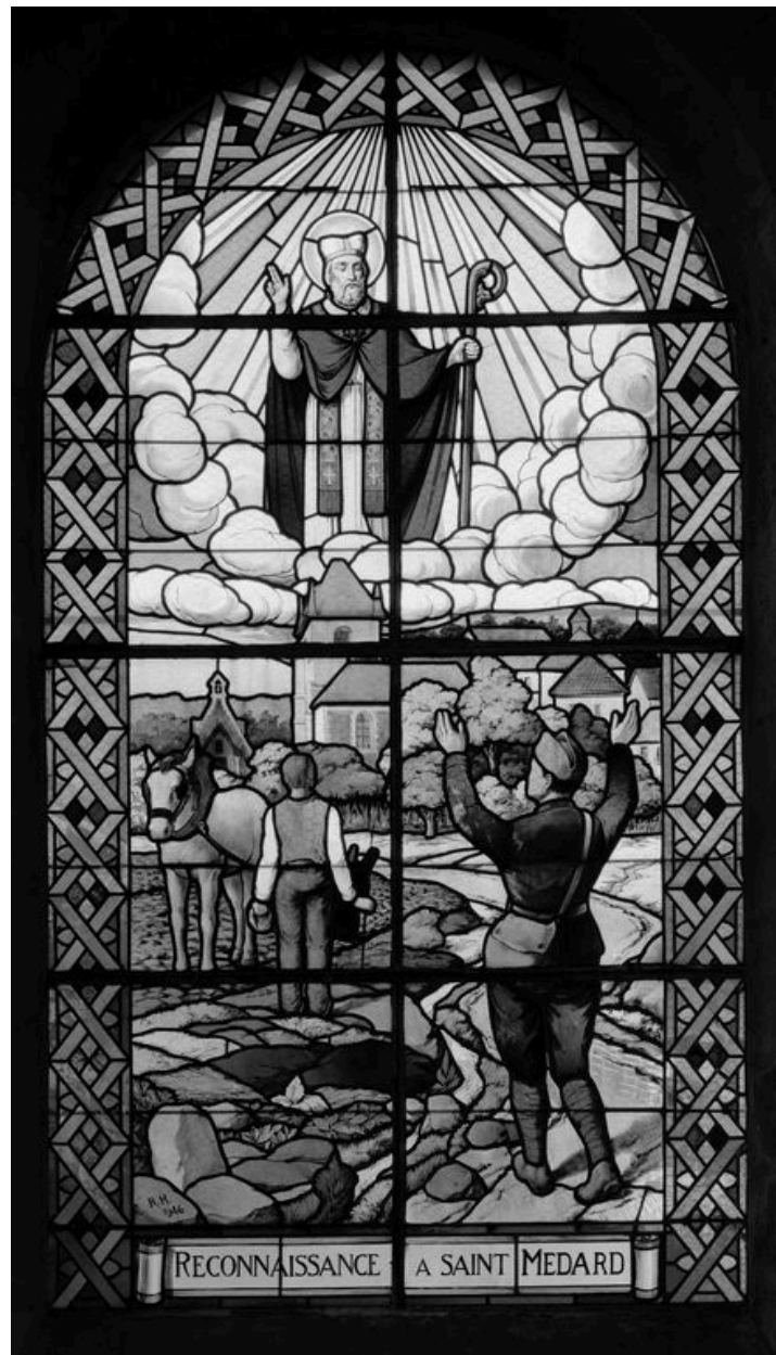
Verrière (baie 13) : Reconnaissance à saint Médard, attribuée à René Houille, 1946.