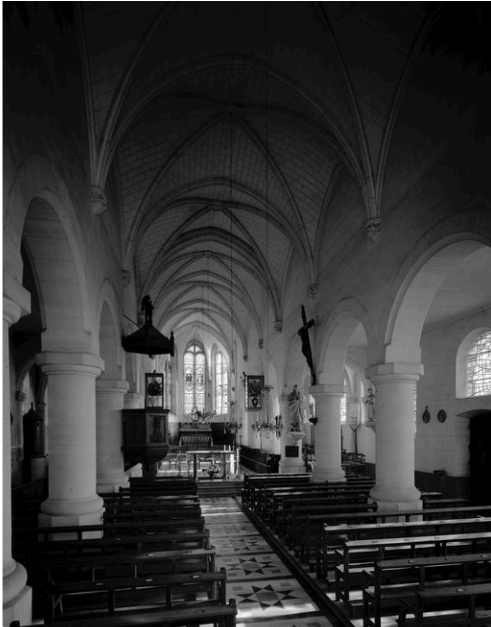
Vue intérieure vers le choeur.