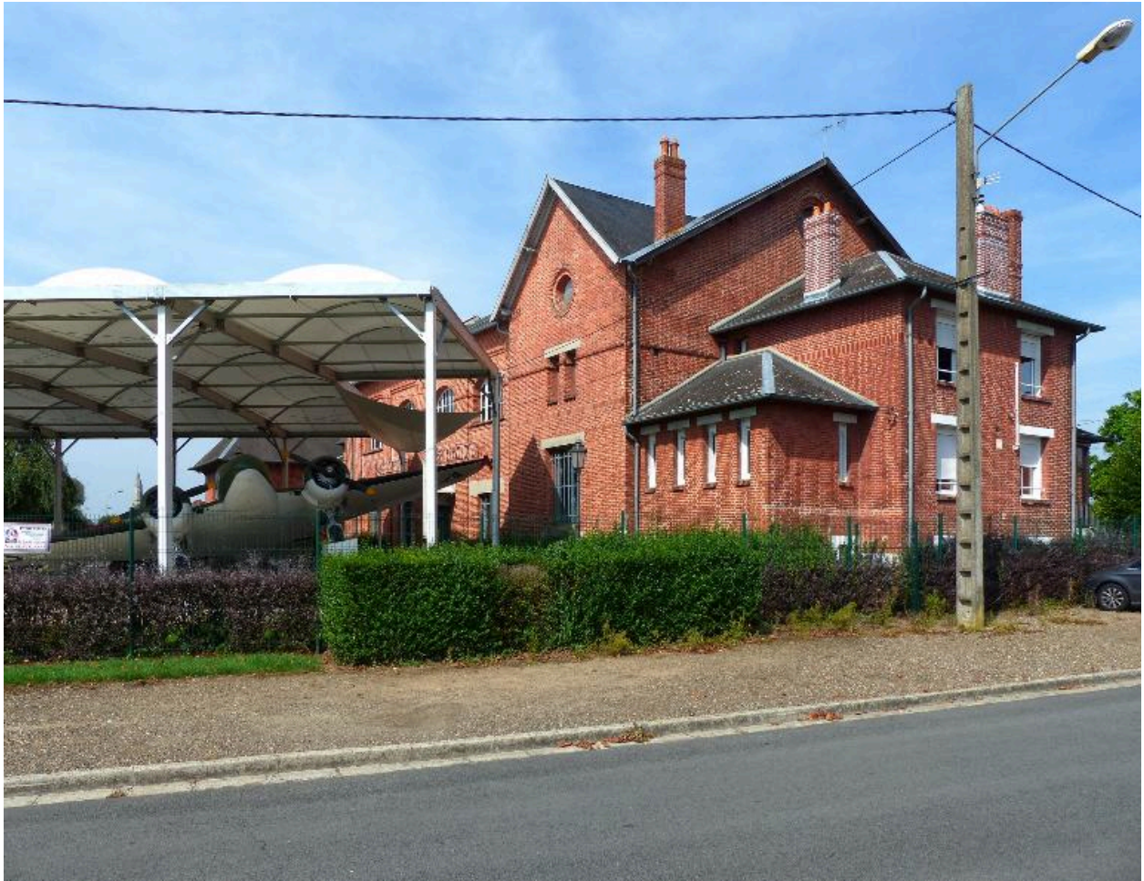
Vue depuis la rue Gouillard-Marcel.