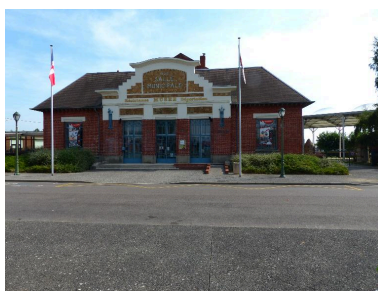
Vue générale. IVR32_20170205483NUCA