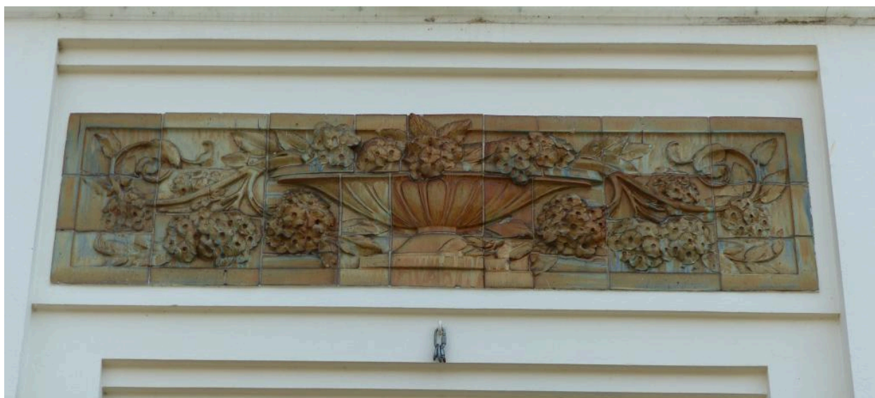
Vue de détail sur le décor de grès cérame.