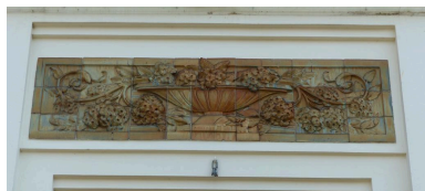
Vue de détail sur le décor de grès cérame. IVR32_20170205622NUCA