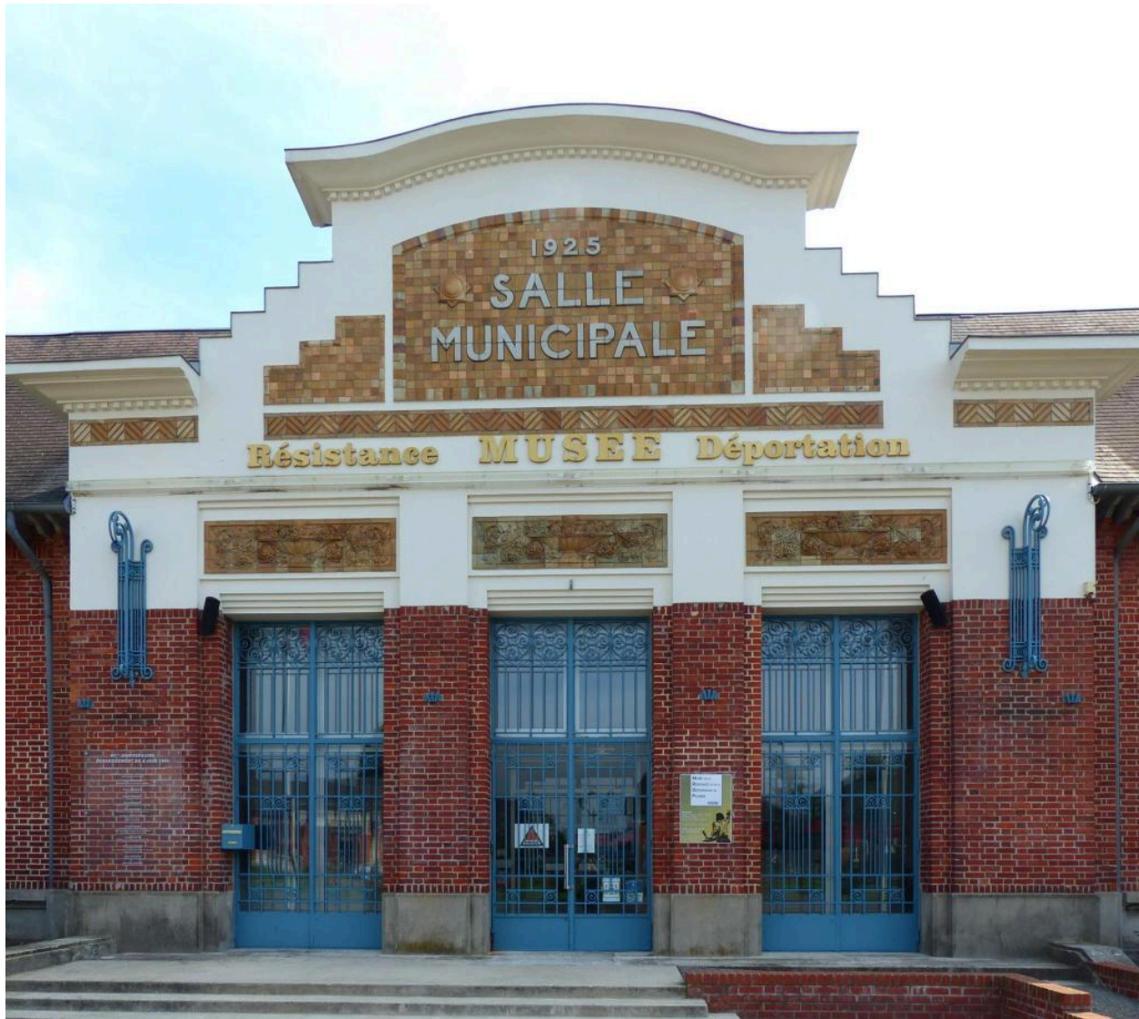
Vue de détail de la façade antérieure avec une inscription et une date portées.