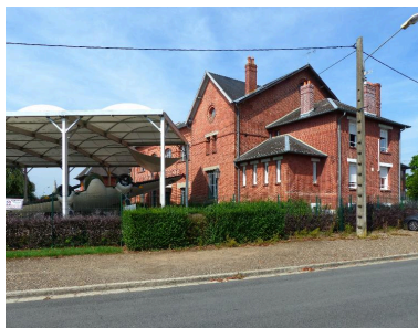
Vue depuis la rue Guillard-Marcel.