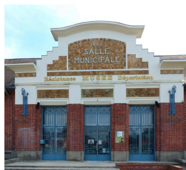
Vue de détail de la façade antérieure avec une inscription et une date portées. IVR32_20170205621NUCA