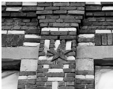
Atelier de fabrication, façade nord-ouest. Fer d'ancrage et décor de brique. IVR31_19885901965X