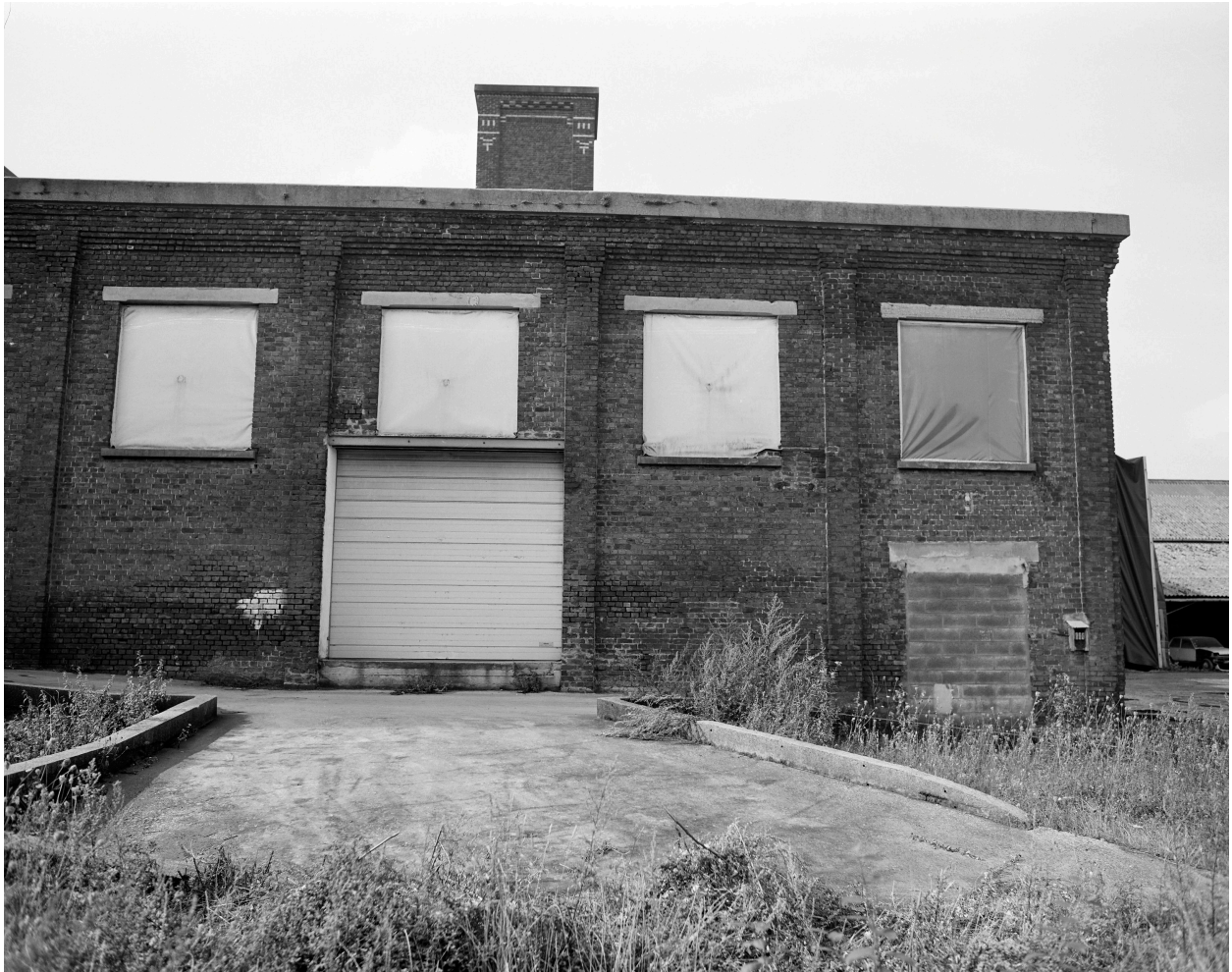
Ancienne chaufferie, rampe d'accès.