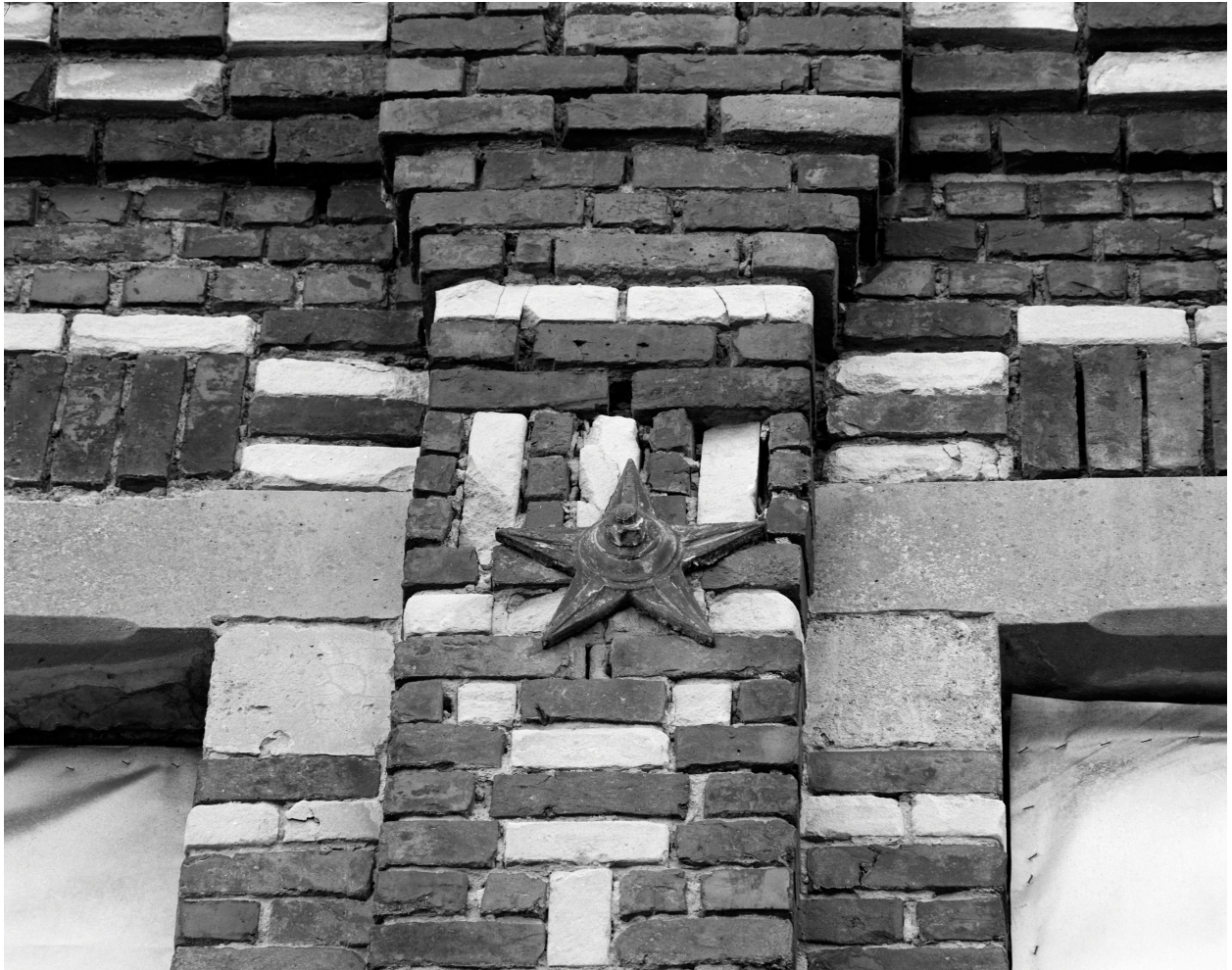
Atelier de fabrication, façade nord-ouest. Fer d'ancrage et décor de brique.