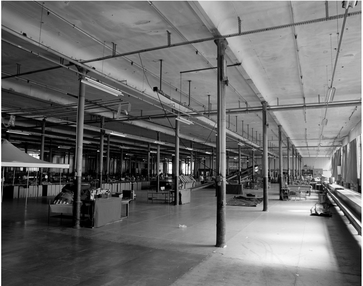
Atelier de fabrication. Vue intérieure.