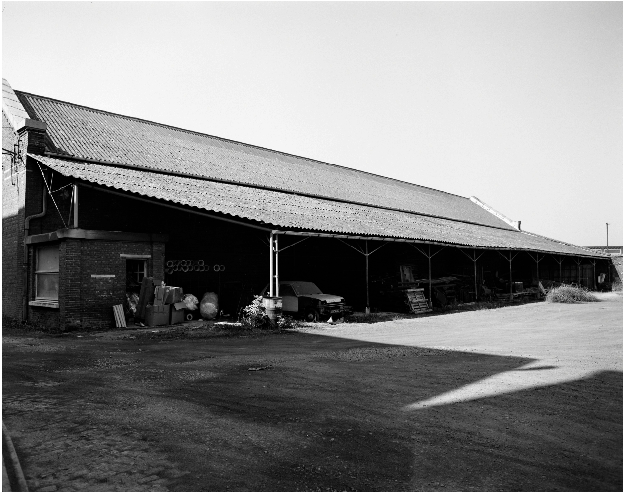
Magasins industriels. Vue prise vers l'ouest.