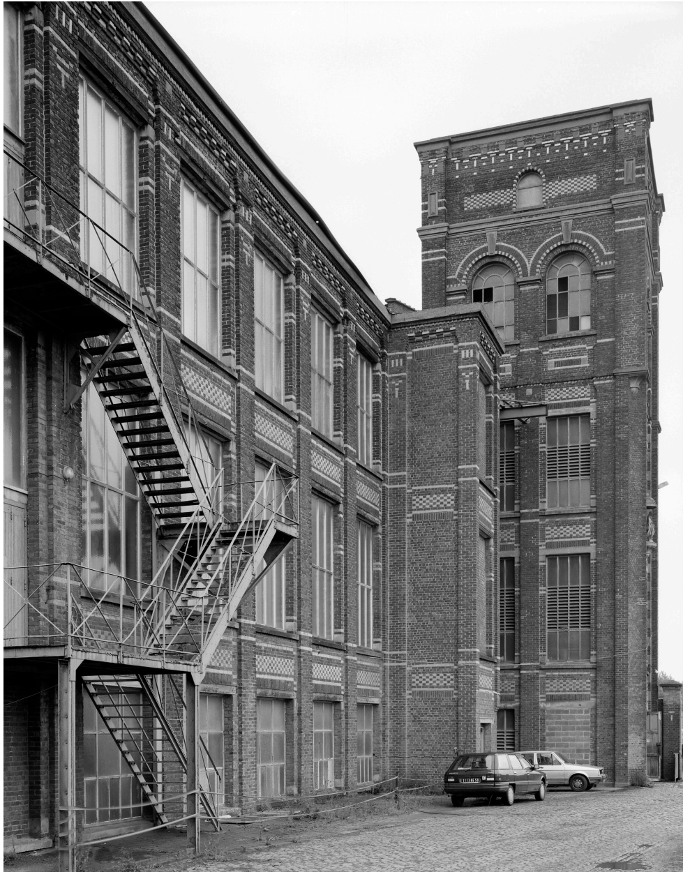
Atelier de fabrication et tour abritant l'escalier. Vue prise vers le sud-est.