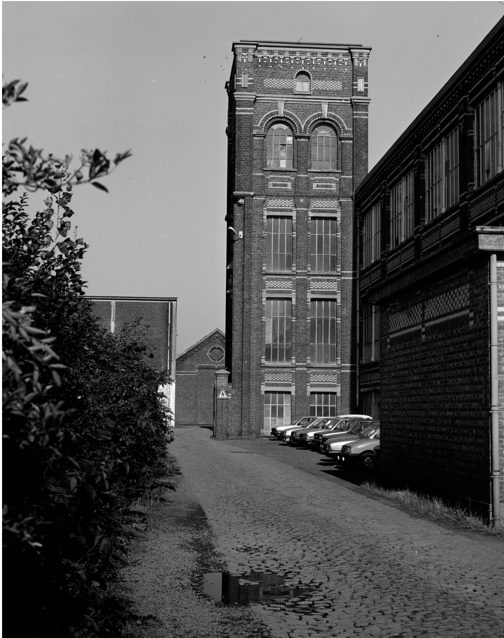
Atelier de fabrication et tour abritant l'escalier. Vue prise vers le nord.