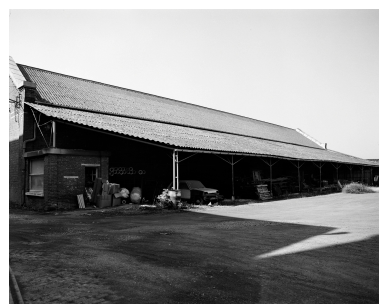
Magasins industriels. Vue prise vers l'ouest. IVR31_19885901994X