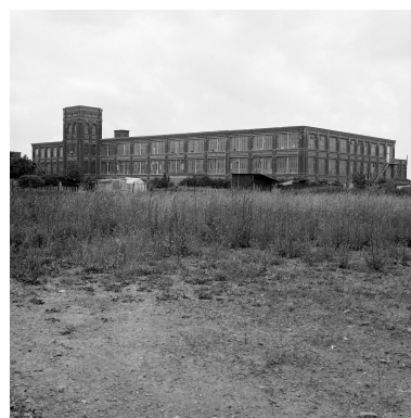
Vue générale prise depuis le sud.