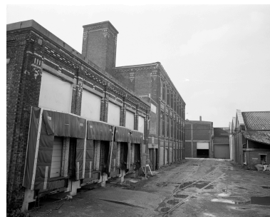
Enfilade vers le sud-ouest, entre l'atelier de fabrication et les magasins industriels. IVR31_19885901881X