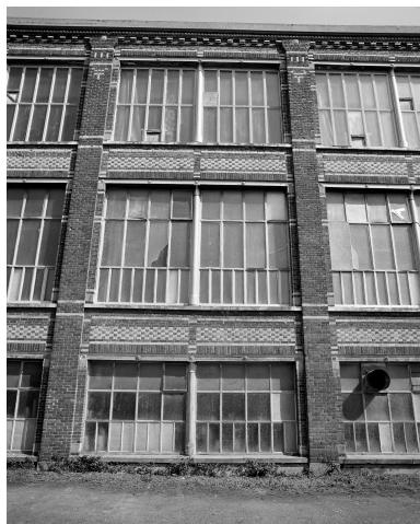
Atelier de fabrication. Une travée. IVR31_19885901967X