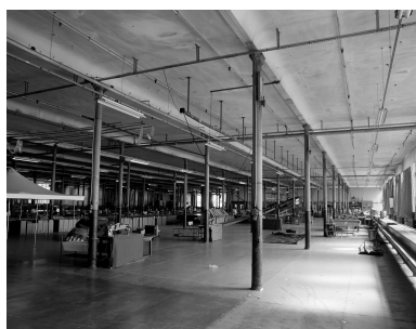
Atelier de fabrication. Vue intérieure. IVR31_19885901968X