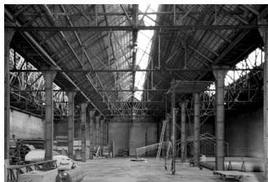
Magasin industriel.