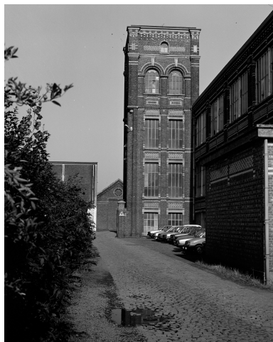
Atelier de fabrication et tour abritant l'escalier. Vue prise vers le nord. IVR31_19885901990X