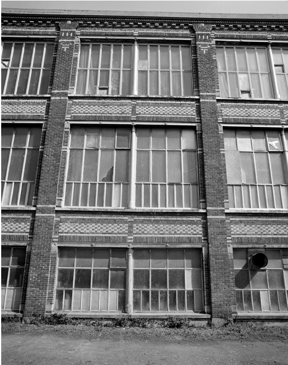
Atelier de fabrication. Une travée.