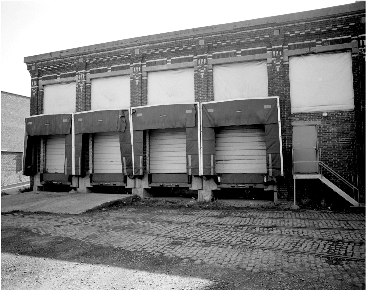
Atelier de fabrication, façade nord-ouest. Poste de chargement.