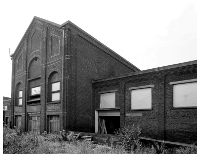
Ancienne salle des machines. Vue prise vers le sud.