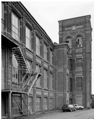
Atelier de fabrication et tour abritant l'escalier. Vue prise vers le sud-est.