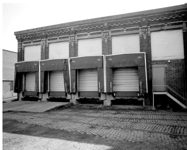
Atelier de fabrication, façade nord-ouest. Poste de chargement.