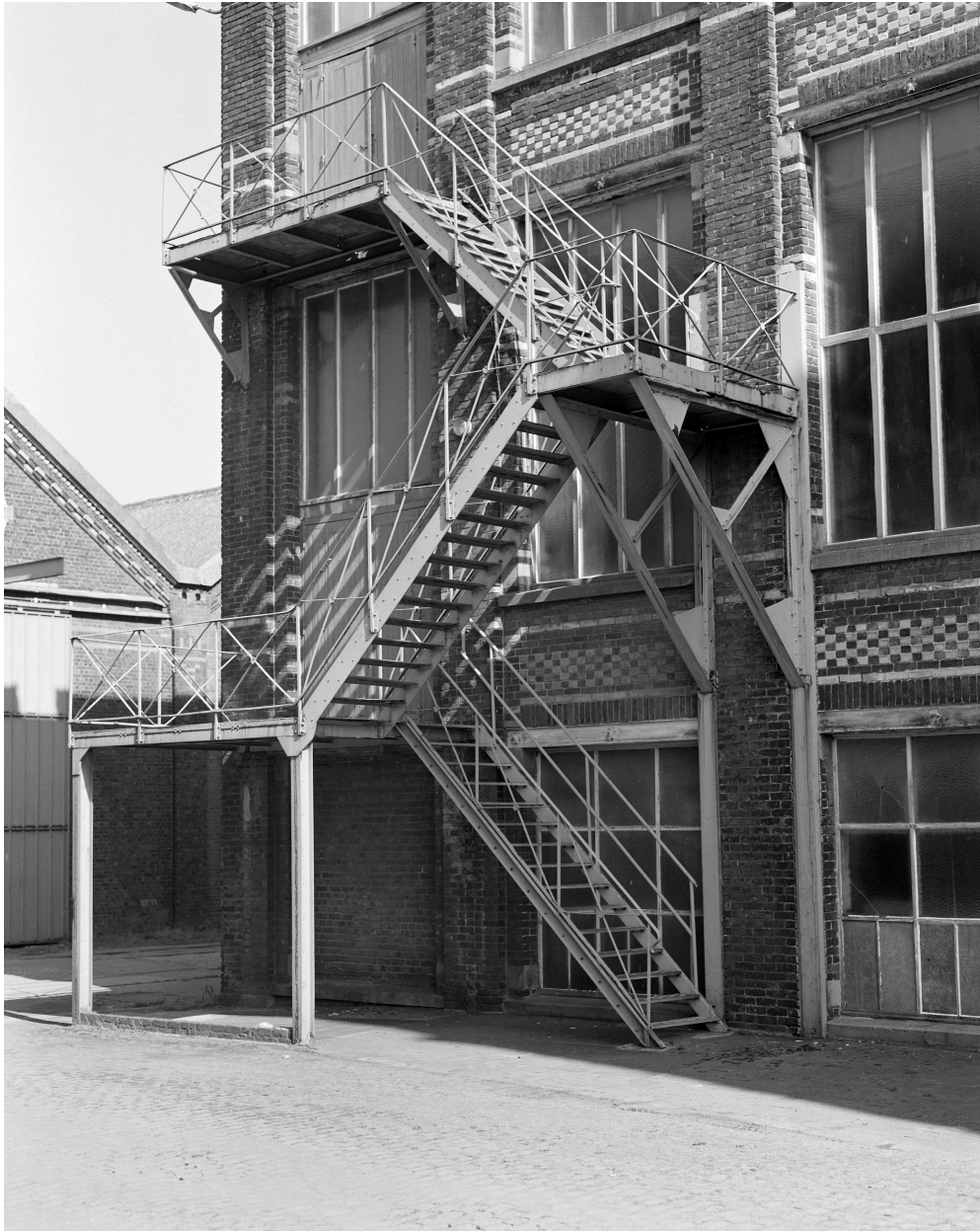
Atelier de fabrication. Escalier de distribution extérieur.