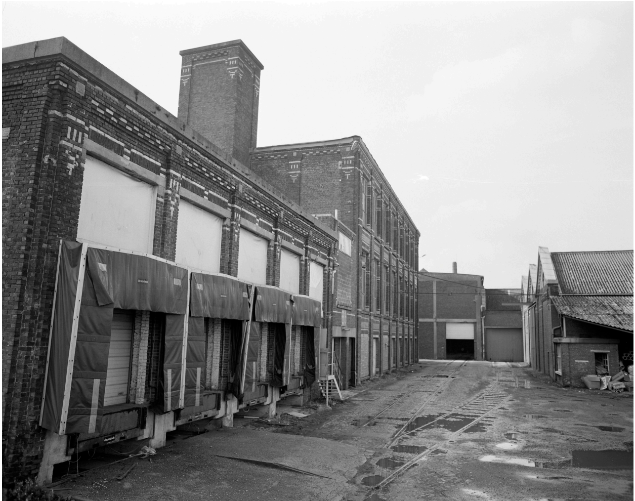
Enfilade vers le sud-ouest, entre l'atelier de fabrication et les magasins industriels.