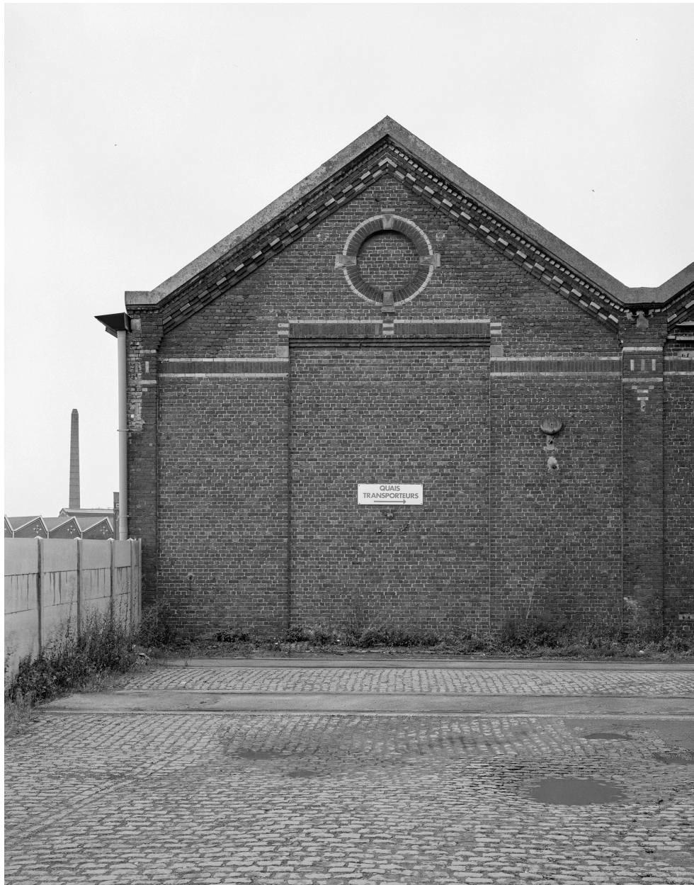
Magasin. Pignon sur cour.