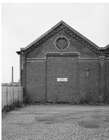
Magasin. Pignon sur cour. IVR31_19925901498V