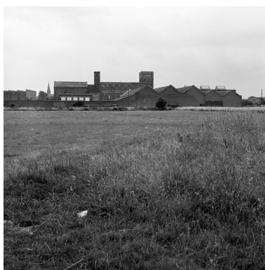
Vue générale prise depuis le nord.