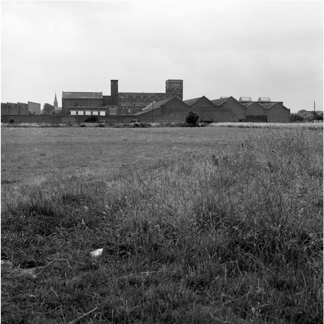
Vue générale prise depuis le nord.