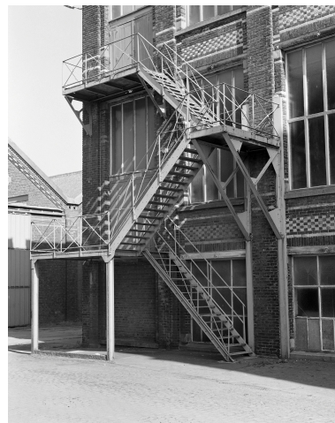
Atelier de fabrication. Escalier de distribution extérieur. IVR31_19885901993X