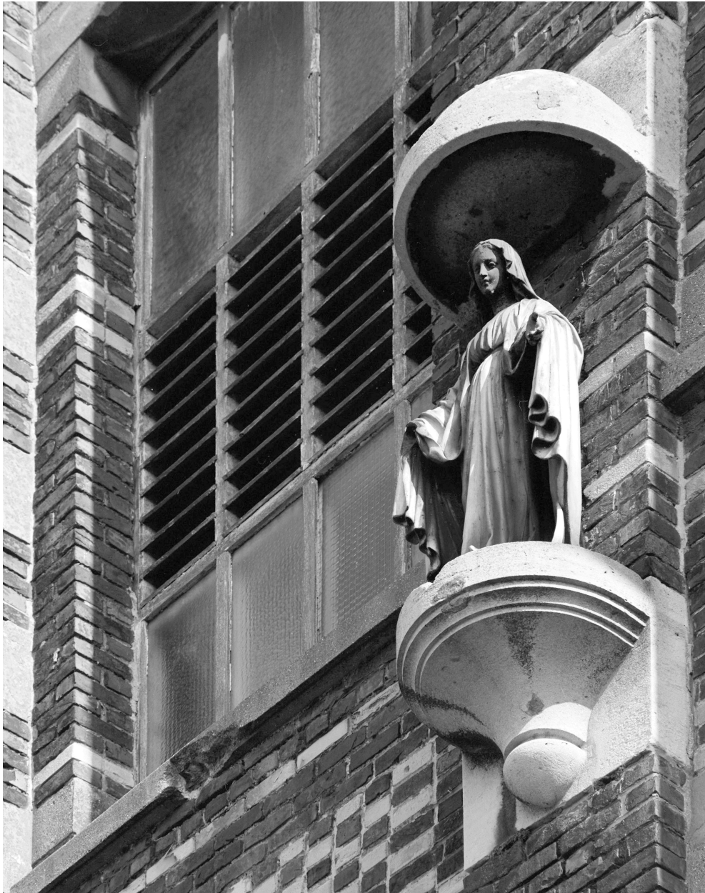
Statue de la Vierge sur la tour d'escalier.