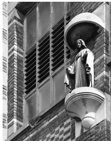
Statue de la Vierge sur la tour d'escalier.