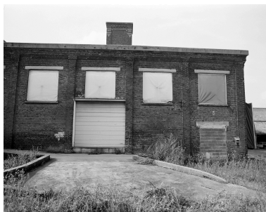
Ancienne chaufferie, rampe d'accès. IVR31_19885901882X