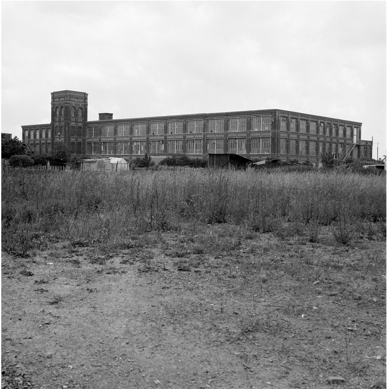
Vue générale prise depuis le sud.