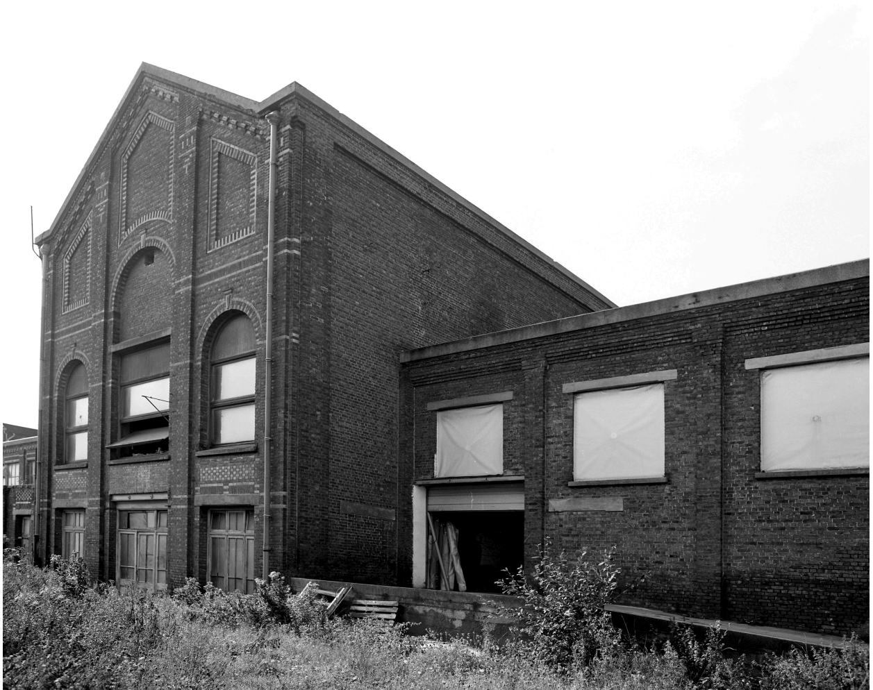
Ancienne salle des machines. Vue prise vers le sud.