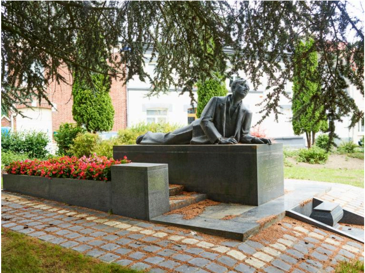
Vue générale, face avant.