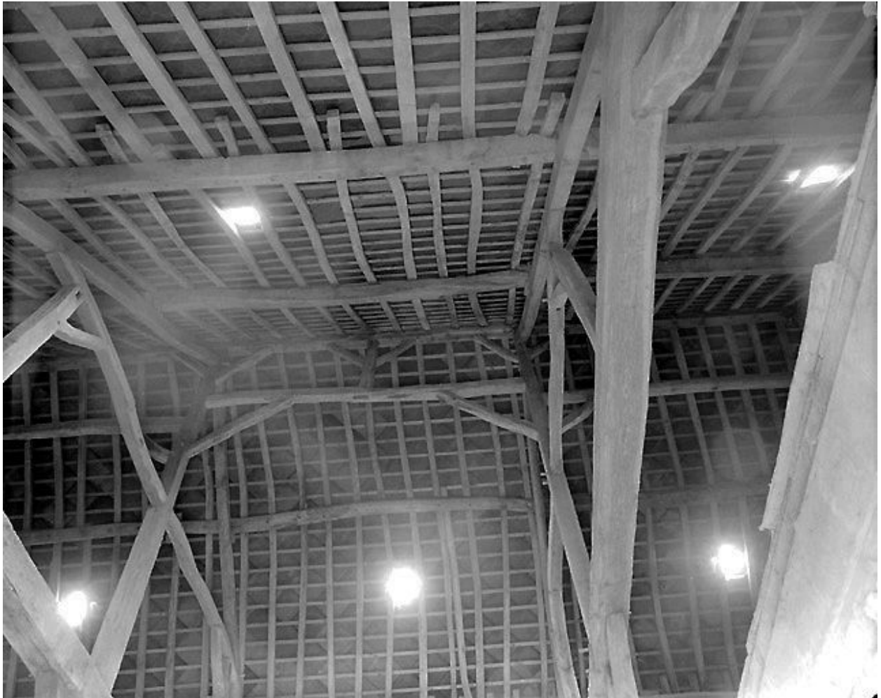
Charpente de la grange.