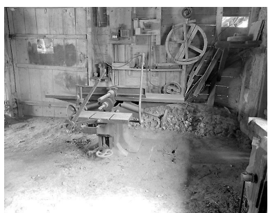
Machine à découper et scier le bois. IVR22_19980201029X