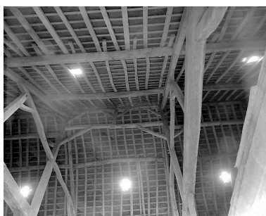
Charpente de la grange. IVR22_19980201030X