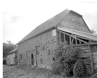
Élévation postérieure du logis et de la grange-étable. IVR22_19980201025X