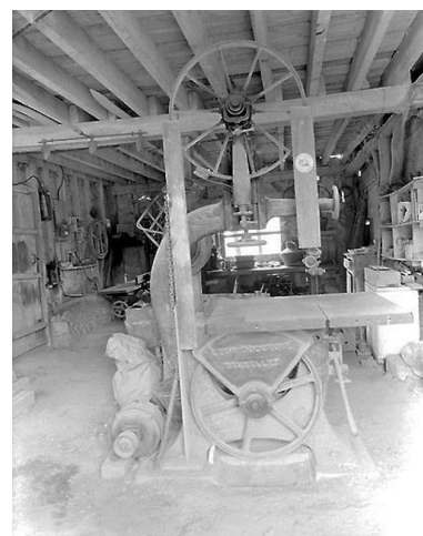
Machine à découper et scier le bois. IVR22_19980201028X