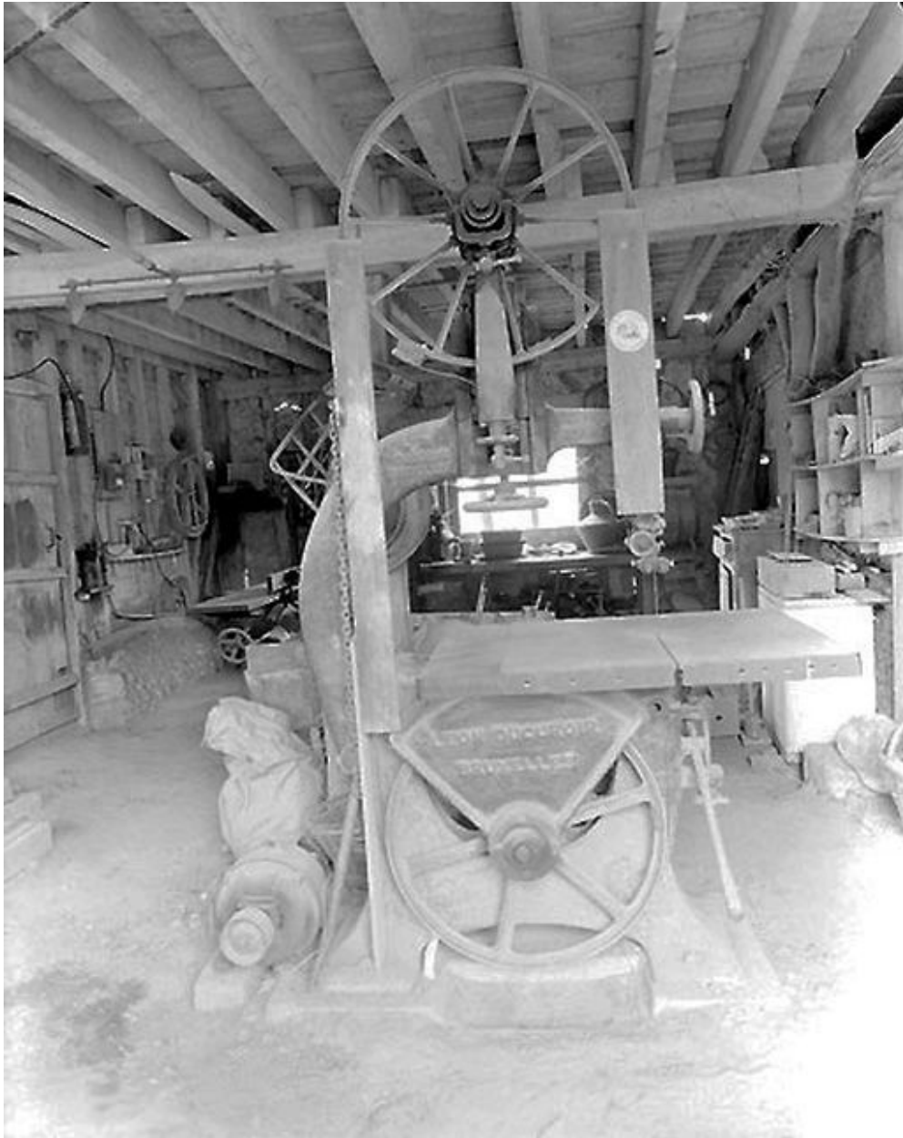
Machine à découper et scier le bois.