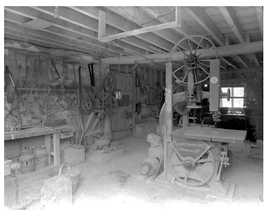
Intérieur de l'atelier de charron.