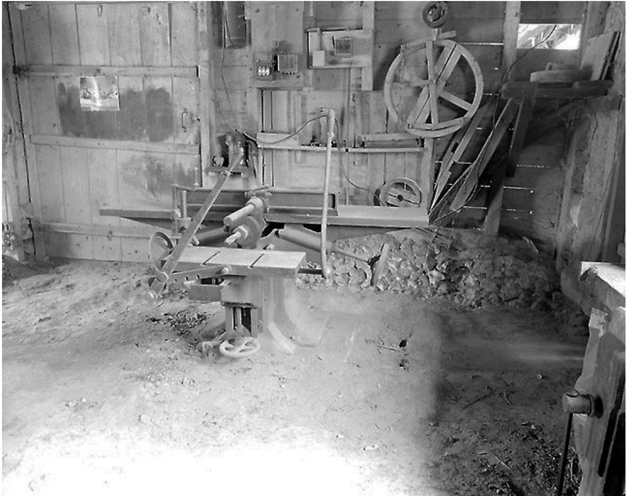
Machine à découper et scier le bois.