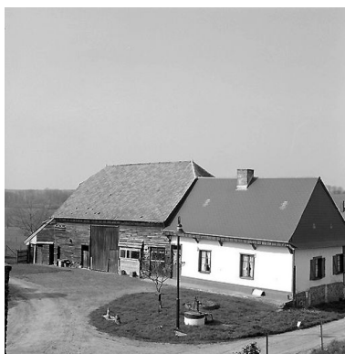
Vue générale. IVR22_20020200247X