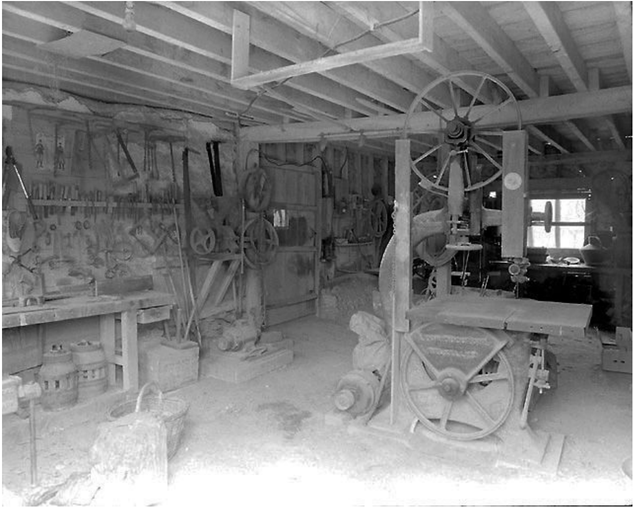
Intérieur de l'atelier de charron.