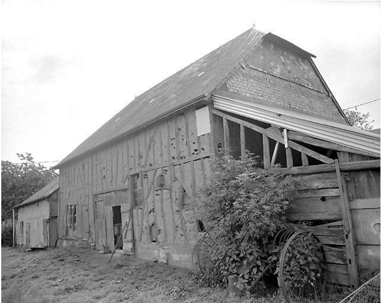
Elévation postérieure du logis et de la grange-étable.