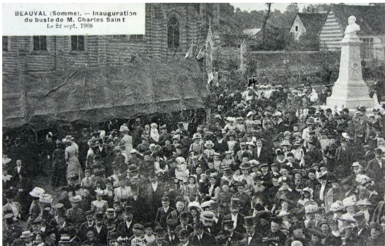
Inauguration du buste de Charles Saint, 22 septembre 1908.