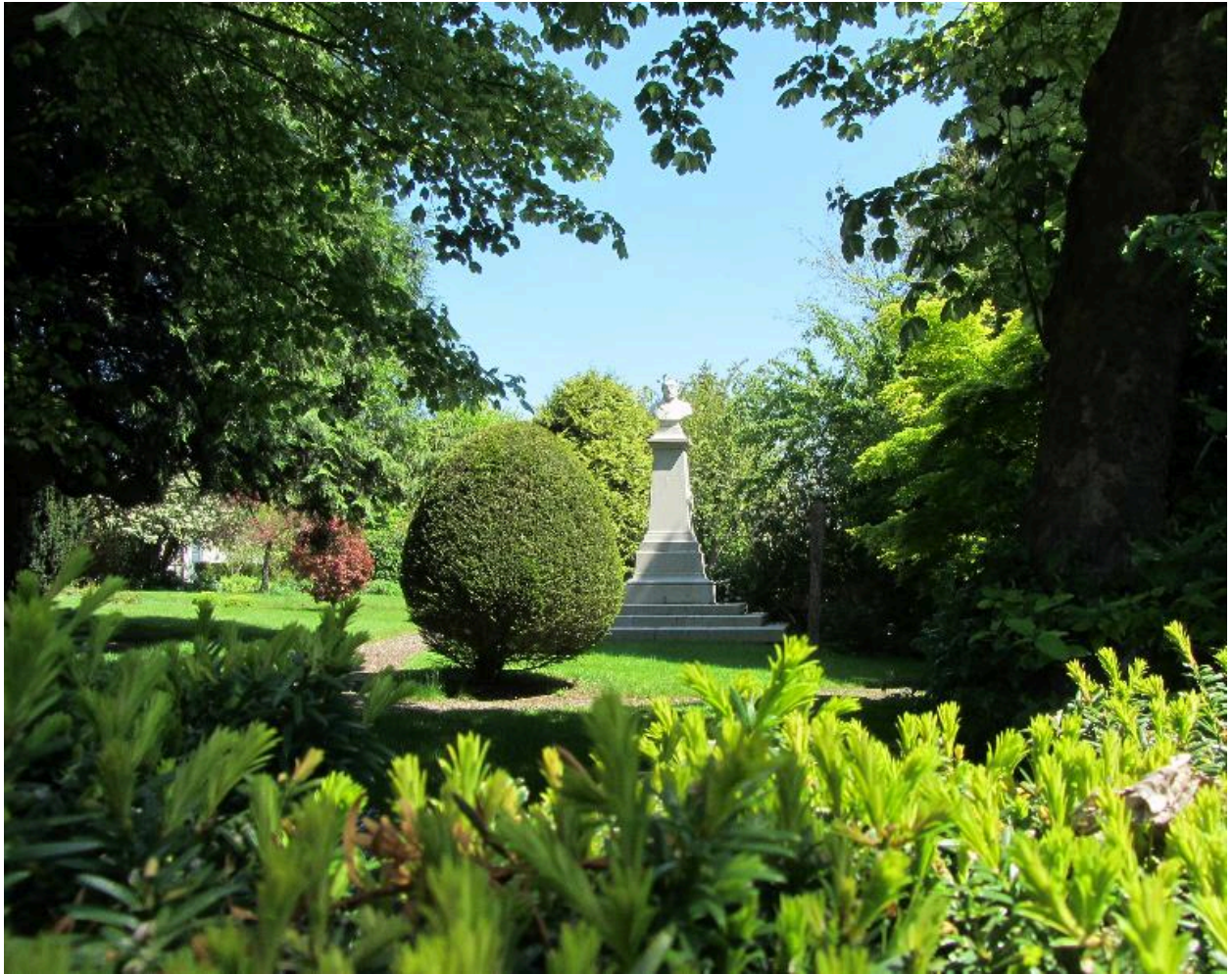
Vue de situation.