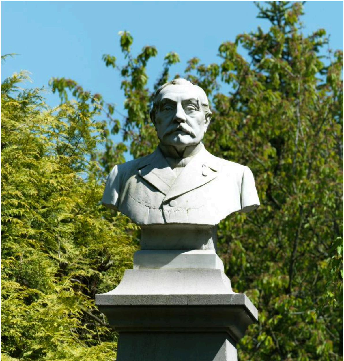
Détail du buste de Charles Saint.