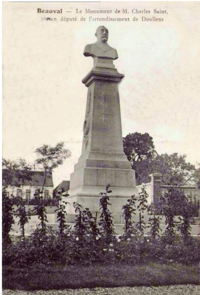
Vue d'ensemble, vers 1910.