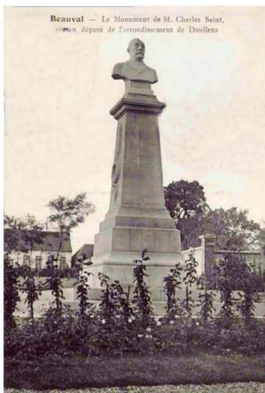
Vue d'ensemble, vers 1910 (coll. part.).