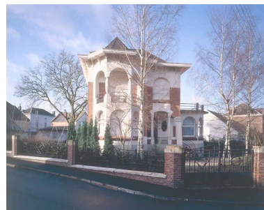
Élévation antérieure.