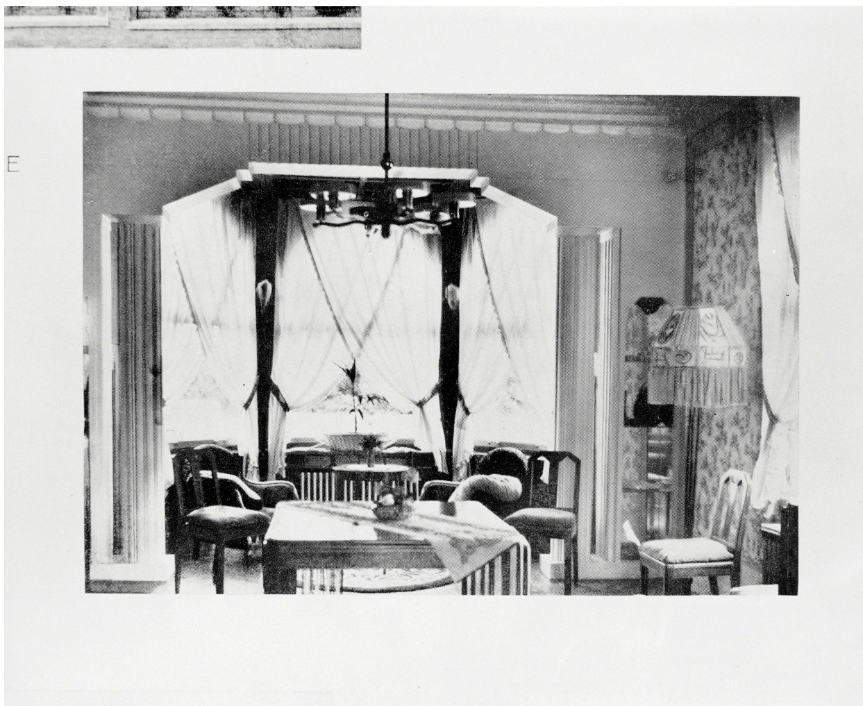
Vue intérieure entre 1927-34, in Travaux d'Architecture (AP Dieux).