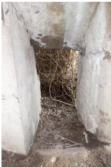
Ouverture située au niveau du sol d'une des petites salles intermédiaires (latrines ?)