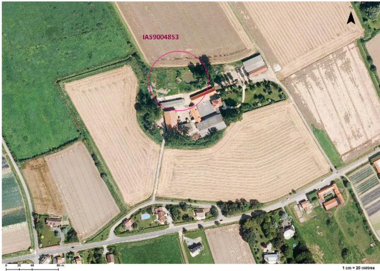
Position de l'édifice sur une photographie aérienne de 2014