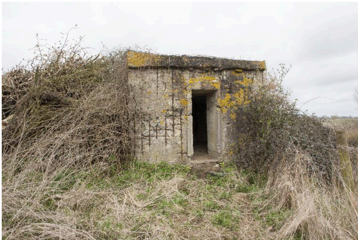
Entrée sur le pignon sud-est