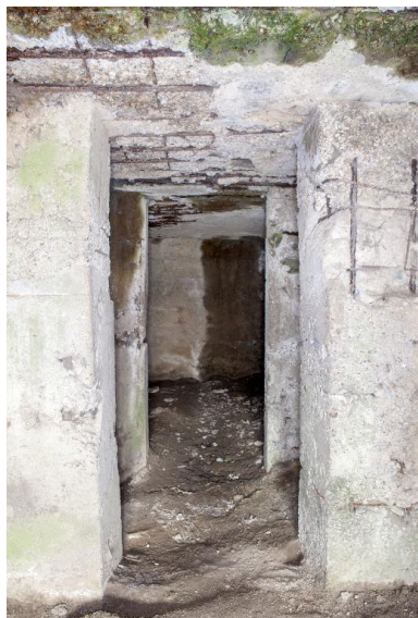
Depuis la première salle, vers le nord-ouest. Au premier plan se trouvent deux petites pièces qui faisaient peut-être office de latrines.