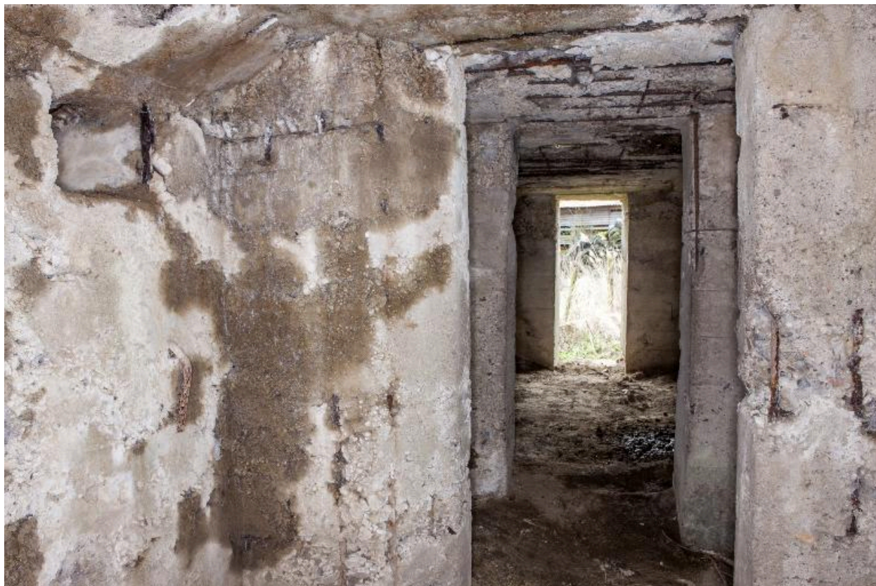
Depuis la seconde salle, vers la sortie