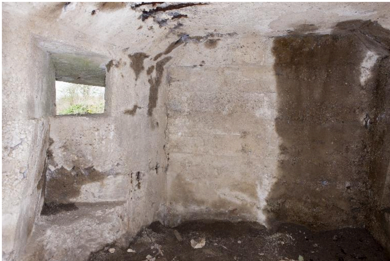
Seconde salle, élévation sud-ouest. Créneau de fusillade ou d'observation