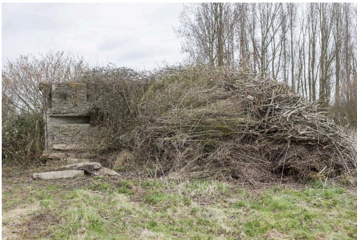
Vue latérale, vers le nord