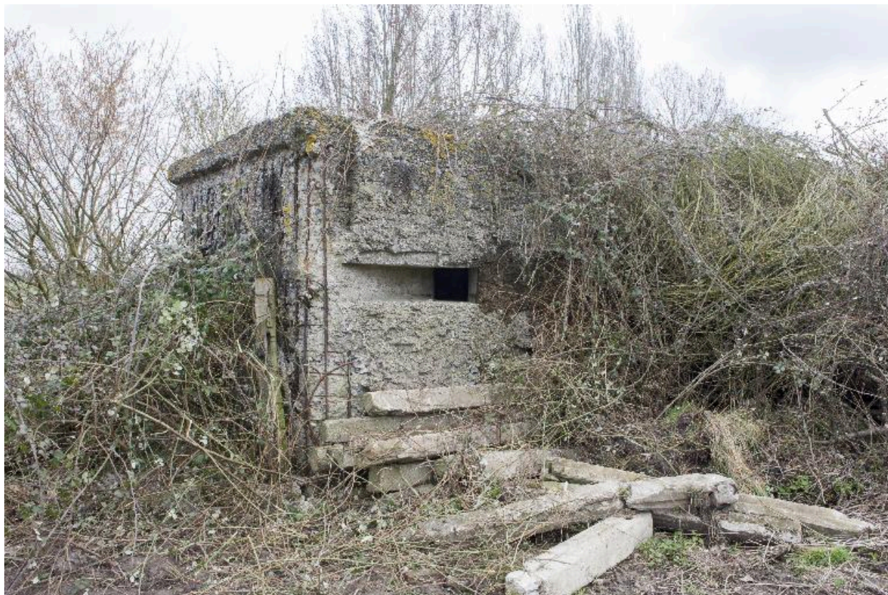
Vue de trois-quarts vers le nord-est