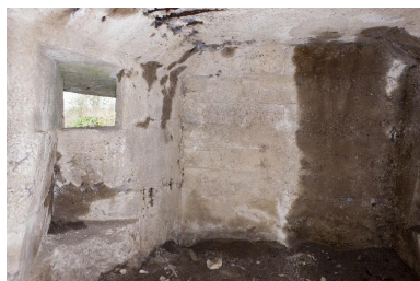
Seconde salle, élévation sud-ouest.