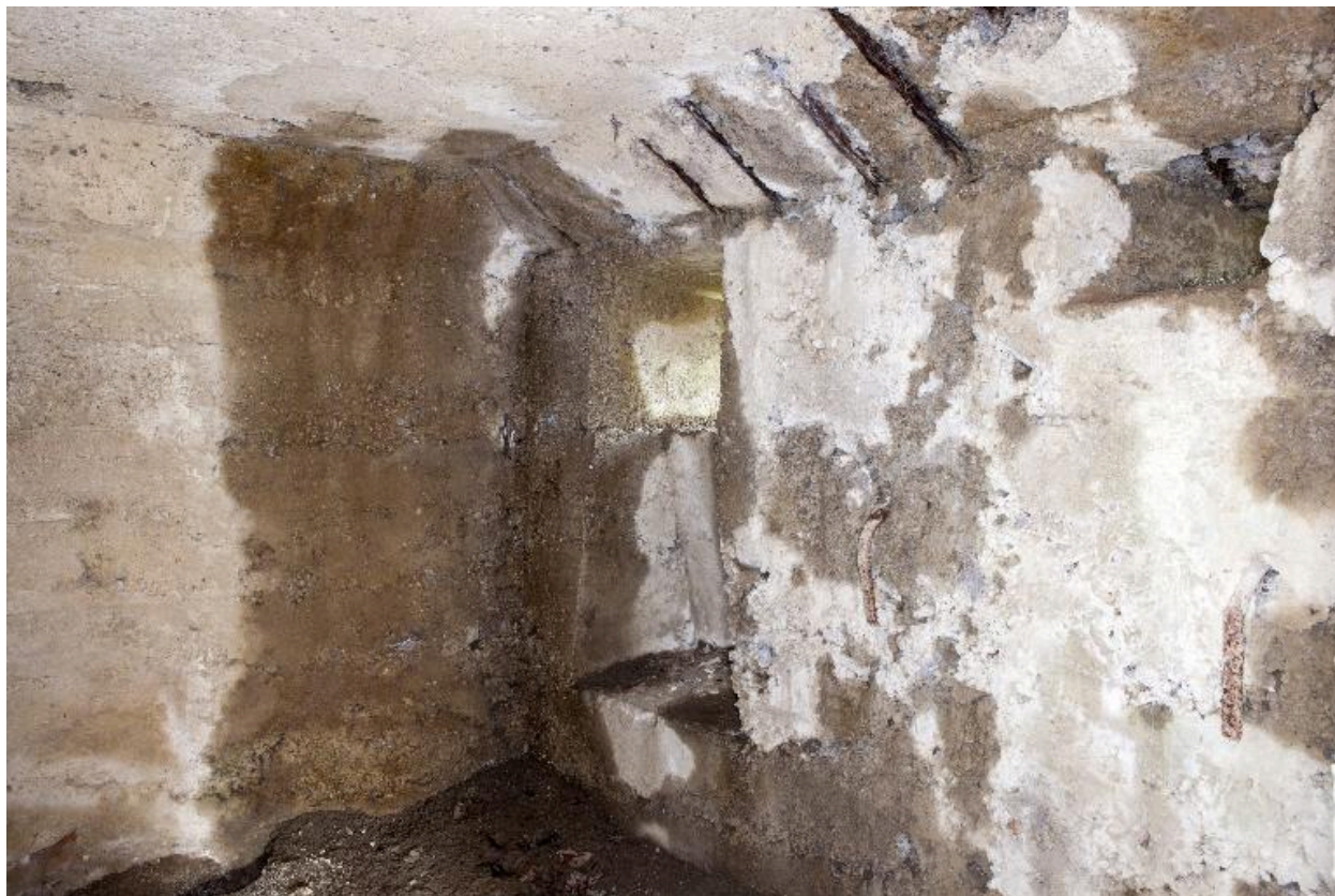
Seconde salle, élévation nord-est. Créneau de fusillade ou d'observation.