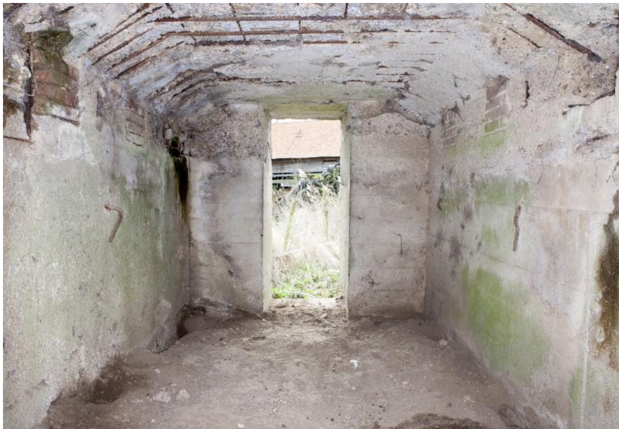
Vue depuis la première salle vers la sortie