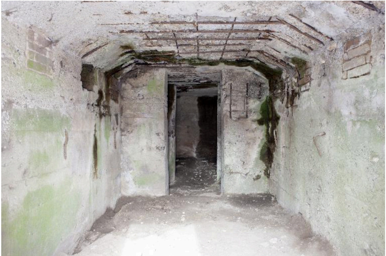
Vue intérieure en enfilade, vers le nord-ouest