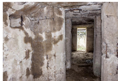
Depuis la seconde salle, vers la sortie