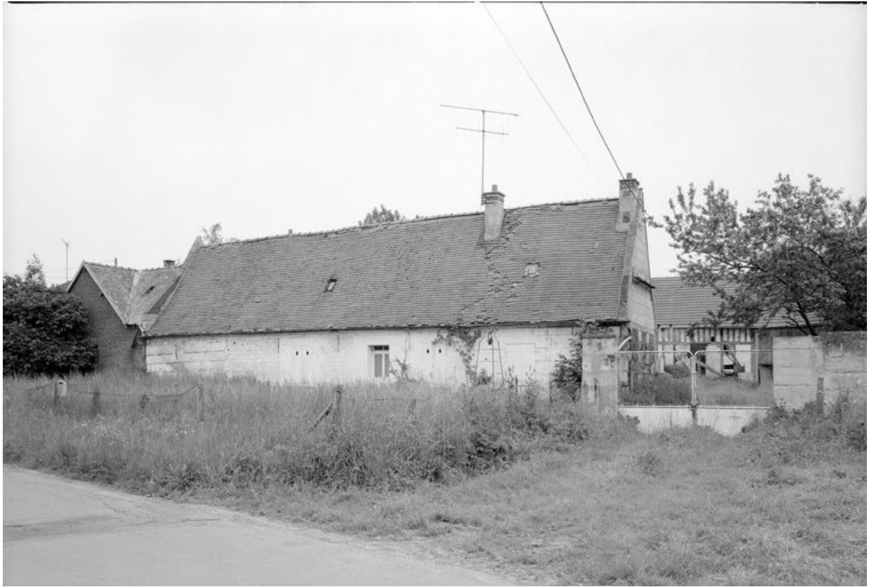
Logis. Elévation antérieure.