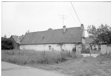
Logis. Elévation antérieure. IVR22_19856000866X