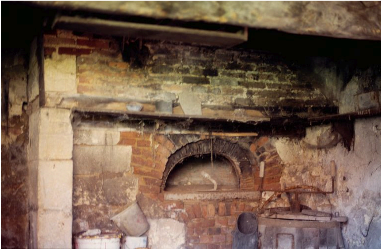
Four à pain.