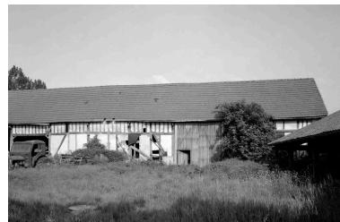
Granges.