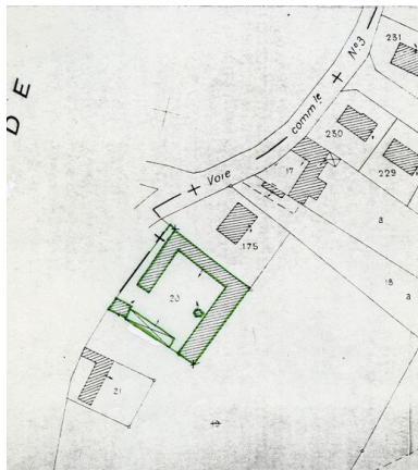
Plan de situation. Extrait du plan cadastral de 1958, section AE 20.