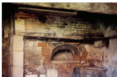
Four à pain. IVR22_19856000700ZA