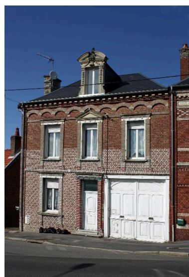
Flixecourt, maison, 11, rue Victor-Hugo, 4e quart du 19e siècle. IVR22_20138016100NUC2A