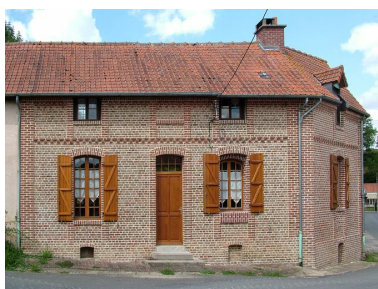
Bouchon, logis de l'ancienne ferme, 1 Grande-Rue, fin du 19e siècle.