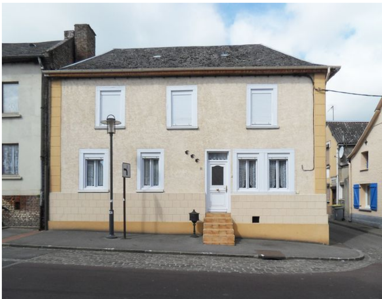
Saint-Ouen, maison, 9 rue de la République, reconstruite vers 1855.