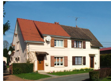
Ribeaucourt, maisons jumelles, 6 et 8 rue de l'Eglise, années 1950.