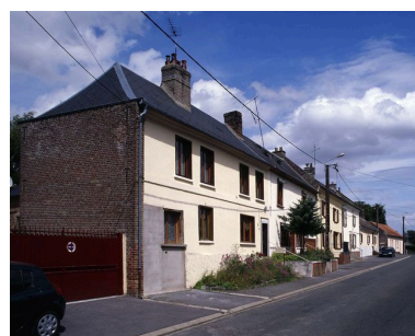
Pernois, alignement de maisons, 115-157 rue de la Ville, dont certaines étaient habitées par des tisserands au milieu du 19e siècle. IVR22_20098000245XA