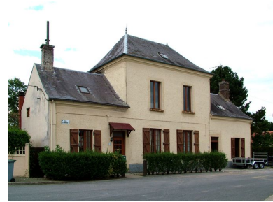
Pernois, ancien café de la Place, 11-21 rue du Marais, 4e quart du 19e siècle. IVR22_20098005413NUCA