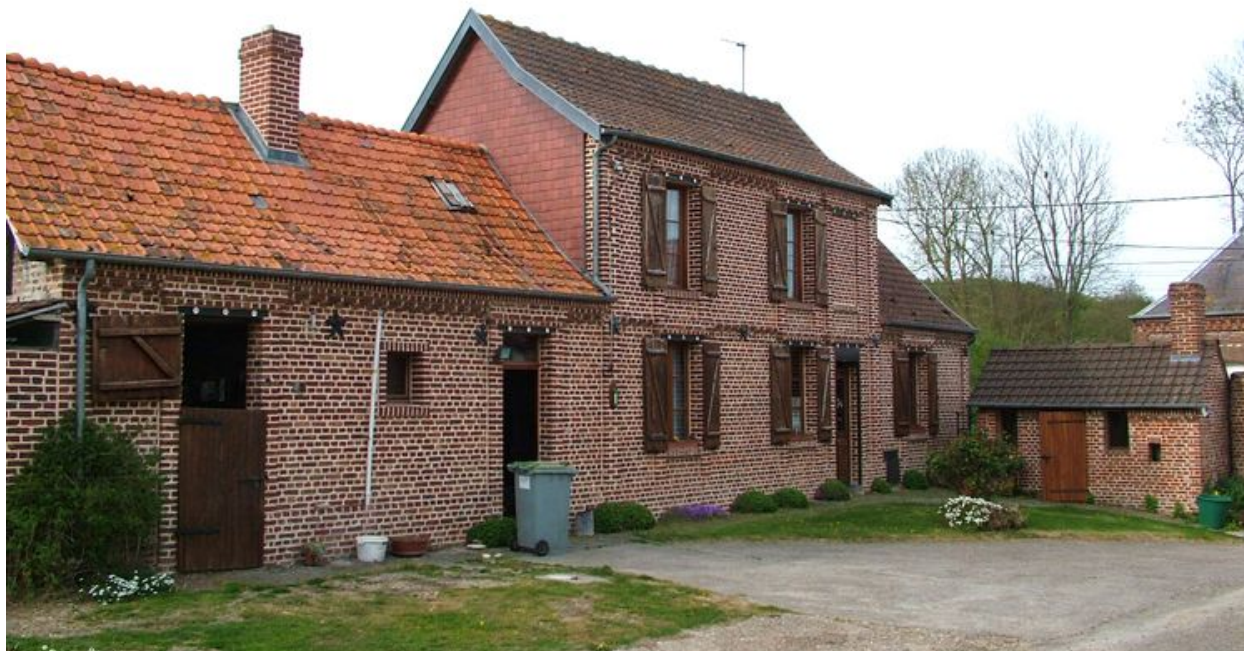
Surcamps, ancienne ferme, 5 rue Principale, fin du 19e siècle : écurie, logis et porcherie.