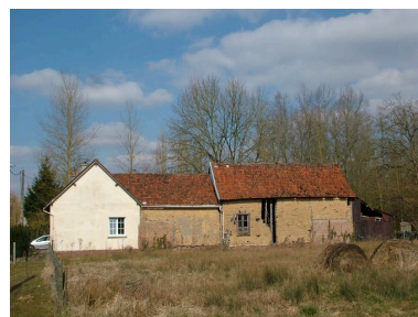
Canaples, ancienne ferme, 183 rue de l'Etroit, présentant des bâtiments d'exploitation en torchis, 1ère moitié du 19e siècle.