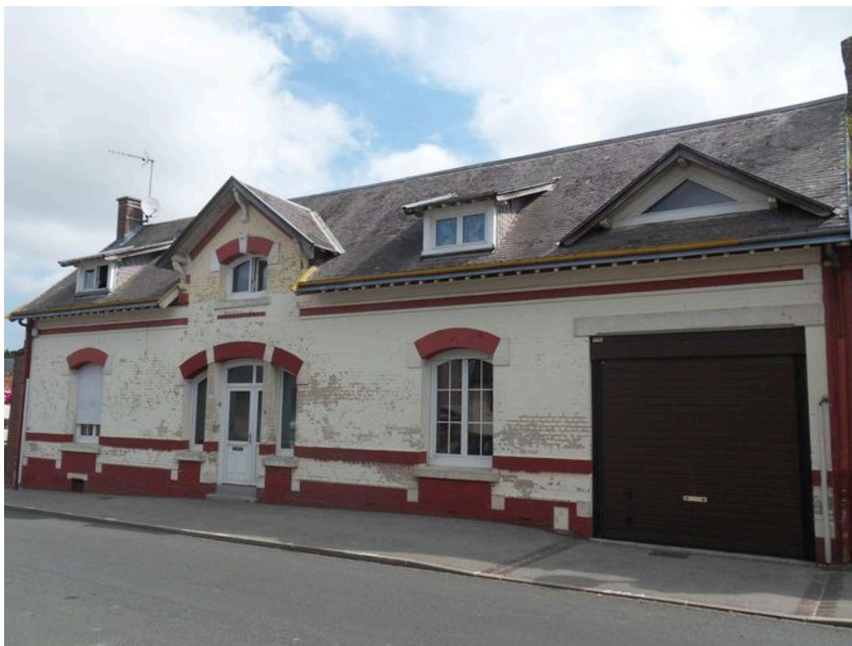
Saint-Ouen, maison, 9 rue Philippe-Louis, reconstruite vers 1838.