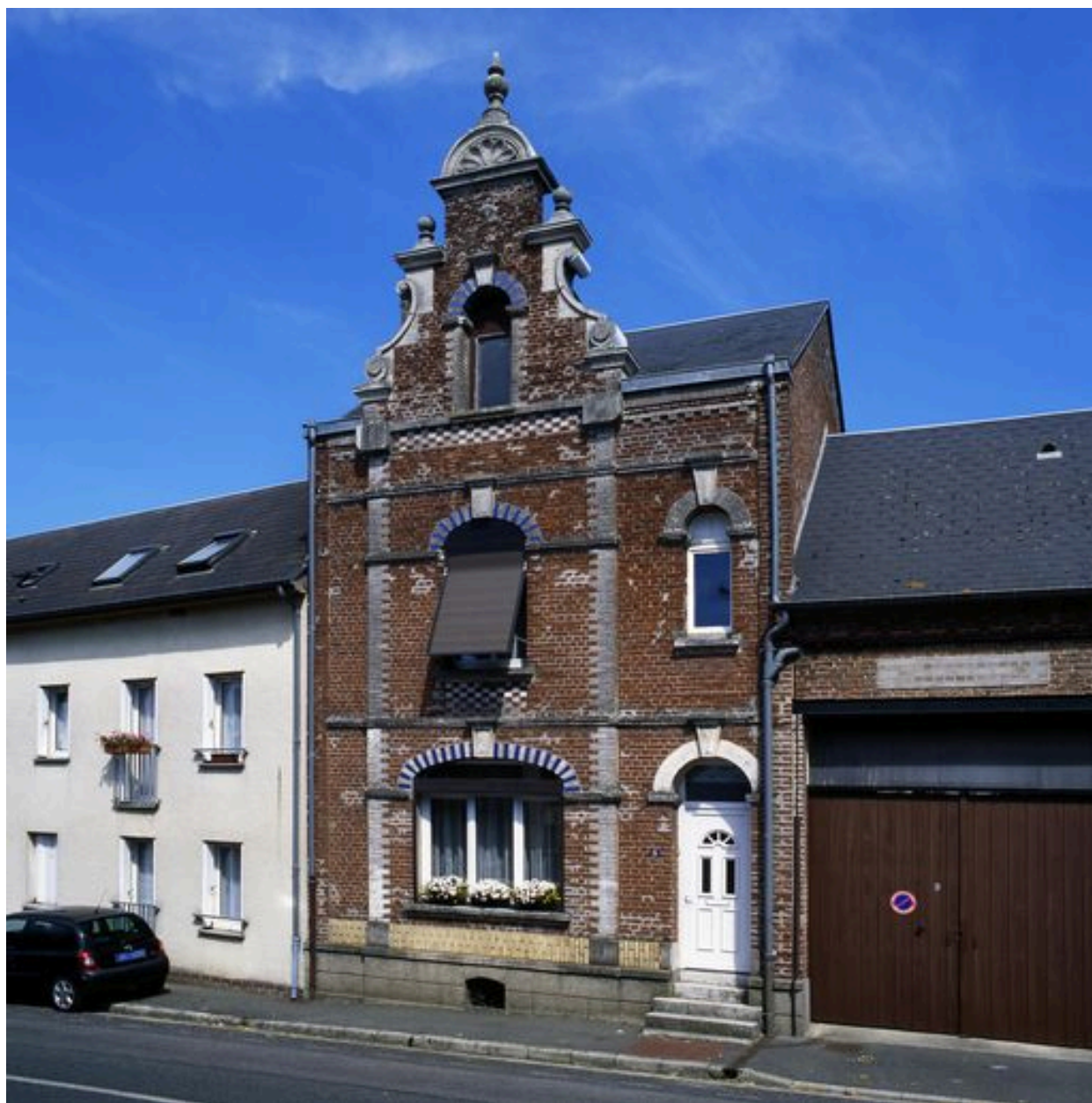
Berteaucourt-les-Dames, maison, 1er quart du 20e siècle.