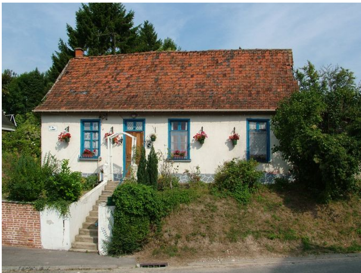
Pernois, maison, 3 rue d'En-Haut, 1ère moitié du 19e siècle.