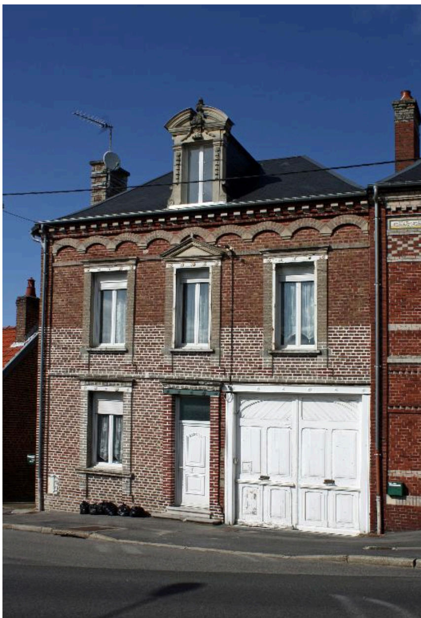
Flixecourt, maison, 11, rue Victor-Hugo, 4e quart du 19e siècle.