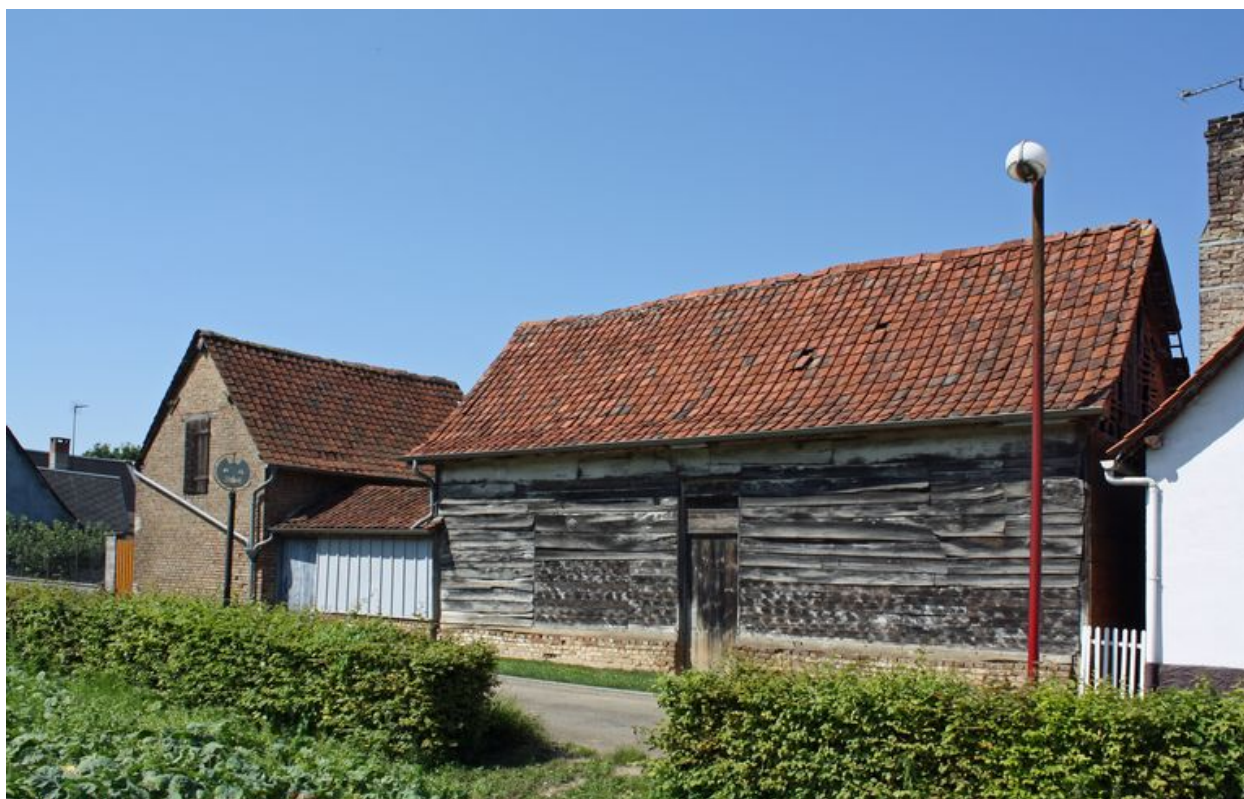
Ville-le-Marclet, ferme, rue de la Voie, début du 19e siècle.