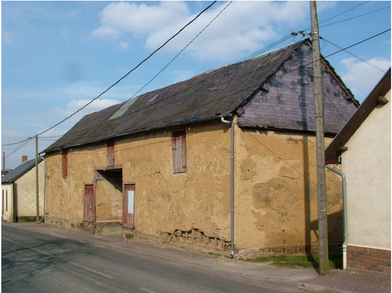
Havernas, grange en torchis de l'ancienne ferme, 5 rue d'Amiens, 19e siècle.