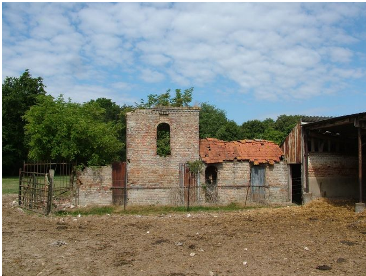
Bettencourt-Saint-Ouen. Vestiges de l'ancienne ferme (n°2) de Bachimond, 4e quart 19e siècle.