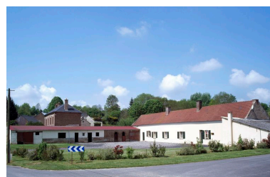
Franqueville, vestiges restaurés de l'ancienne ferme, 33 rue de Berneuil, 2e moitié du 19e siècle. IVR22_20108000157XA