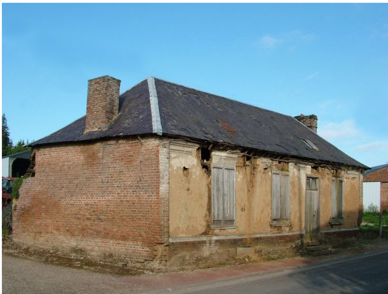
Havernas, ancienne maison en torchis, rue de l'Eglise, 1ère moitié du 19e siècle.