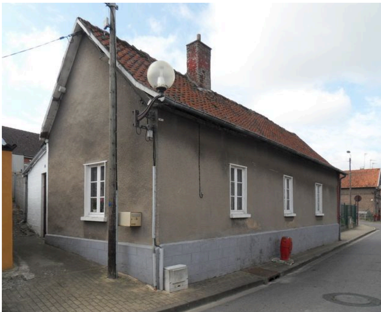
Saint-Ouen, maison, 1 rue Lafayette, construite vers 1886.