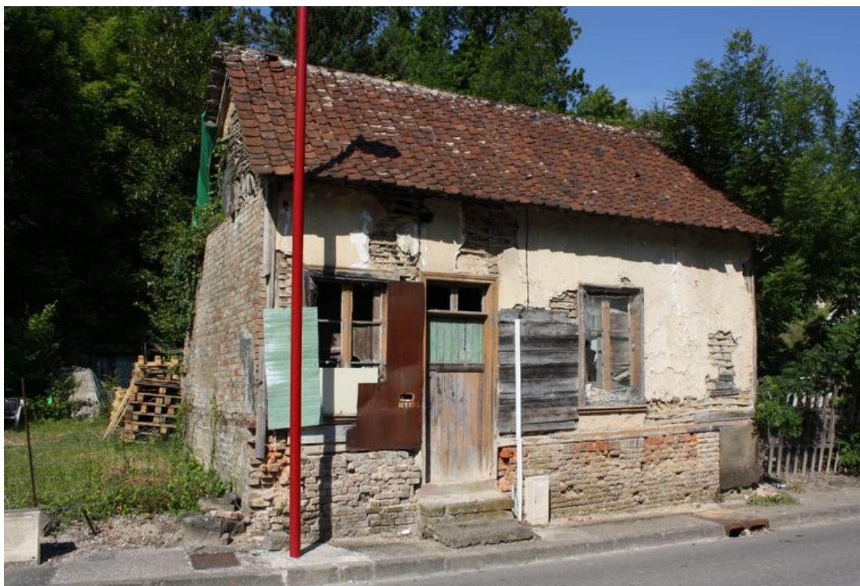
Ville-le-Marclet, maison en pan de bois et torchis, rue Jean-Catelas, milieu du 19e siècle.