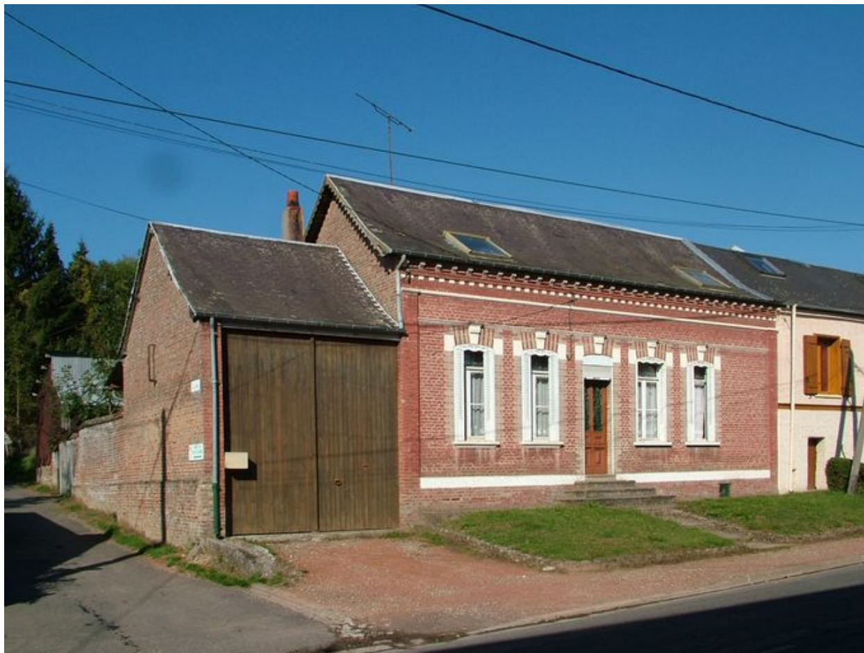
Canaples, maison, 89 rue de Fieffes, dont la façade a été remontée à la fin du 19e ou au début du 20e siècle.