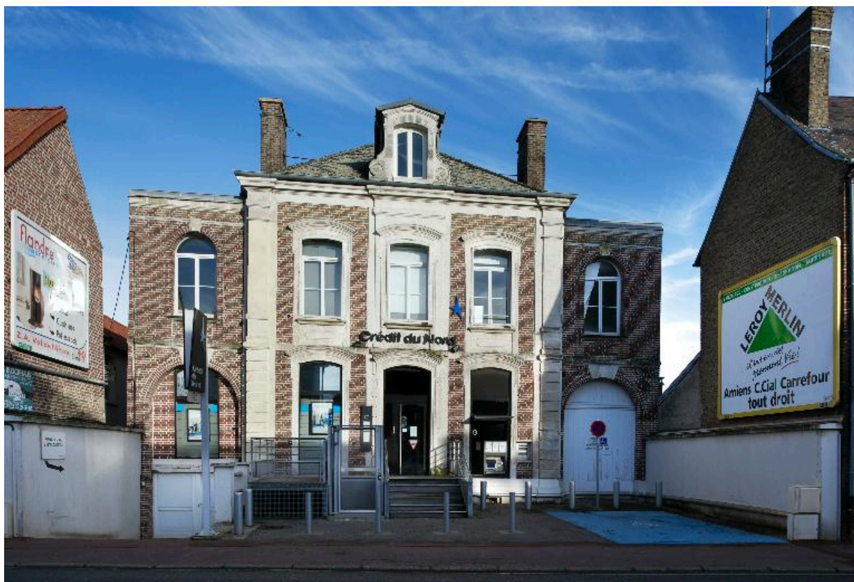
Flixecourt, ancienne maison de notaire, 11, rue Roger-Godard, 4e quart du 19e siècle.