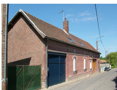
Bettencourt-Saint-Ouen, maison, 7 rue du Marais, présentant la devanture d'un ancien commerce, années 1920-1930. IVR22_20098005225NUCA