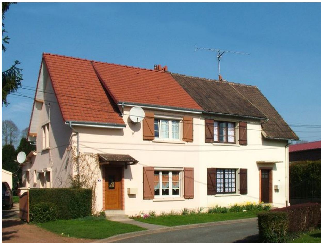
Ribeaucourt, maisons jumelles, 6 et 8 rue de l'Eglise, années 1950.