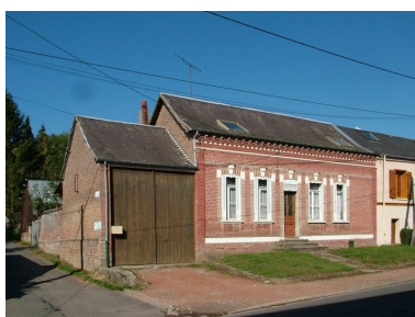
Canaples, maison, 89 rue de Fieffes, dont la façade a été remontée à la fin du 19e ou au début du 20e siècle. IVR22_20098005692NUCA