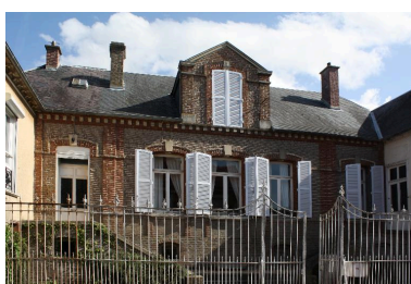
Flixecourt, maison, 25 rue Saint-Pierre, 2e moitié du 19e siècle. IVR22_20138016098NUC2A