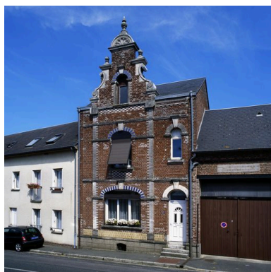
Berteaucourt-les-Dames, maison, 1er quart du 20e siècle. IVR22_20088000145XA