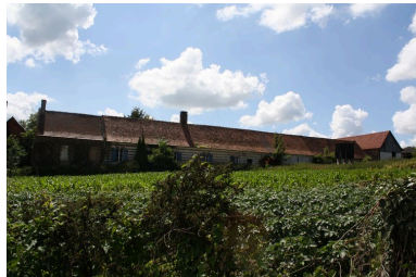
Ville-le-Marcelet, ferme du Bois-Riquier.