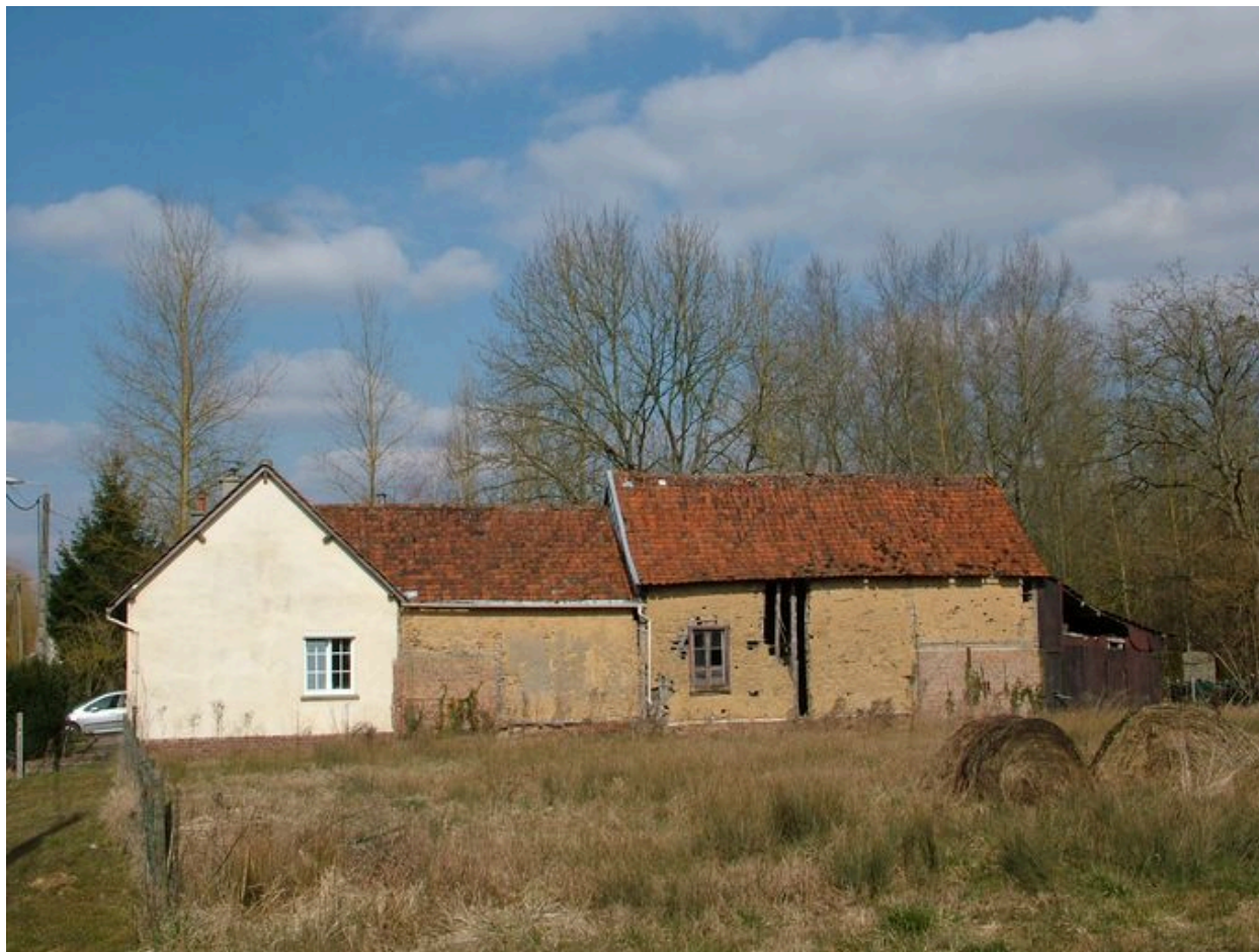
Canaples, ancienne ferme, 183 rue de l'Étroit, présentant des bâtiments d'exploitation en torchis, 1 ère moitié du 19 e siècle.