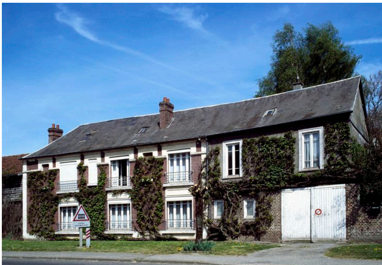
Canaples, maison, 352 rue de Fieffes, 1ère moitié du 20e siècle.