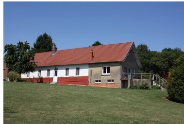
Ville-le-Marcelet, ferme de Rèderie. IVR22_20098005147NUCA