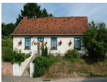
Pernois, maison, 3 rue d'En-Haut, 1ère moitié du 19e siècle. IVR22_20098005416NUCA