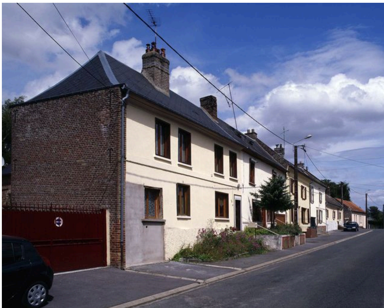
Pernois, alignement de maisons, 115-157 rue de la Ville, dont certaines étaient habitées par des tisserands au milieu du 19e siècle.