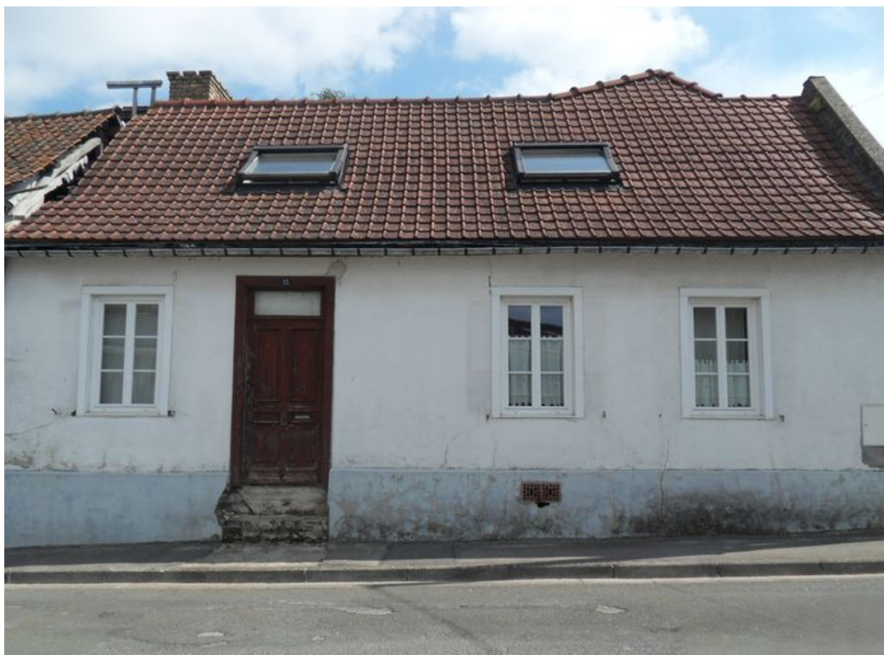
Saint-Ouen, ancienne ferme, 15 rue de Vignacourt, 1ère moitié du 19e siècle.