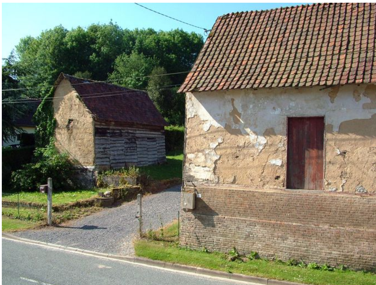
Franqueville, anciens bâtiments de ferme, 11 rue Principale, 2e moitié du 19e siècle.