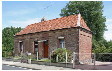
Ville-le-Marcelet, maison, 46 rue Georges-Outrebon, limite 19e siècle 20e siècle. IVR22_20098005144NUCA