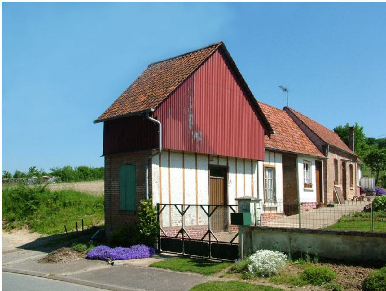
Franqueville, ancienne ferme, 37 rue de Berneuil, 2e moitié du 19e siècle, ayant perdu sa grange et son passage charretier sur rue.