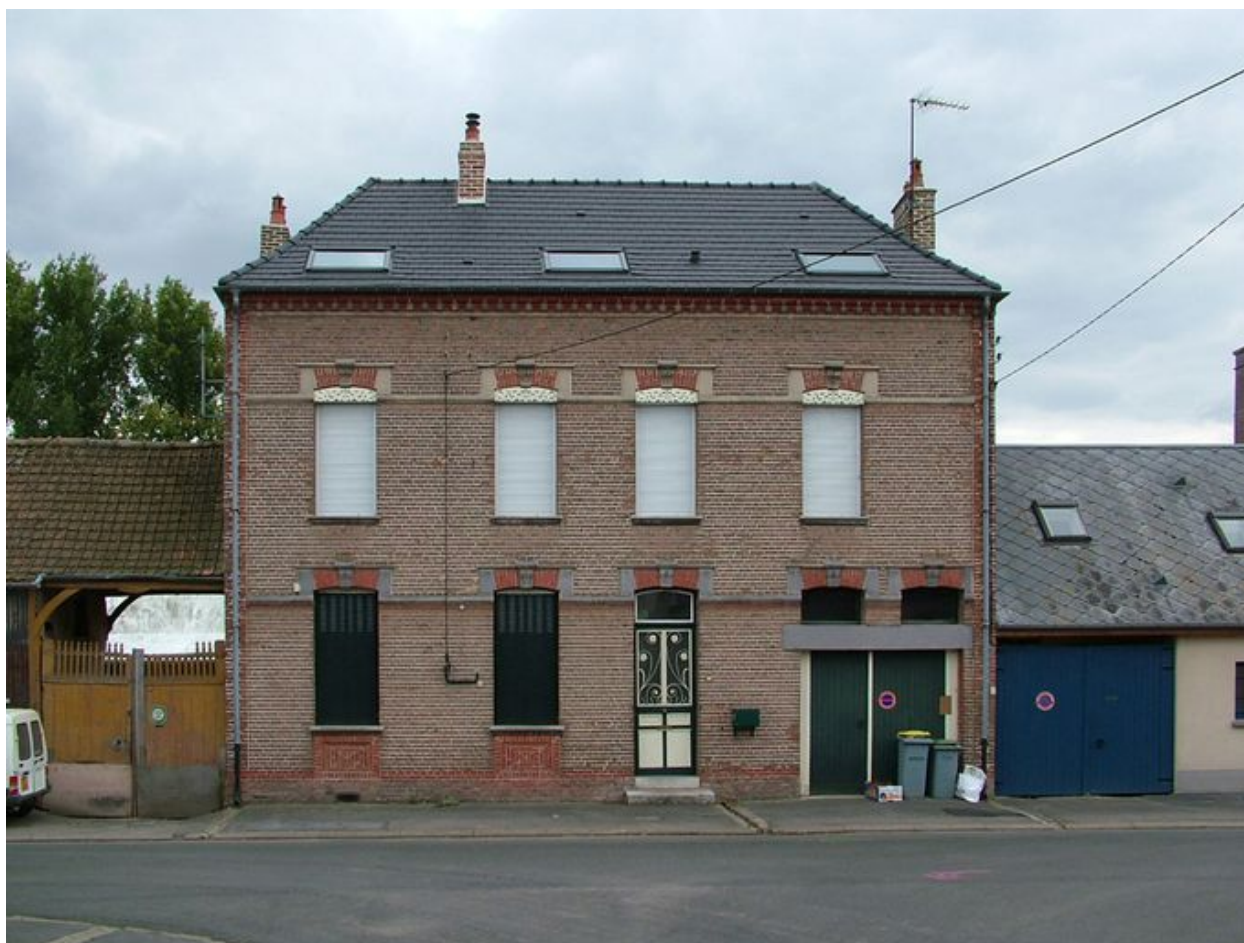
Pernois, maison, 166 rue de la Ville, 2e quart du 20e siècle.