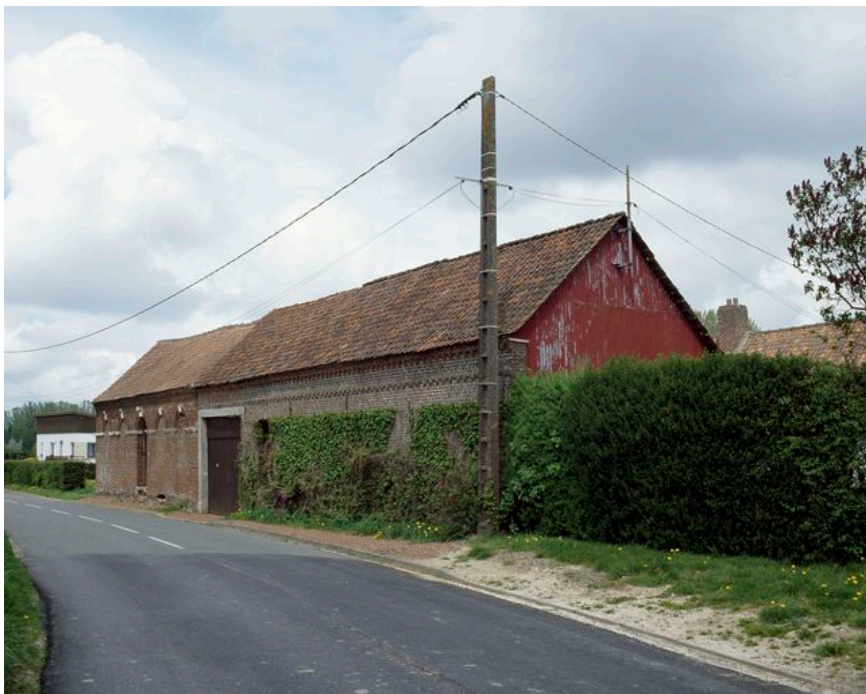
Ribeaucourt, hameau de Barlette, ferme, 31 rue de Domart, 2e moitié du 19e siècle.