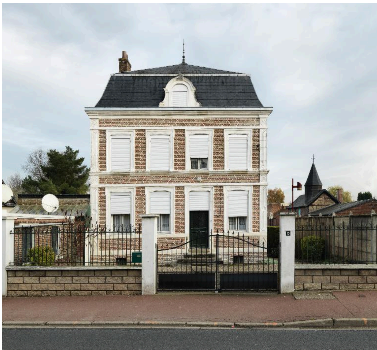
Flixecourt, maison de maître, 33 rue Roger-Godard, 2e moitié du 20e siècle.