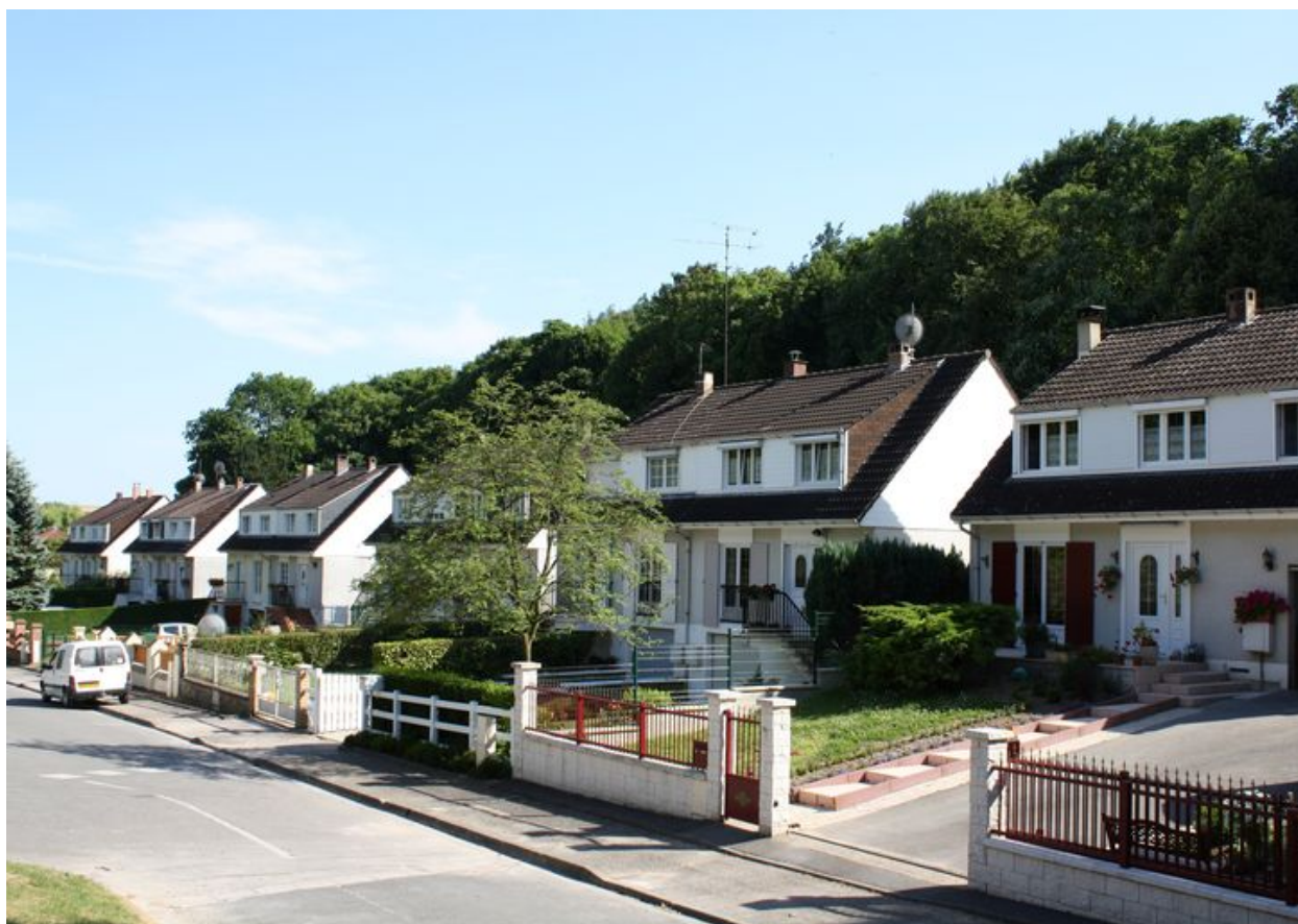
Ville-le-Marcelet, lotissement Olympia , rue Jean-Catelas, 1975.