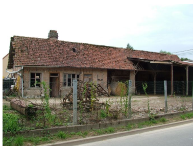
Bouchon, ancienne ferme, 14 rue de Mouflers, 1ère moitié du 19e siècle. IVR22_20098005257NUCA