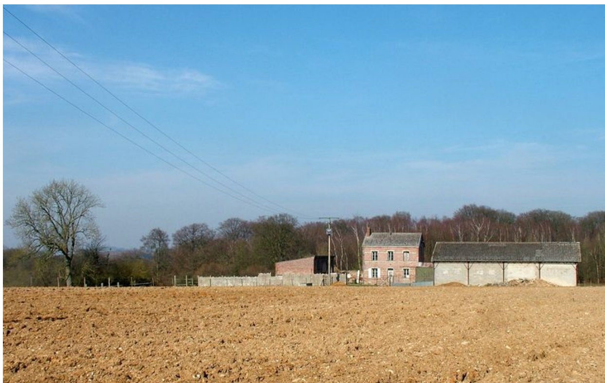
Bettencourt-Saint-Ouen. Ancienne ferme de Bachimond (n°1), 1er quart 20e siècle.