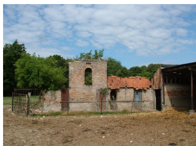
Bettencourt-Saint-Ouen. Vestiges de l'ancienne ferme (n°2) de Bachimond, 4e quart 19e siècle.