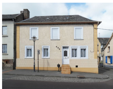
Saint-Ouen, maison, 9 rue de la République, reconstruite vers 1855.