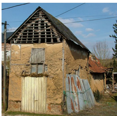
Havernas, ancienne ferme en torchis, rue de l'Eglise, 1ère moitié du 19e siècle. IVR22_20108001097NUCA