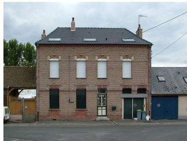
Pernois, maison, 166 rue de la Ville, 2e quart du 20e siècle. IVR22_20098005409NUCA