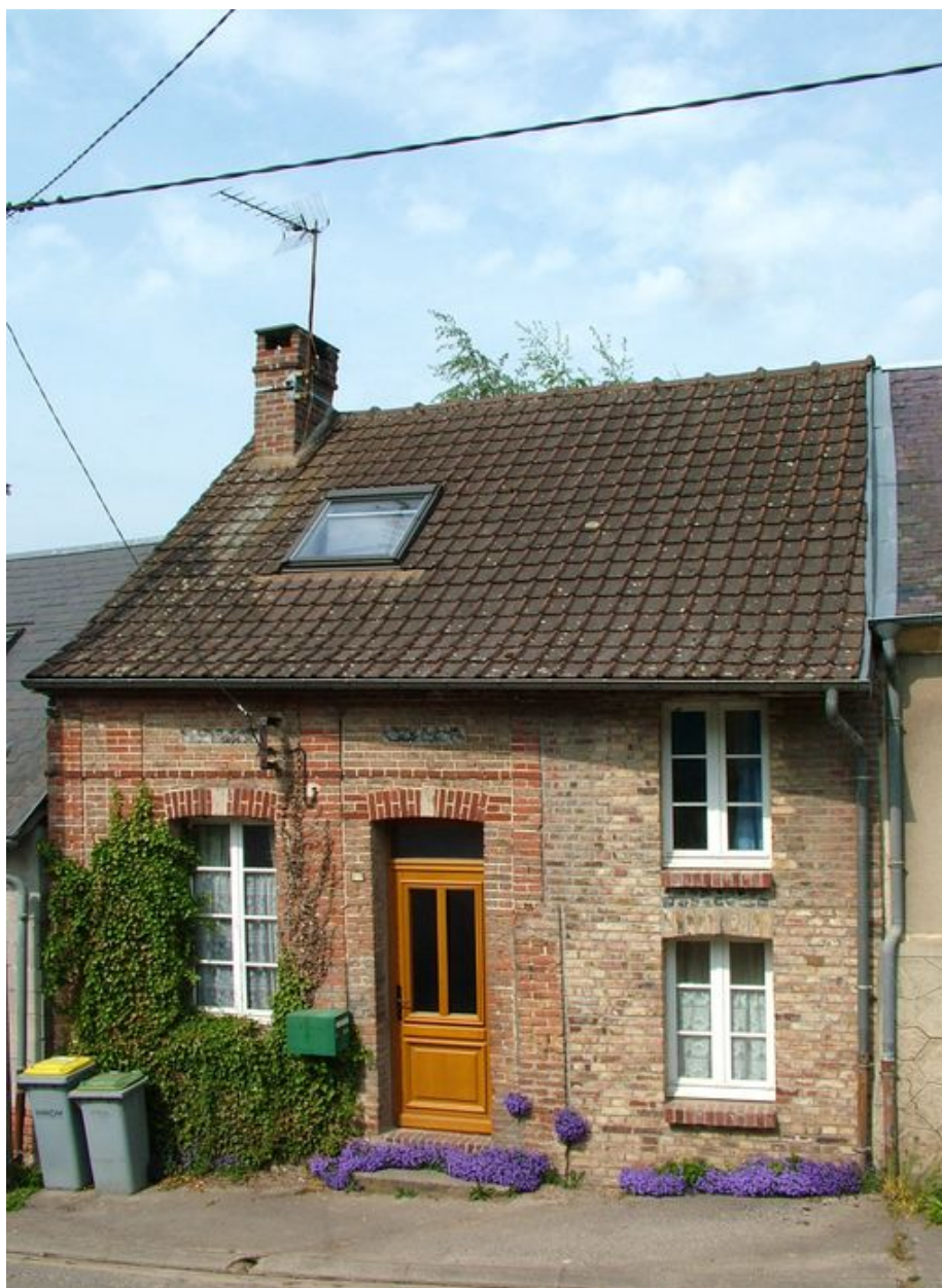
Canaples, maison, 117 rue de l'Eglise, 2e moitié du 19e siècle.