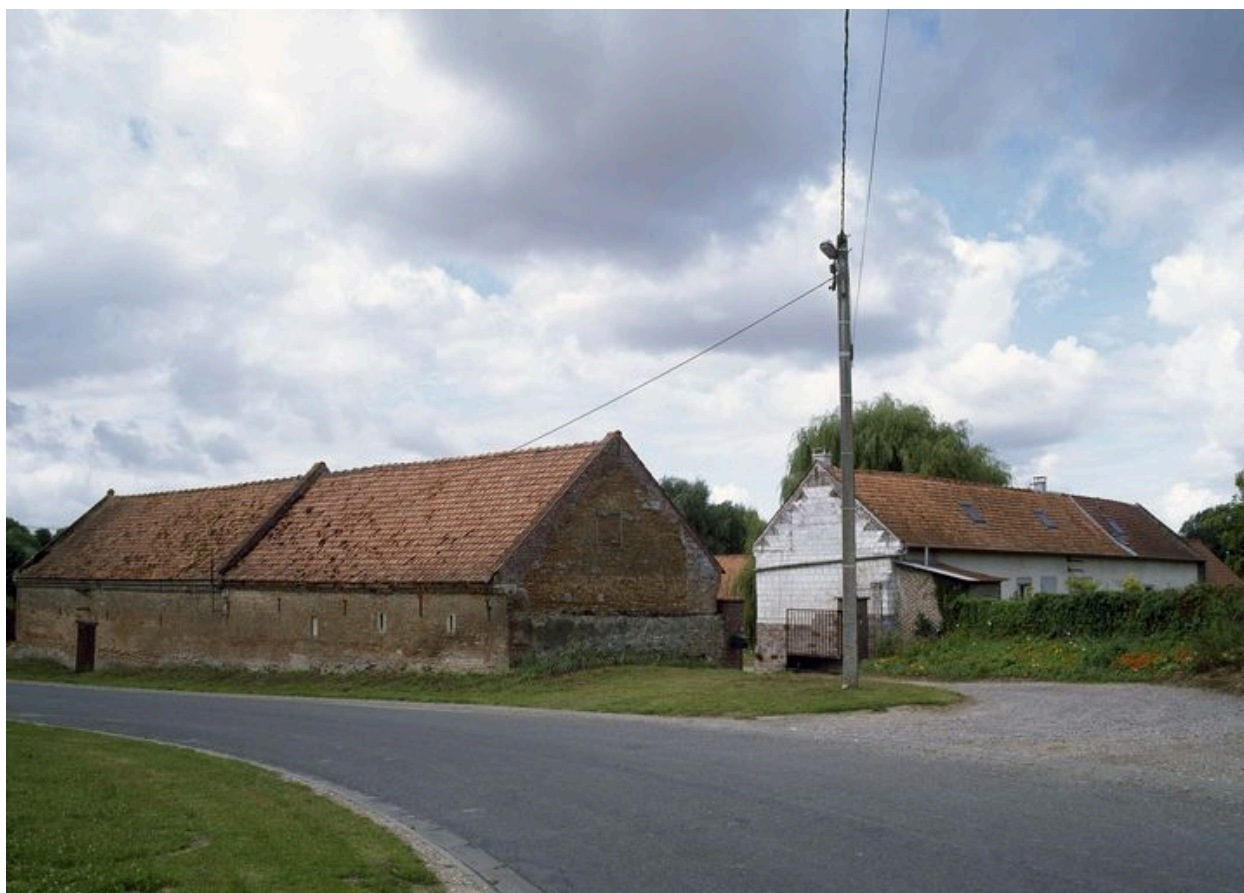
Pernois, ferme de Bélette, 18e et 19e siècles.