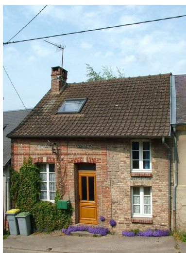
Canaples, maison, 117 rue de l'Eglise, 2e moitié du 19e siècle. IVR22_20108001350NUCA