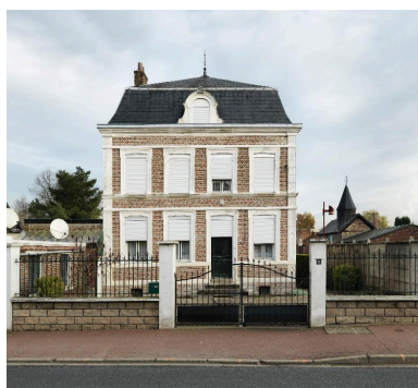
Flixecourt, maison de maître, 33 rue Roger-Godard, 2e moitié du 20e siècle.