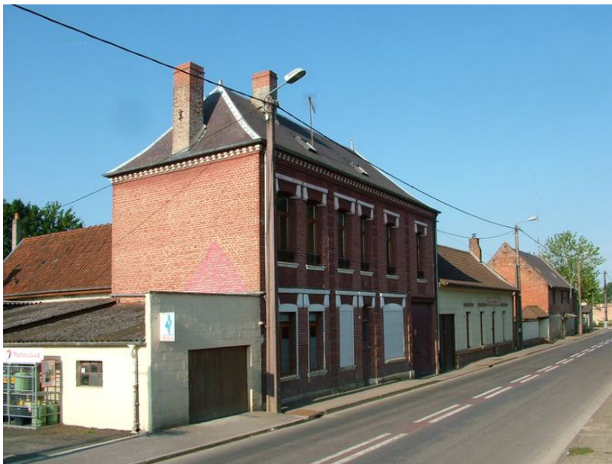
Pernois, ancienne boucherie et ancien café, 469 et 487 rue du Général-Leclerc, 2e moitié du 19e siècle.