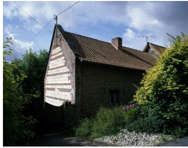
Pernois, pignon du logis de ferme, 322 rue d'En-Haut, portant la date de 1847. IVR22_20098000252XA