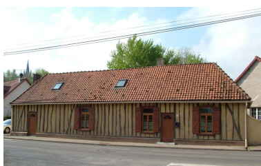
Havernas, ancienne auberge, 21 rue de la Carrière, 19e siècle. IVR22_20108001343NUCA