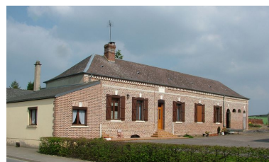
Bettencourt-Saint-Ouen, ferme, 1 rue de Vignacourt, portant la date : 1880. IVR22_20098005222NUCA