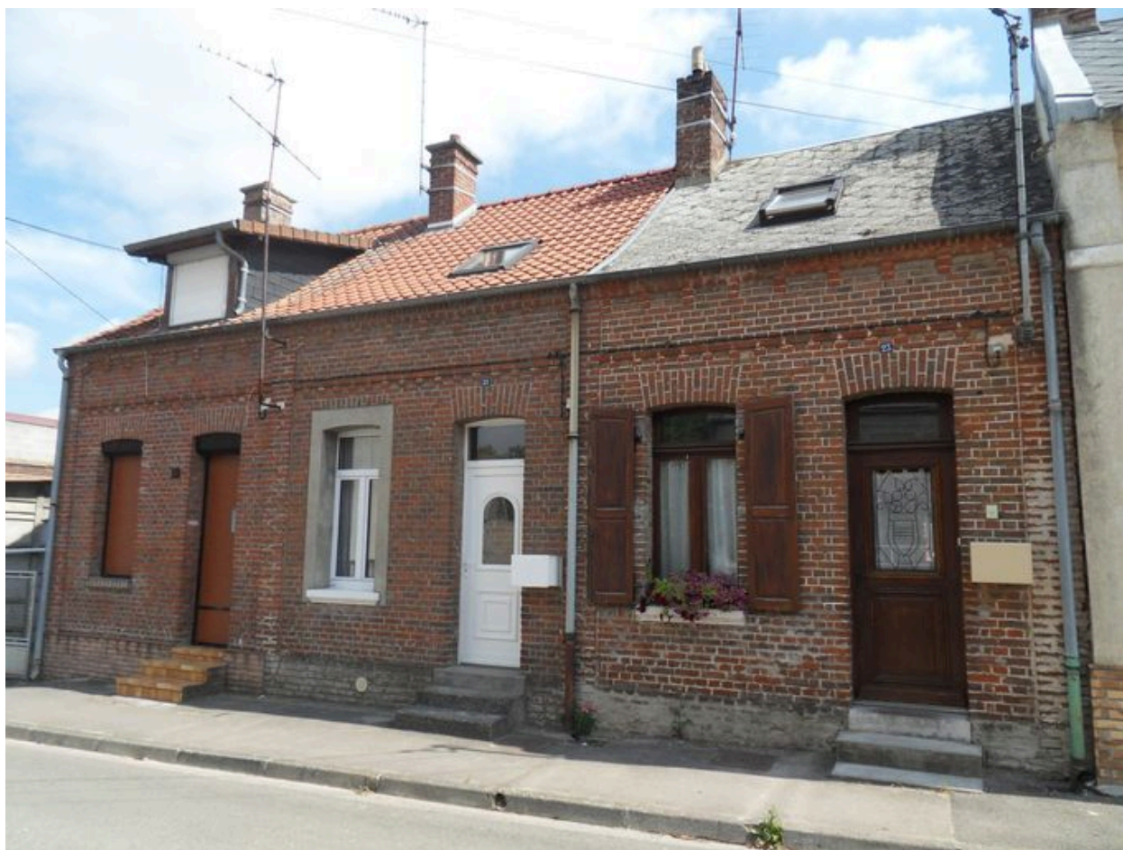
Saint-Ouen, maison à trois unités d'habitation, 19 à 23 rue de Vignacourt, 4e quart du 19e siècle.