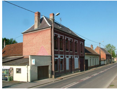
Pernois, ancienne boucherie et ancien café, 469 et 487 rue du Général-Leclerc, 2e moitié du 19e siècle.