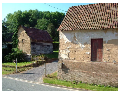
Franqueville, anciens bâtiments de ferme, 11 rue Principale, 2e moitié du 19e siècle. IVR22_20108001797NUCA