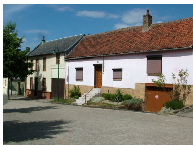
Bettencourt-Saint-Ouen, maisons, 29 et 31 rue Principale, 19e siècle.