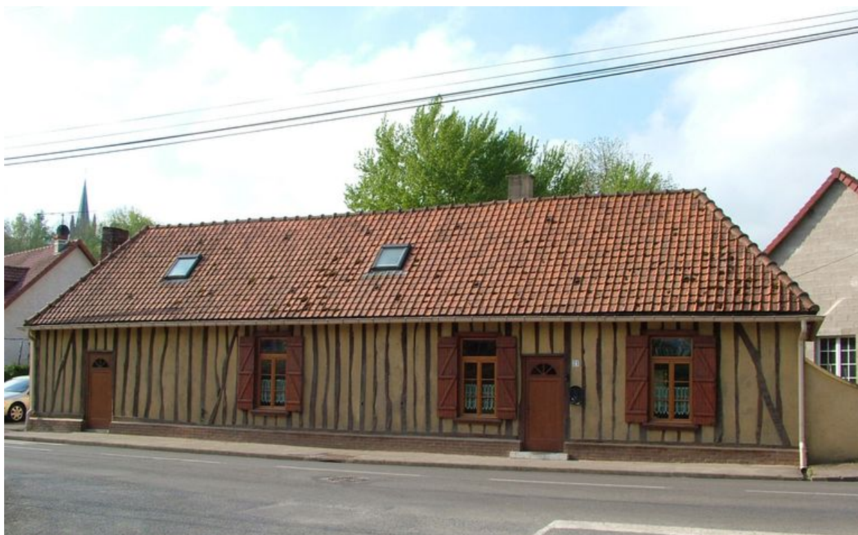
Havernas, ancienne auberge, 21 rue de la Carrière, 19e siècle.