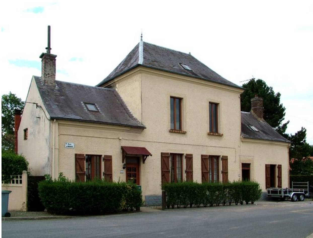
Pernois, ancien café de la Place, 11-21 rue du Marais, 4e quart du 19e siècle.