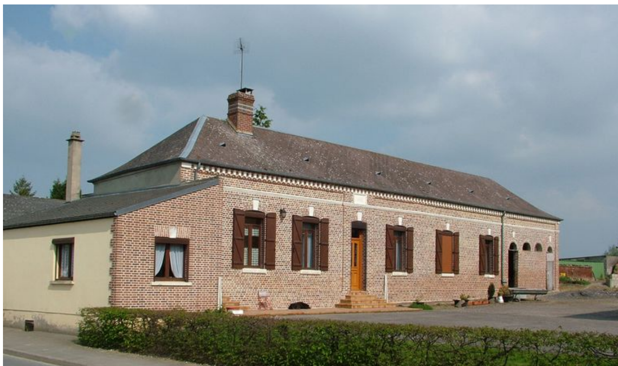
Bettencourt-Saint-Ouen, ferme, 1 rue de Vignacourt, portant la date : 1880.