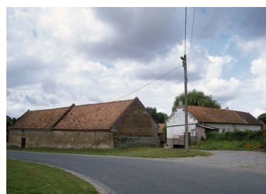
Pernois, ferme de Bélette, 18e et 19e siècles. IVR22_20098000240XA