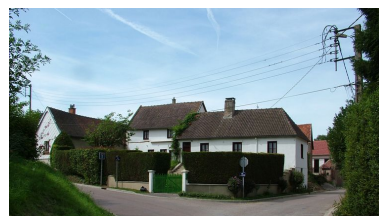
Bouchon, ancienne ferme, 1 rue de Long, 1ère moitié du 19e siècle.