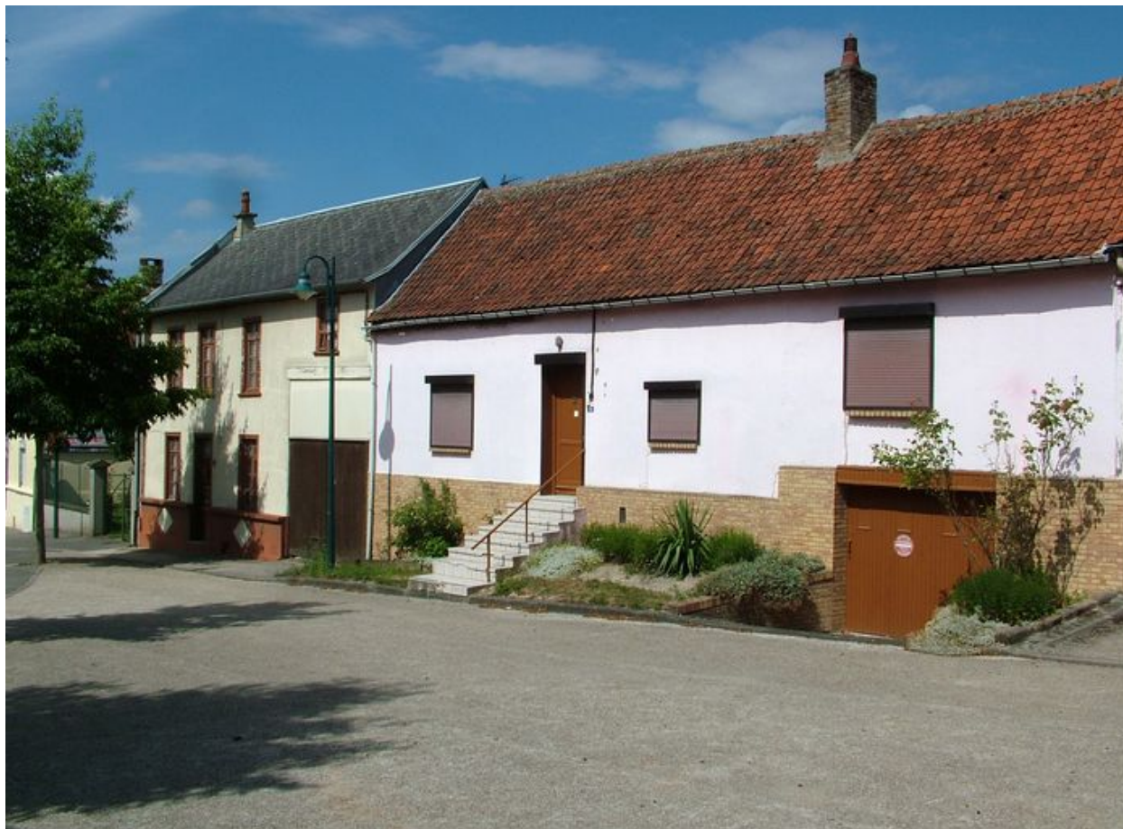
Bettencourt-Saint-Ouen, maisons, 29 et 31 rue Principale, 19e siècle.