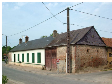
Canaples, ferme, 51 rue de l'Eglise, première moitié du 19e siècle.