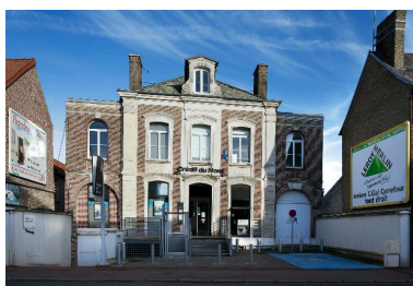
Flixecourt, ancienne maison de notaire, 11, rue Roger- Godard, 4e quart du 19e siècle. IVR22_20138000543NUC2A