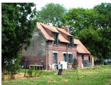
Fransu, maison forestière dite Maison Rouge, en lisière de la forêt de Ribeaucourt, 2e quart du 20e siècle. IVR22_20108001903NUCA