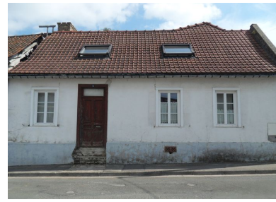
Saint-Ouen, ancienne ferme, 15 rue de Vignacourt, 1ère moitié du 19e siècle. IVR22_20108001554NUCA