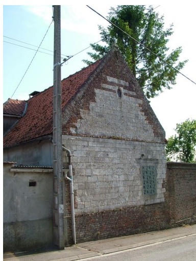
Pernois, pignon de l'ancien presbytère, 82 rue d'En-Haut, 18e siècle.