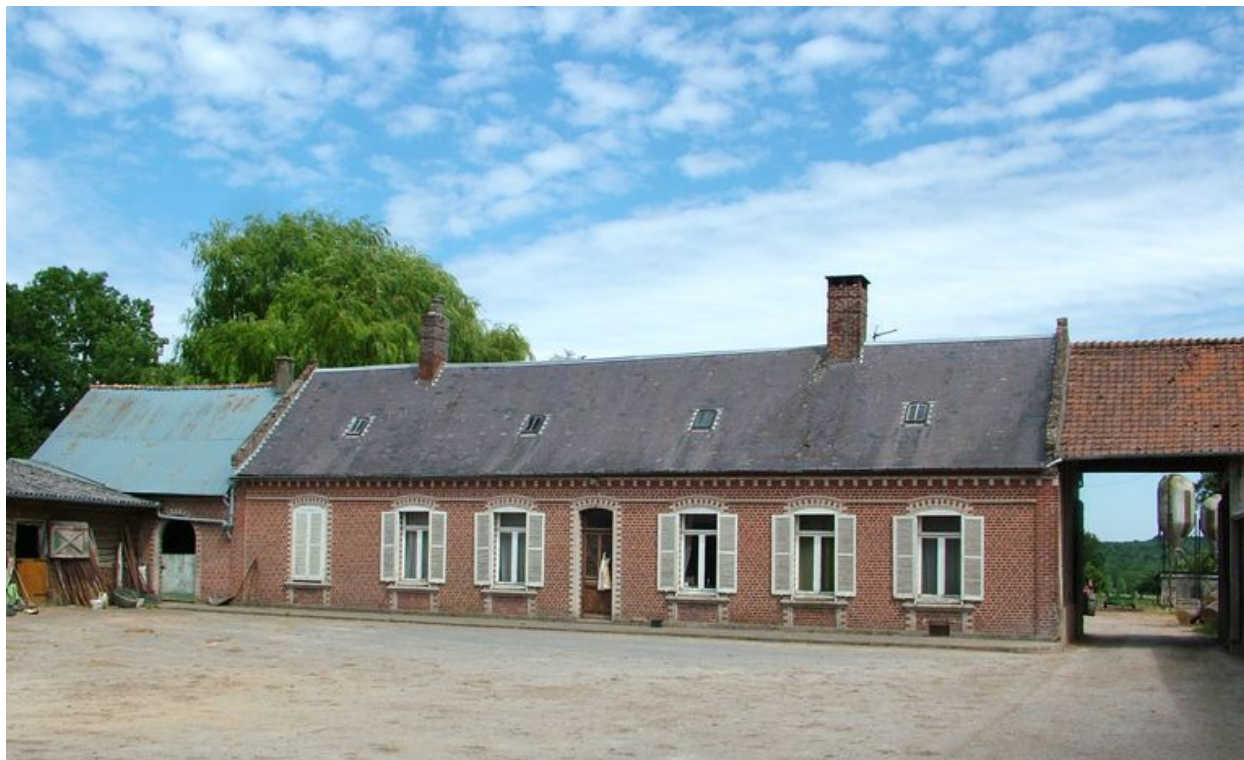
Fransu, logis de ferme, 10 Grande-Rue, portant la date de 1792 mais reconstruit au milieu du 19e siècle.