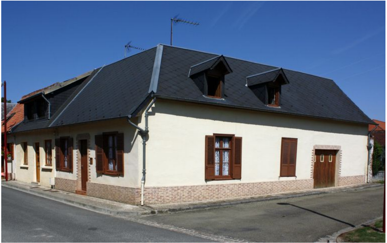
Ville-le-Marlet, ferme, 3 rue Gambetta, début du 19e siècle.