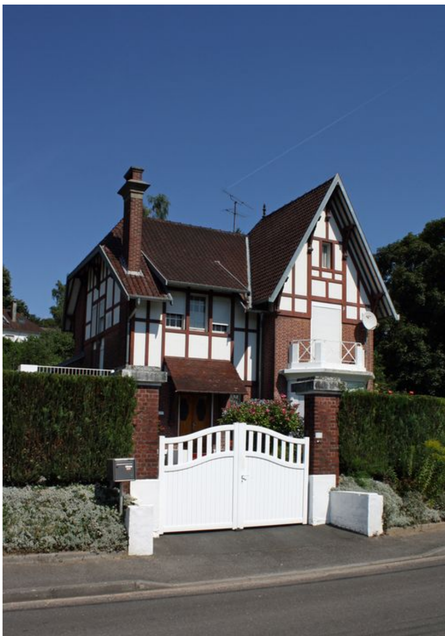
Ville-le-Marlet, maison de style régionaliste, 30 rue Marius-Sire, années 1930.