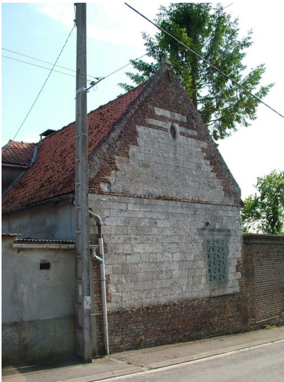
Pernois, pignon de l'ancien presbytère, 82 rue d'En-Haut, 18e siècle.