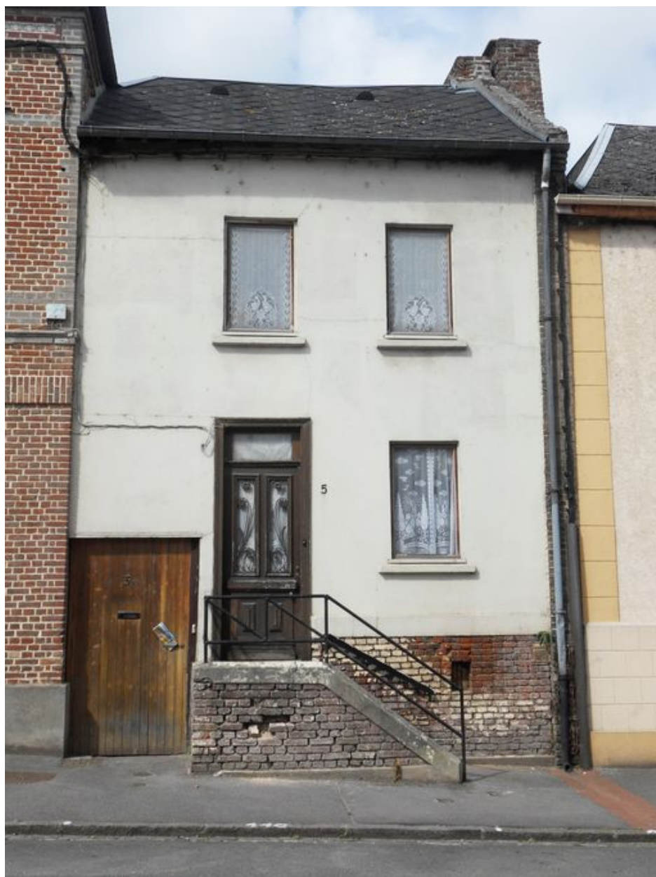
Saint-Ouen, maison, 5 rue de la République, reconstruite vers 1838.