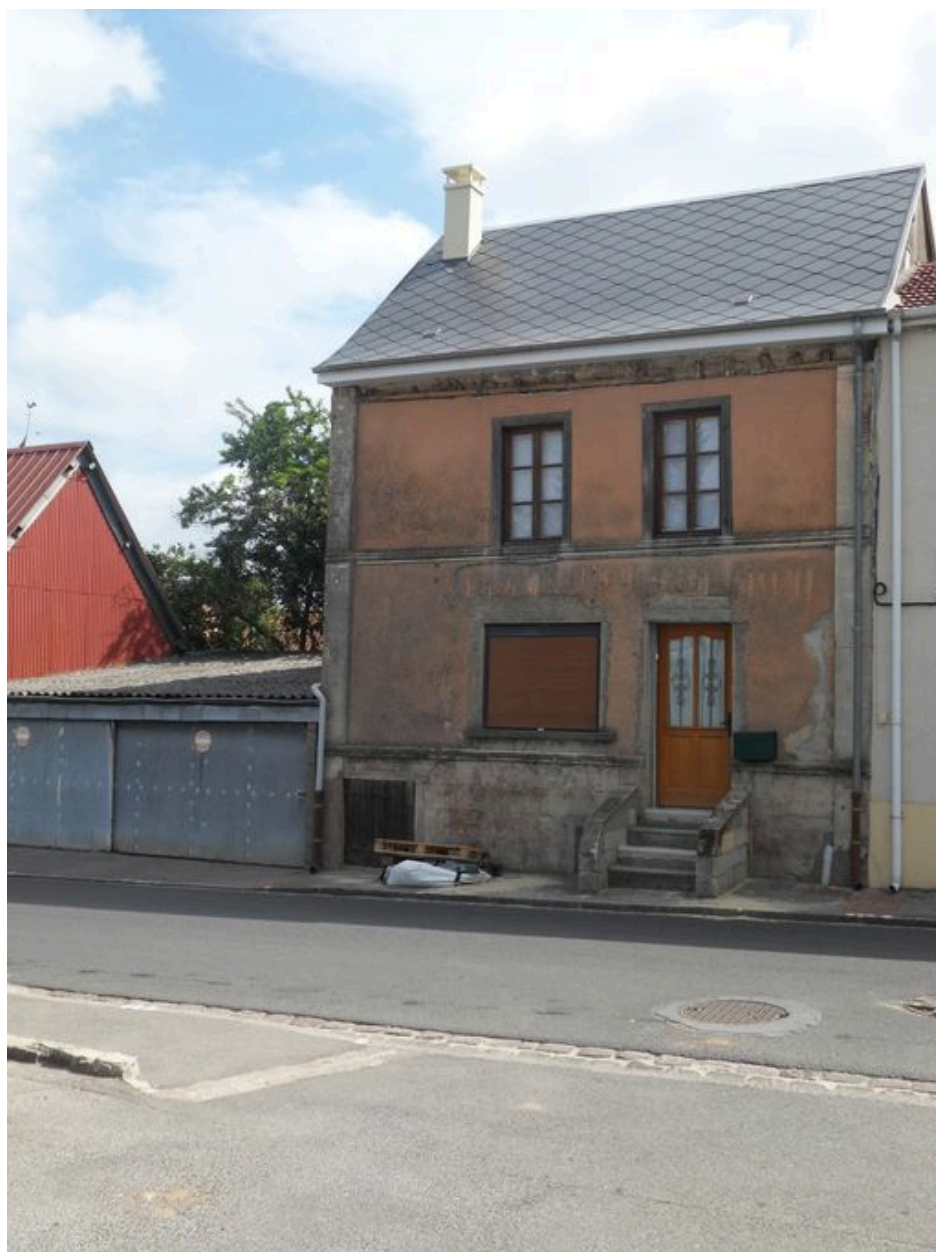
Saint-Ouen, maison, 3 rue Philippe-Louis, construite vers 1862.