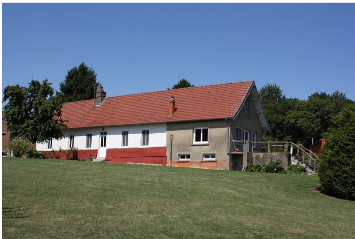
Ville-le-Marcelet, ferme de Rèderie.