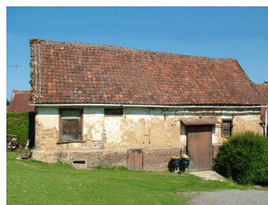
Franqueville, étable de l'ancienne ferme, 13 rue Principale, 2e moitié du 19e siècle. IVR22_20108001796NUCA