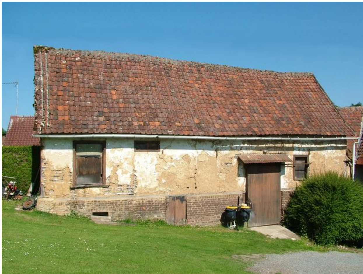
Franqueville, étable de l'ancienne ferme, 13 rue Principale, 2e moitié du 19e siècle.