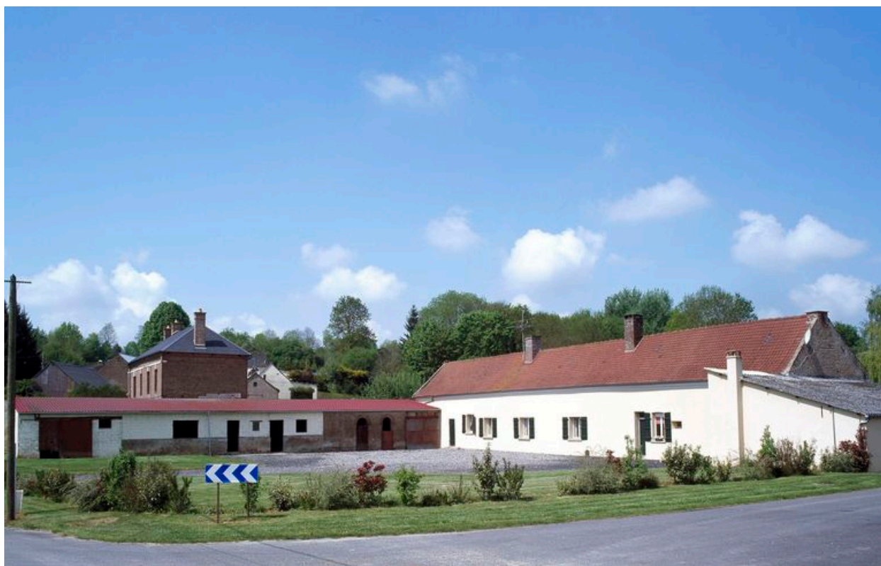
Franqueville, vestiges restaurés de l'ancienne ferme, 33 rue de Berneuil, 2e moitié du 19e siècle.