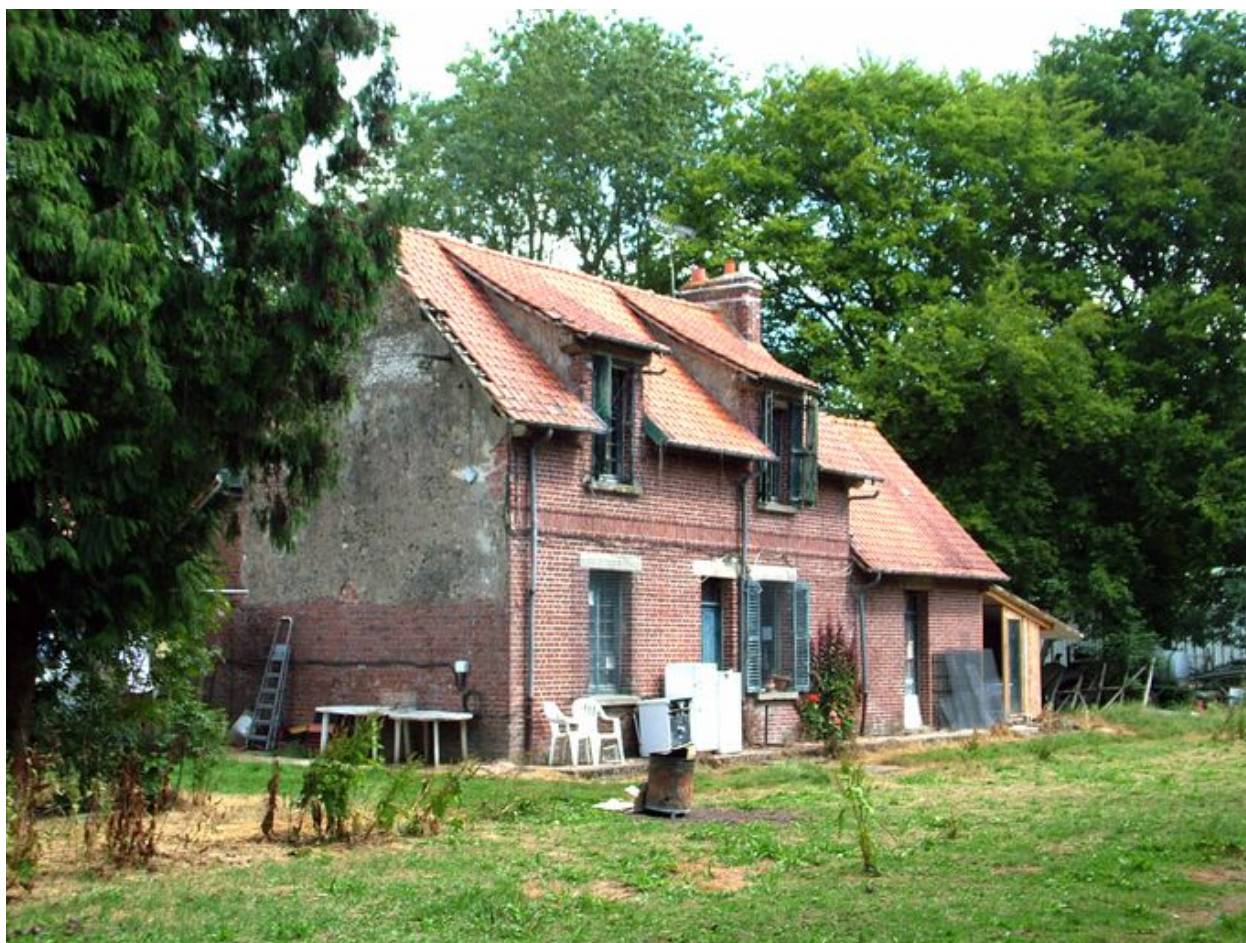
Fransu, maison forestière dite Maison Rouge, en lisière de la forêt de Ribeaucourt, 2e quart du 20e siècle.