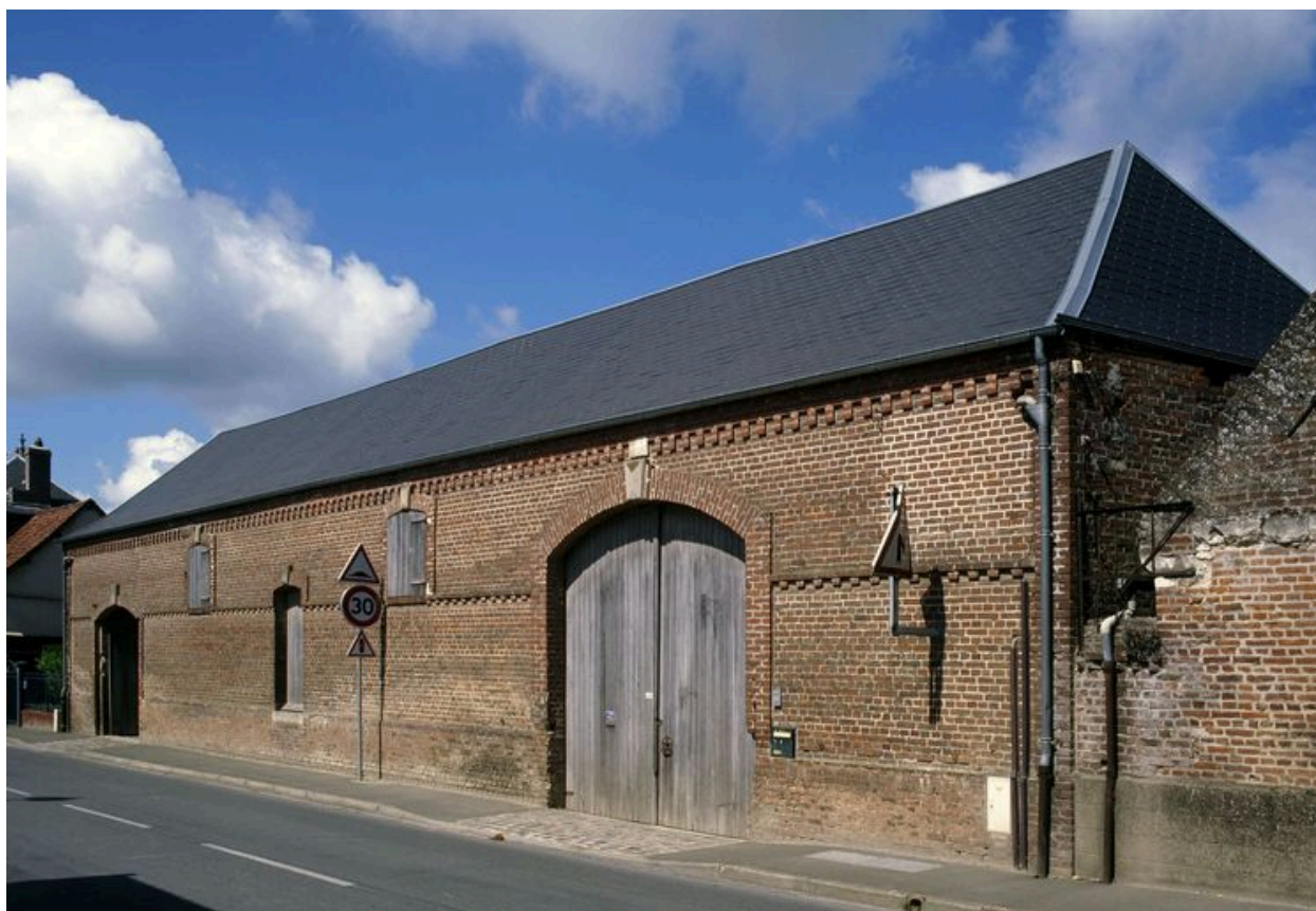
Bettencourt-Saint-Ouen, ferme, 47 rue Principale, portant la date et le nom : 1897 LECAT.