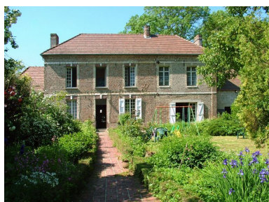
Franqueville, maison, 29 rue Principale, 2e moitié du 19e siècle. IVR22_20108001793NUCA