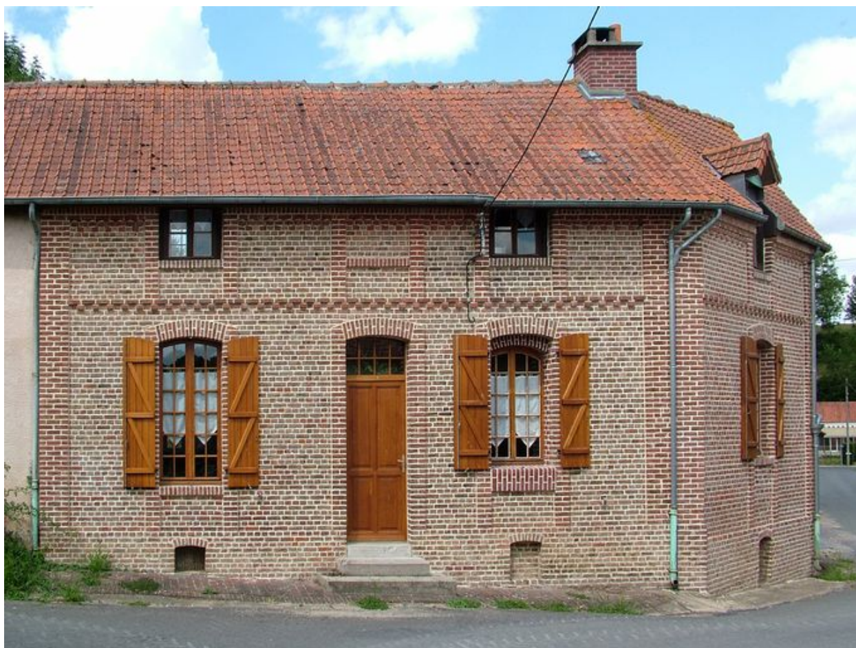
Bouchon, logis de l'ancienne ferme, 1 Grande-Rue, fin du 19 e siècle.