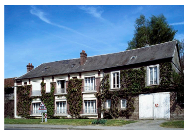
Canaples, maison, 352 rue de Fieffes, 1ère moitié du 20e siècle. IVR22_20098000217XA