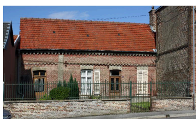
Flixecourt, maison, 5 rue Malakoff, portant la date de 1865. IVR22_20138016099NUC2A