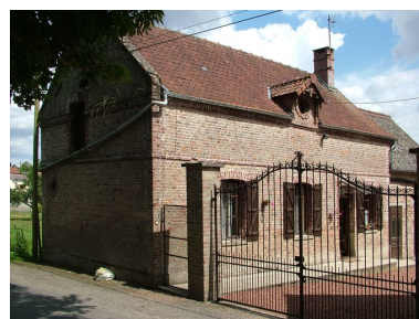
Bouchon, logis de la ferme, 10 rue de L'Etoile, limite 19e siècle 20e siècle.