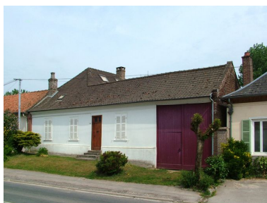
Canaples, ancienne ferme, 106 rue de Fieffes, première moitié du 19e siècle.