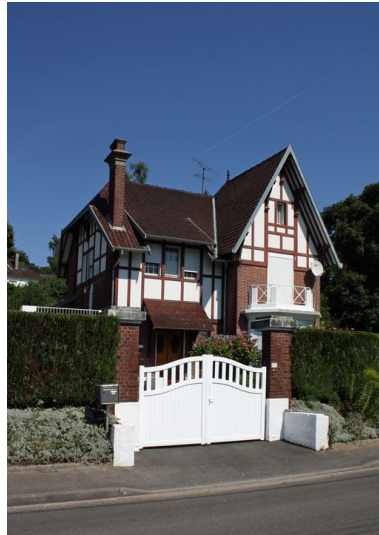
Ville-le-Marcelet, maison de style régionaliste, 30 rue Marius-Sire, années 1930. IVR22_20098005158NUCA