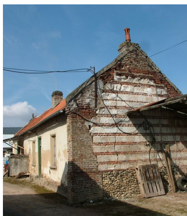
Havernas, pignon en brique et pierre d'un ancien logis de ferme, impasse Gaston-Moutardier, début du 19e siècle.