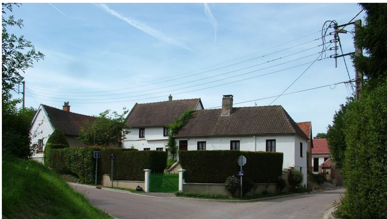
Bouchon, ancienne ferme, 1 rue de Long, 1ère moitié du 19e siècle.