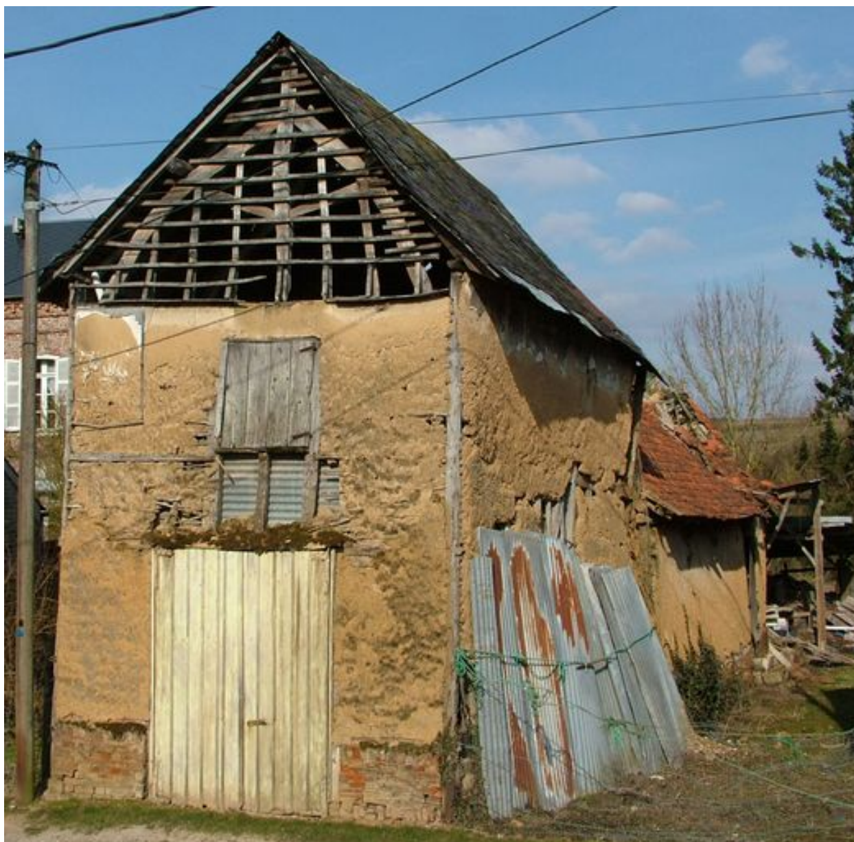
Havernas, ancienne ferme en torchis, rue de l'Eglise, 1ère moitié du 19e siècle.