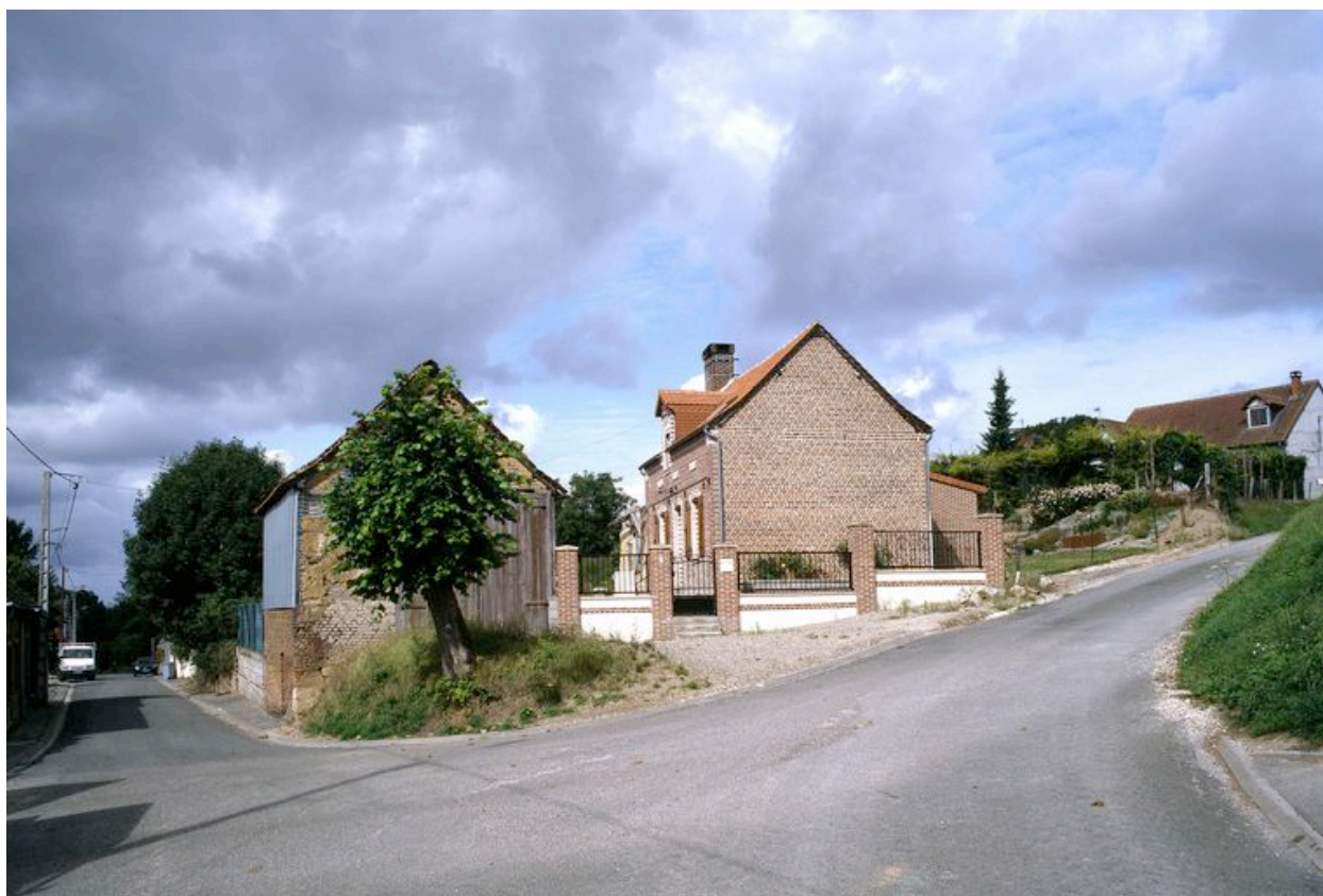
Pernois, ancienne ferme, 7 rue de la Croix, 2e moitié 19e siècle et 1ère moitié 20e siècle.