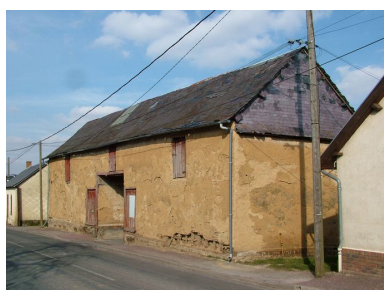
Havernas, grange en torchis de l'ancienne ferme, 5 rue d'Amiens, 19e siècle.