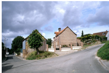
Pernois, ancienne ferme, 7 rue de la Croix, 2e moitié 19e siècle et 1ère moitié 20e siècle. IVR22_20098000256XA