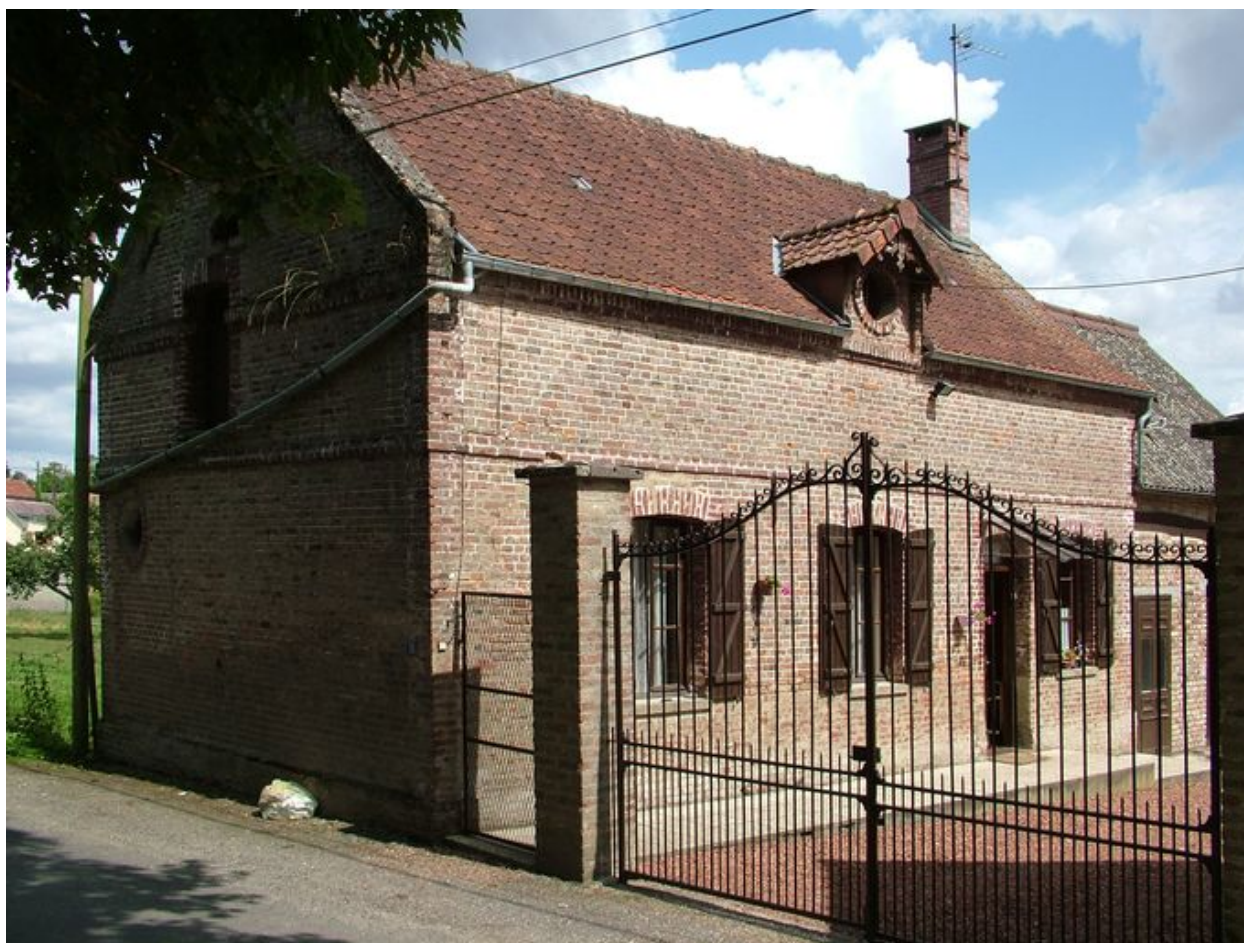
Bouchon, logis de la ferme, 10 rue de L'Etoile, limite 19e siècle 20e siècle.