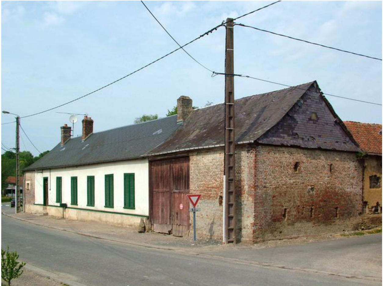
Canaples, ferme, 51 rue de l'Eglise, première moitié du 19e siècle.