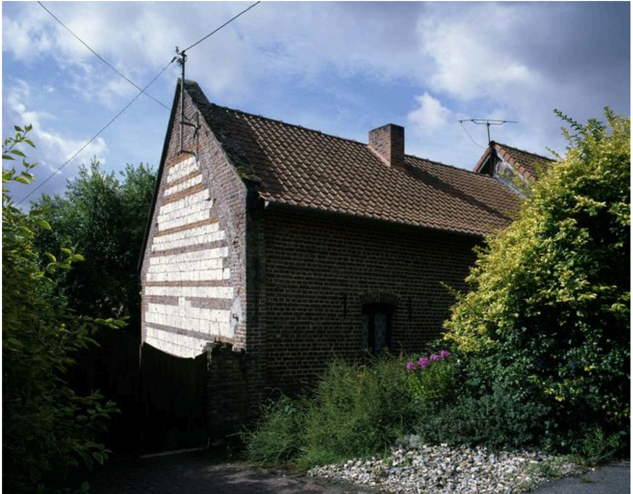
Pernois, pignon du logis de ferme, 322 rue d'En-Haut, portant la date de 1847.