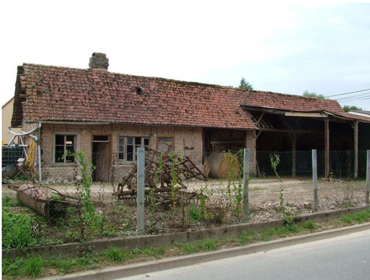
Bouchon, ancienne ferme, 14 rue de Mouflers, 1ère moitié du 19e siècle.