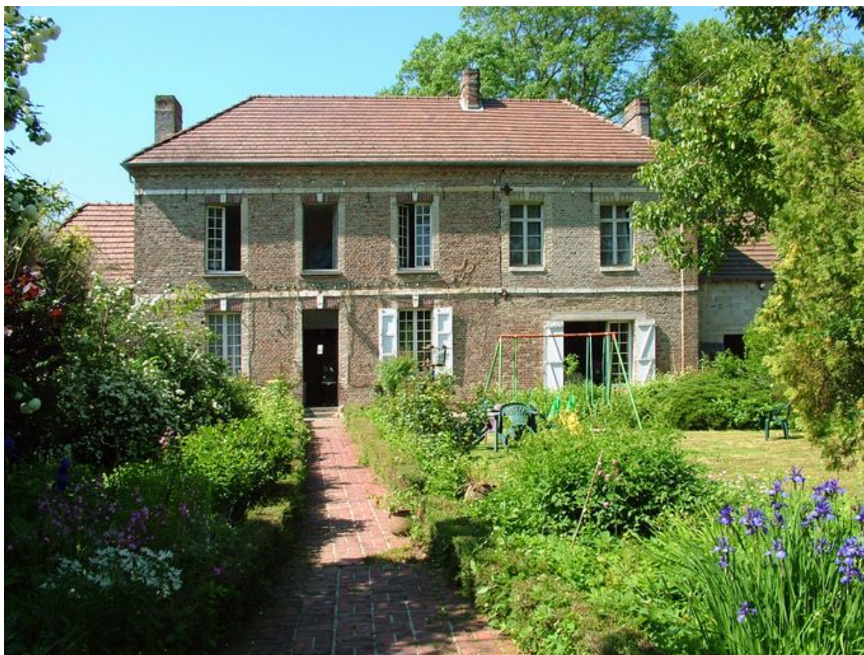
Franqueville, maison, 29 rue Principale, 2e moitié du 19e siècle.