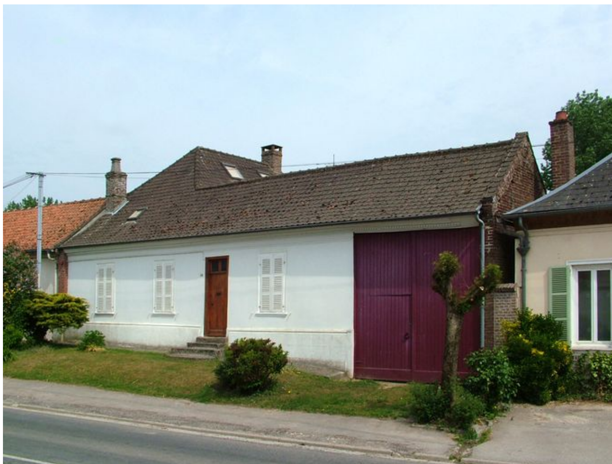
Canaples, ancienne ferme, 106 rue de Fieffes, première moitié du 19e siècle.