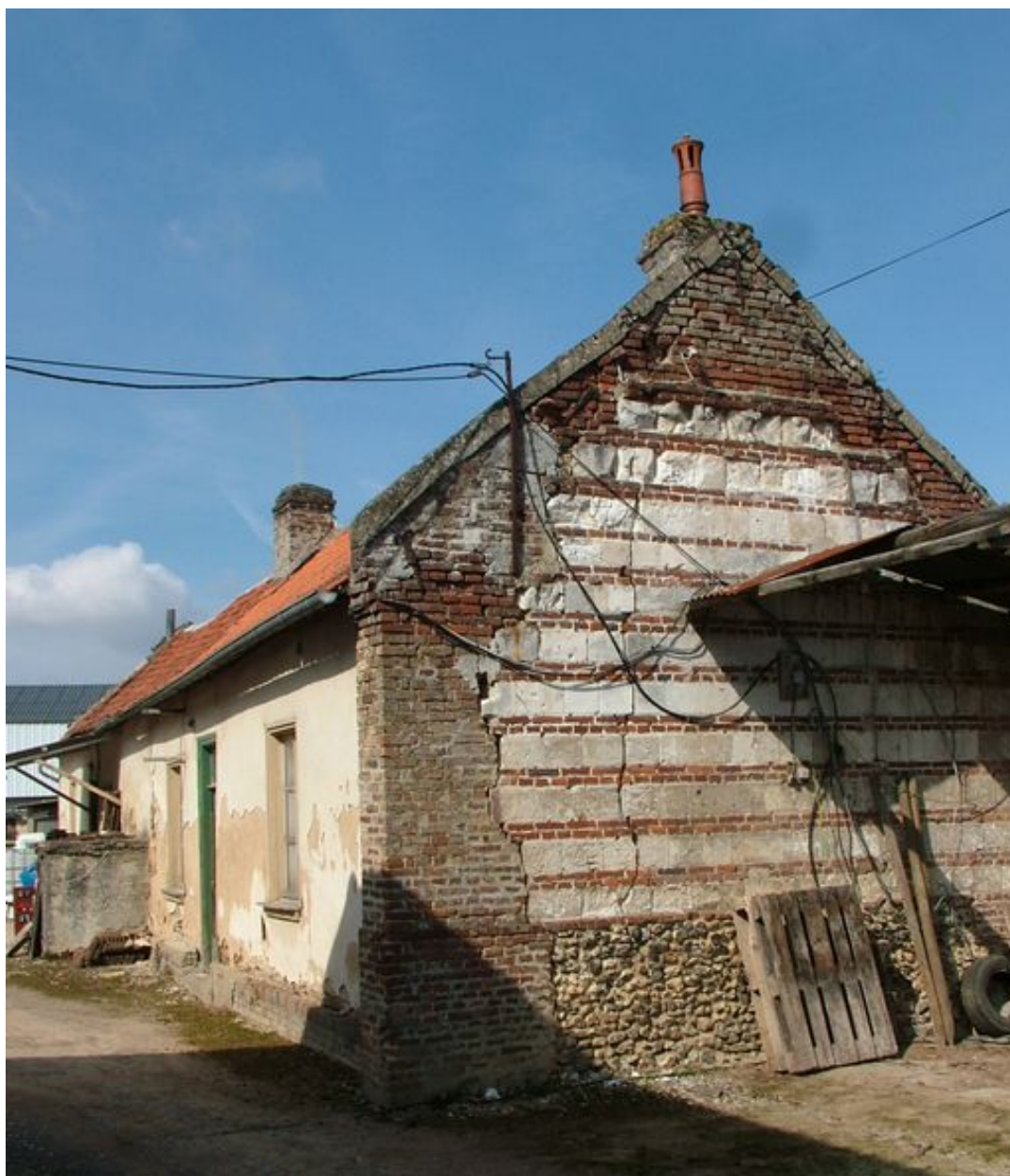
Havernas, pignon en brique et pierre d'un ancien logis de ferme, impasse Gaston-Moutardier, début du 19e siècle.