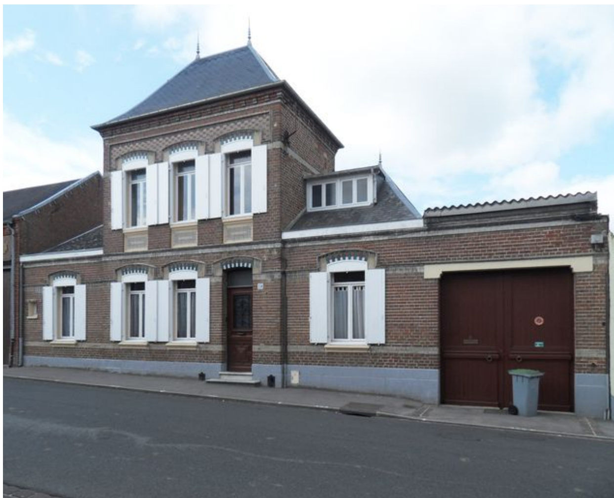
Saint-Ouen, maison, 28 rue Philippe-Louis, 2e moitié du 19e siècle.