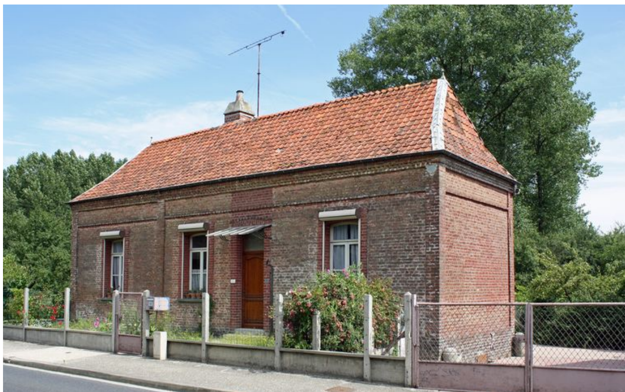
Ville-le-Marcelet, maison, 46 rue Georges-Outrebon, limite 19e siècle 20e siècle.