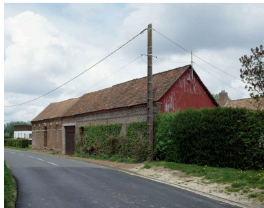
Ribeaucourt, hameau de Barlette, ferme, 31 rue de Domart, 2e moitié du 19e siècle. IVR22_20108000097XA