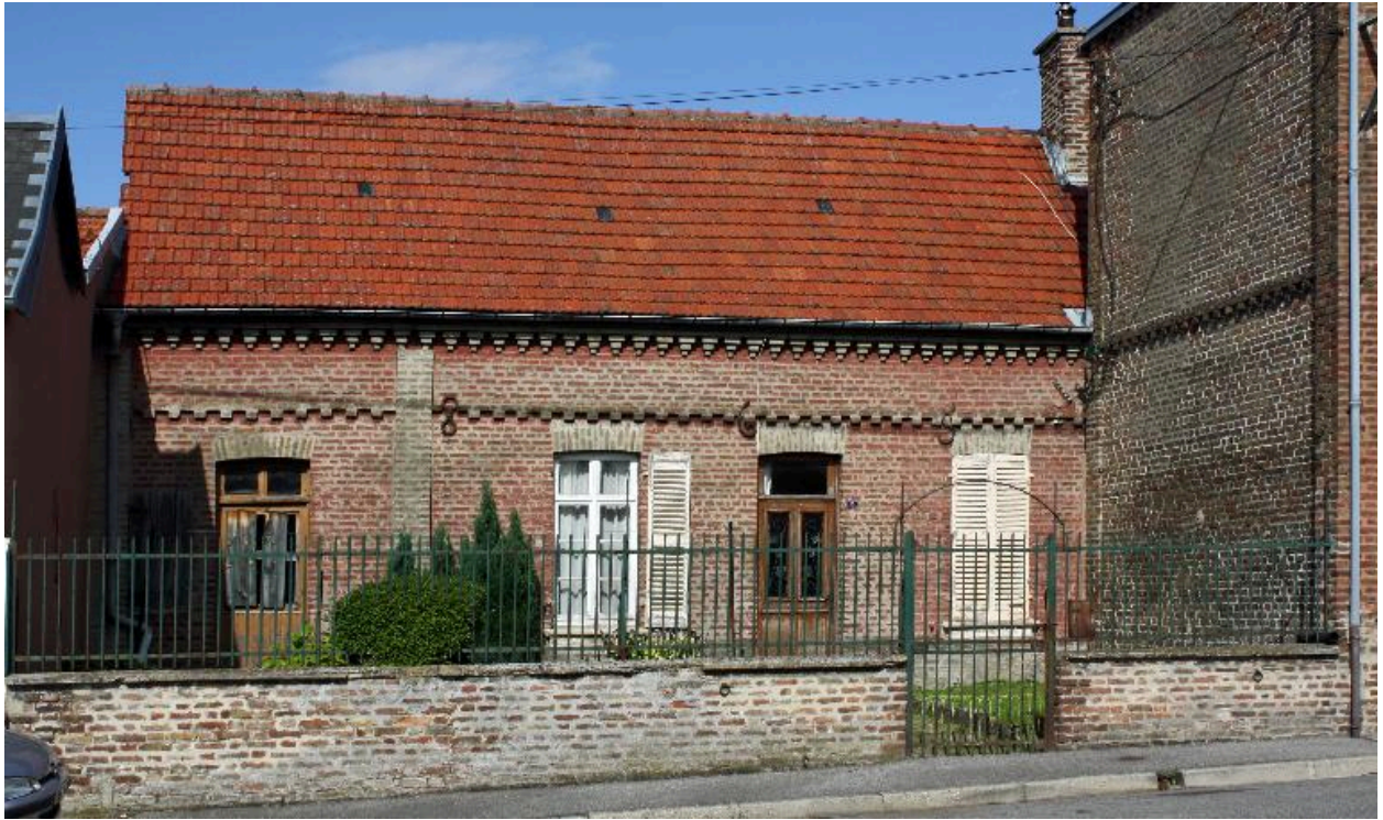
Flixecourt, maison, 5 rue Malakoff, portant la date de 1865.