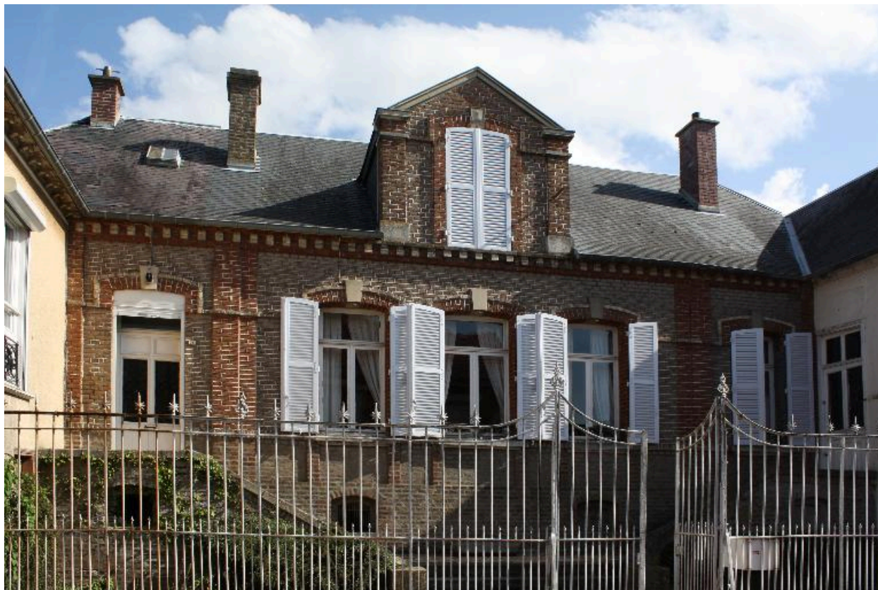
Flixecourt, maison, 25 rue Saint-Pierre, 2e moitié du 19e siècle.