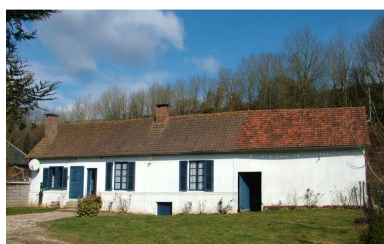
Bouchon, ancienne ferme, 5 rue du Calvaire, 19e siècle.