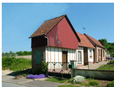
Franqueville, ancienne ferme, 37 rue de Berneuil, 2e moitié du 19e siècle, ayant perdu sa grange et son passage charretier sur rue.