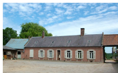
Fransu, logis de ferme, 10 Grande- Rue, portant la date de 1792 mais reconstruit au milieu du 19e siècle.