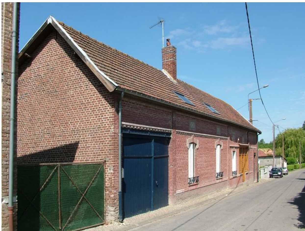
Bettencourt-Saint-Ouen, maison, 7 rue du Marais, présentant la devanture d'un ancien commerce, années 1920-1930.