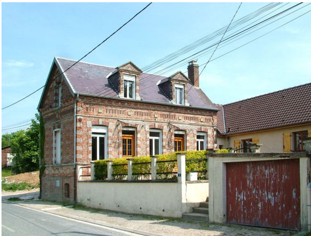
Vauchelles-lès-Domart, maison, 3 rue de Flixecourt, limite des 19e et 20e siècles.