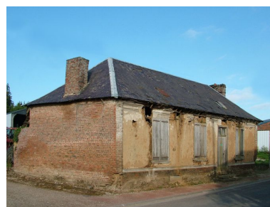
Havernas, ancienne maison en torchis, rue de l'Eglise, 1ère moitié du 19e siècle.