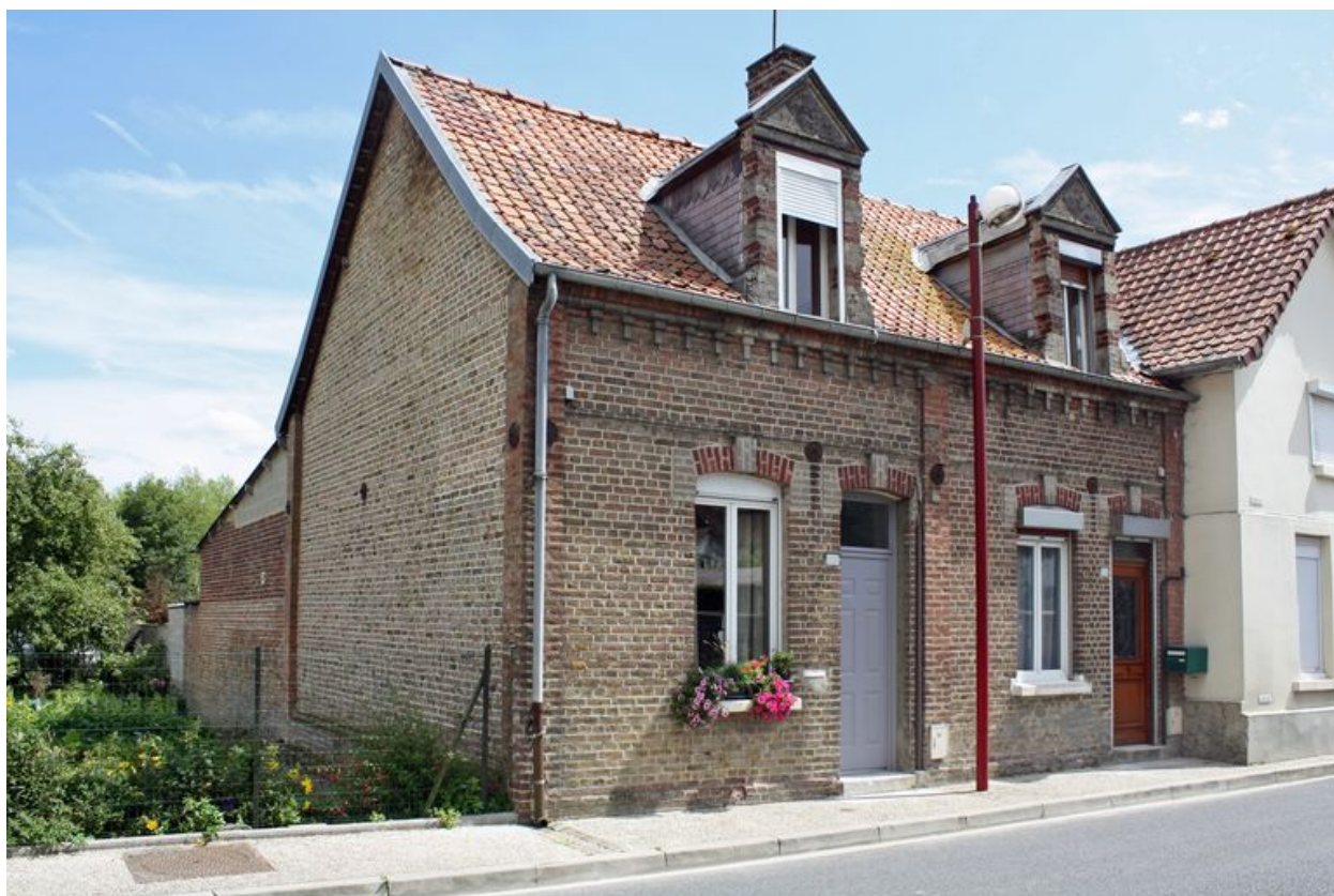
Ville-le-Marlet, maison de rapport à deux unités d'habitation, 18 et 20, rue Georges-Outrebon, 4e quart du 19e siècle.