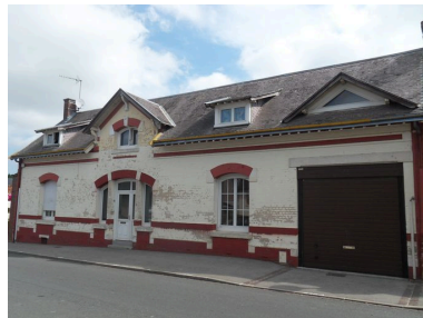
Saint-Ouen, maison, 9 rue Philippe-Louis, reconstruite vers 1838.