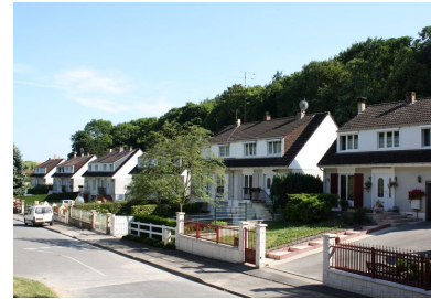
Ville-le-Marcelet, lotissement Olympia, rue Jean-Catelas, 1975.