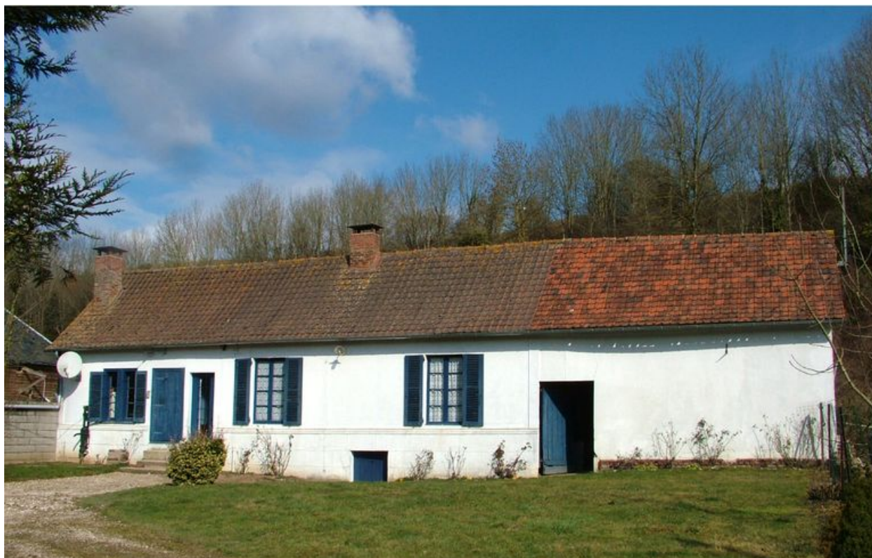
Bouchon, ancienne ferme, 5 rue du Calvaire, 19e siècle.