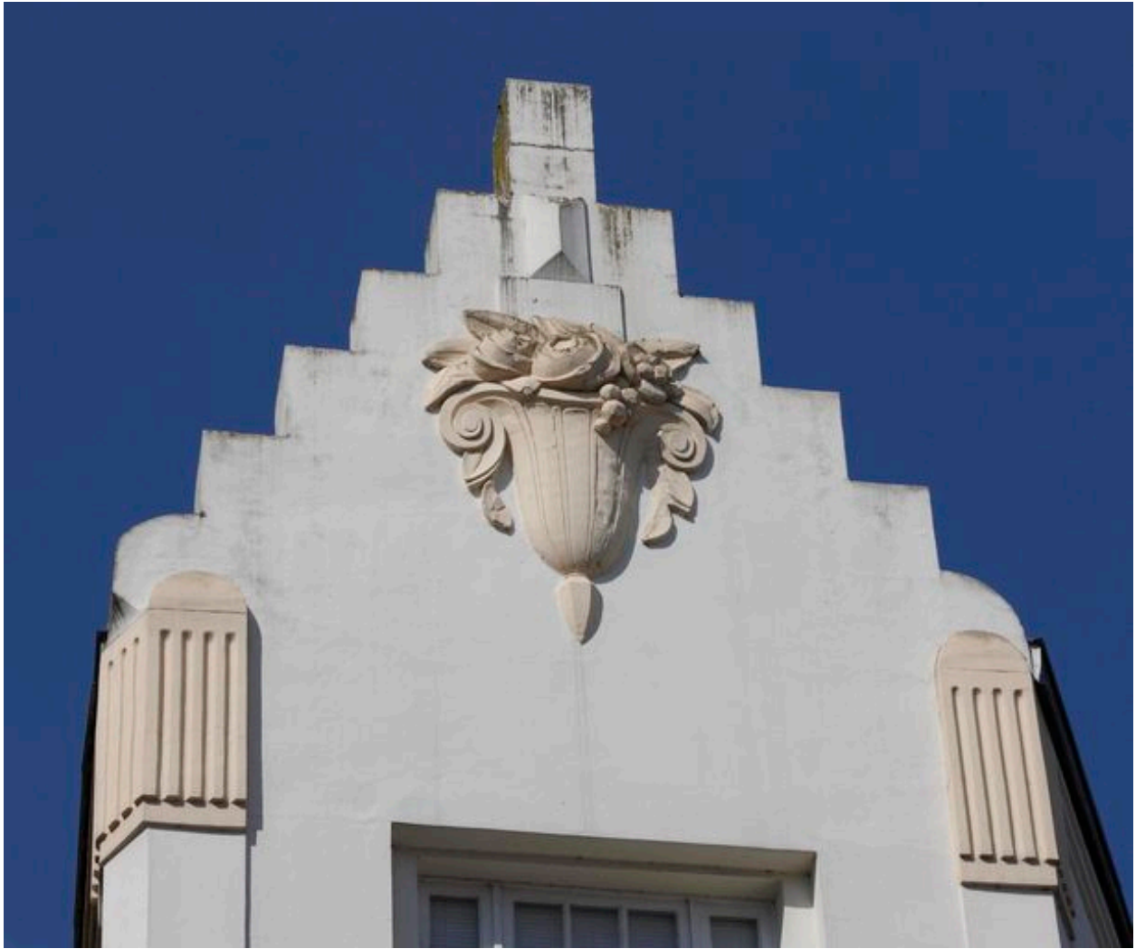
Pignon empreint de régionalisme flamand, orné d'un vase de fleurs.