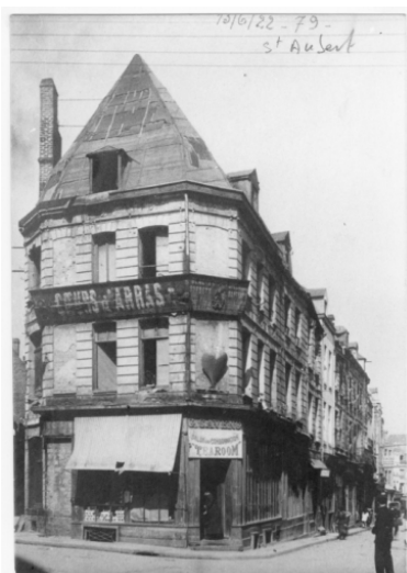
Vue de l'immeuble du 11-13 rue Saint-Aubert, construction avant l'alignement de la rue. (reproduction) IVR31_20096200304NUCB