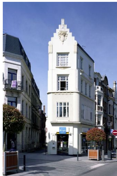
Vue générale. IVR31_20086200232XE