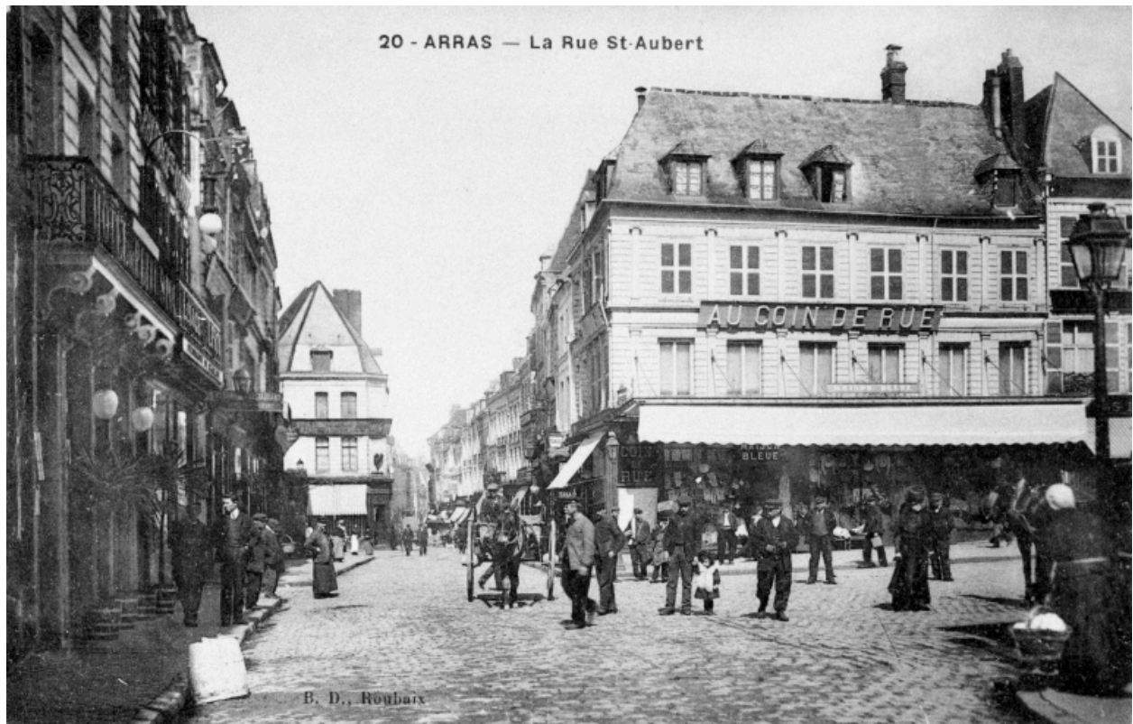
La rue Saint-Aubert, vers 1915 (AD Pas-de-Calais ; 5Fi 041/92).