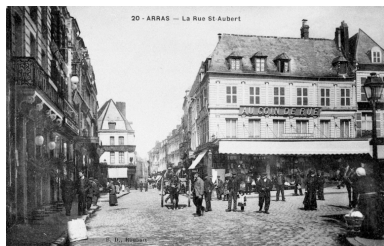
La rue Saint-Aubert, vers 1915