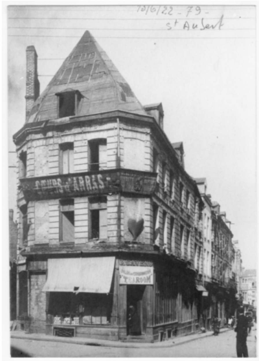
Vue de l'immeuble du 11-13 rue Saint-Aubert, construction avant l'alignement de la rue.