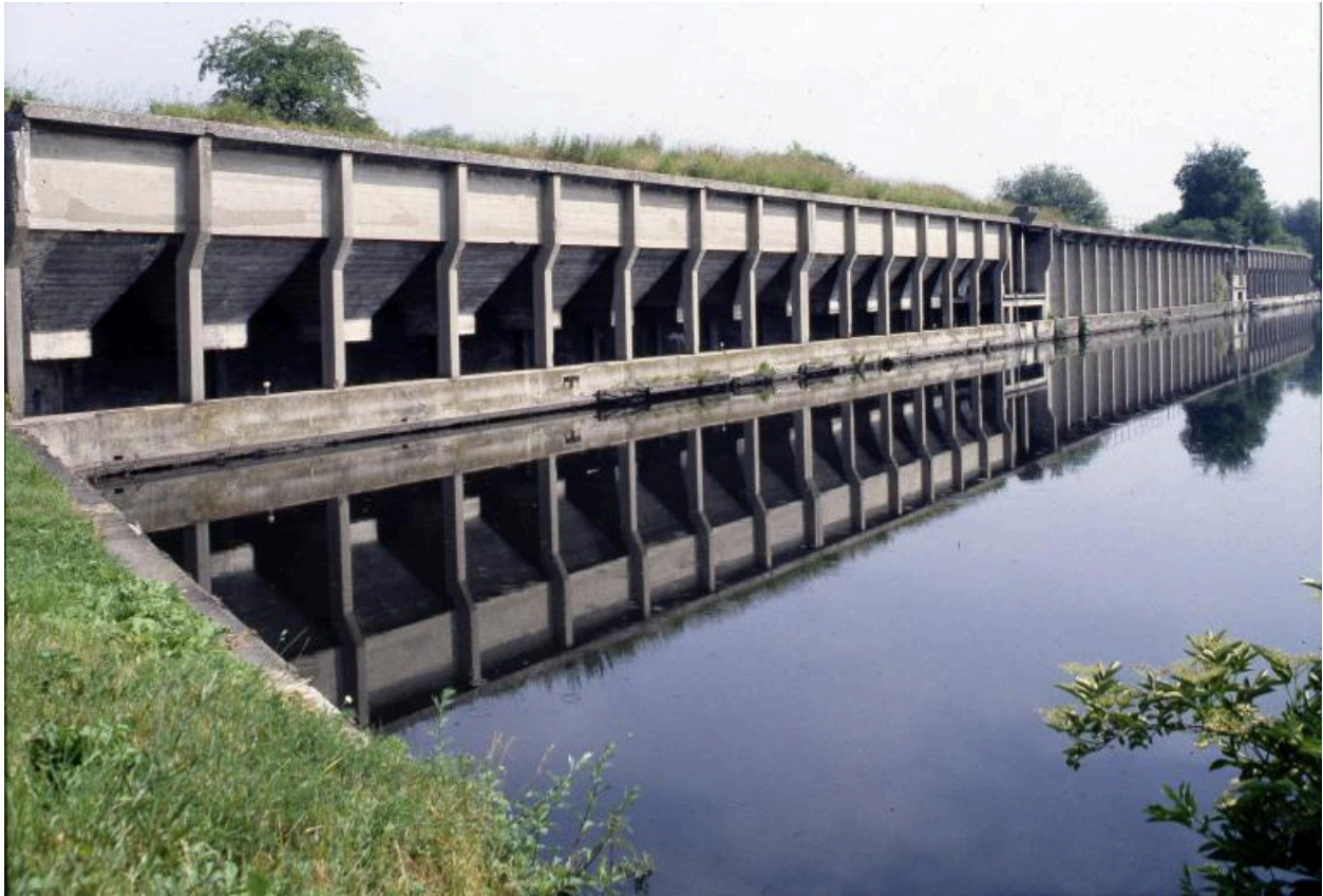
Vue générale vers le nord-ouest en 1996.