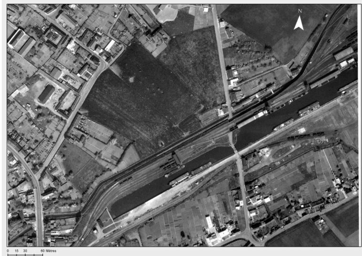
Le rivage, au nord de la darse et à droite du pont, sur une vue aérienne de 1960 (IGN. Photothèque nationale. 1960).