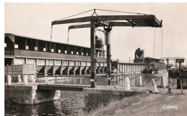
Carte postale, vers 1930 (coll. part.). IVR32_20206200044NUCA