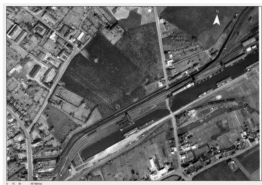
Le rivage, au nord de la darse et à droite du pont, sur une vue aérienne de 1960. IVR32_20206200045NUC