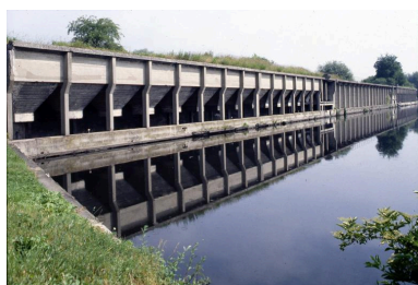
Vue générale vers le nord-ouest en 1996.