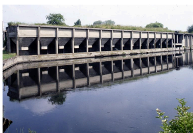
Vue générale vers le nord-ouest en 1996. IVR31_19966200940ZA