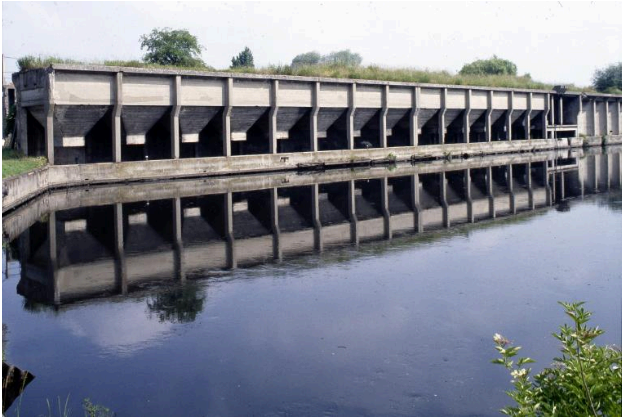
Vue générale vers le nord-ouest en 1996.