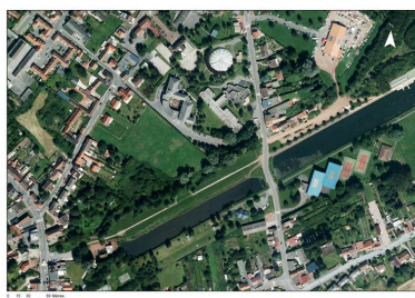
Le site, selon la même emprise, sur une photographie aérienne de 2015. IVR32_20206200046NUCA