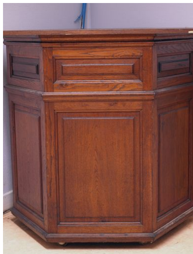
La cuve, conservée dans l'oratoire