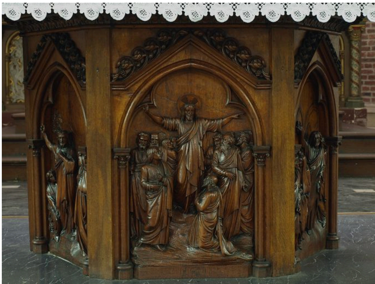
Vue générale des panneaux remontés sous l'autel du choeur