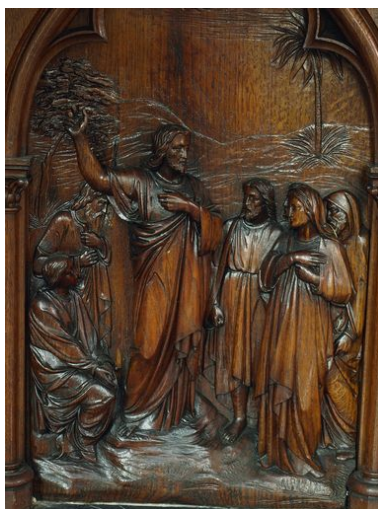
Prédication du Christ IVR31_20106202782NUCA