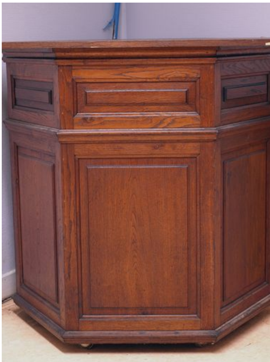
La cuve, conservée dans l'oratoire