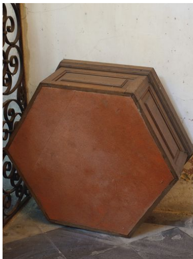
L'abat-son : conservé dans la chapelle des fonts IVR31_20106202784NUCA