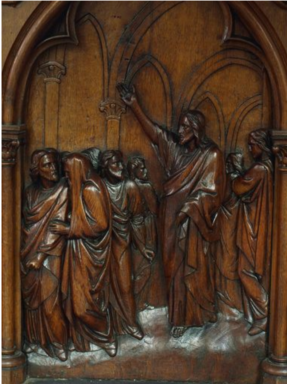
Prédication du Christ