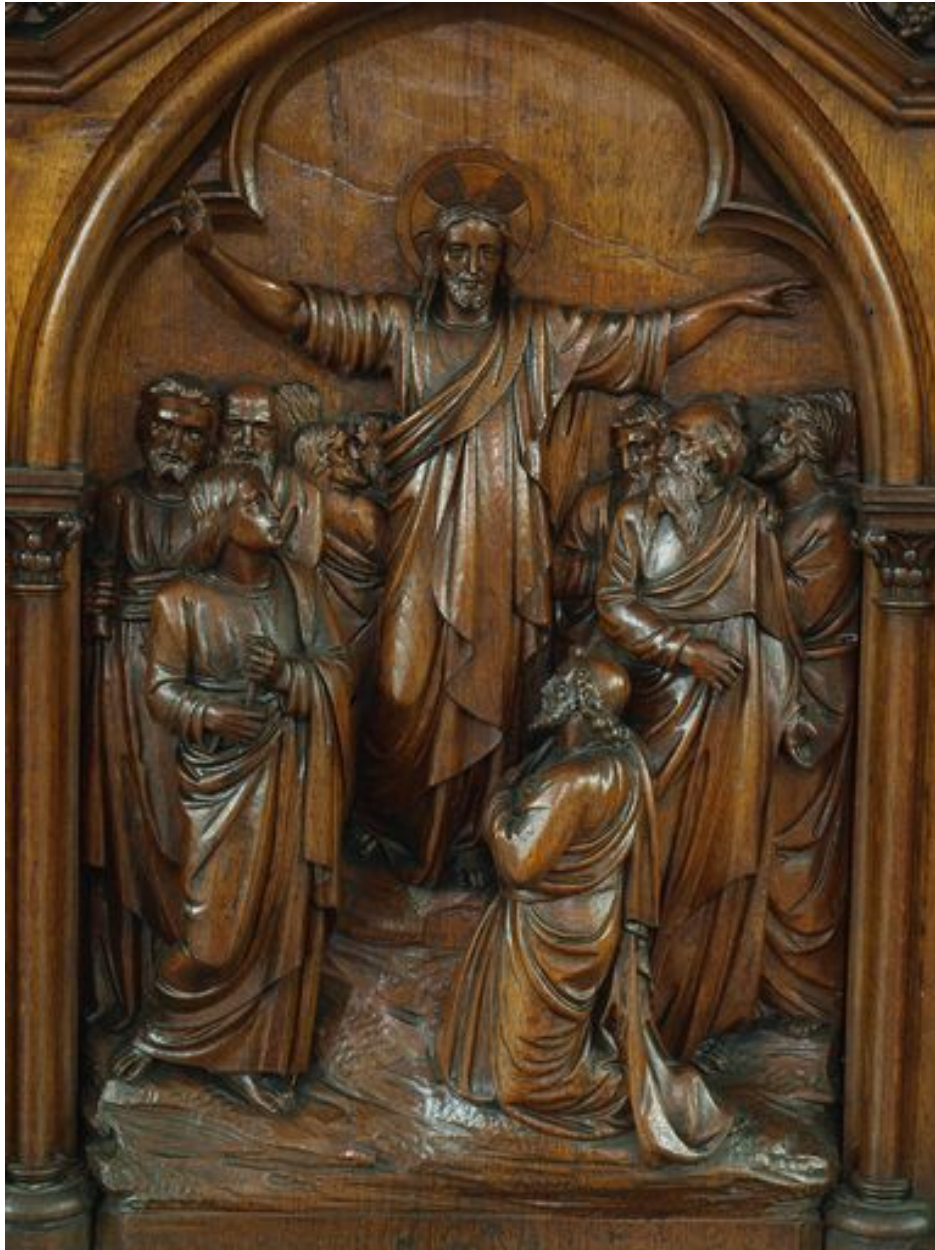
Panneau central : le sermon sur la montagne ?