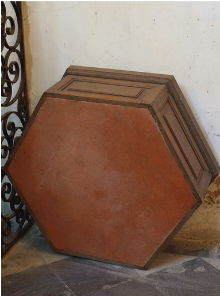
L'abat-son : conservé dans la chapelle des fonts