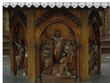
Vue générale des panneaux remontés sous l'autel du chœur IVR31_20106202780NUCA