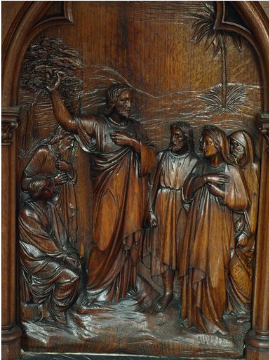
Prédication du Christ