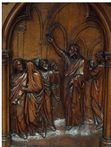
Prédication du Christ