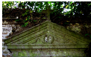
Fronton triangulaire sculpté de la stèle. IVR22_20068001049NUCA