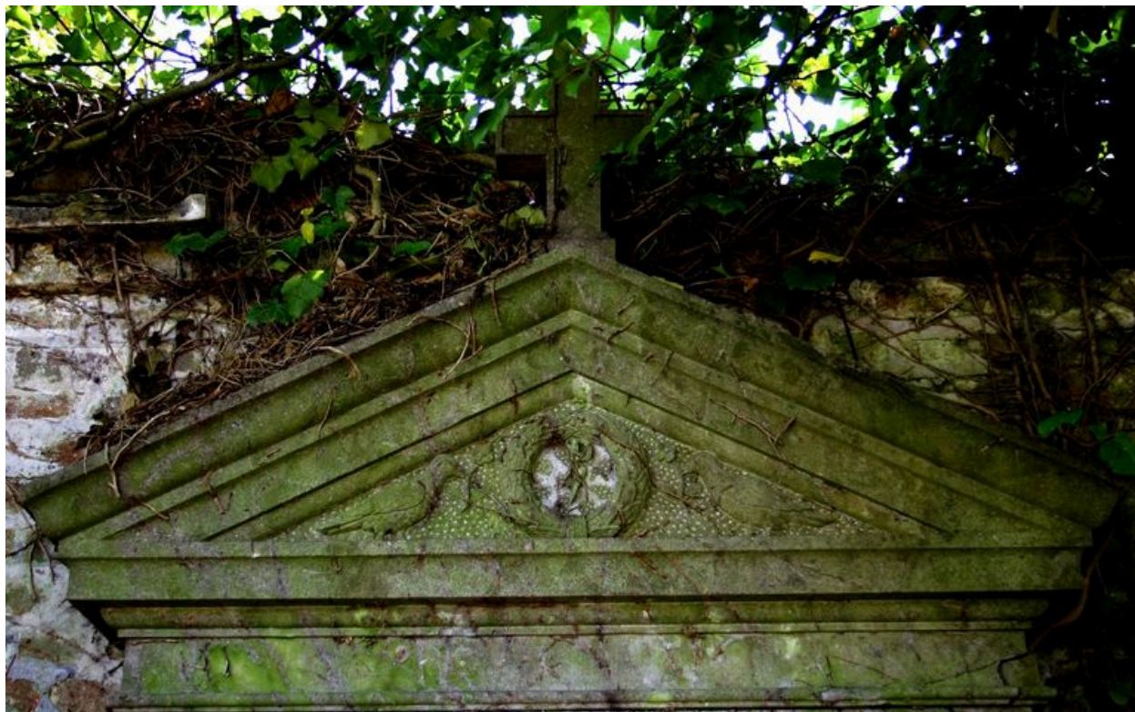
Fronton triangulaire sculpté de la stèle.