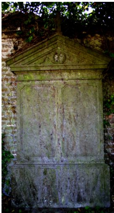
Stèle à entablement et fronton. IVR22_20068001048NUCA