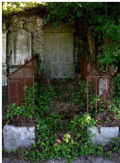
Vue générale. IVR22_20068001047NUCA