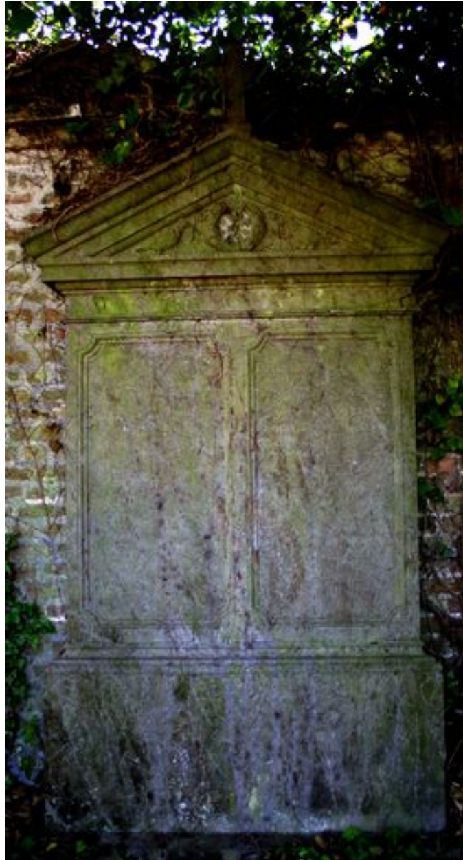
Stèle à entablement et fronton.