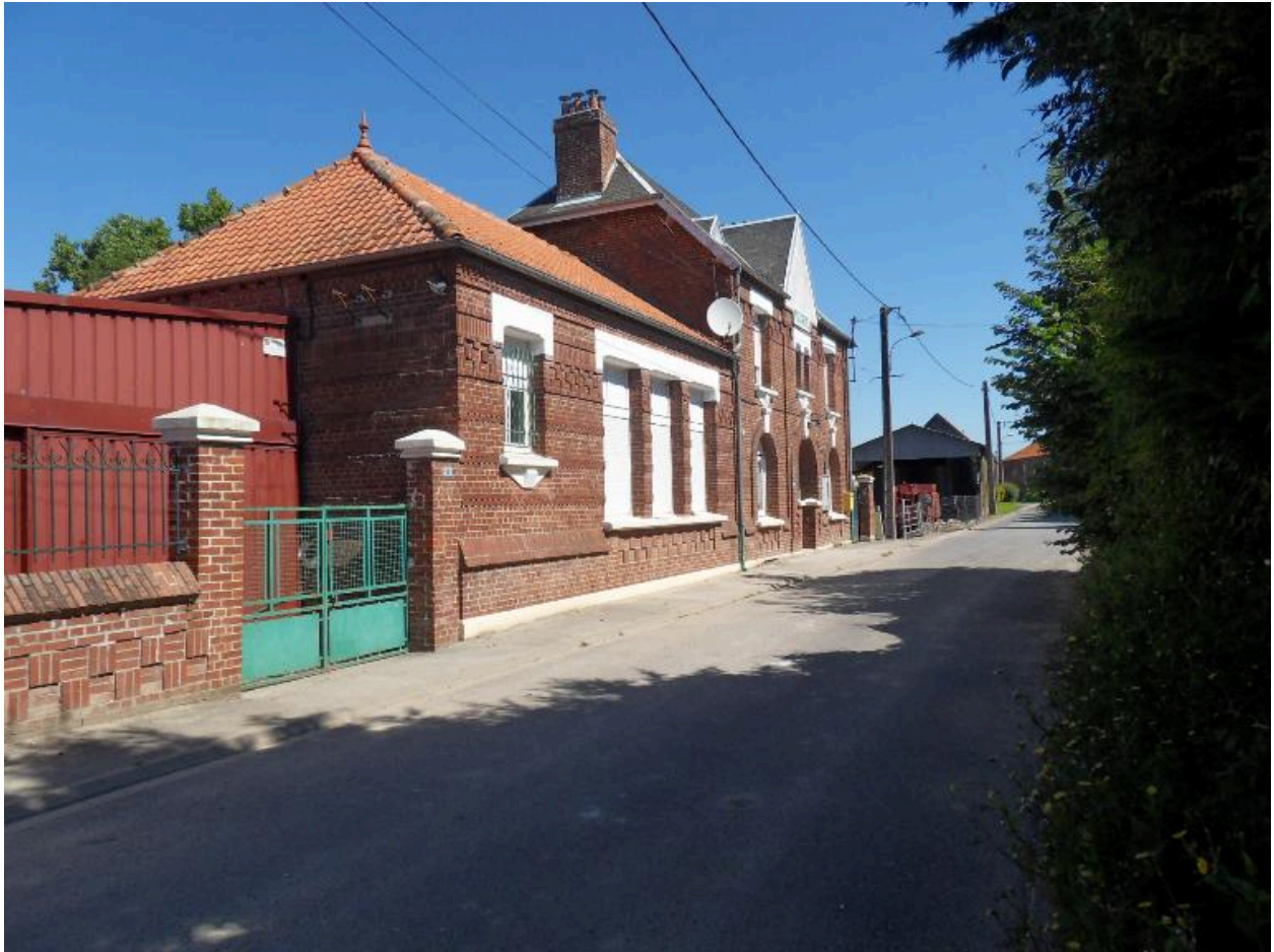
Vue de situation depuis le sud. Au premier plan, le portail sur la cour et la salle de classe.