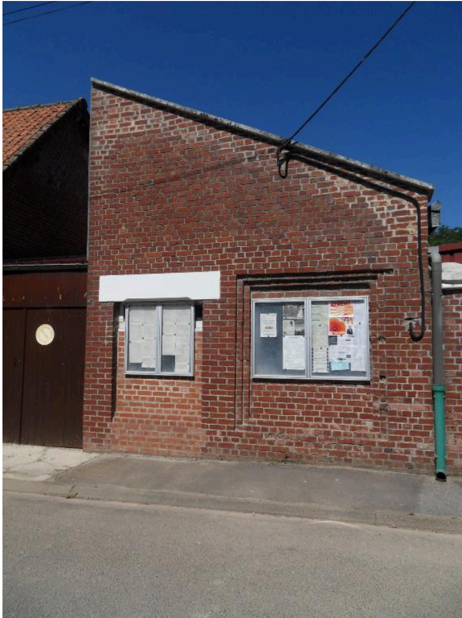
L'ancienne remise des pompes à incendie et de l'ancien puits.