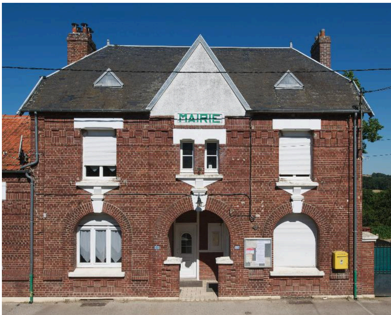
Vue de la façade sur rue, du bâtiment principal abritant l'ancien logement de l'instituteur et la salle de mairie.