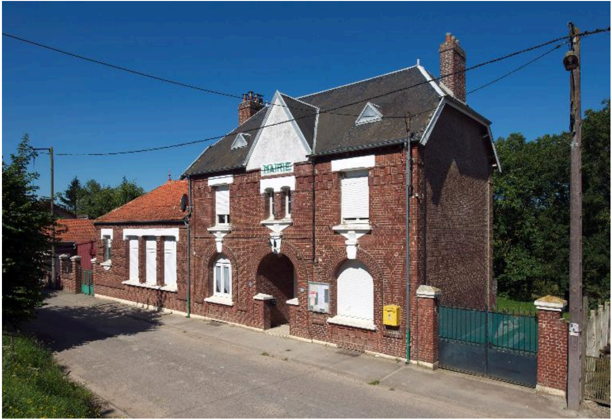
Vue de situation depuis le nord.

IVR22_20128000938NUC2A Auteur de l'illustration : Marie-Laure Monnehay-Vulliet (c) Région Hauts-de-France - Inventaire général reproduction soumise à autorisation du titulaire des droits d'exploitation