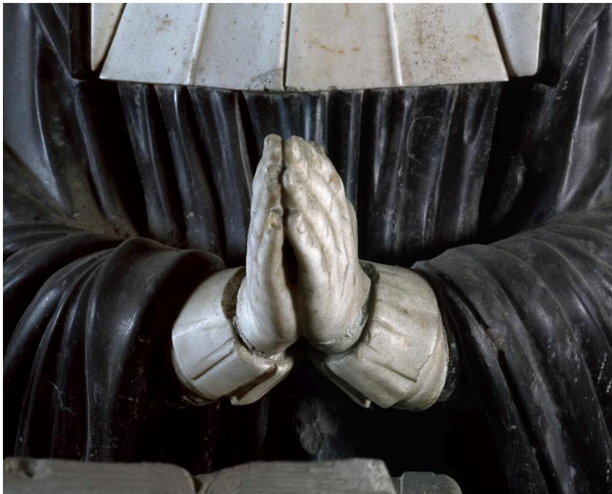
Vue des mains jointes de l'abbesse.