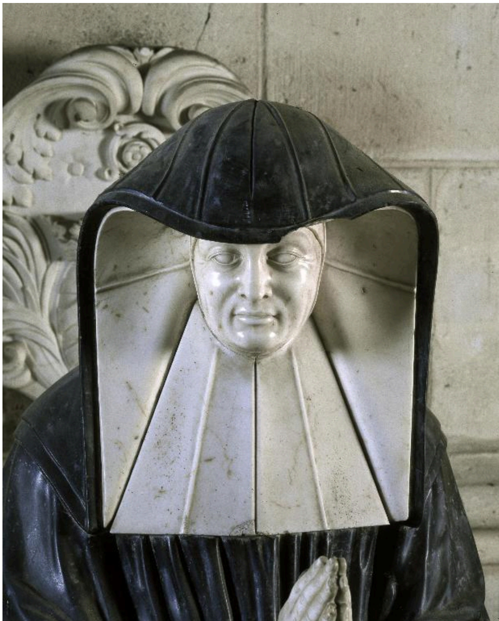
Vue du buste de l'abbesse.