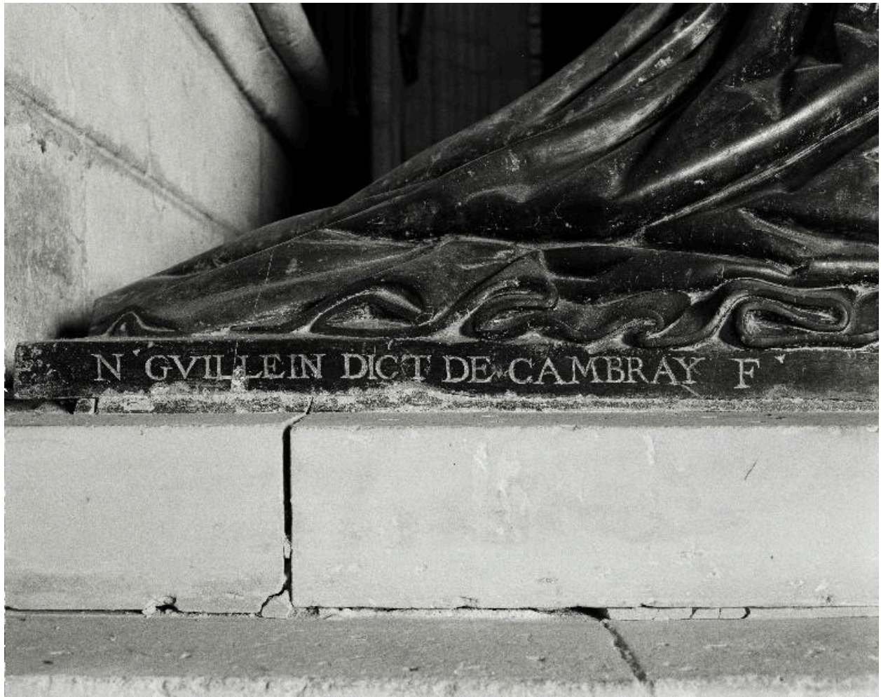
Vue de la signature de Nicolas Guillain.