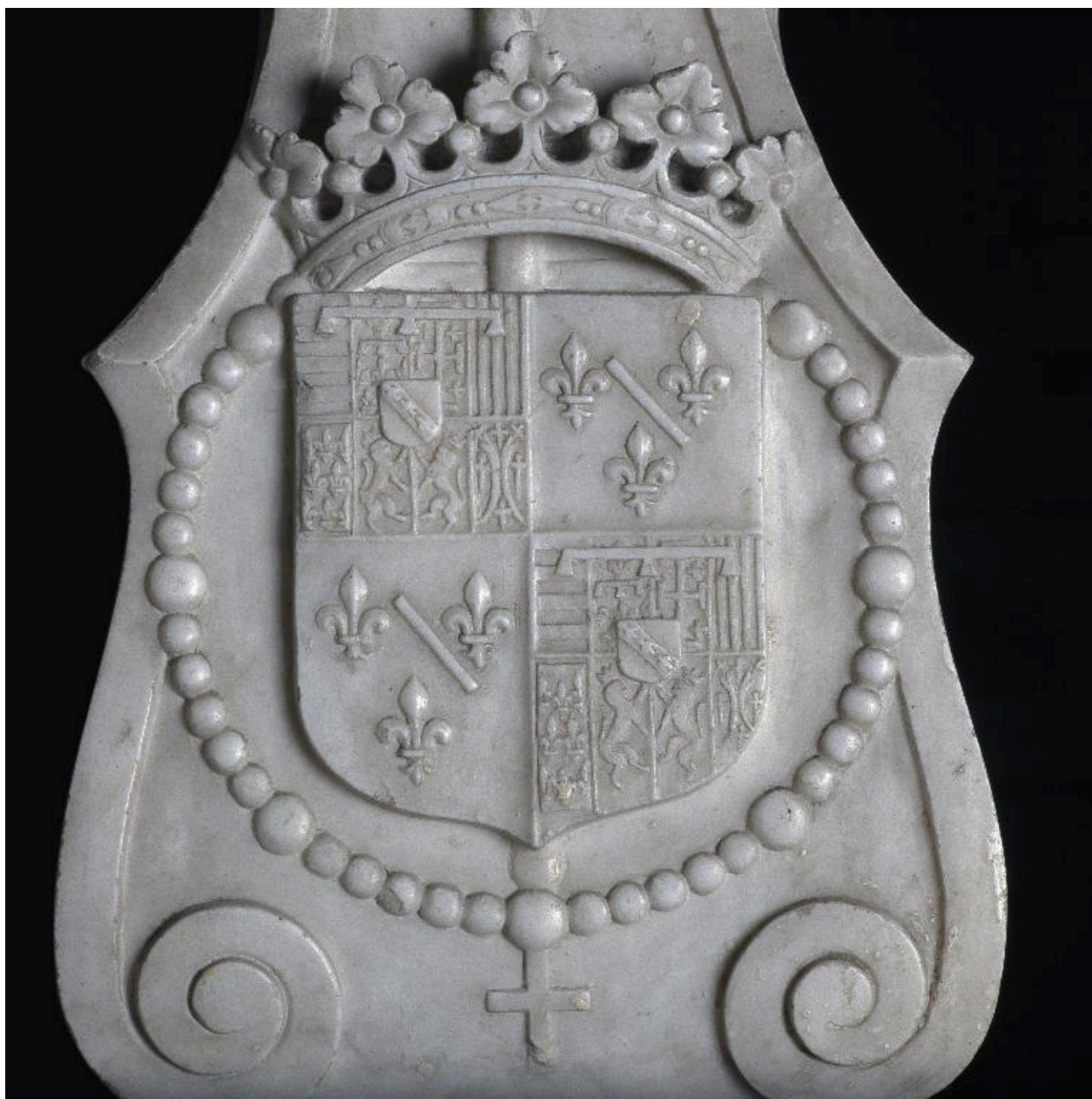
Vue des armoiries de l'abbesse Louise de Lorraine d'Aumale, ornant le pupitre placé par erreur devant l'autre priant.