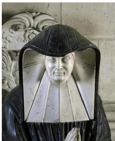
Vue du buste de l'abbesse.