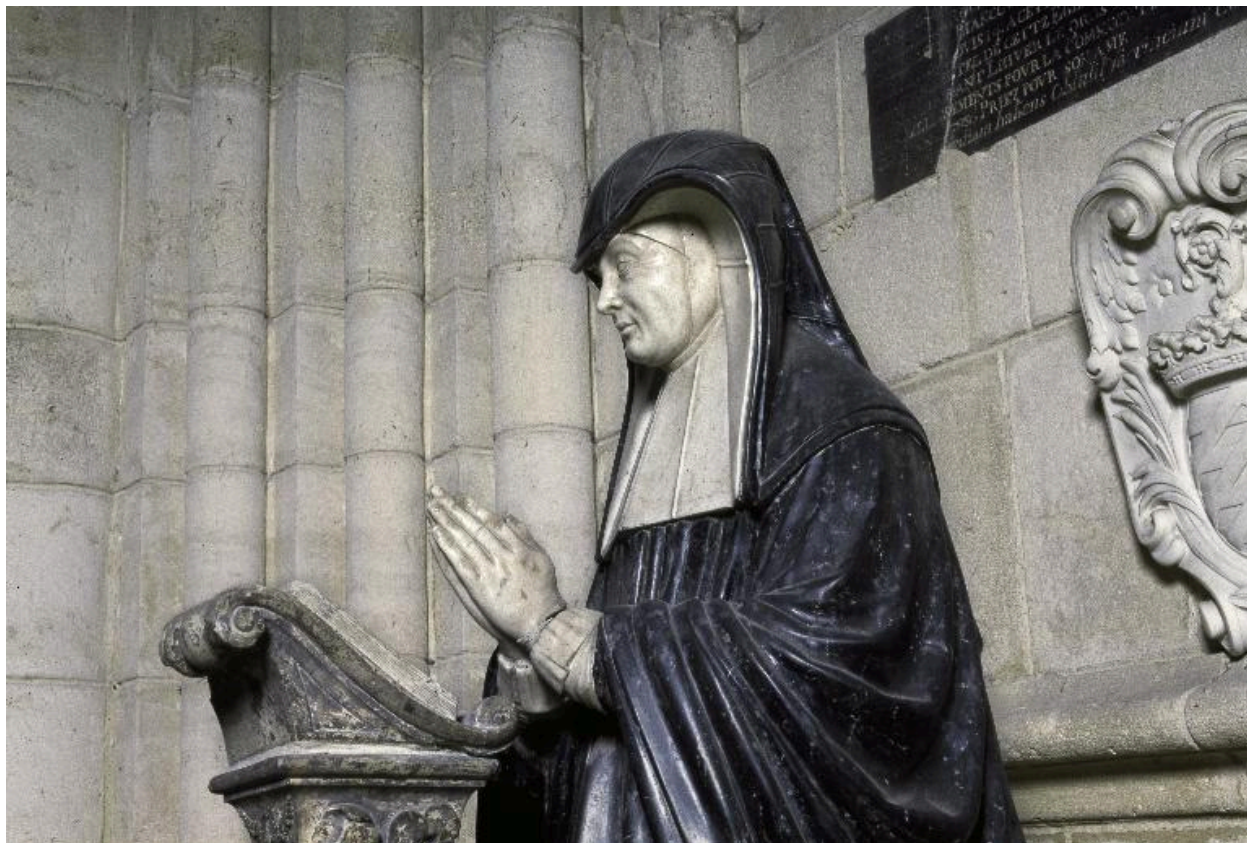
Vue de la partie supérieure de la statue.