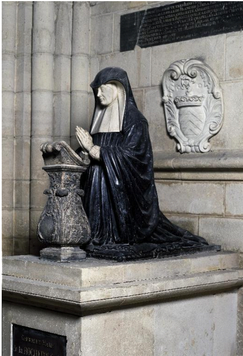
Vue générale du priant de Louise de Lorraine d'Aumale.