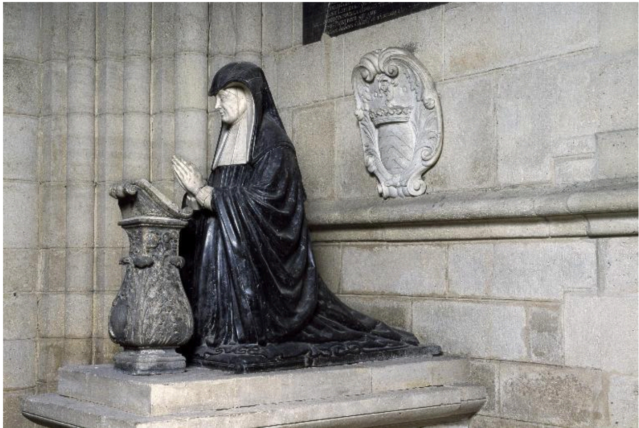
Vue générale du priant de Louise de Lorraine d'Aumale.