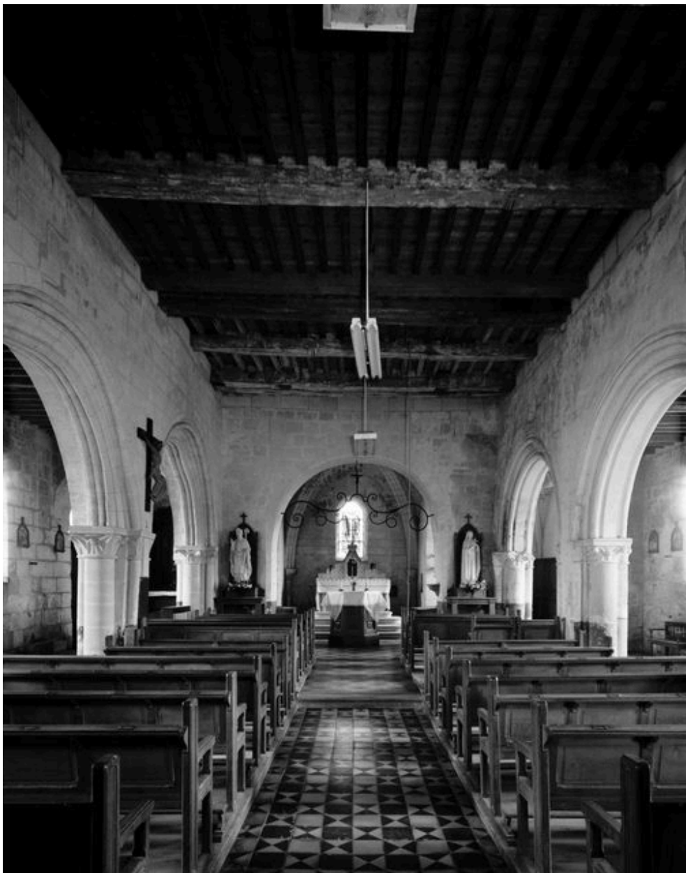
Vue intérieure vers le choeur.