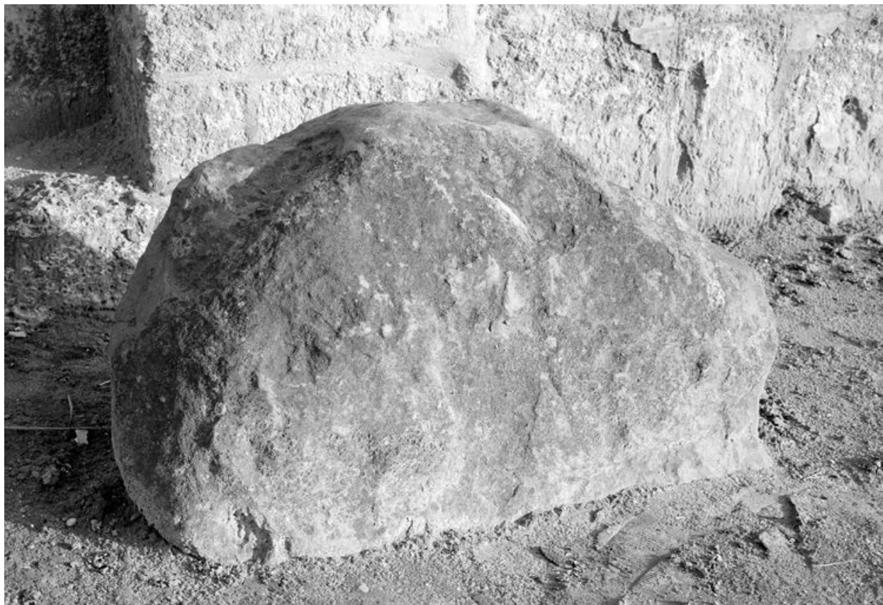
Mégalithe dit Grès Saint Lucien.