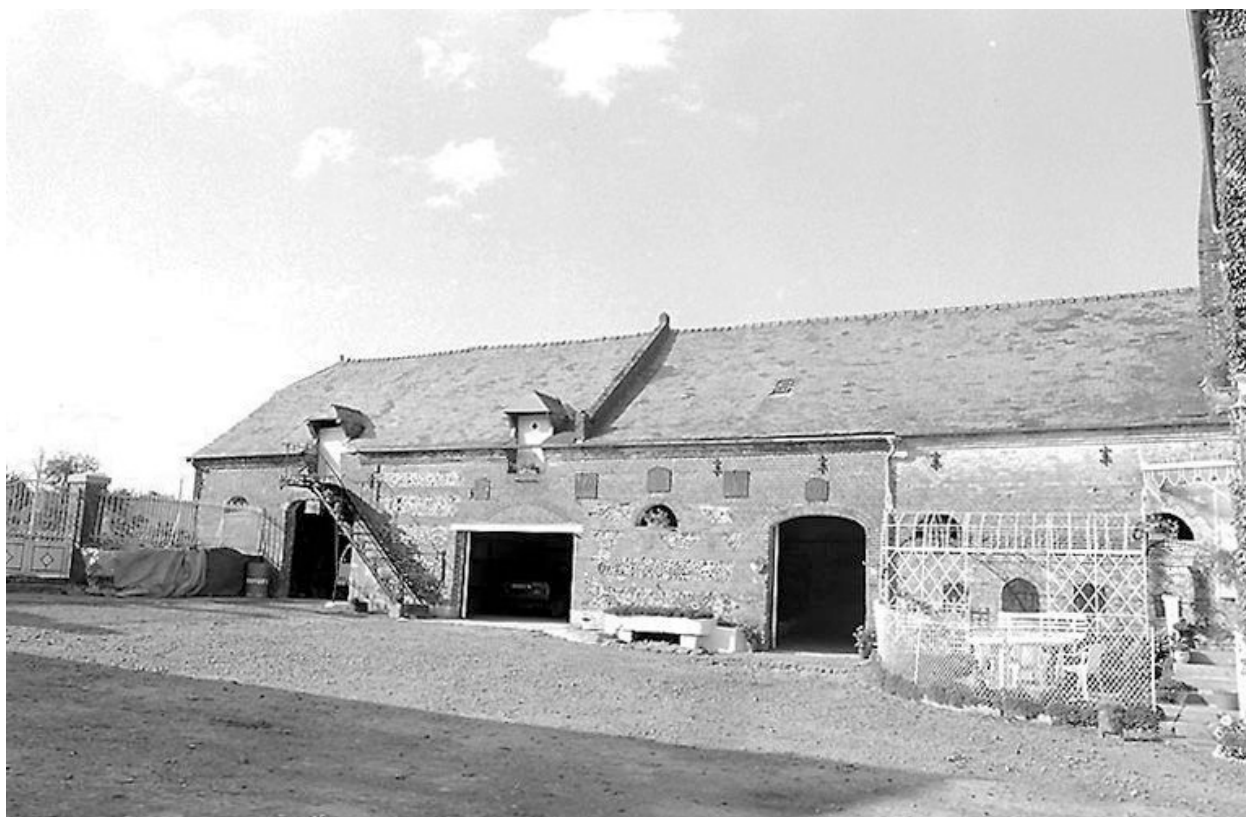
Etable à vaches et à chevaux.