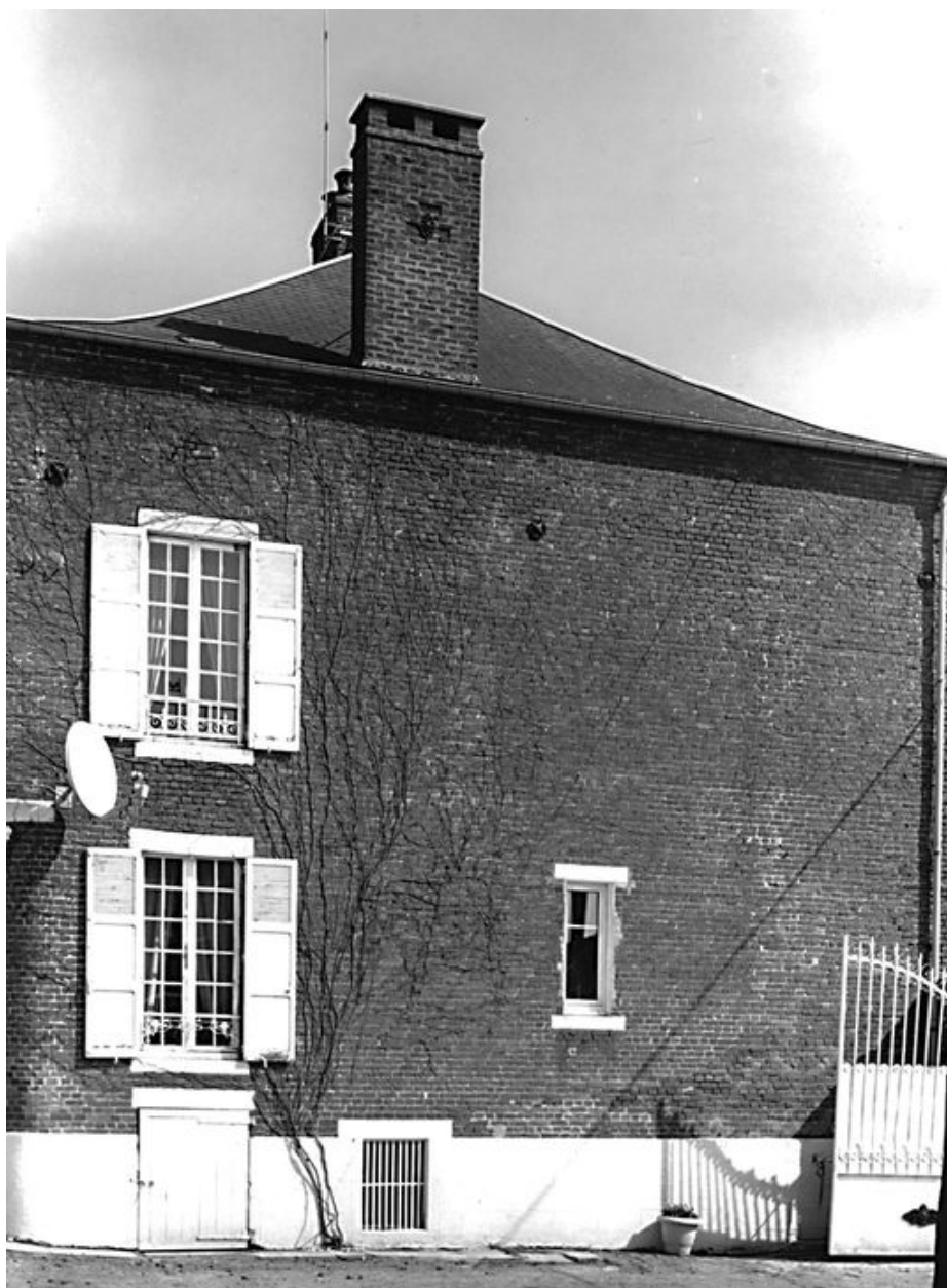
Elévation du mur pignon ouest du logis.