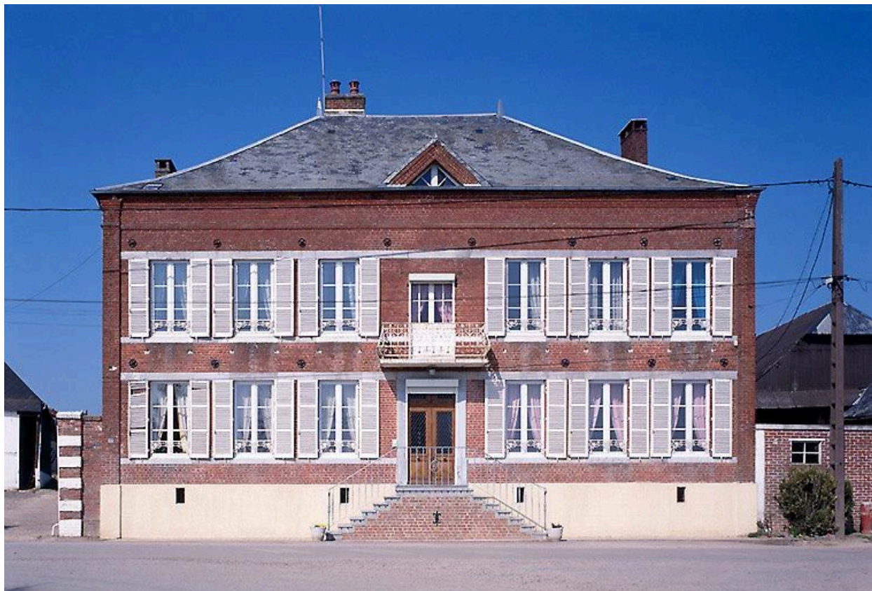
Vue générale du logis.