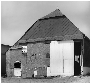
Grange-étable. IVR22_19990201245X