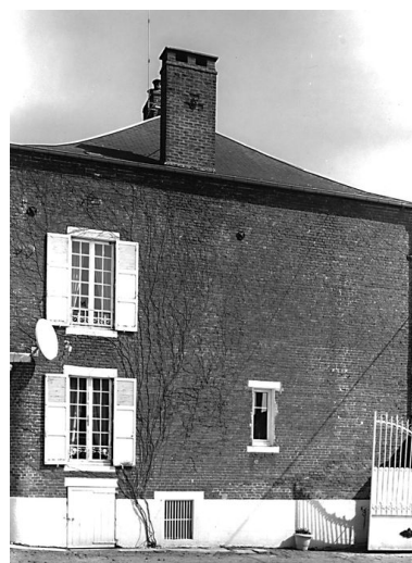
Élévation du mur pignon ouest du logis. IVR22_19990201244X