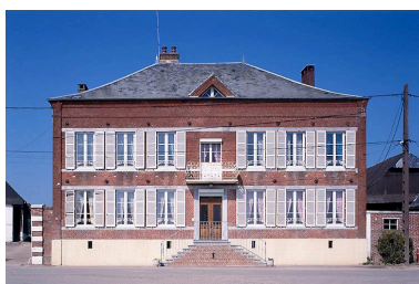
Vue générale du logis.