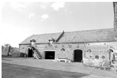
Etable à vaches et à chevaux.