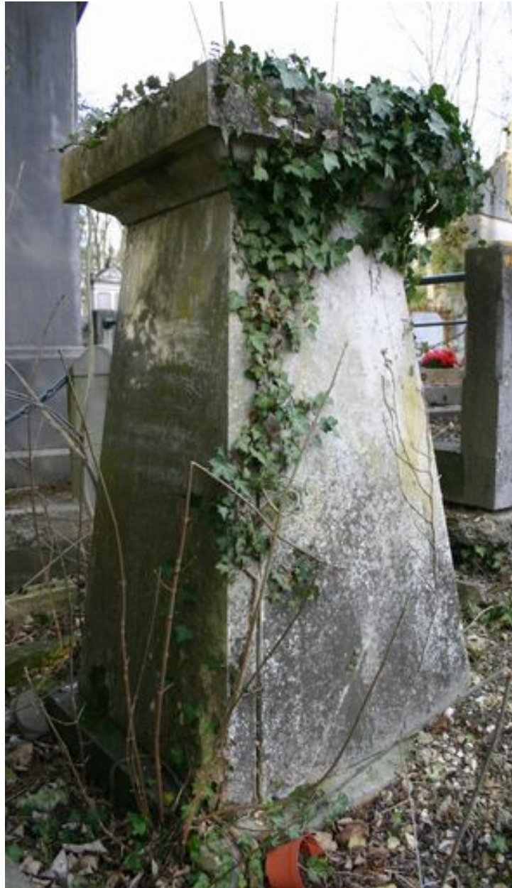
Cippe, vers 1824, côté droit.