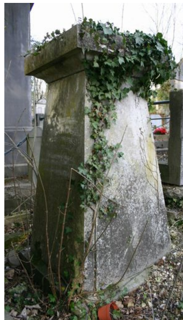
Cippe, vers 1824, côté droit.