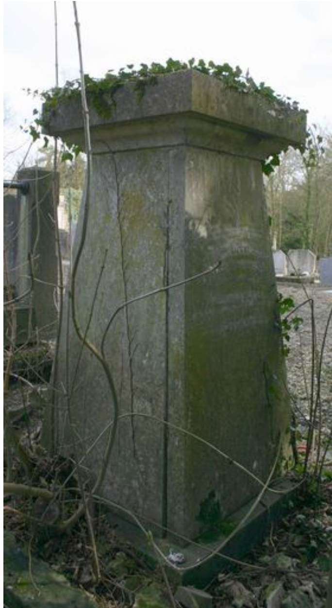
Cippe, vers 1824, côté gauche.