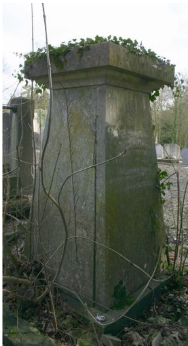
Cippe, vers 1824, côté gauche.