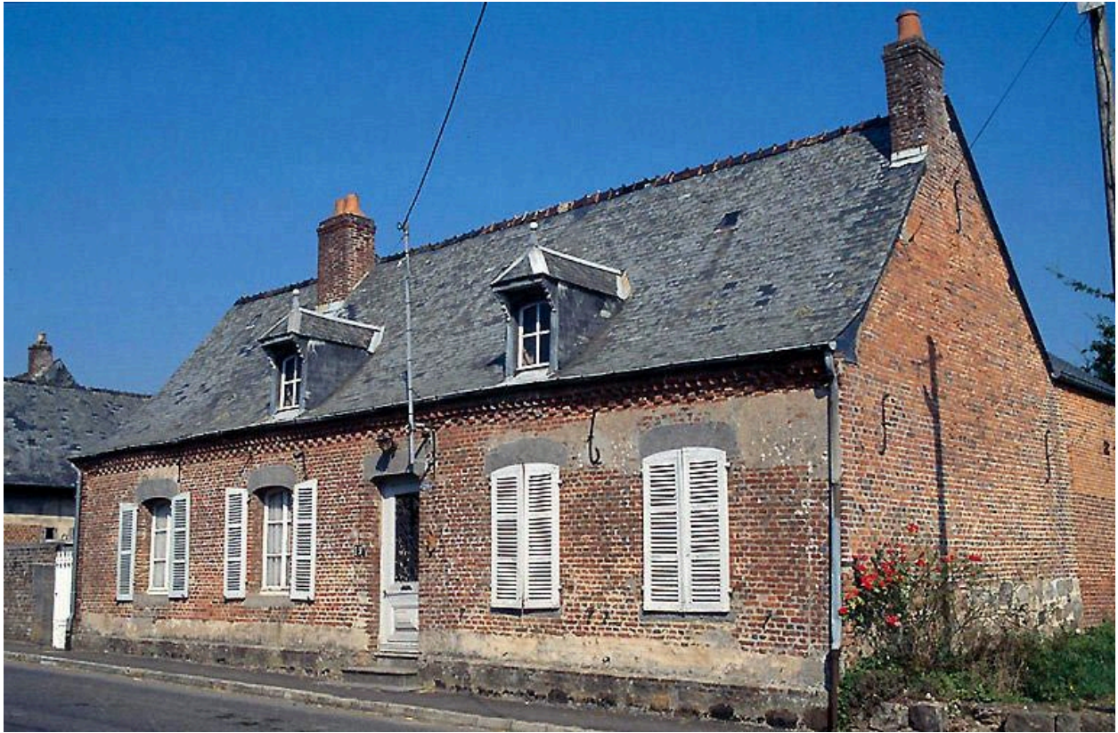
Vue du logis.