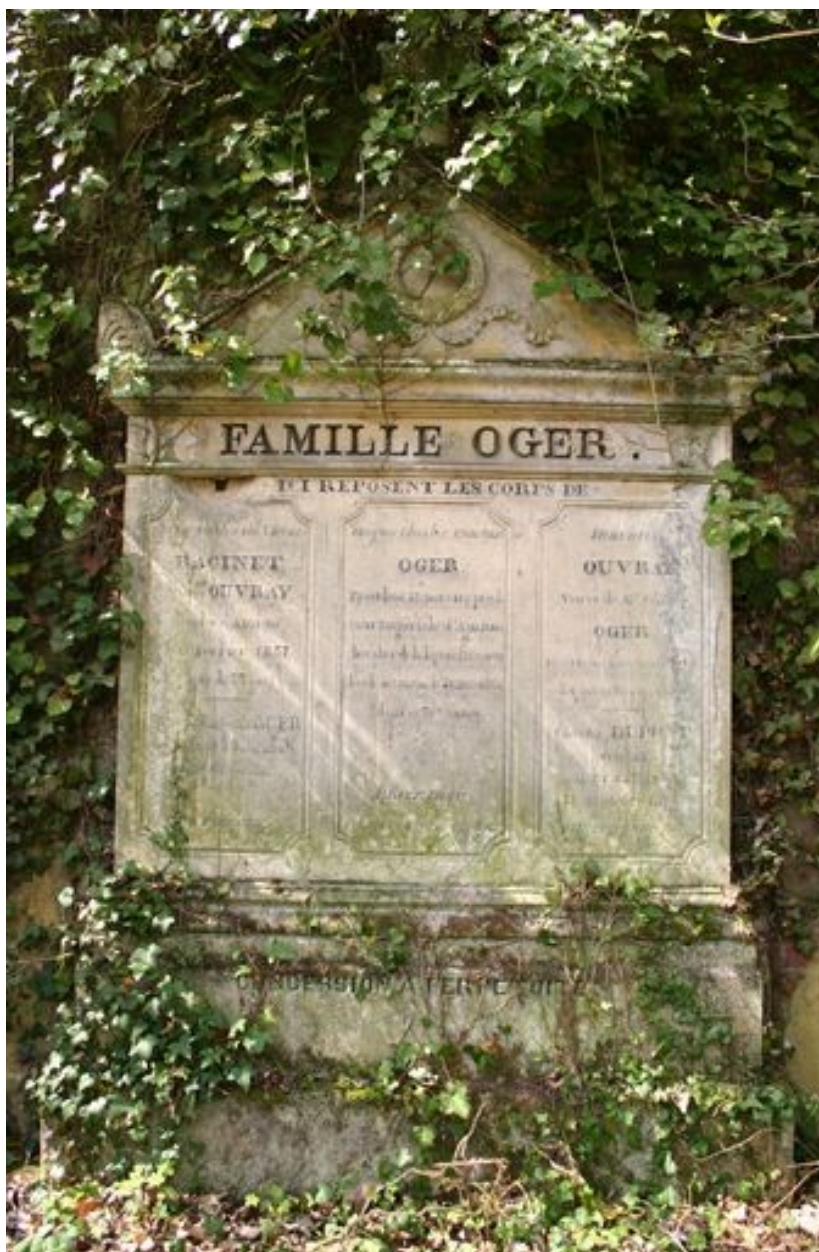
Stèle à entablement et fronton.