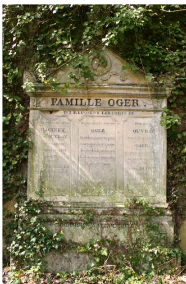
Stèle à entablement et fronton.