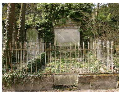
Vue générale. IVR22_20068000848NUCA