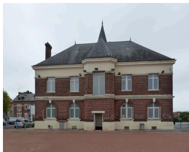
Vue de la façade arrière (ouest).

Phot. Isabelle Barbedor IVR32_20210205089NUCA