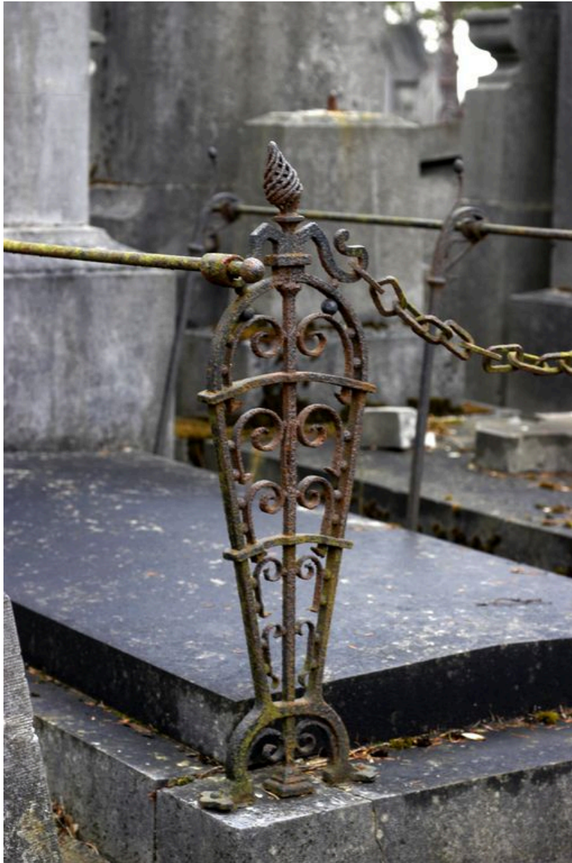
Vue de détail sur un des piliers de la clôture.