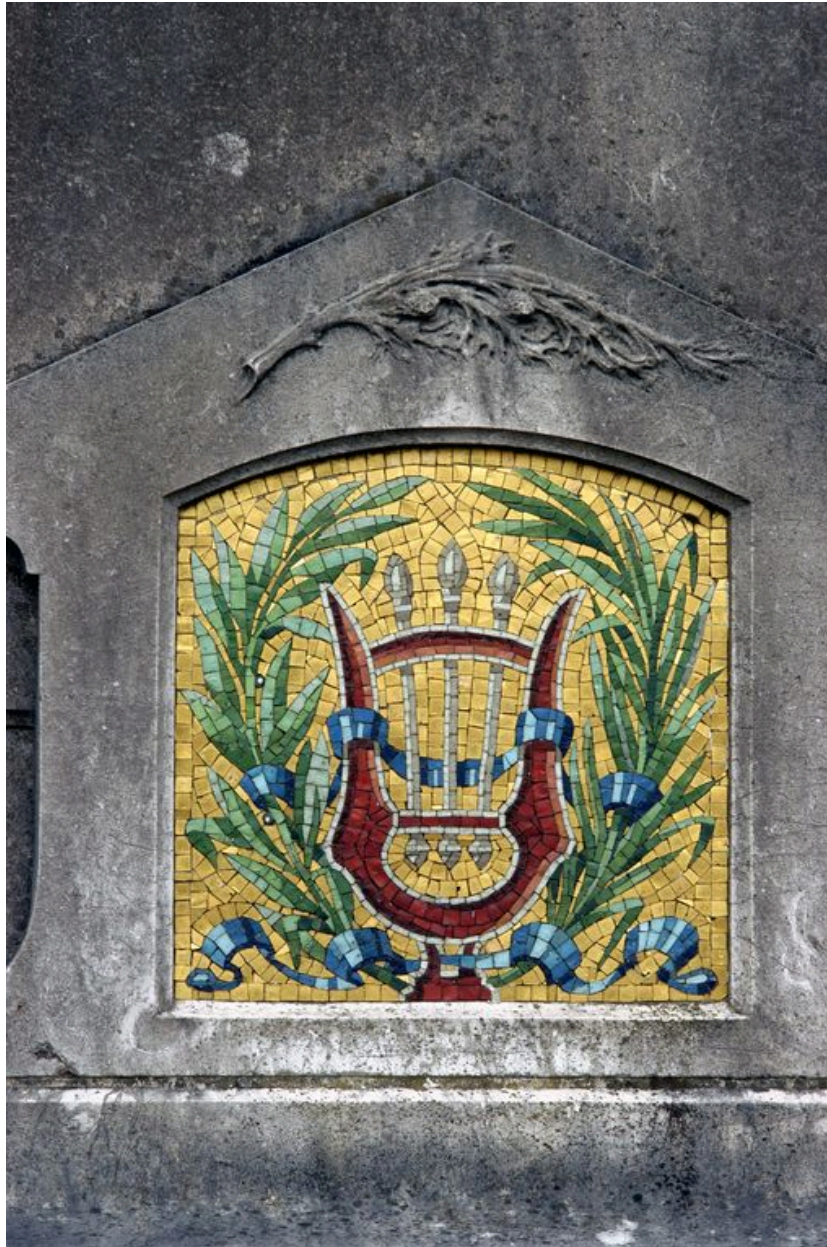
Vue de détail sur le décor en mosaïque.