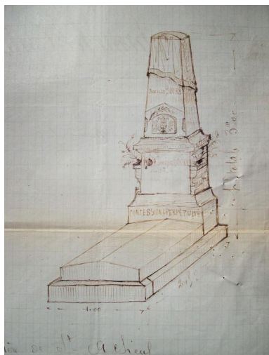
Tombeau pour la famille Boury au cimetière de Saint-Acheul, Lamolet-Tattegrain, 1905 (BM Amiens ; 2M 18/9).

IVR22_20068013173NUCA