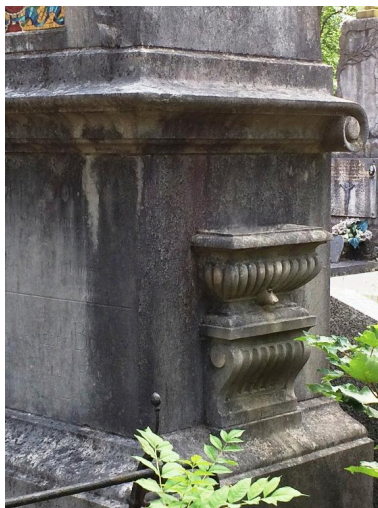
Vue de détail sur le côté de l'obélisque. IVR32_20178005151NUCA