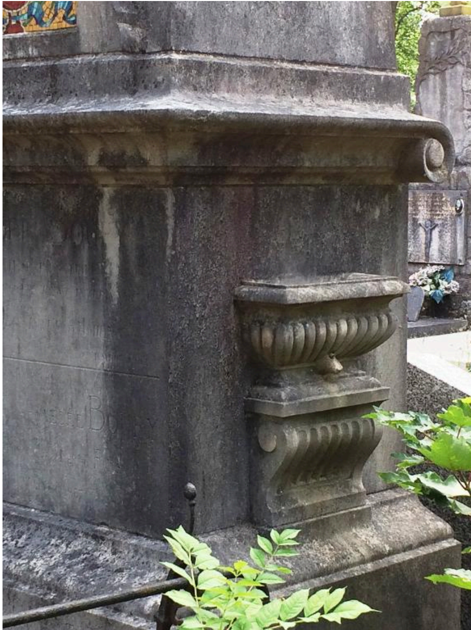
Vue de détail sur le côté de l'obélisque.