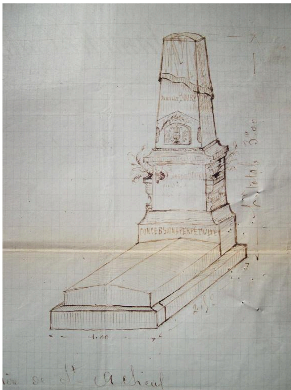
Tombeau pour la famille Boury au cimetière de Saint-Acheul, Lamolet-Tattegrain, 1905 (BM Amiens ; 2M 18/9).