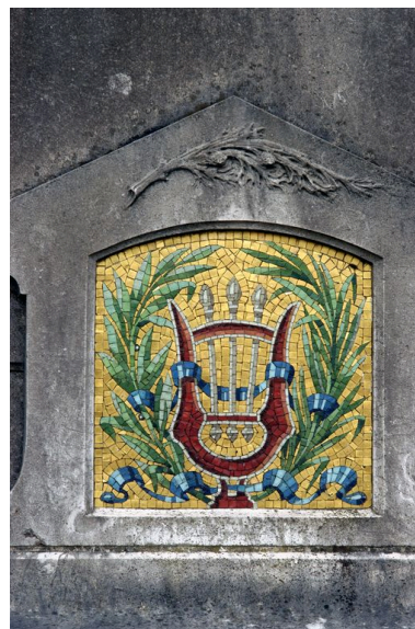
Vue de détail sur le décor en mosaïque.