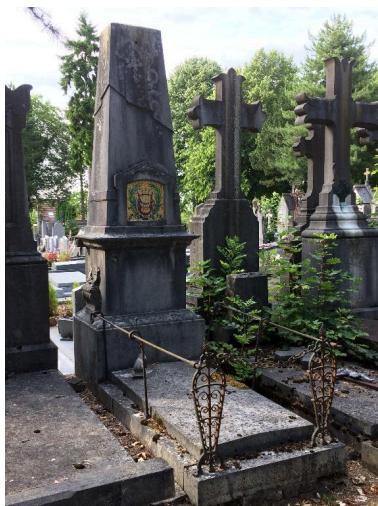
Vue générale. IVR32_20178005152NUCA

IVR22_20068013173NUCA