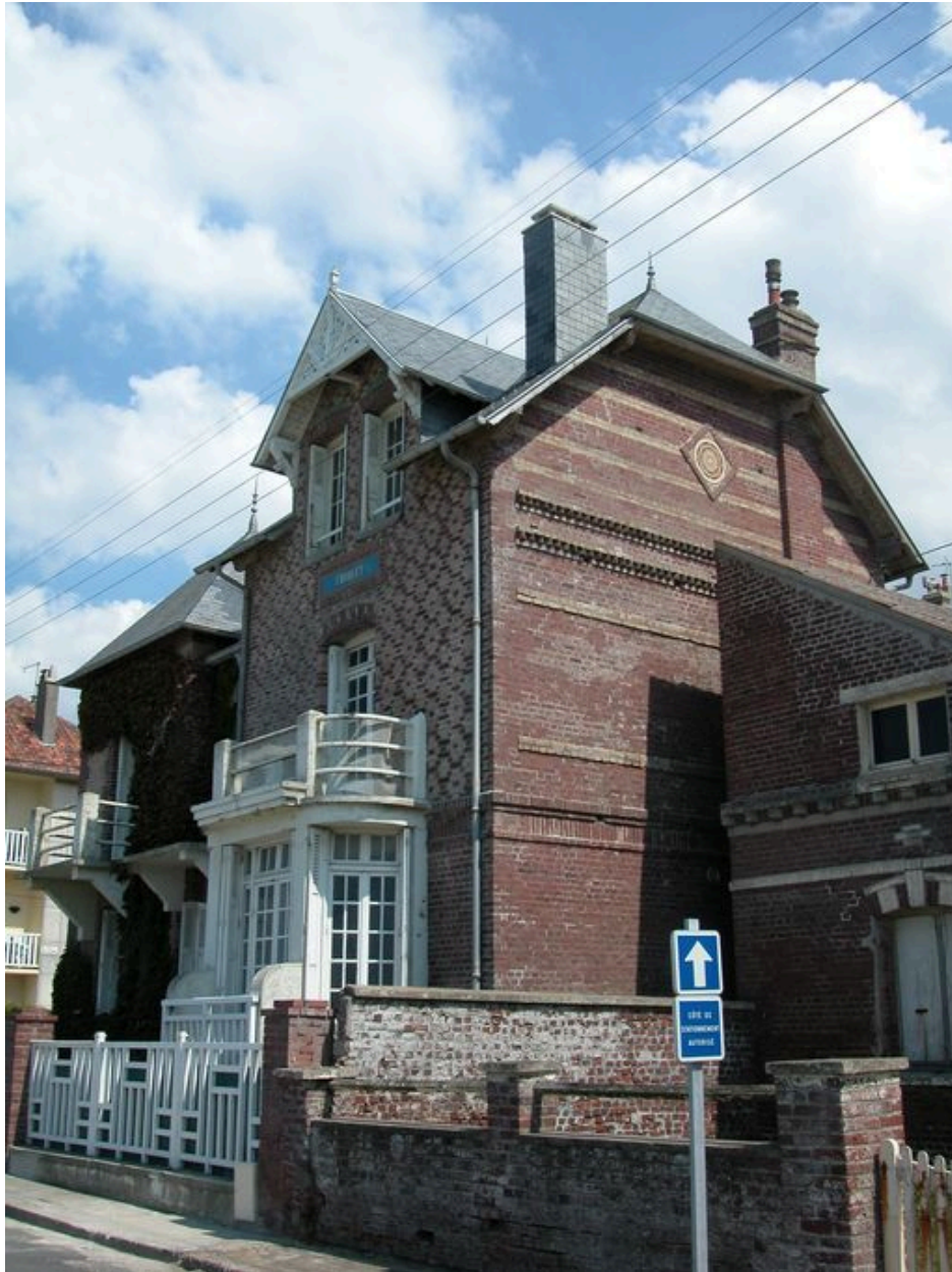
Elévation latérale droite.