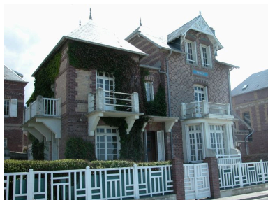
Vue d'ensemble. IVR22_20048001691NUCA