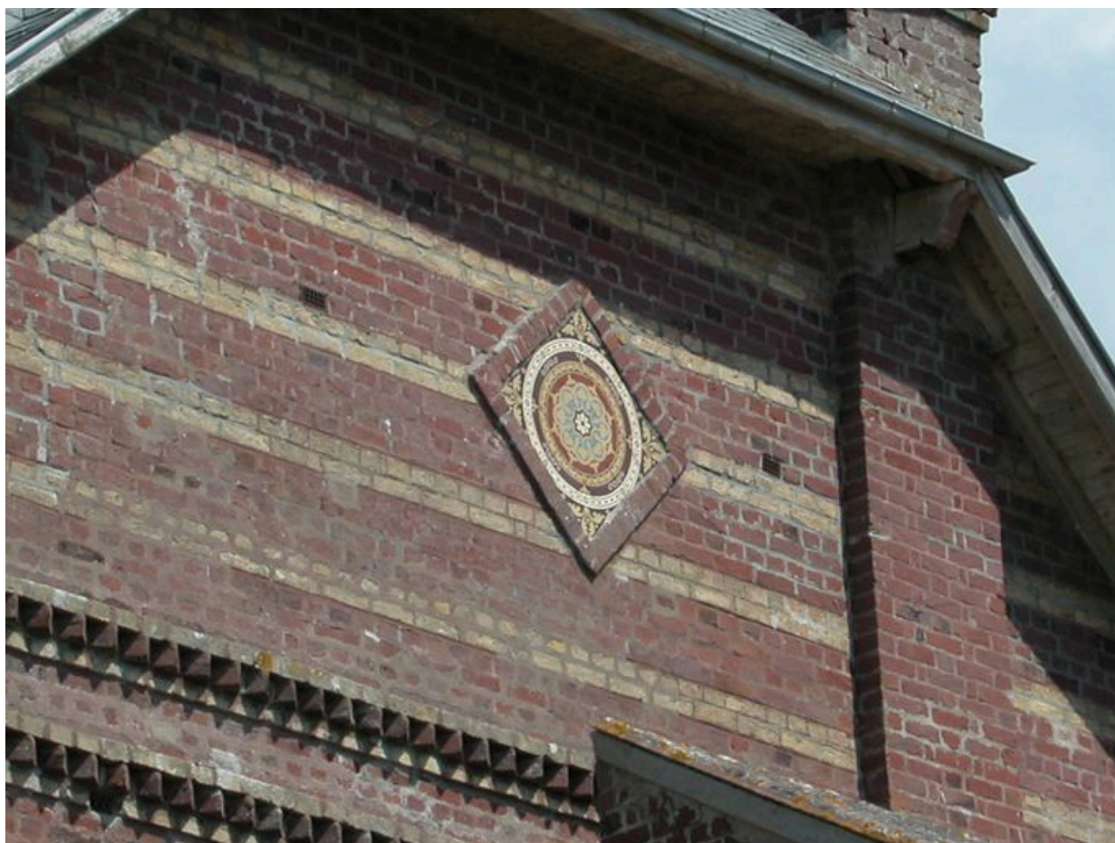
Détail du décor de céramique sur l'élévation latérale droite.