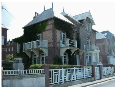
Vue de trois-quarts. IVR22_20048001692NUCA