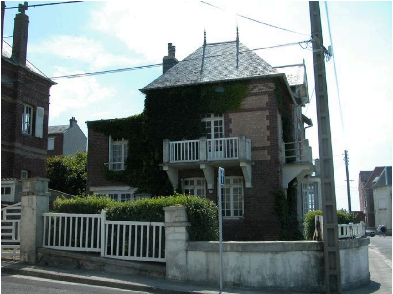
Elévation latérale gauche.