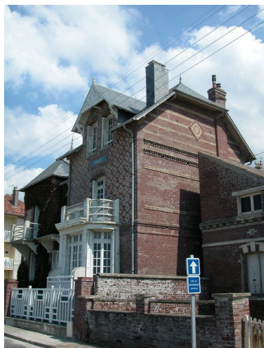
Élévation latérale droite.