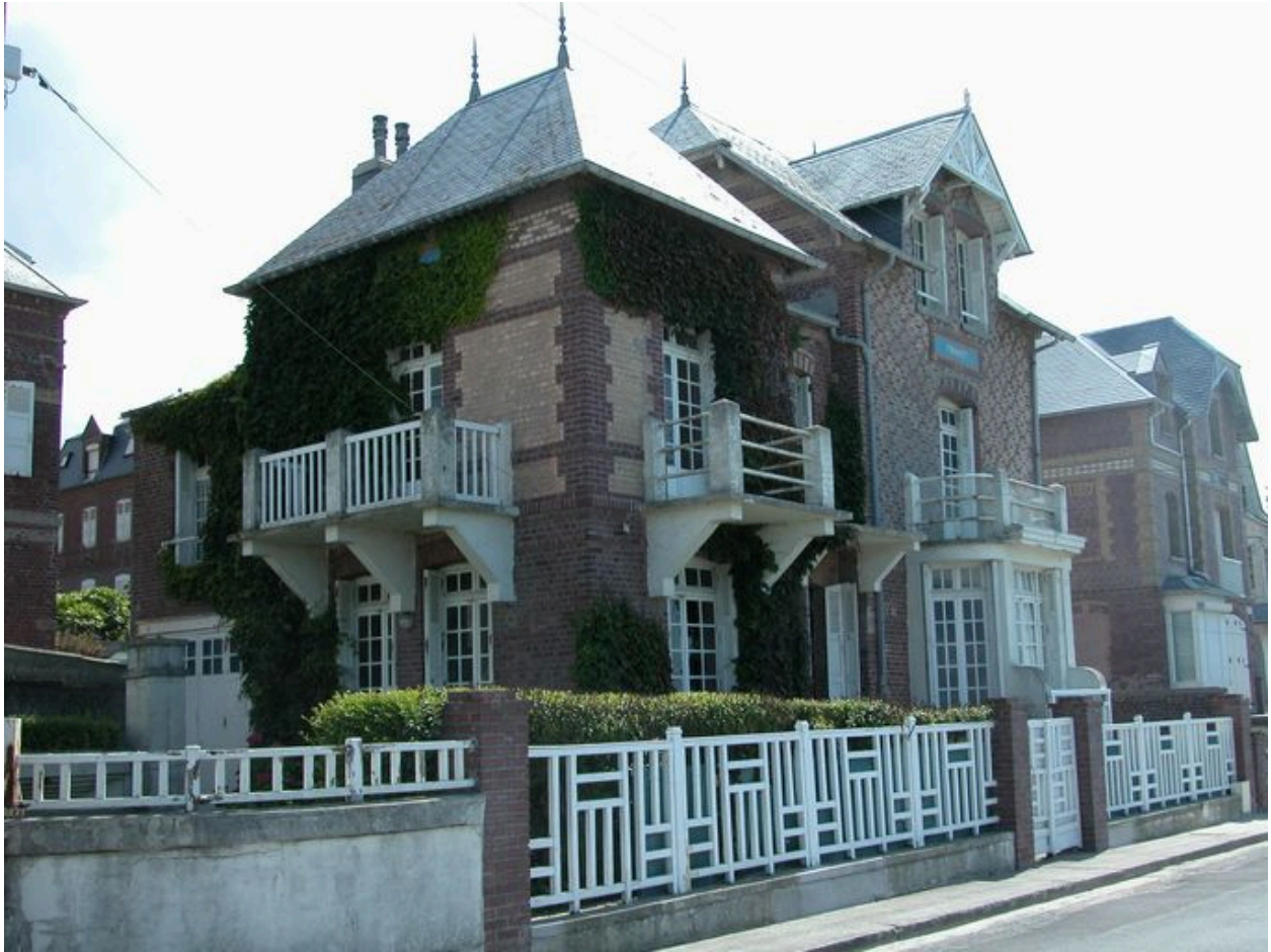
Vue de trois-quarts.