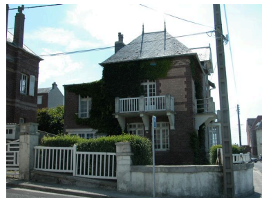
Élévation latérale gauche. IVR22_20048001693NUCA