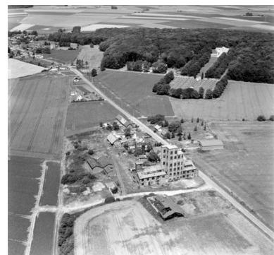
Vue aérienne, flanc sud-ouest. IVR22_19888001261P