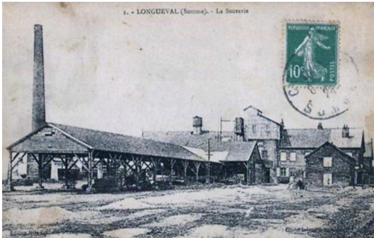
La sucrerie de Longueval, carte postale avant 1914.