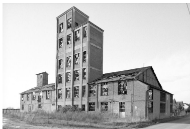
Vue d'ensemble de la râperie depuis le sud.