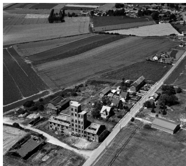
Vue aérienne, flanc sud-est.