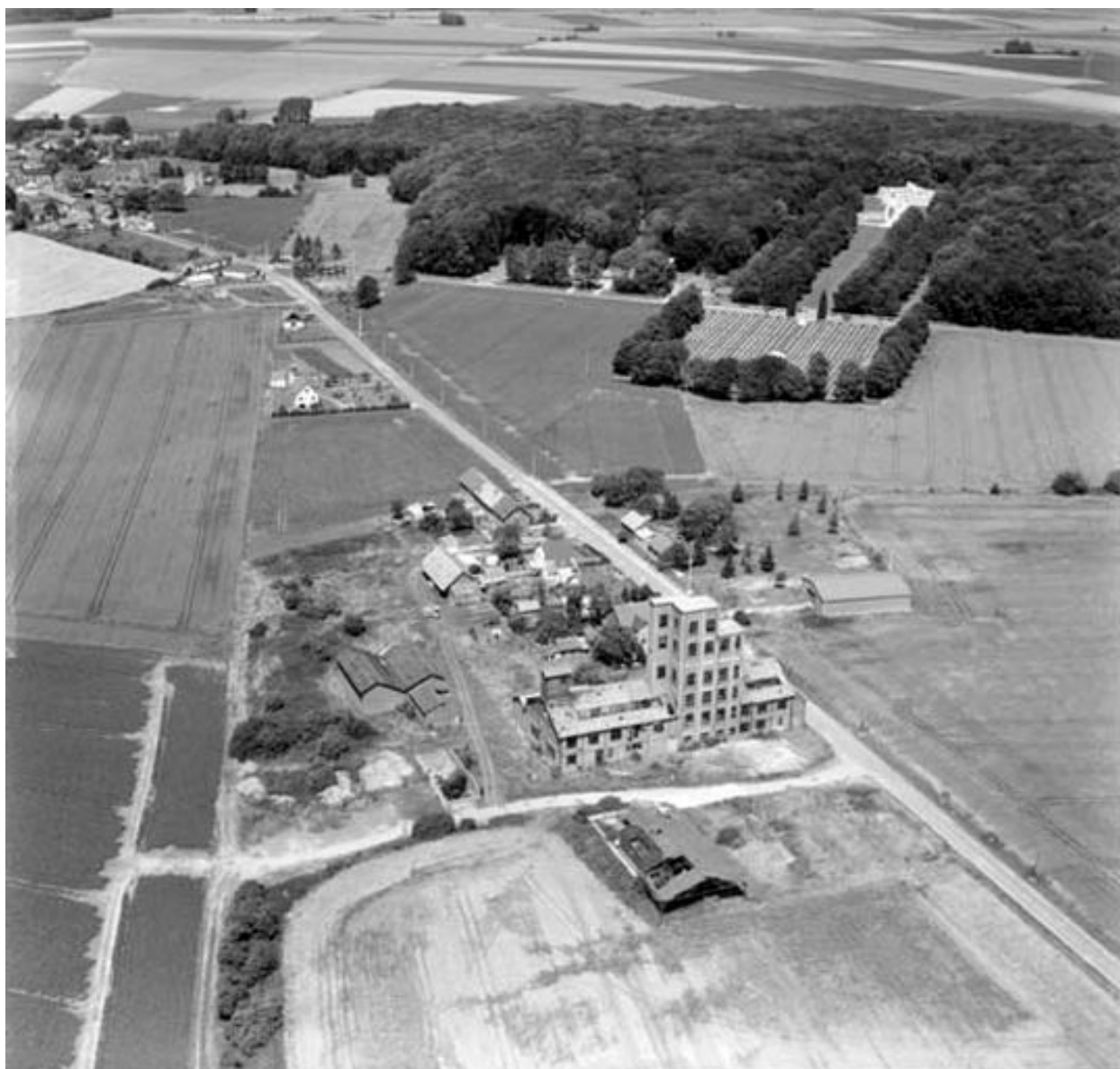
Vue aérienne, flanc sud-ouest.