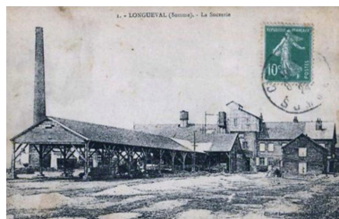
La sucrerie de Longueval, carte postale avant 1914 (coll. part.). IVR22_20158005298NUCA