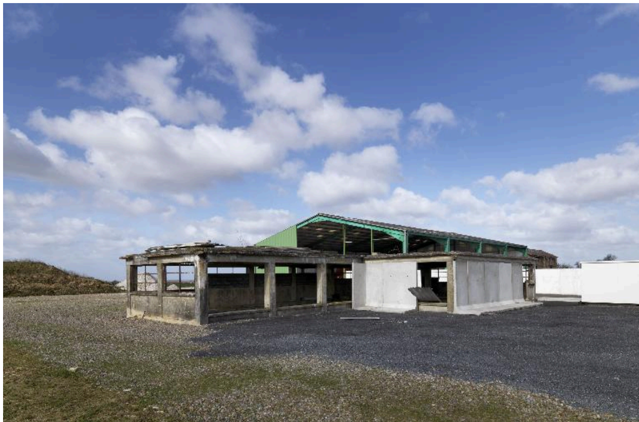
Vestige de l'ancienne sucrerie.