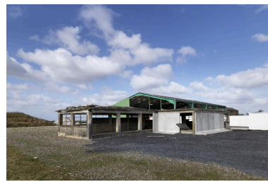
Vestige de l'ancienne sucrerie. IVR22_20158000207NUC2A