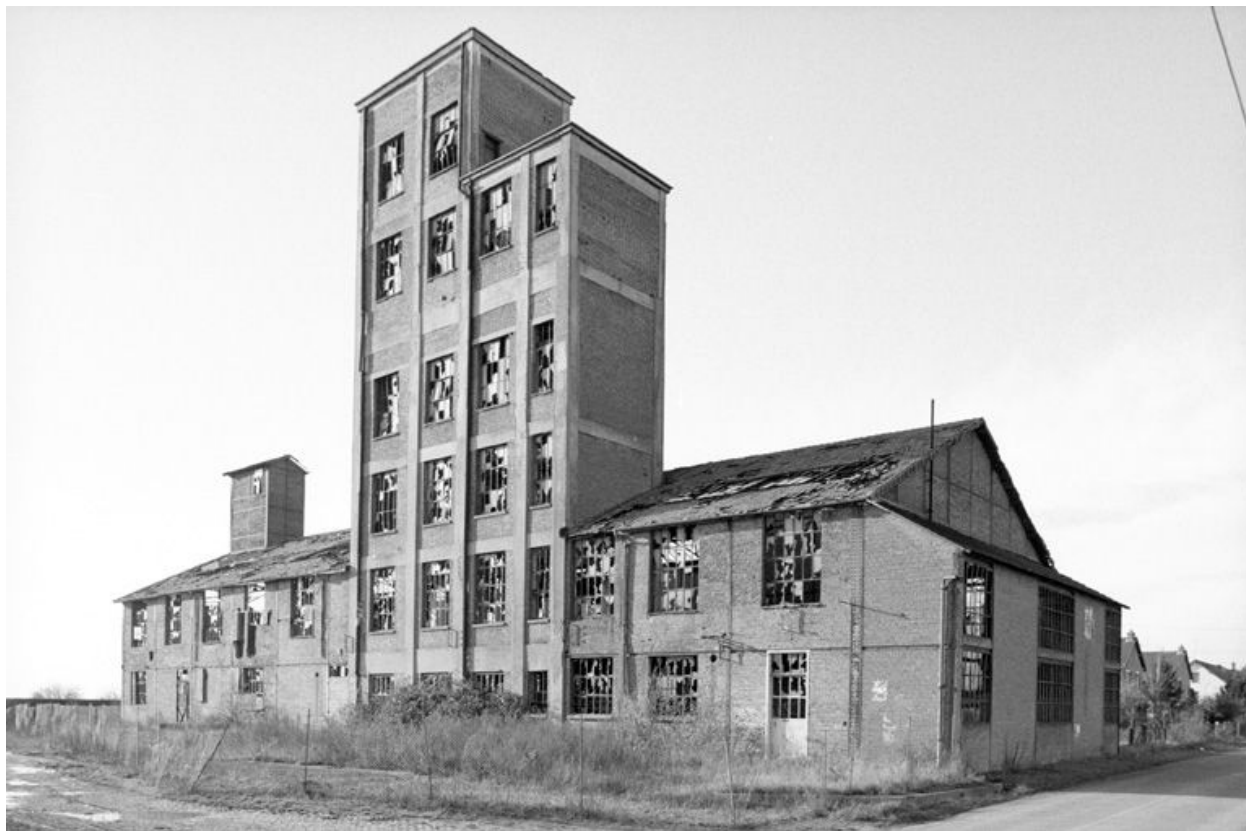
Vue d'ensemble de la râperie depuis le sud.