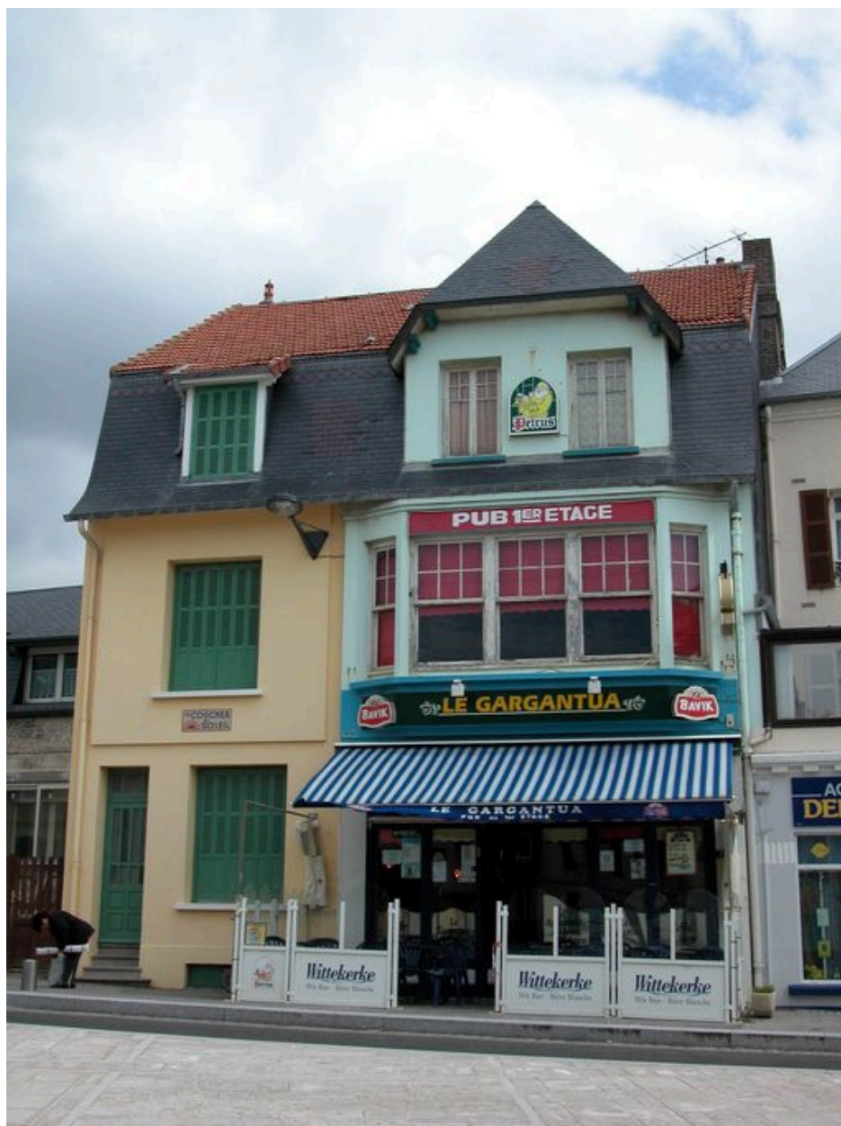
Vue d'ensemble depuis la place Courbet.