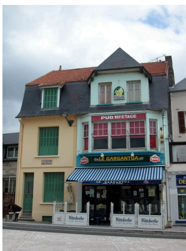
Vue d'ensemble depuis la place Courbet.