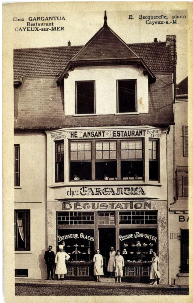
Carte postale, 2e quart 20e siècle (coll. part.).