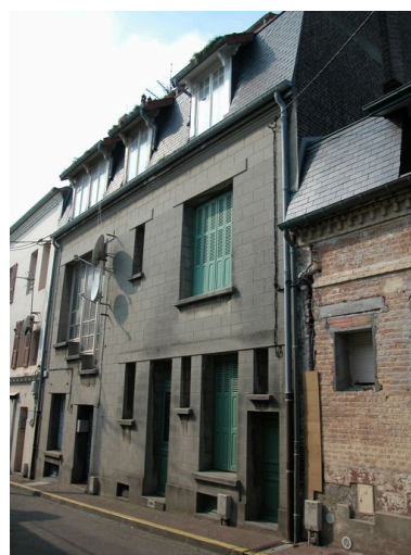
Élévation postérieure. IVR22_20058003635NUCA