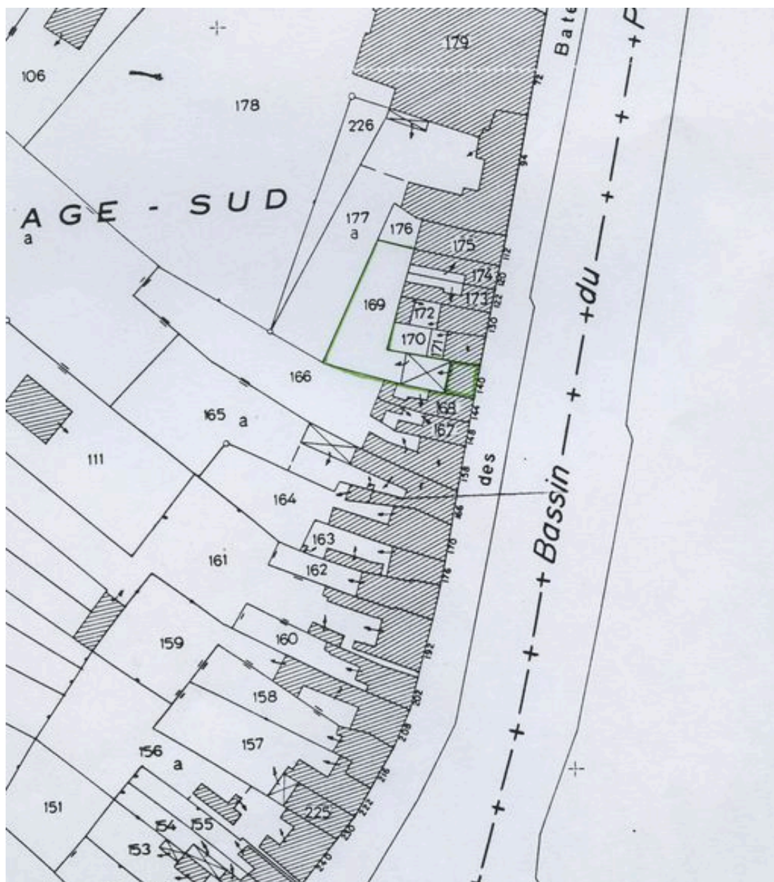
Plan de situation. Extrait du plan cadastral de 1982, section AB 169.