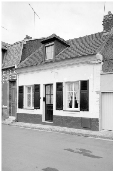
Elévation antérieure. IVR22_19856000962X