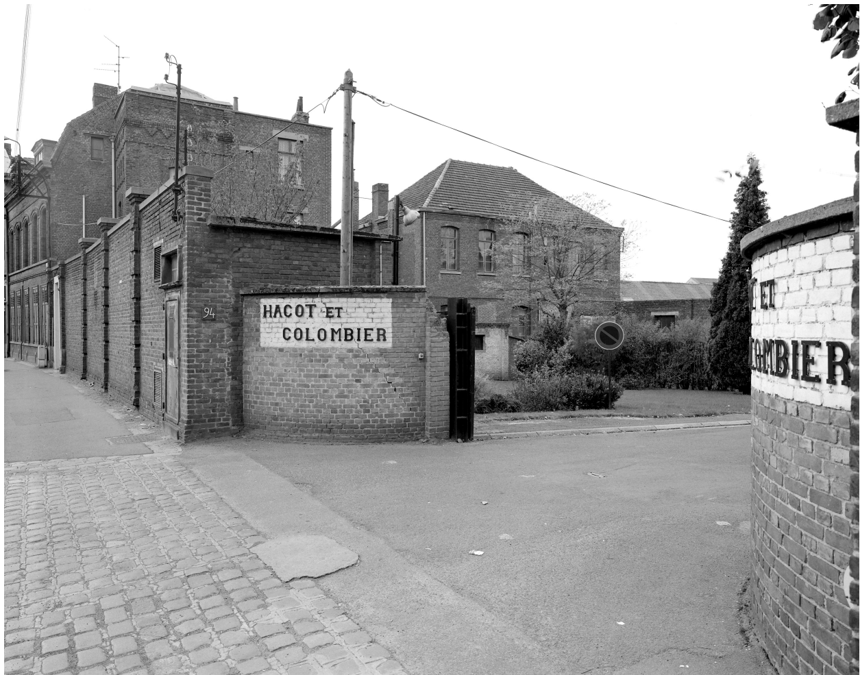
Vue générale depuis la rue, vers l'ouest. Entrée de la filature Hacot et Colombier.