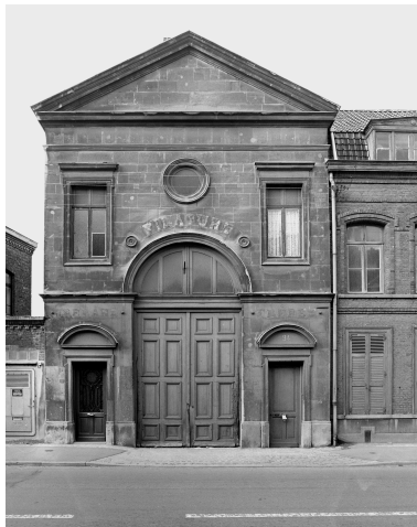
Bureaux, élévation. IVR31_19905900974X

IVR32_20235905029NUCA