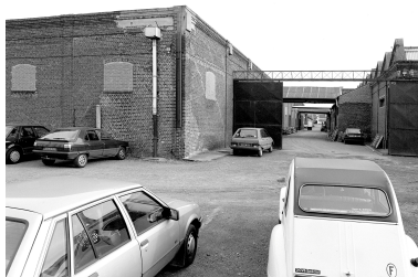
Atelier de fabrication, vue générale vers le sud.