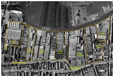
Le tissage Jeanson dans son environnement industriel en 1951 (Source IGN. Photothèque nationale. 02/06/1951).

Repro. Jean-Marc Ramette IVR32_20235905029NUCA