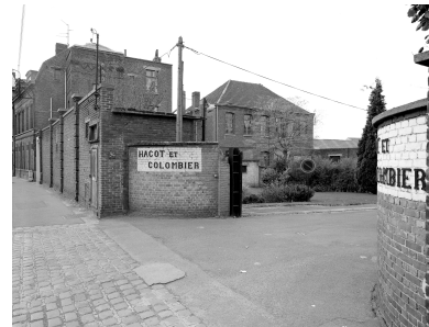
Vue générale depuis la rue, vers l'ouest. Entrée de la filature Hacot et Colombier.