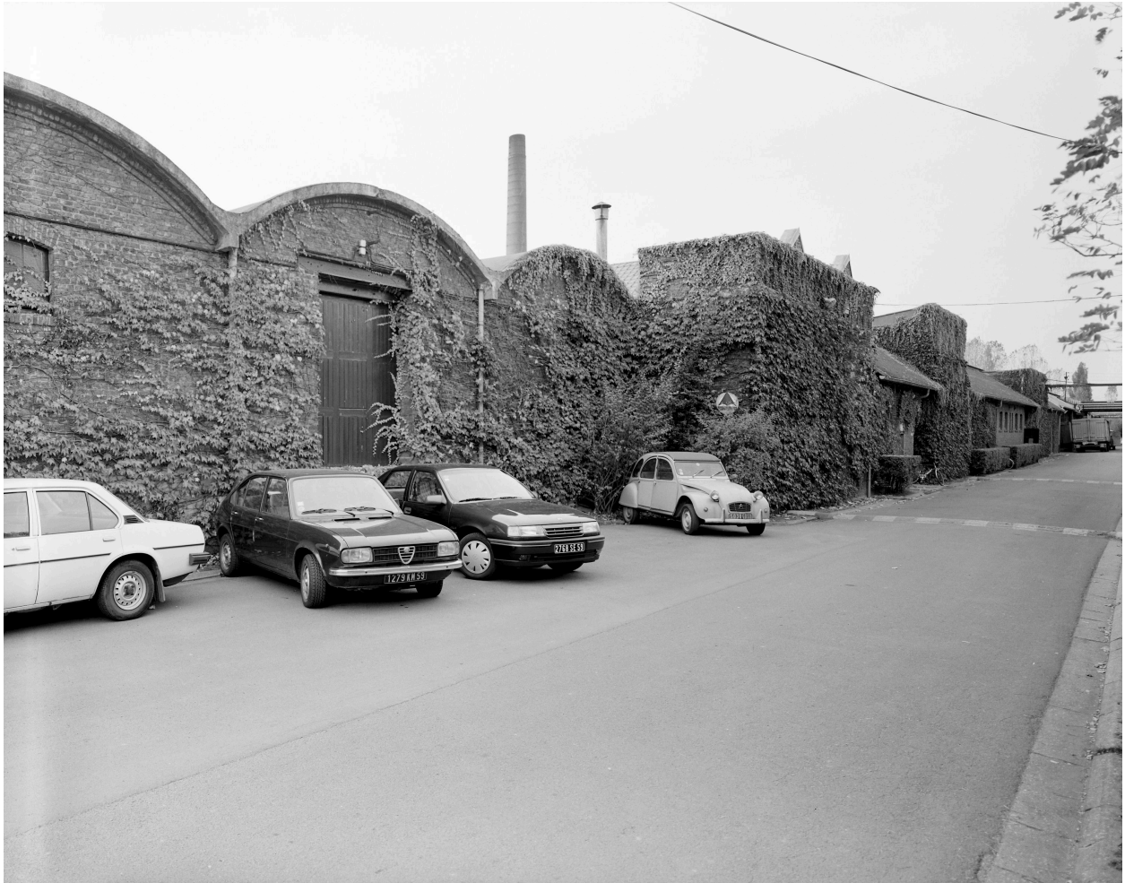
Atelier de fabrication, vue générale vers le nord.