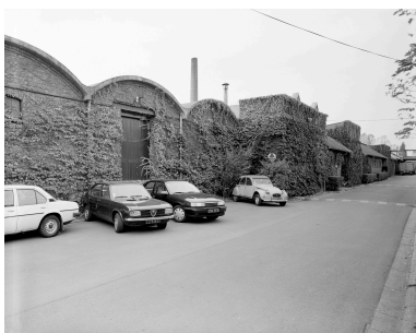
Atelier de fabrication, vue générale vers le nord.