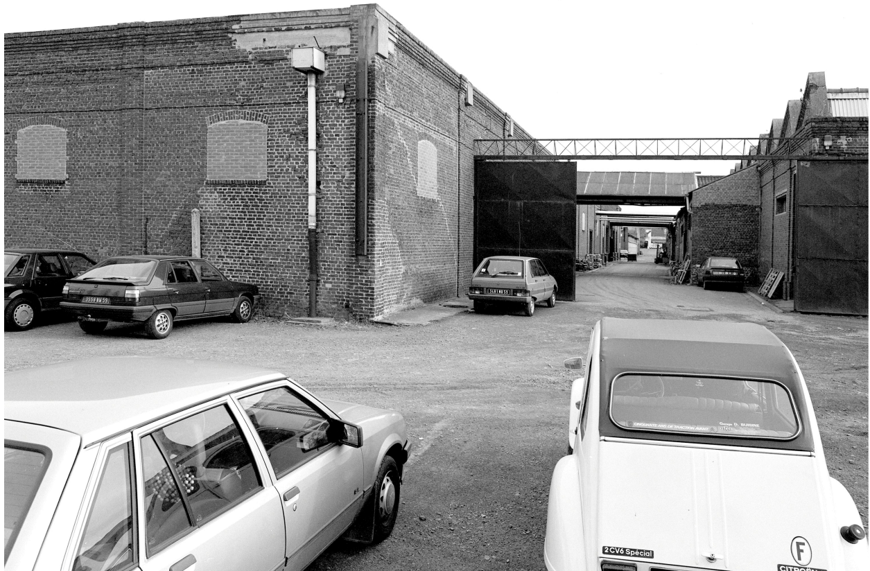
Atelier de fabrication, vue générale vers le sud.