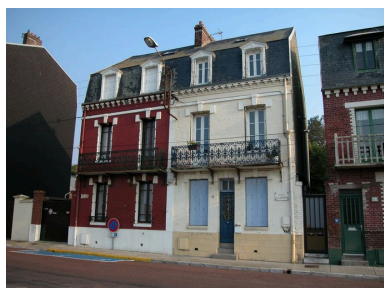
Vue d'ensemble. IVR22_20058003185NUCA