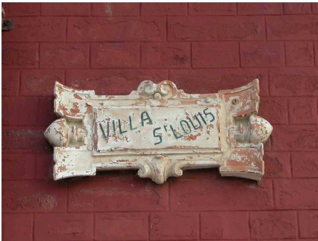
Détail du cartouche portant appellation Villa Saint-Louis.