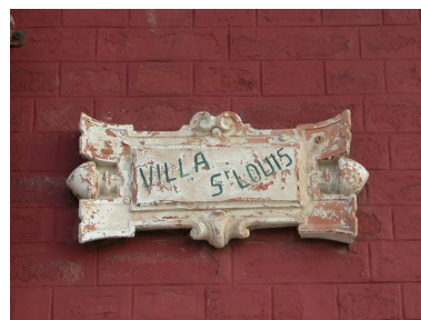
Détail du cartouche portant appellation Villa Saint-Louis. IVR22_20058003187NUCA