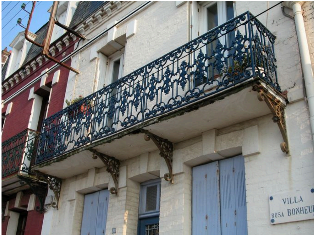
Détail d'un balcon en fonderie.