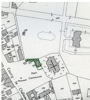
Plan de situation. Extrait du plan cadastral de 1962, section C2 470-471.