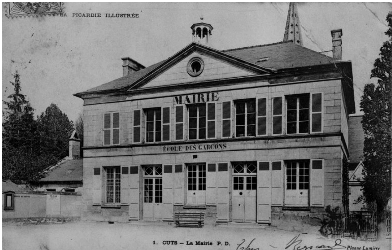
La mairie avant 1914 (AP).