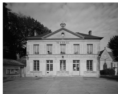
Elévation antérieure. IVR22_19846001310V