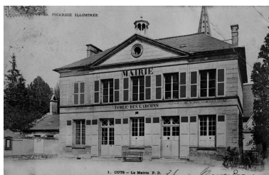
La mairie avant 1914 (AP).