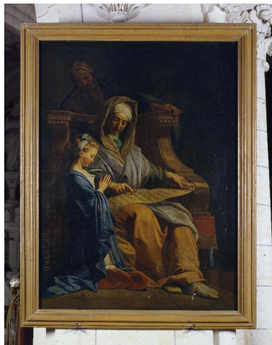
Vue générale du tableau.