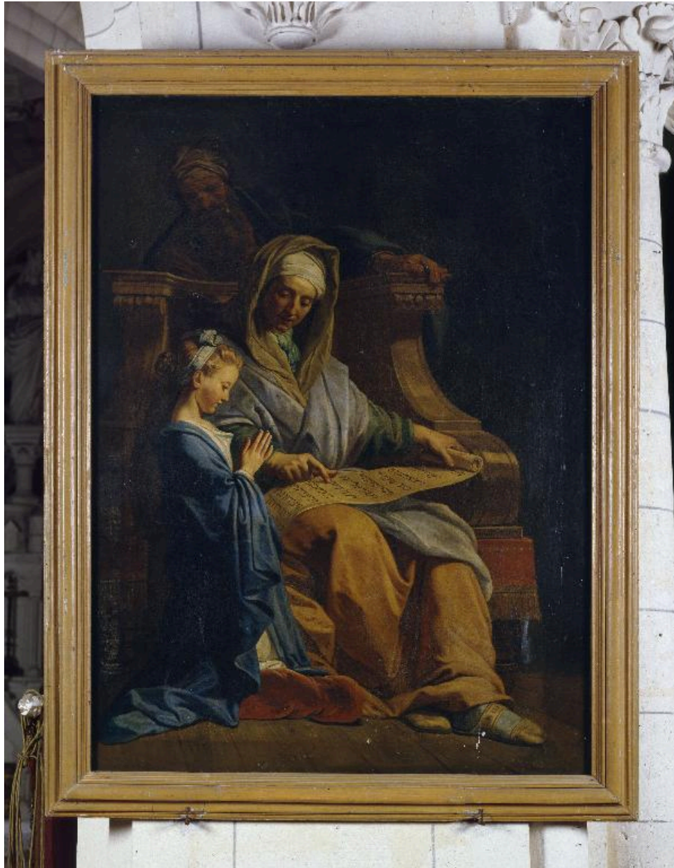
Vue générale du tableau.