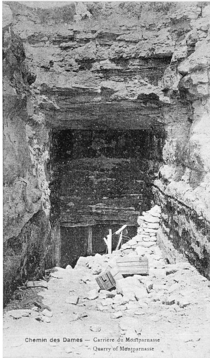
Vue ancienne de l'entrée de la carrière (coll. part).