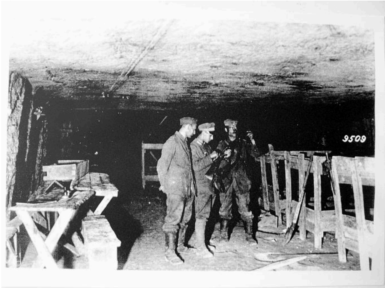
Vue intérieure de la carrière.