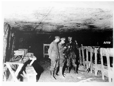
Vue intérieure de la carrière (coll. part).