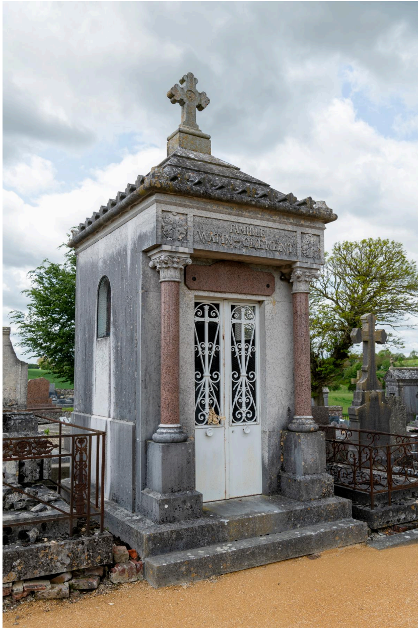
Tombeau en forme de chapelle de la famille Watin-Clément, signé Portemer.