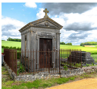
Tombeau en forme de chapelle de la famille Mesnard-Roisin, signé Bertin.