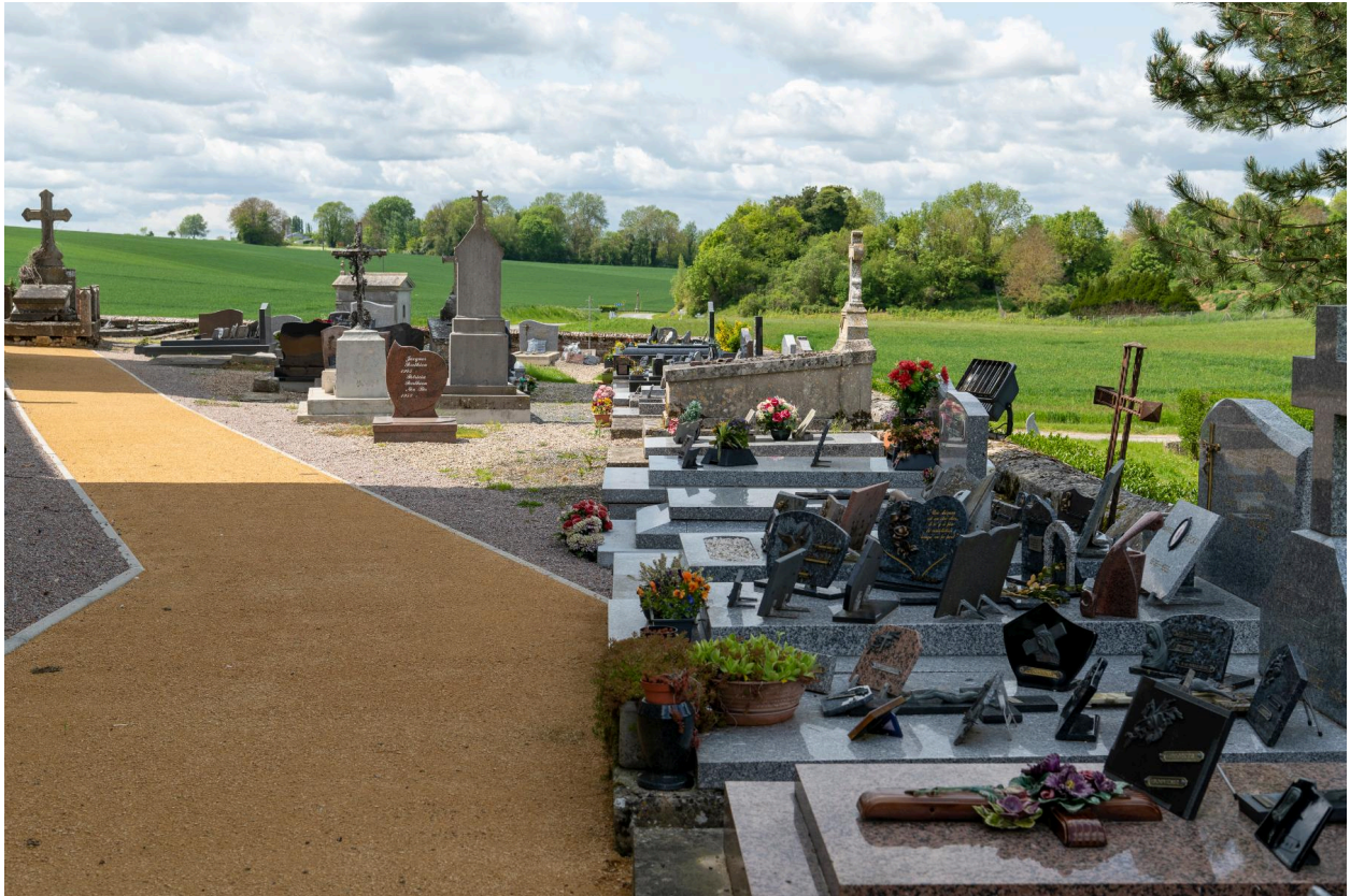
Vue générale de la partie nord du cimetière prise depuis l'est.