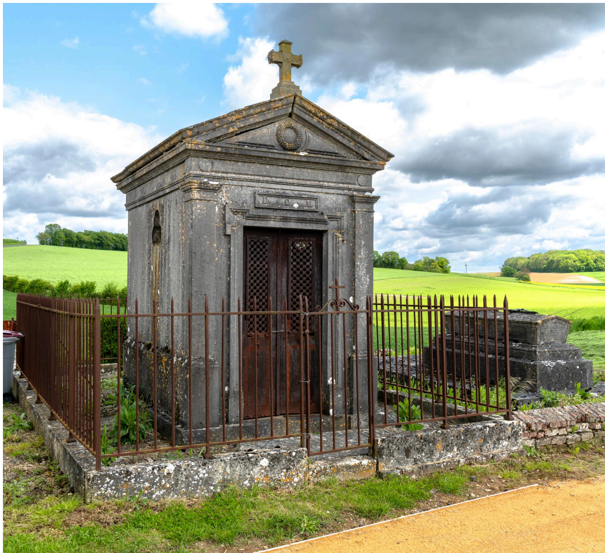
Tombeau en forme de chapelle de la famille Mesnard-Roisin, signé Bertin.