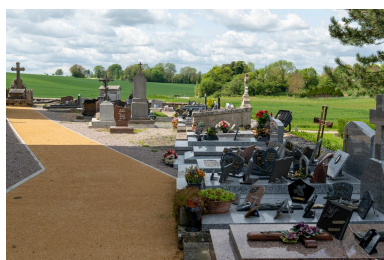
Vue générale de la partie nord du cimetière prise depuis l'est. IVR32_20236000677NUCA