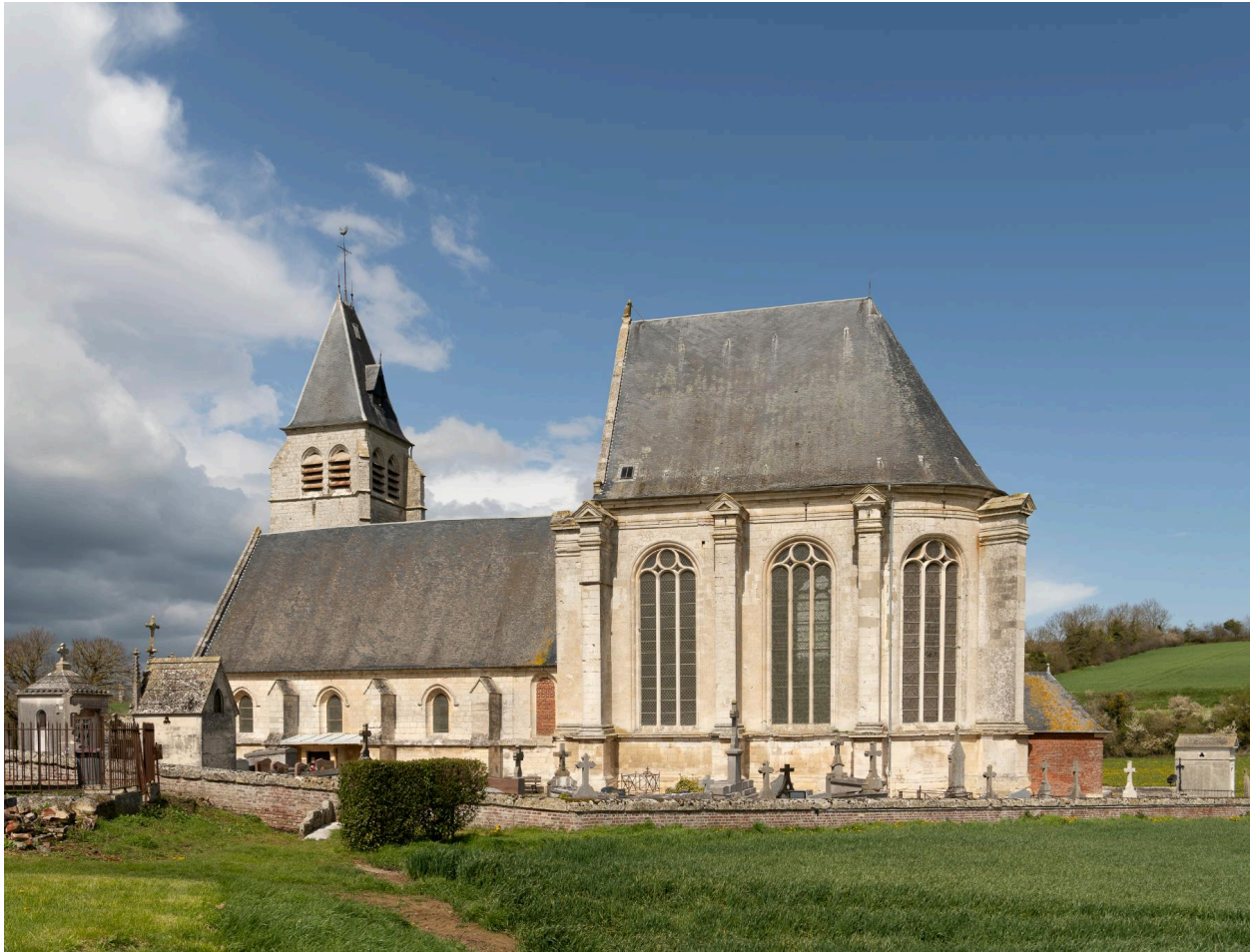
Vue générale, prise depuis le sud, de l'église entourée du cimetière.