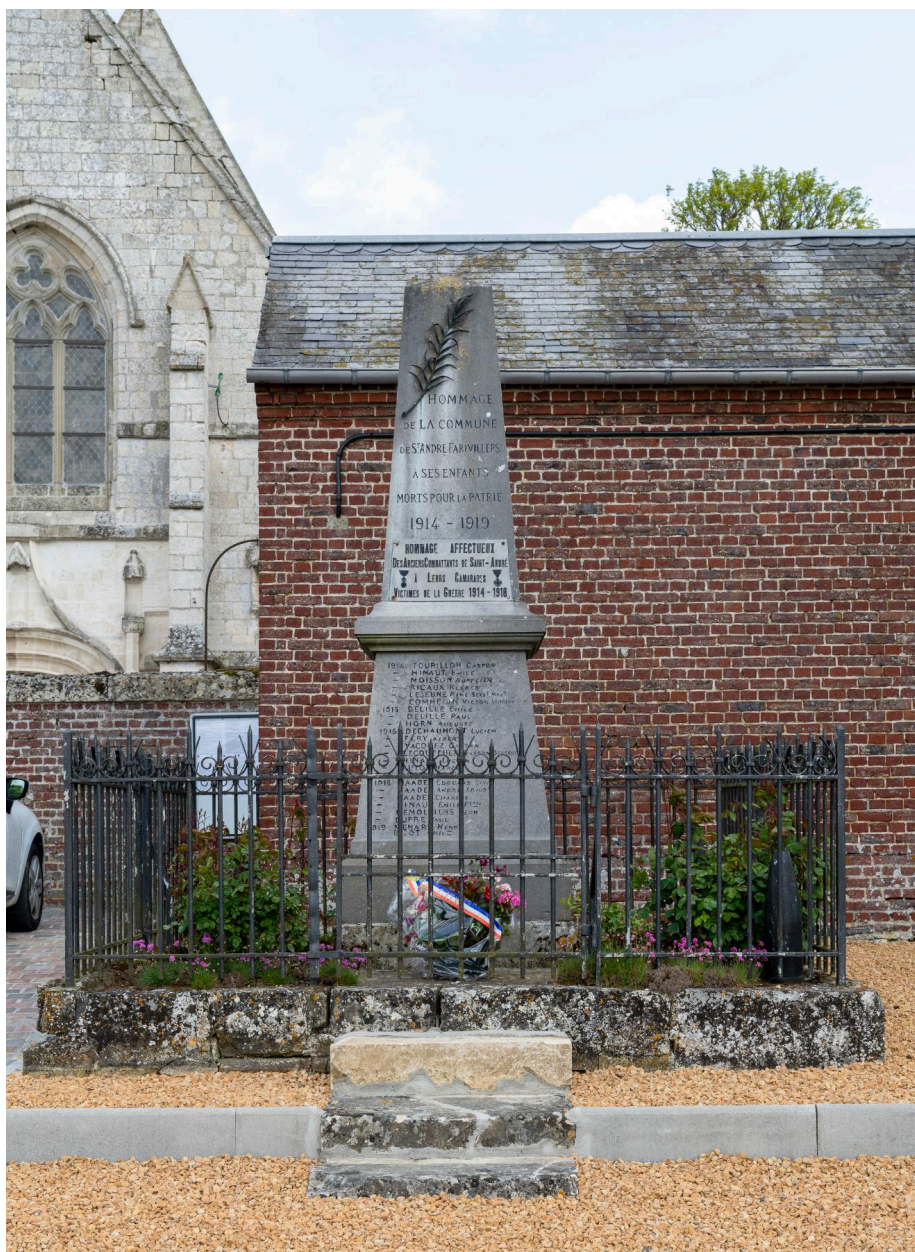
Monument aux morts de Saint-André-Farivillers, signé Boussard, entrée du cimetière, vue prise depuis l'ouest.