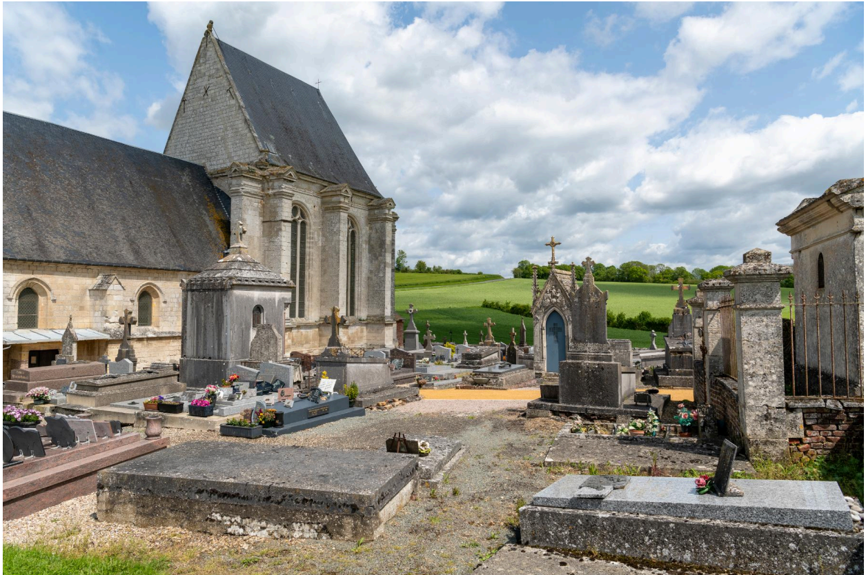
Vue générale du cimetière prise depuis l'angle sud-ouest.