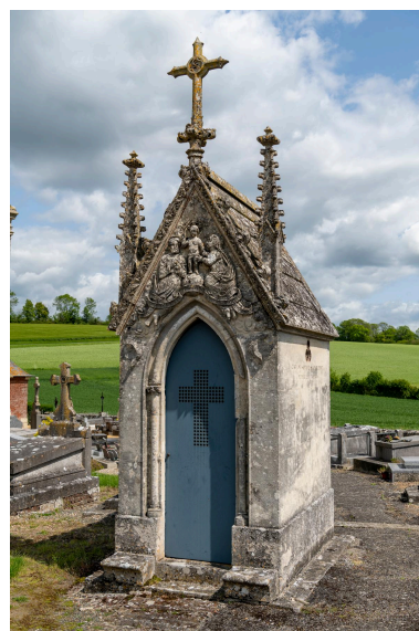
Tombeau en forme de chapelle de la famille Morel- Bellemère, date portée "1861". IVR32_20236000676NUCA