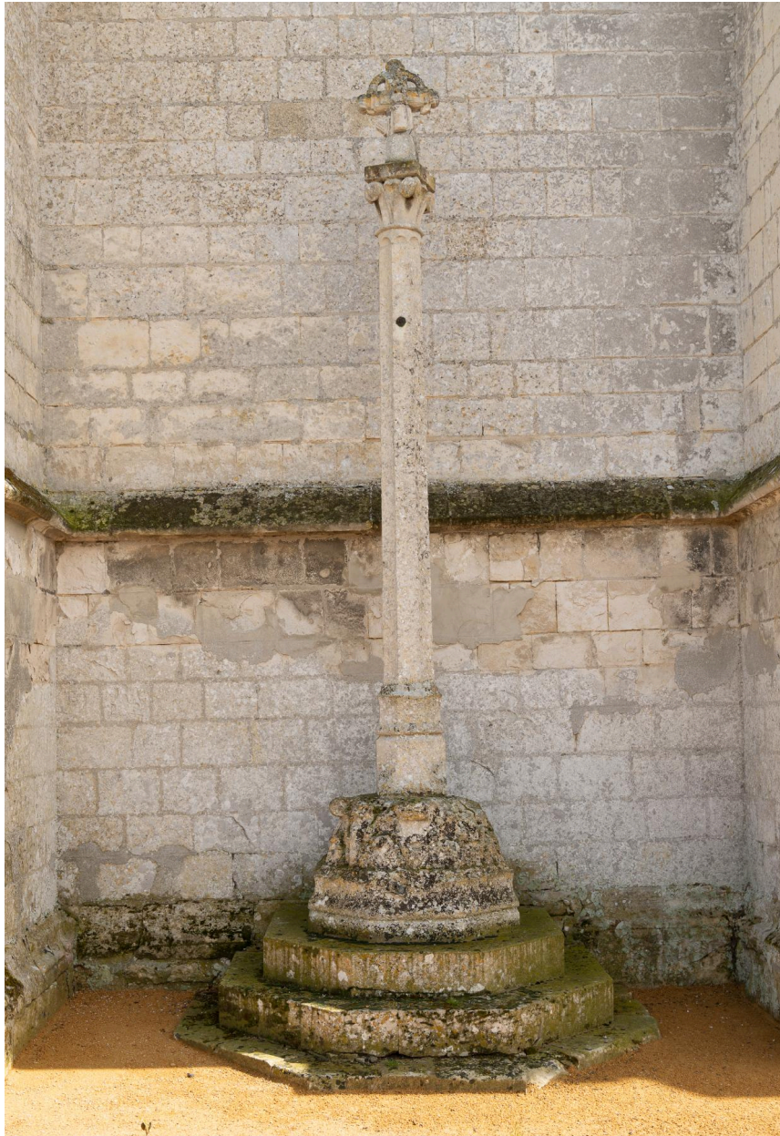
Ancienne croix du cimetière (?), façade occidentale, vue prise depuis l'ouest.