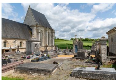
Vue générale du cimetière prise depuis l'angle sud-ouest. IVR32_20236000675NUCA