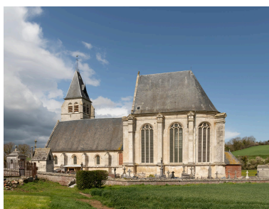
Vue générale, prise depuis le sud, de l'église entourée du cimetière. IVR32_20236000430NUCA