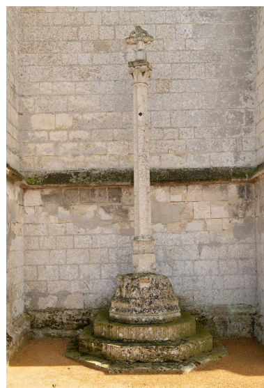
Ancienne croix du cimetière (?), façade occidentale, vue prise depuis l'ouest. IVR32_20236000426NUCA