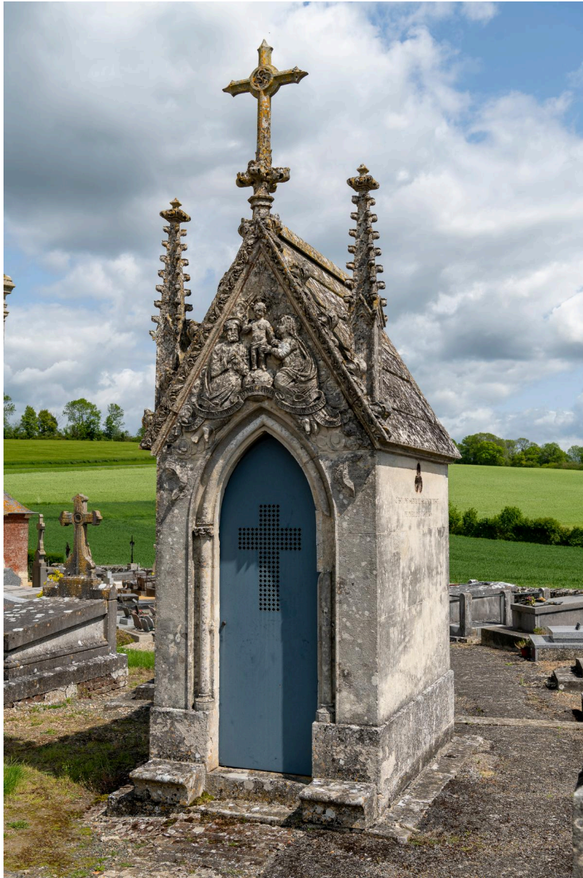
Tombeau en forme de chapelle de la famille Morel-Bellemère, date portée "1861".