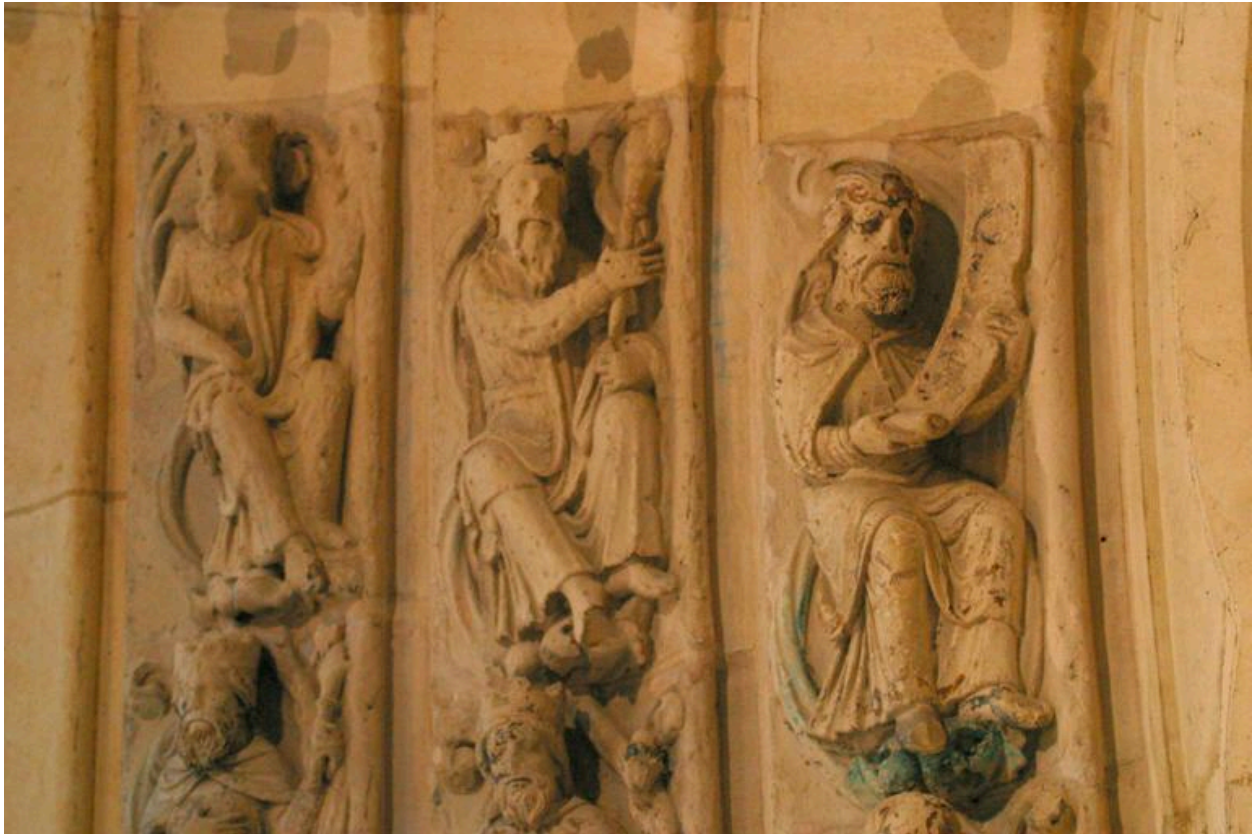
Détail de la voissure.