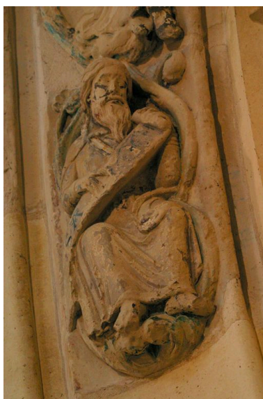
Détail de la voussure.