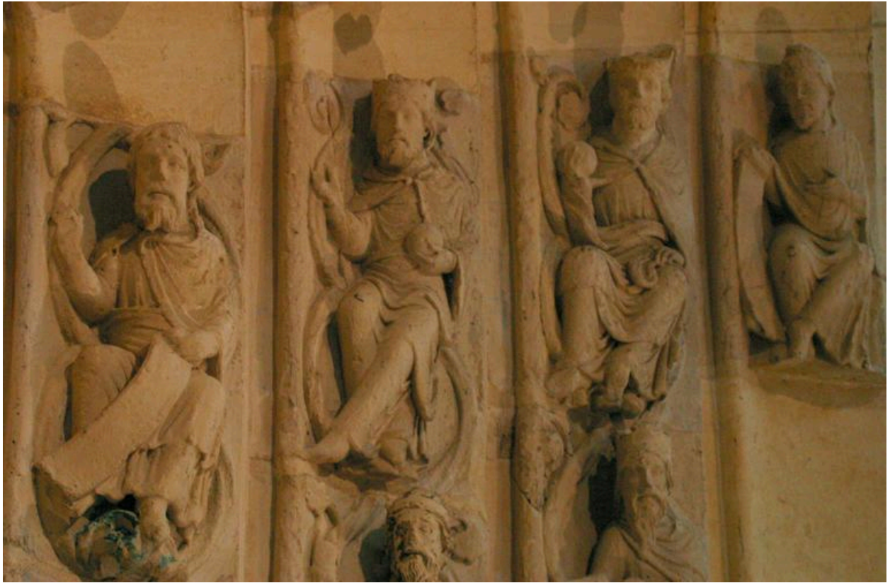
Détail de la voussure.