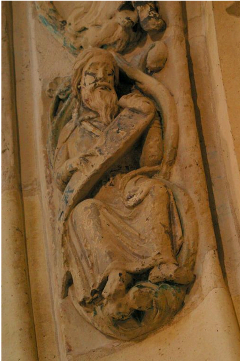
Détail de la voussure.