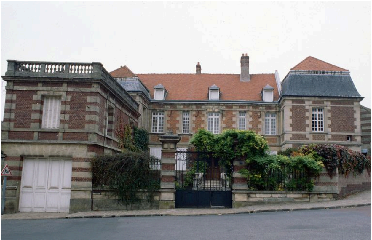
Vue depuis la rue.